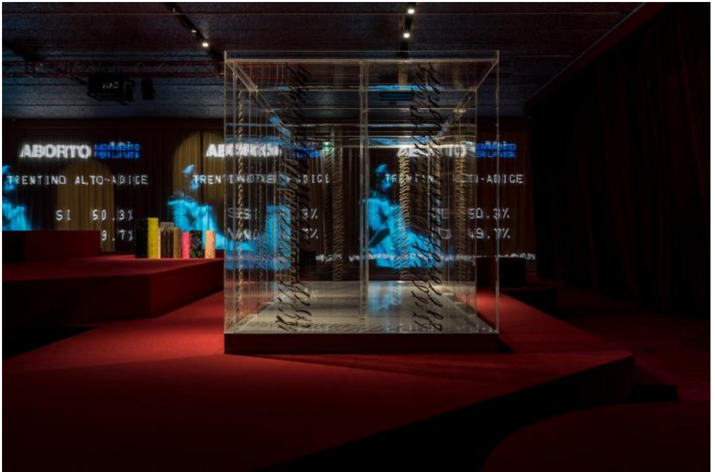
Immagine della mostra TV 70: Francesco Vezzoli guarda la Rai. Fondazione Prada, Milano. 9 maggio 2017 - 24 settembre 2017. Carla Accardi, Casa Labirinto, 1999 - 2000. Da un disegno del 1970, vernice su plexiglas e base di legno / View of the exhibition TV 70: Francesco Vezzoli guarda la Rai. Fondazione Prada, Milan. 9 May 2017 - 24 September 2017. Carla Accardi, Casa Labirinto, 1999 - 2000. After a 1970 drawing, varnish on plexiglas and

A far da controcanto a questo fermento civile e sociale tutto femminile, in campo artistico, l'unica donna capace di imporsi è Carla Accardi, i cui lavori volumetrici sono numerosi, celebri Rotoli colorati (giallo, nero, rosa, rosa-fluoro e verdenero... ), tre Grandi Trasparenti (1975-76), due strutture abitabili sono la Tenda (1965-66) e la Casa Labirinto (su un disegno del '70) che rimandano all'idea di permeabilità degli spazi, di relazione insolubile tra esteriorità e interiorità, tra la vita nel mondo, là fuori e una vita interiore tutta da coltivare, abitano armonicamente la grande sala, che assume le connotazioni di una scena teatrale.