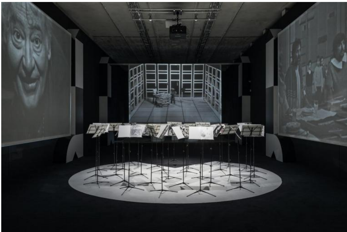
Immagine della mostra “TV 70: Francesco Vezzoli guarda la Rai”. Fondazione Prada, Milano. 9 maggio 2017 - 24 settembre 2017. Giulio Paolini, Apoteosi di Omero, 1970–71, 32 fotografie, documento scritto a macchina, 33 legggi