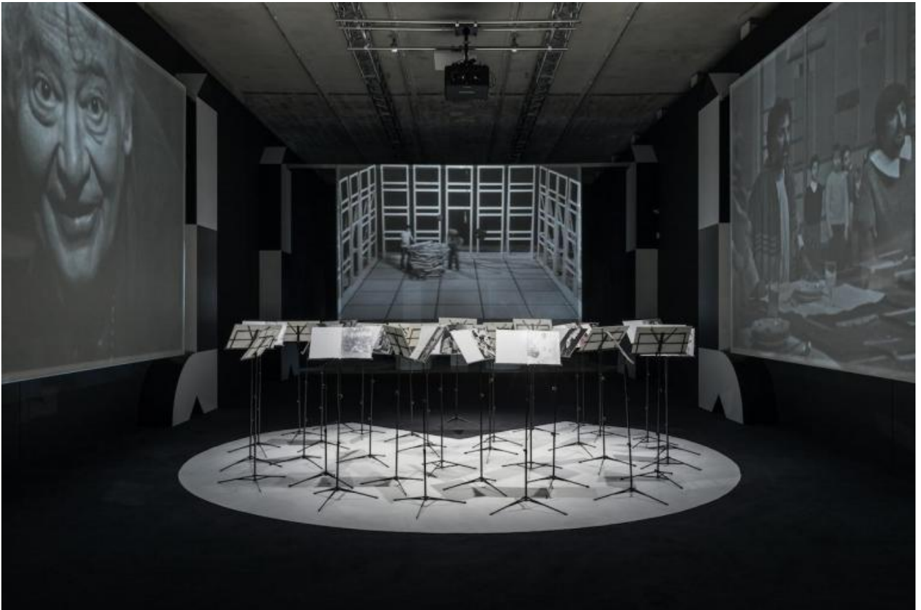
Immagine della mostra "TV 70: Francesco Vezzoli guarda la Rai". Fondazione Prada, Milano. 9 maggio 2017 - 24 settembre 2017. Giulio Paolini, Apoteosi di Omero, 1970-71, 32 fotografie, documento scritto a macchina, 33 leggii