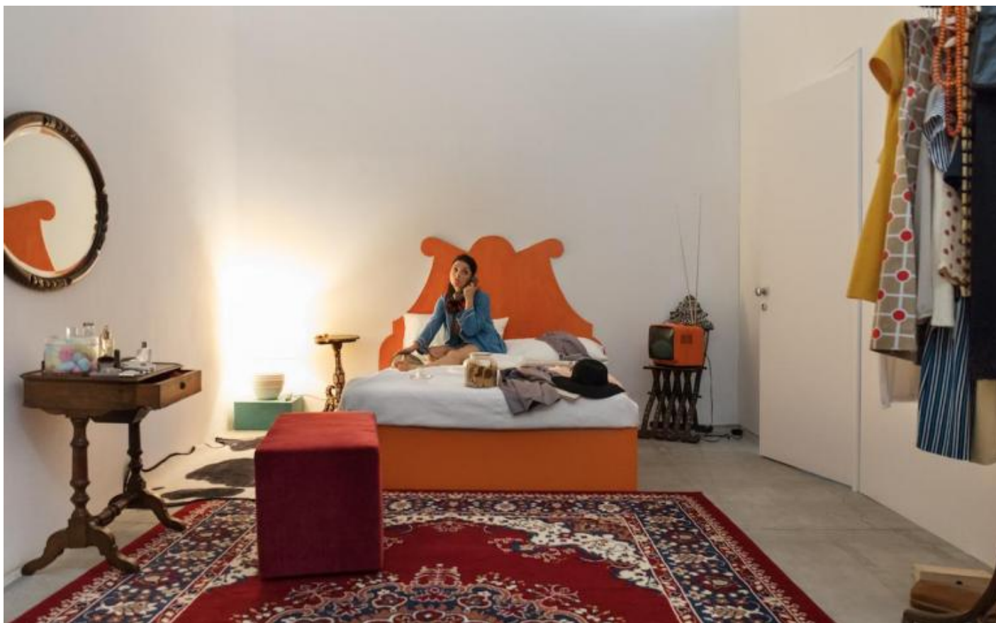
Immagine della mostra “TV 70: Francesco Vezzoli guarda la Rai”. Fondazione Prada, Milano. 9 maggio 2017 - 24 settembre 2017. Giosetta Fioroni, La spia ottica – Ovvero la mia camera da letto, 1968 (2017) / View of the exhibition “TV 70: Francesco Vezzoli guarda la Rai”. Fondazione Prada, Milan. 9 May 2017 - 24 September 2017. Giosetta Fioroni, La spia ottica – Ovvero la mia camera da letto, 1968 (2017)

Secondo Vezzoli, questo contesto è profondamente rituale : «la televisione degli anni Settanta produceva riti e, di conseguenza, miti assoluti e duraturi che ancora oggi, riproposti in questa mostra, possono ispirare scelte non convenzionali».