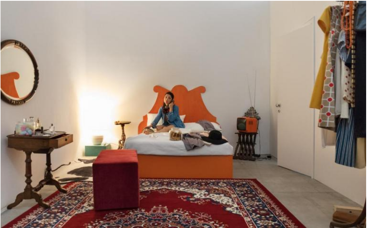
Immagine della mostra "TV 70: Francesco Vezzoli guarda la Rai". Fondazione Prada, Milano. 9 maggio 2017 - 24 settembre 2017. Courtesy Fondazione Prada. Giosetta Fioroni, La spia ottica ovvero la mia camera da letto, 1968 (2017) / View of the exhibition "TV 70: Francesco Vezzoli guarda la Rai". Fondazione Prada, Milan. 9 May 2017 - 24 September 2017. Courtesy Fondazione Prada. Giosetta Fioroni, La spia ottica ovvero la mia camera da letto, 1968 (2017)

Secondo Vezzoli, questo contesto "profondamente rituale": «la televisione degli anni Settanta produceva riti e, di conseguenza, miti assoluti e duraturi che ancora oggi, riproposti in questa mostra, possono ispirare scelte non convenzionali».