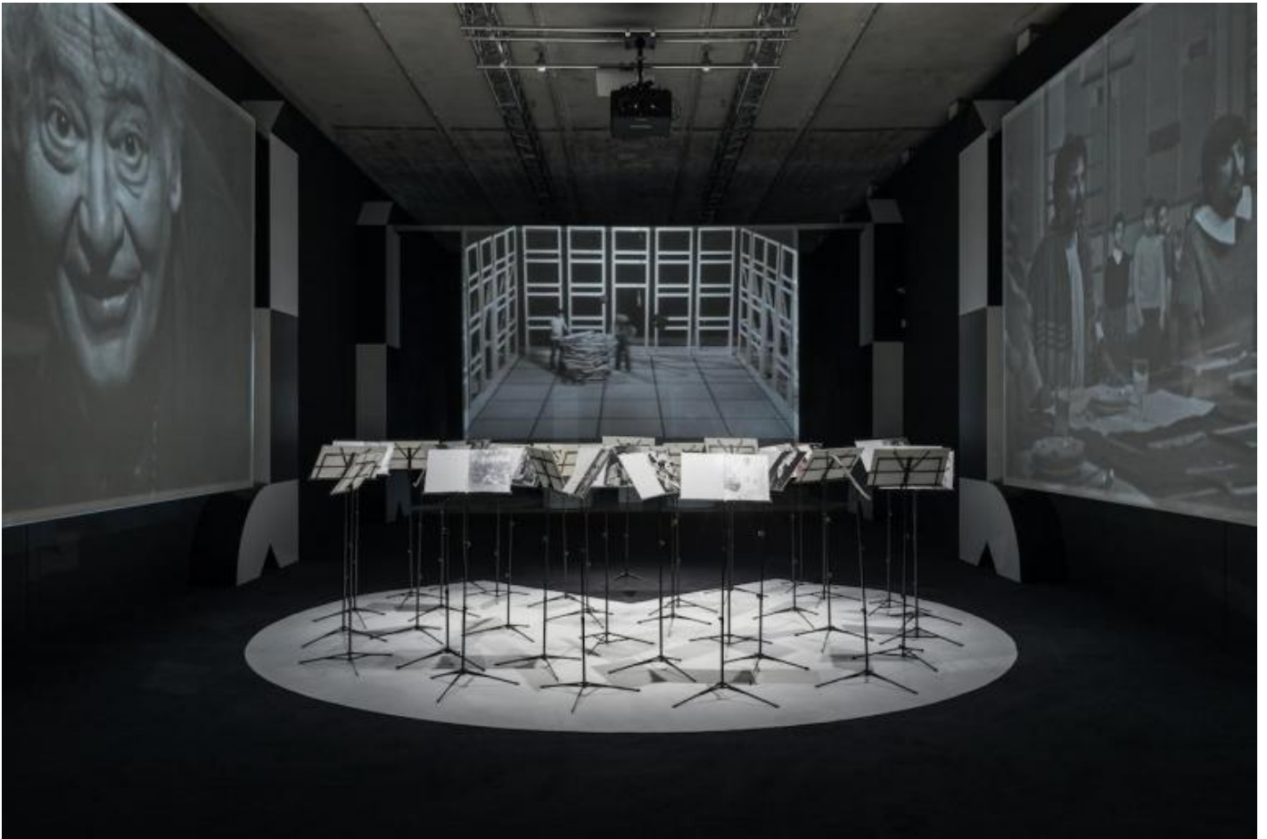
Immagine della mostra "TV 70: Francesco Vezzoli guarda la Rai". Fondazione Prada, Milano. 9 maggio 2017 - 24 settembre 2017. Giulio Paolini, Apoteosi di Omero, 1970-71, 32 fotografie, documento scritto a macchina, 33 leggi

Pi 1 in L 1 , si situa in un centro ideale, l'installazione Apoteosi di Omero (1970-71) di Giulio Paolini, artista e collaboratore Rai come scenografo, per diversi spettacoli teatrali e televisivi: 32 fotografie e documenti scritti a macchina sono disposti circolarmente su altrettanti leggi, avvolti dal sonoro di tre grandi schermi che proiettano adattamenti pensati e prodotti per un uso pi 1 creativo che informativo del mezzo televisivo, come Finestra in Racconti italiani del '900 di Massimo Bontempelli, l'ultima ripetizione di Nora Helmer in Casa di bambola di Ibsen e La fantastica storia di Don Chisciotte e del suo scudiero Sancio Panza, inventata da Cervantes, ricostruita e rappresentata in uno studio televisivo da una compagnia di attori e musicisti con Ronzinante e l'asino, animali veri (1970) di Lericci-Quartucci. Infine, uno spazio dedicato ai programmi sperimentali per i pi 1 piccoli e i ragazzi, con Fabio Mauri ed Eugenio Carmi.