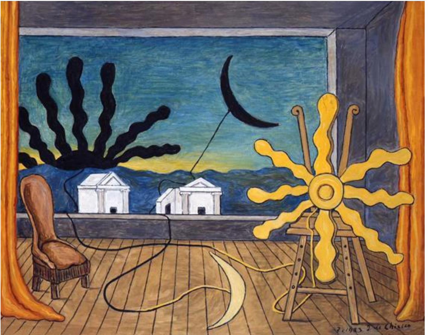
Giorgio De Chirico, Sole sul cavalletto , 1973.

D'un tratto, la luce si accende e tutto scompare. Resta solo il silenzio e qualche minuto a disposizione per osservare un esemplare pittorico esposto di fronte al video, come un dialogo diretto, senza soluzione di continuitÃ tra l'artista, la sua immagine in movimento e la sua opera materiale. Due, credo, sono i casi di maggior interesse per far proprio lo sguardo che la televisione volgeva all'arte.