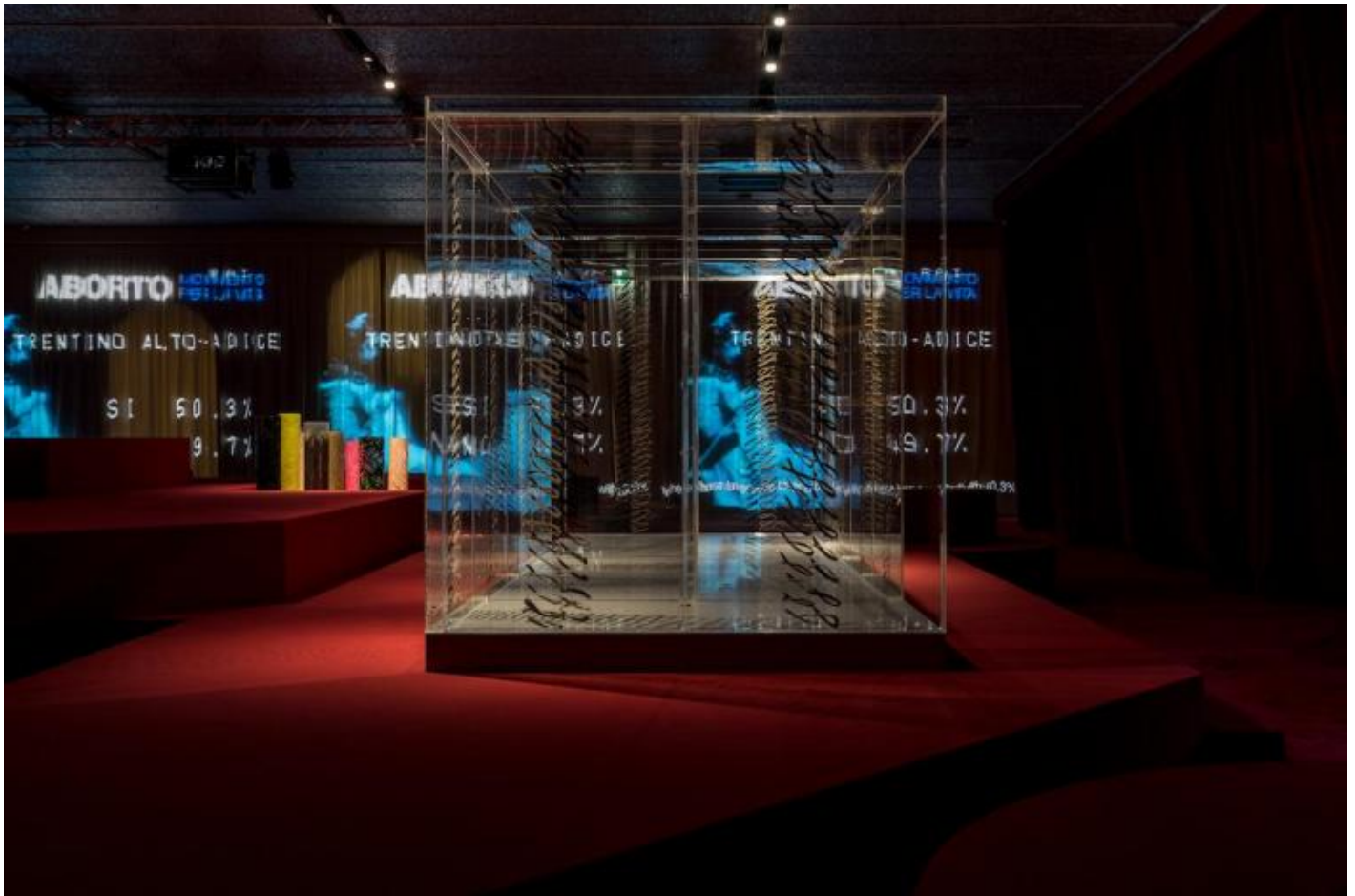
Immagine della mostra “TV 70: Francesco Vezzoli guarda la Rai”. Fondazione Prada, Milano. 9 maggio 2017 - 24 settembre 2017. Carla Accardi, Casa Labirinto, 1999 – 2000. Da un disegno del 1970, vernice su plexigas e base di legno / View of the exhibition “TV 70: Francesco Vezzoli guarda la Rai”. Fondazione Prada, Milan. 9 May 2017 - 24 September 2017. Carla Accardi, Casa Labirinto, 1999 – 2000. After a 1970 drawing, varnish on plexigas and wooden platform

A far da controcanto a questo fermento civile e sociale tutto femminile, in campo artistico, l'unica donna capace di imporsi è Carla Accardi, i cui lavori volumetrici – numerosi, celebri Rotoli colorati (giallo, nero, rosa, rosa-fluoro e verdenero... ), tre Grandi Trasparenti (1975-76), due strutture abitabili – la Tenda (1965-66) e la Casa Labirinto (su un disegno del '70) – che rimandano all'idea di permeabilità degli spazi, di relazione insolubile tra esteriorità e interiorità, tra la vita nel mondo, là fuori e una vita interiore tutta da coltivare, abitano armonicamente la grande sala, che assume le connotazioni di una scena teatrale.