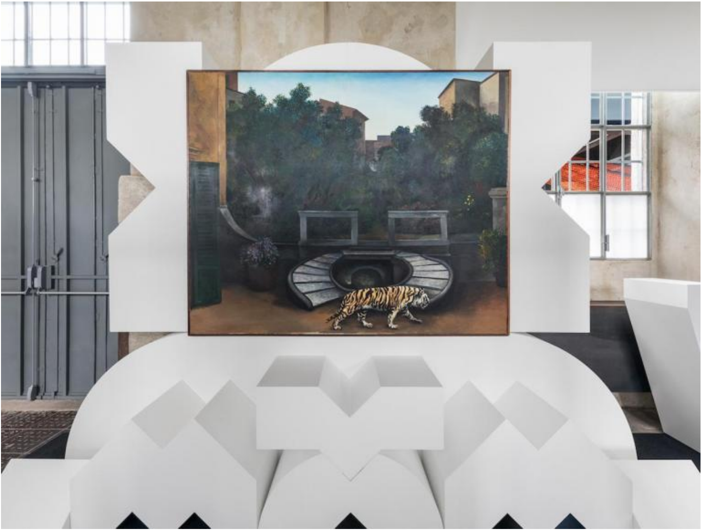
Immagine della mostra "TV 70: Francesco Vezzoli guarda la Rai". Fondazione Prada, Milano. 9 maggio 2017 - 24 settembre 2017. Renato Guttuso, La visita della sera, 1980, olio su tela. / View of the exhibition "TV 70: Francesco Vezzoli guarda la Rai". Fondazione Prada, Milan. 9 May 2017 - 24 September 2017. Renato Guttuso, La visita della sera, 1980, oil on canvas