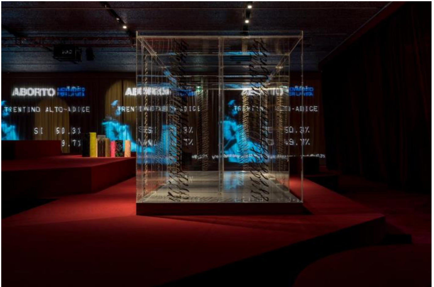
Immagine della mostra TV 70: Francesco Vezzoli guarda la Rai. Fondazione Prada, Milano. 9 maggio 2017 - 24 settembre 2017. Carla Accardi, Casa Labirinto, 1999 - 2000. Da un disegno del 1970, vernice su plexiglas e base di legno / View of the exhibition TV 70: Francesco Vezzoli guarda la Rai. Fondazione Prada, Milan. 9 May 2017 - 24 September 2017. Carla Accardi, Casa Labirinto, 1999 - 2000. After a 1970 drawing, varnish on plexiglas and

A far da controcanto a questo fermento civile e sociale tutto femminile, in campo artistico, l'unica donna capace di imporsi è Carla Accardi, i cui lavori volumetrici sono numerosi, celebri Rotoli colorati (giallo, nero, rosa, rosa-fluoro e verdenero ...), tre Grandi Trasparenti (1975-76), due strutture abitabili come la Tenda (1965-66) e la Casa Labirinto (su un disegno del '70) che rimandano all'idea di permeabilità degli spazi, di relazione insolubile tra esteriorità e interiorità, tra la vita nel mondo, là fuori e una vita interiore tutta da coltivare, abitano armonicamente la grande sala, che assume le connotazioni di una scena teatrale.