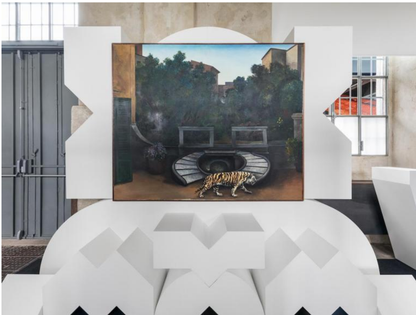
Immagine della mostra “TV 70: Francesco Vezzoli guarda la Rai”. Fondazione Prada, Milano. 9 maggio 2017 - 24 settembre 2017. Renato Guttuso, La visita della sera, 1980, olio su tela. / View of the exhibition “TV 70: Francesco Vezzoli guarda la Rai”. Fondazione Prada, Milan. 9 May 2017 - 24 September 2017. Renato Guttuso, La visita della sera, 1980, oil on canvas