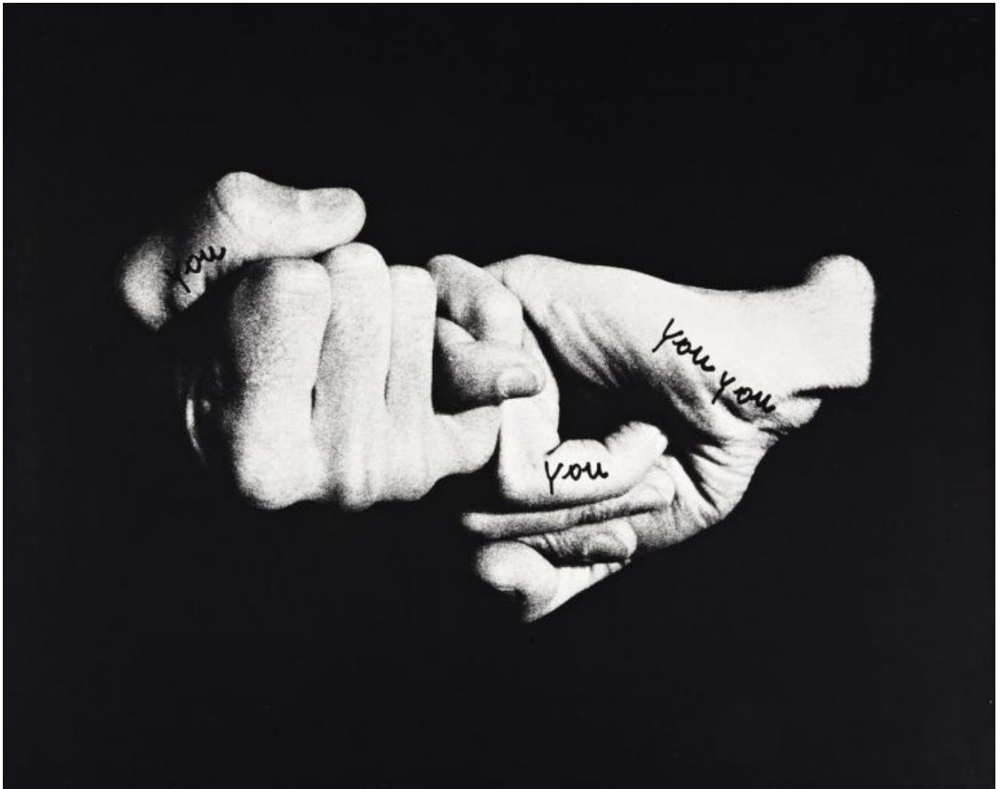
Ketty La Rocca, Le mani , 1973.

In apertura e in chiusura di questo capitolo dedicato alla ferita politica , troviamo due opere che investono le possibilità del linguaggio: Non capiterà mai più , 12 collage di Nanni Balestrini, e Le Mani (1973) di Ketty La Rocca, un video realizzato per la trasmissione Nuovi Alfabeti , dedicata ai non udenti, di cui poi diventa anche sigla . Finalmente, una donna.