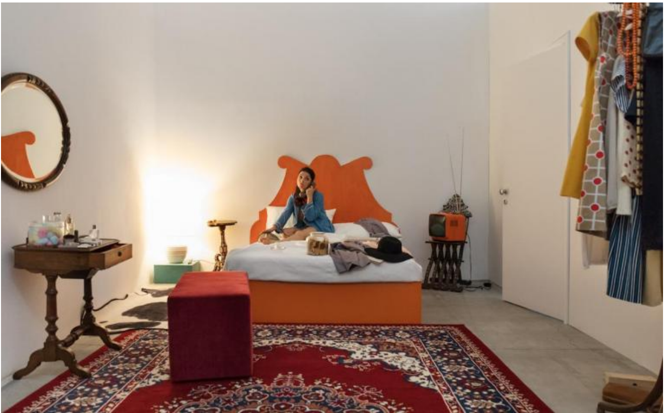
Immagine della mostra "TV 70: Francesco Vezzoli guarda la Rai". Fondazione Prada, Milano. 9 maggio 2017 - 24 settembre 2017. Giosetta Fioroni, La spia ottica - Ovvero la mia camera da letto, 1968 (2017) / View of the exhibition "TV 70: Francesco Vezzoli guarda la Rai". Fondazione Prada, Milan. 9 May 2017 - 24 September 2017. Giosetta Fioroni, La spia ottica - Ovvero la mia camera da letto, 1968 (2017)

Il primo incontro è con La spia ottica - Ovvero, la mia camera da letto (1968, 2017) di Giosetta Fioroni, raccontata a catalogo nell'intervista dell'artista con H.U. Obrist: Una donna, sola, che si annoia . Si tratta del re-enactement , dopo quasi 50 anni, di una performance del 1968 alla storica galleria La Tartaruga di Roma: lo spettatore osserva - non visto, dunque da una prospettiva privilegiata - attraverso la lente di uno spioncino, una donna sola nella sua camera da letto, muoversi, compiere azioni quotidiane come leggere, scrivere, telefonare, spogliarsi, pettinarsi, assopirsi e risvegliarsi.