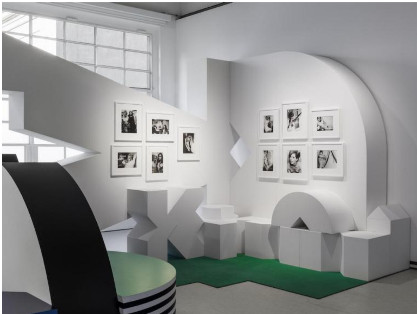
Immagine della mostra "TV 70: Francesco Vezzoli guarda la Rai". Fondazione Prada, Milano. 9 maggio 2017 - 24 settembre 2017. Lisetta Carmi, I Travestiti, 1965 – 71, original gelatin silver print. / View of the exhibition "TV 70: Francesco Vezzoli guarda la Rai". Fondazione Prada, Milan. 9 May 2017 - 24 September 2017. Lisetta Carmi, I Travestiti, 1965 - 71, original gelatin silver print.