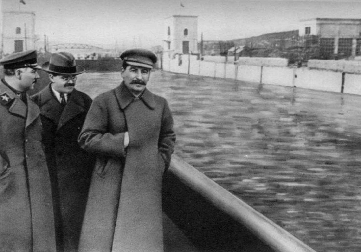
La stessa foto del 1937 ritoccata dopo la caduta in disgrazia di Ežov, 1939.

passò a Lavrentij Berija, sotto la cui giurisdizione la situazione conobbe un temporaneo momento di distensione per poi riprendere con efferata violenza. La figura di Ežov divenne imbarazzante e, come era d'uso all'epoca, quando una persona cadeva in disgrazia e «spariva», anche la sua immagine doveva dileguarsi da ogni documento ufficiale. La fotografia del 1937 venne ritoccata, la spalletta del ponte riassetata, la manica del cappotto di Stalin aggiustata e del commissario-nemico del popolo non rimase neppure l'effigie.