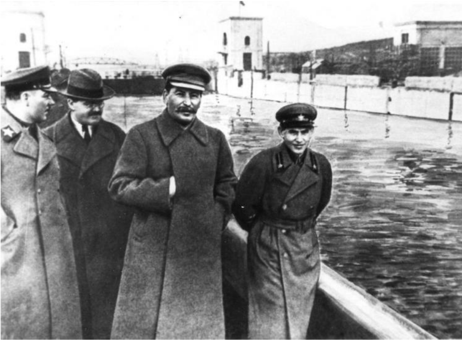
La visita di alcuni membri del politbjuro al cantiere del canale Mosca-Volga, 1937.

Quest'ultimo era all'epoca capo dell'NKDV, la polizia segreta responsabile in quegli anni di purghe ed efferatezze senza fine, ufficialmente "Commissariato del popolo per gli affari interni". Il periodo fu ribattezzato «È¾ovjÄ•ina , intraducibile lemma che si potrebbe rendere come "fenomeno dominato dalle atroci gesta di È¾ov": arresti, condanne, interrogatori, torture, confini ecc. Le famigerate notti in cui il rumore di un'auto che si fermava alle porte di un palazzo mandava nel panico tutti gli inquilini, e il sollievo si manifestava soltanto quando i passi sulle scale si fermavano prima o superavano il pianerottolo in cui si risiedeva. Amici denunciavano amici, mogli denunciavano mariti, colleghi denunciavano colleghi. La disperazione per la sopravvivenza faceva strage anche di ogni etica e umanità. Come spesso succedeva in quella realtà, a cadere per primi in disgrazia erano proprio coloro che occupavano posizioni di maggiore responsabilità e che si trovavano più vicini ai vertici del potere. Invidie, timori di vendette o complotti, punizioni per eccesso di zelo o divergenze ideologiche videro progressivamente cadere teste assai prestigiose in ogni ambito, militare, politico, culturale.