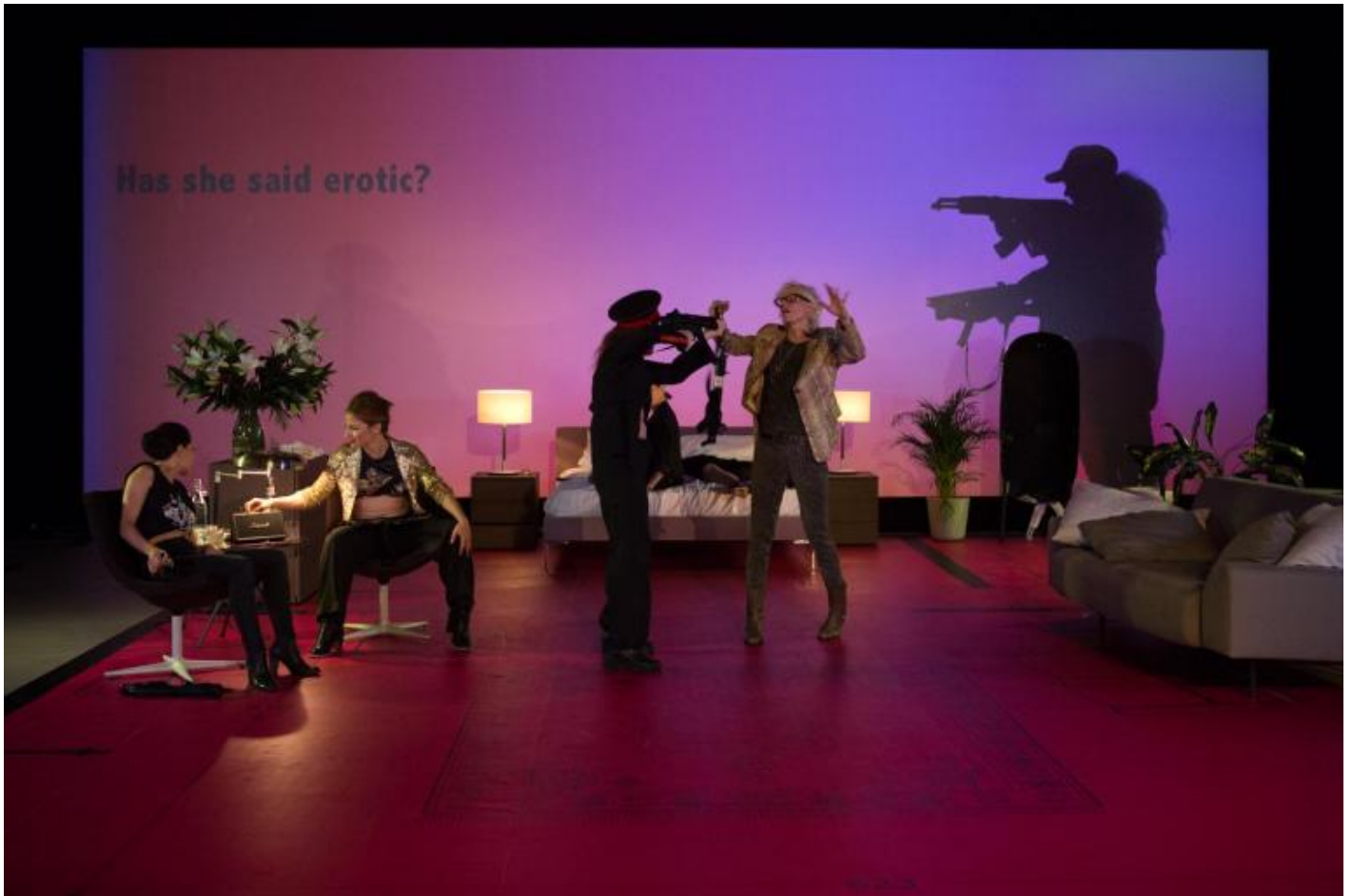
Motus, "Ber Raffiche", ph. DIANE Ilaria Scarpa, Luca Telleschi

versione "acqua e sapone", con una maglietta scura e una treccia da adolescente si sovrappongono le immagini virtuali di lei pesantemente truccata, immortalata in autoscatti di natura quasi pornografica. Proprio nel violento scarto tra le due figure (talmente antitetico da indurre qualche spettatore a domandarsi se si tratti di una effettiva identità) risiede l'intelligente denuncia di ambigue e scivolose dinamiche di sguardo: lo spettatore si trova inevitabilmente indotto, dopo aver osservato le immagini e i video proposti dall'artista, a ripensare da un'altra prospettiva alla violenza di cui ha sentito parlare nei primi istanti dello spettacolo. E viene così chiamato a riconoscere in se stesso, prima ancora che negli altri, l'attuarsi involontario di schemi di giudizio sessisti ed eteronormativi.