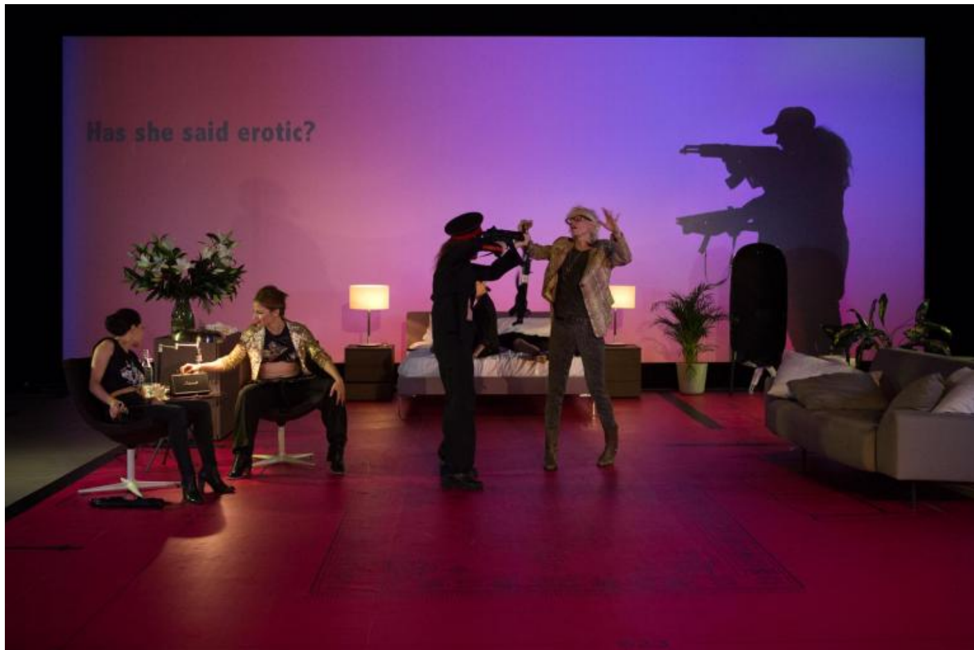
Motus, Über Raffiche

nel violento scarto tra le due figure (talmente antitetice da indurre qualche spettatore a domandarsi se si tratti di una effettiva identità) risiede l'intelligente denuncia di ambigue e scivolose dinamiche di sguardo: lo spettatore si trova inevitabilmente indotto, dopo aver osservato le immagini e i video proposti dell'artista, a ripensare da un'altra prospettiva alla violenza di cui ha sentito parlare nei primi istanti dello spettacolo. E viene così chiamato a riconoscere in se stesso, prima ancora che negli altri, l'attuarsi involontario di schemi di giudizio sessisti ed eteronormativi.