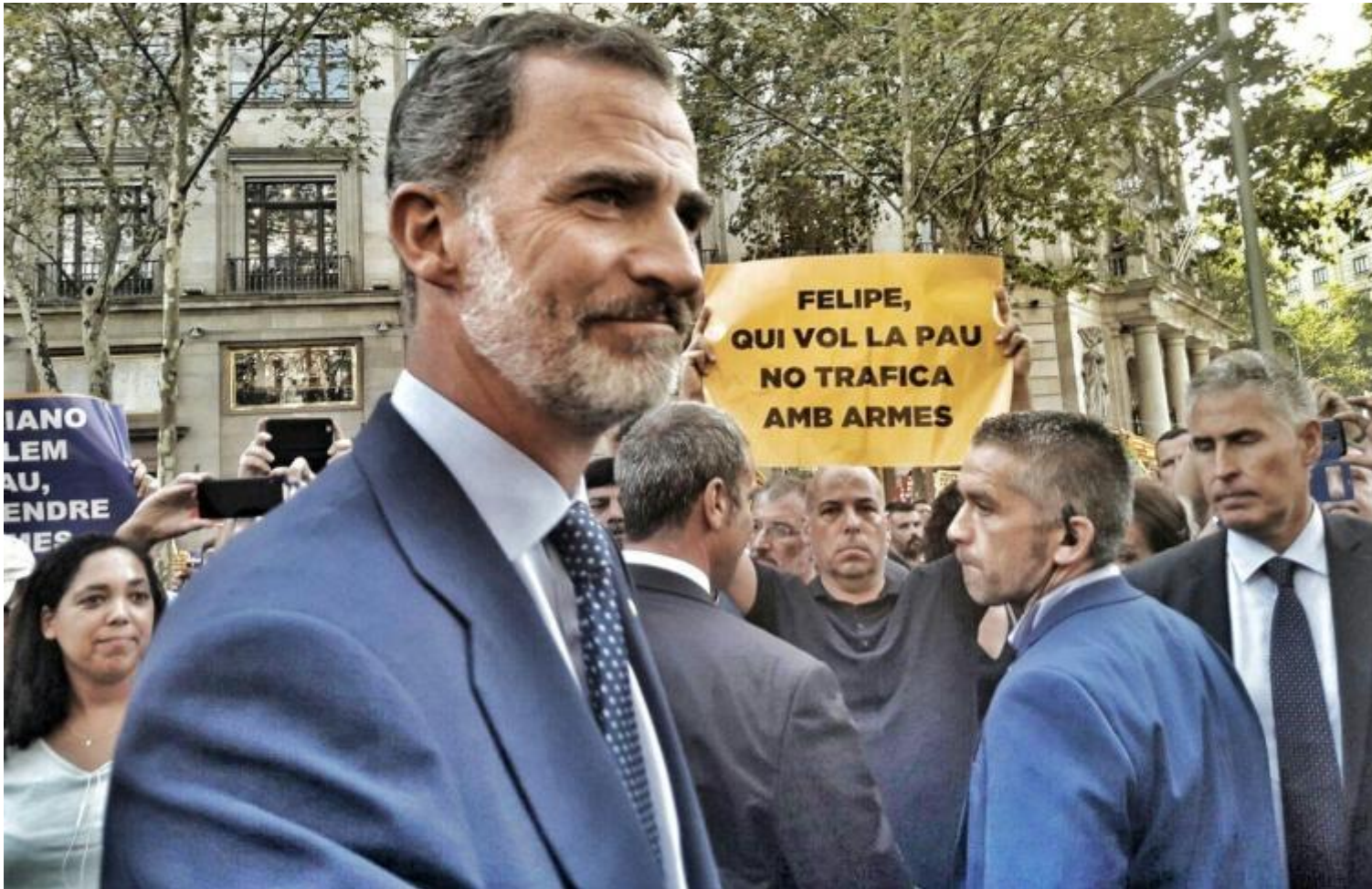
__title__ Passeig de Gracia - entrata a Piazza Catalunya. Sabato 26 Agosto, h. 17.50. "Felipe, chi vuole la pace non traffica con le armi."

Ã interessante essere qui in questo momento e non lo si puÃ² nÃ© vivere nÃ© raccontare senza ricordarsi che Barcellona sta in Catalunya, Catalunya sta in Spagna e che la generazione di Ada Colau Ã figlia di una dittatura: Felipe VI Ã figlio del Re Juan Carlos che Ã rimasto in carica al fianco del dittatore Francisco Franco fino al giorno della sua abdicazione, avvenuta il 19 Giugno 2014. Due anni fa.