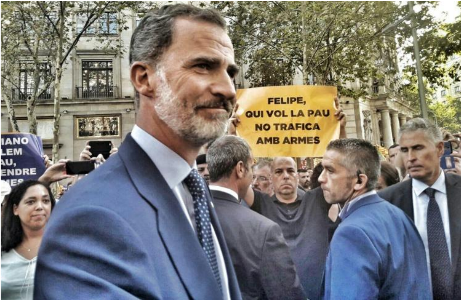
__title__ Passeig de Gracia - entrata a Piazza Catalunya. Sabato 26 Agosto, h. 17.50. "Felipe, chi vuole la pace non traffica con le armi."

Ã interessante essere qui in questo momento e non lo si puÃ² nÃ© vivere nÃ© raccontare senza ricordarsi che Barcellona sta in Catalunya, Catalunya sta in Spagna e che la generazione di Ada Colau Ã figlia di una dittatura: Felipe VI Ã figlio del Re Juan Carlos che Ã rimasto in carica al fianco del dittatore Francisco Franco fino al giorno della sua abdicazione, avvenuta il 19 Giugno 2014. Due anni fa.