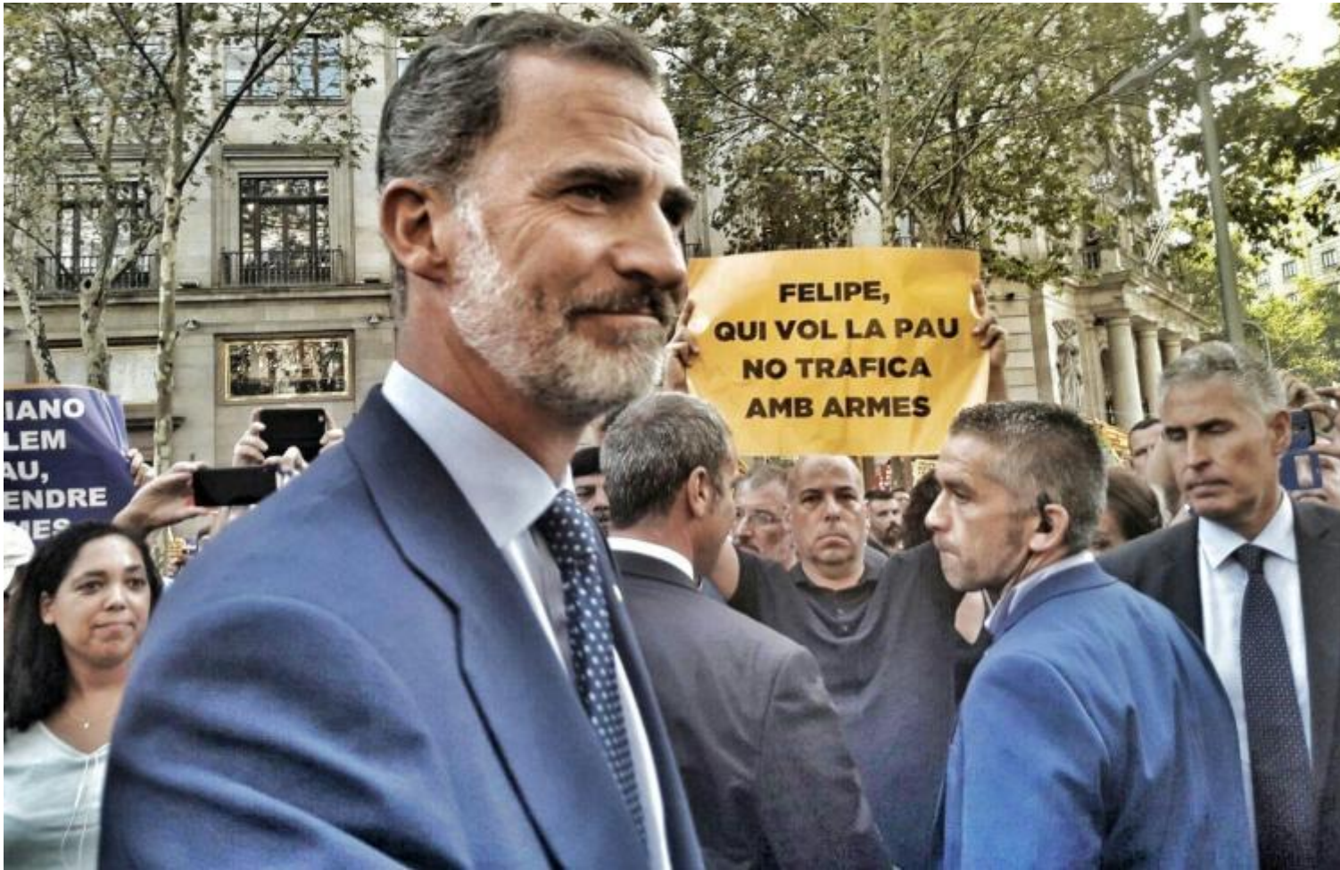
__title__ Passeig de Gracia - entrata a Piazza Catalunya. Sabato 26 Agosto, h. 17.50. "Felipe, chi vuole la pace non traffica con le armi."

È interessante essere qui in questo momento e non lo si può né vivere né raccontare senza ricordarsi che Barcellona sta in Catalunya, Catalunya sta in Spagna e che la generazione di Ada Colau è figlia di una dittatura: Felipe VI è figlio del Re Juan Carlos che è rimasto in carica al fianco del dittatore Francisco Franco fino al giorno della sua abdicazione, avvenuta il 19 Giugno 2014. Due anni fa.