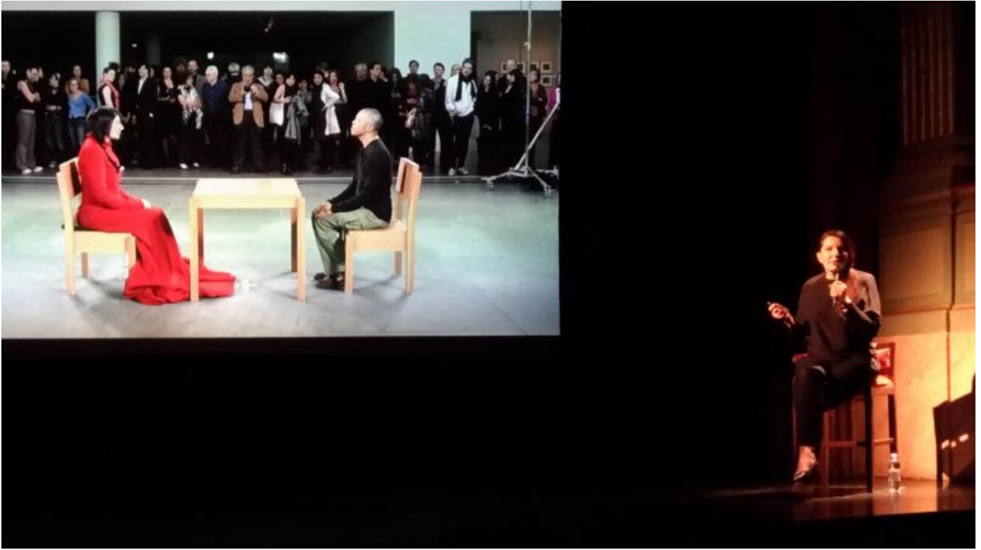
Lecture di Marina Abramović? con la proiezione di alcune fotografie scattate nel corso della performance The Artist is Present eseguita al MoMa di New York nel 2010.

Nella filosofia della Stoà , come si diceva, lo stesso pneuma che anima il mondo anima anche il corpo, un corpo perciò senza limiti e confini , ma già con Marco Aurelio Antonino, e prima ancora con Posidonio, il termine pneuma ( soffio, respiro, spirito vitale ) subisce una mutazione semantica. Nel medio stoicismo viene introdotto un dualismo tra la parte superiore dell'anima e quella inferiore, animale, sensuale e corporea. Al formarsi di questa diversa concezione del pneuma concorre anche lo sviluppo della medicina, in seno alla quale la pneumatologia era stata ulteriormente rielaborata: al soffio vitale era stata sottratta ogni funzione che non fosse puramente fisiologica. Nel suo bellissimo saggio, Tasinato analizza la deprecazione del respiro ( pneuma ), che si accompagna alla stigmatizzazione di quanto nell'esistenza vi è di transitorio. Da qui in avanti lo spirito si emanciperà dal corpo: "sangue guasto, ossicini, intrico sottile di nervi, venuzze, arterie", animato da un "soffiuccio" destinato a disperdersi.