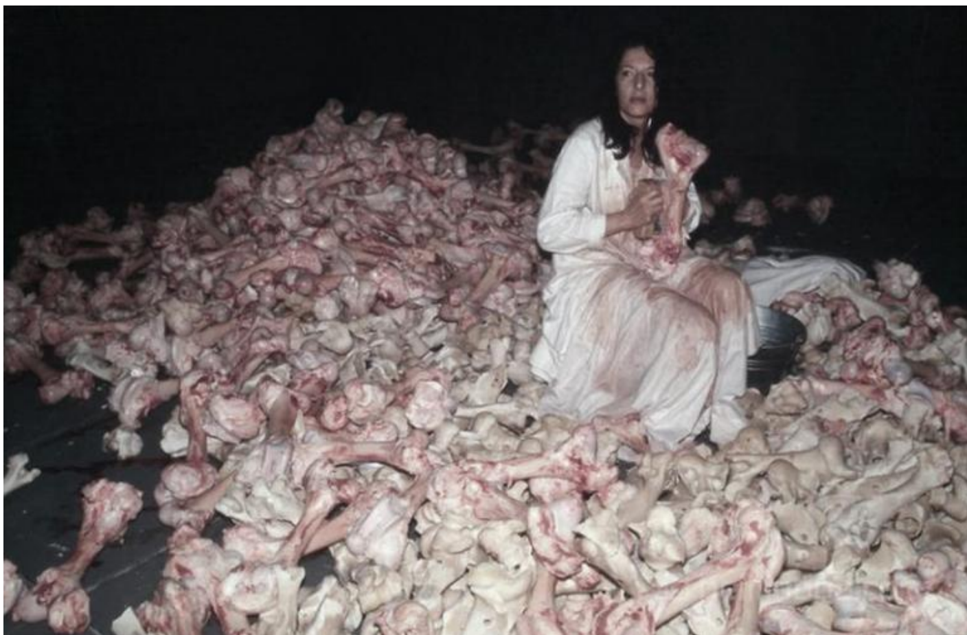
Performance Balkan Baroque eseguita in occasione della Biennale di Venezia del 1997.

Per associazione con “nervi”, “ossicini” e “sangue guasto” balena nella mia mente l’immagine di una sanguinolenta opera di Abramović?. Seduta su una montagna di ossa bovine, intenta a ripulirne la cartilagine nella performance Balkan Baroque eseguita in occasione della Biennale di Venezia del 1997, l’artista porta l’attenzione non solo sulla tragedia dei Balcani ma – mi permetto di pensare con la licenza ermeneutica che ogni opera d’arte rilascia d’ufficio – anche sulla fine di una concezione del mondo in cui la carne è spirito, energia nel flusso della quale l’artista s’immette durante le sue performance. Per la sua natura polisemica l’opera d’arte indica sempre una cosa e, insieme, anche un’altra, diversa se non contraria, in questo caso la difficile e dolorosa ricomposizione sociale dopo le stragi balcaniche e l’altrettanto dolorosa perdita del respiro nella nostra cultura.