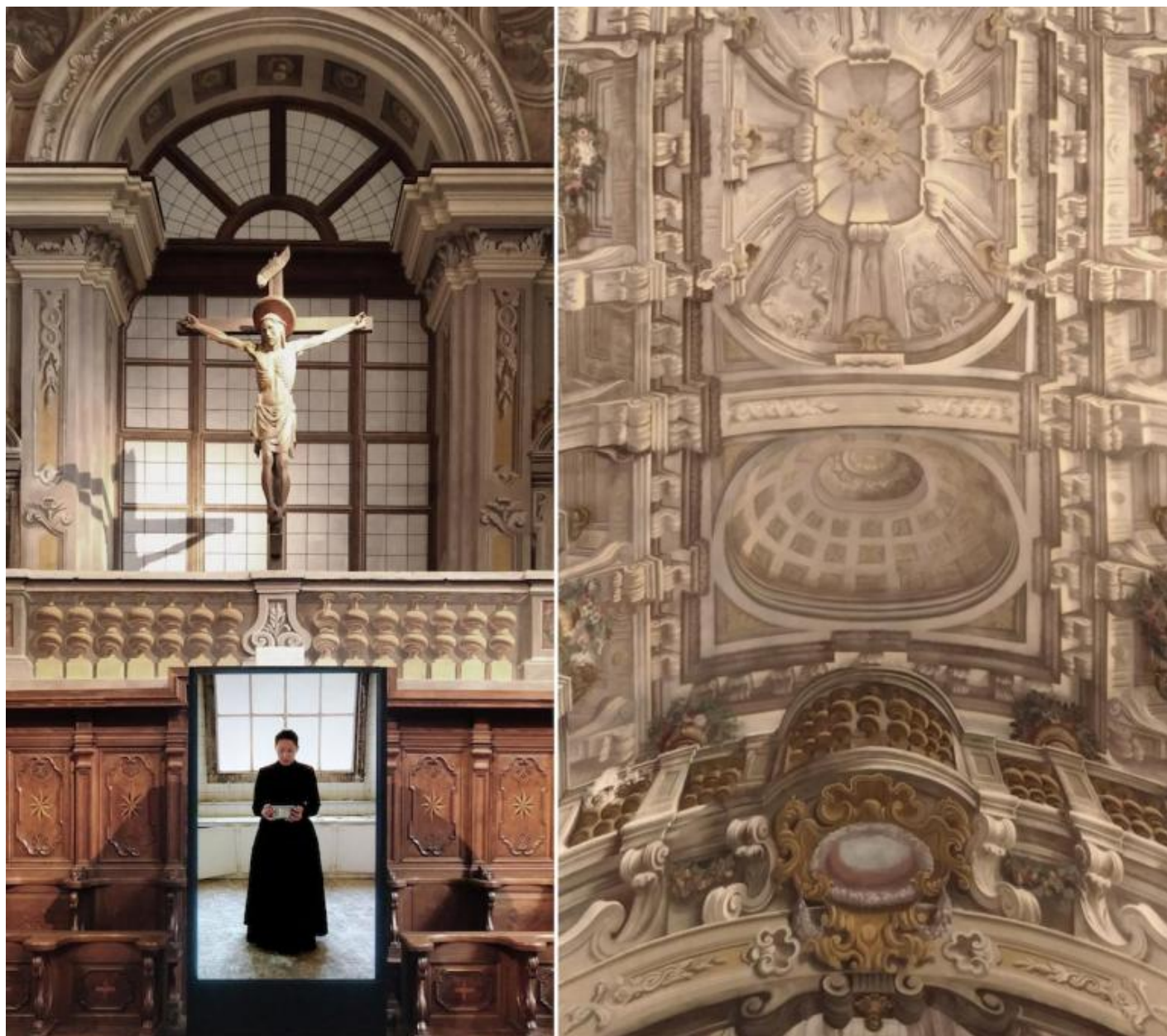
Opera video The Kitchen V, Carrying the Milk, della serie The Kitchen, Homage to Saint Therese, esposta nel coro della chiesa di S. Maria Maddalena ad Alba - Soffitto del coro con affreschi.