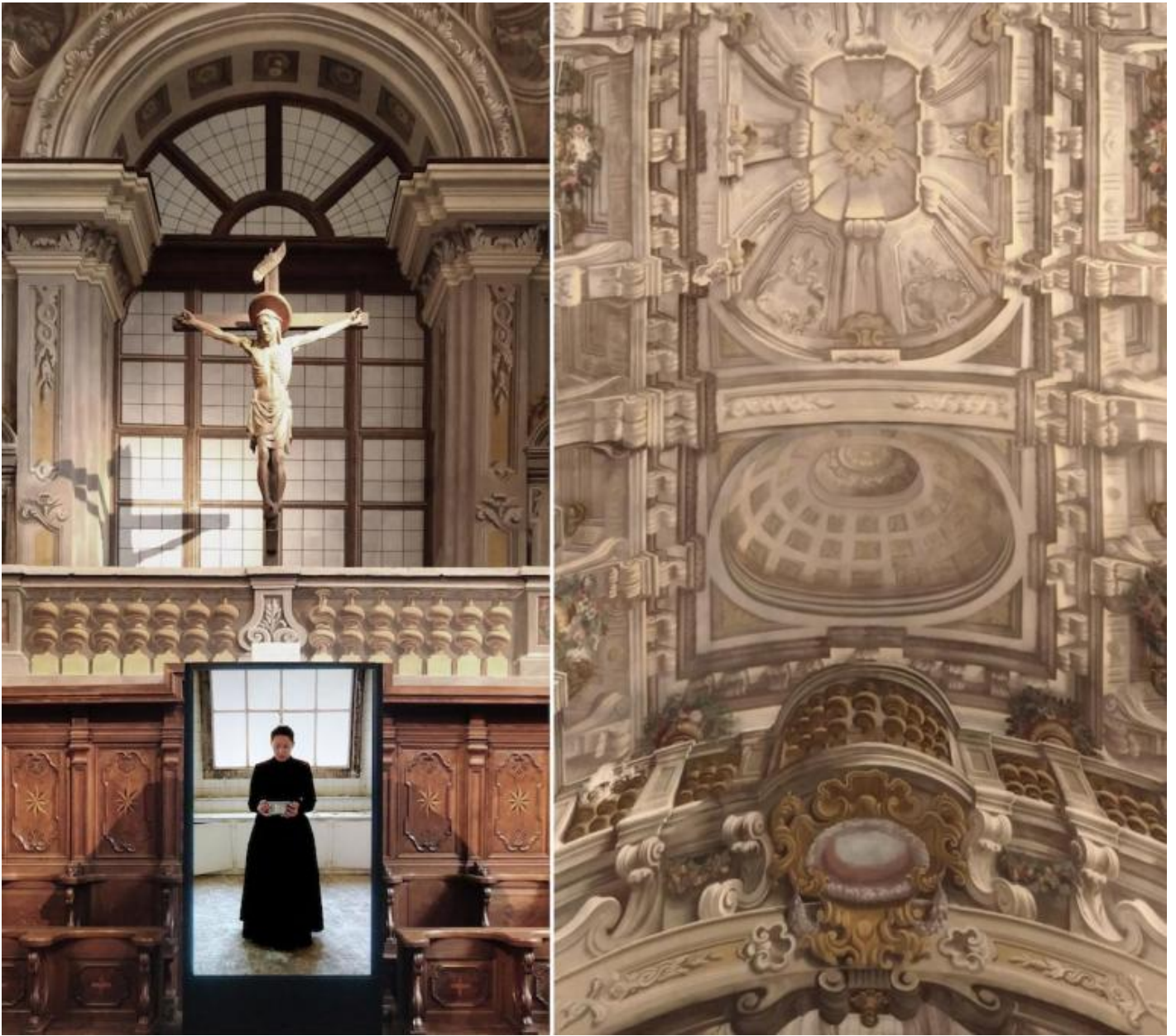
Opera video The Kitchen V, Carrying the Milk, della serie The Kitchen, Homage to Saint Therese, esposta nel coro della chiesa di S. Maria Maddalena ad Alba - Soffitto del coro con affreschi.