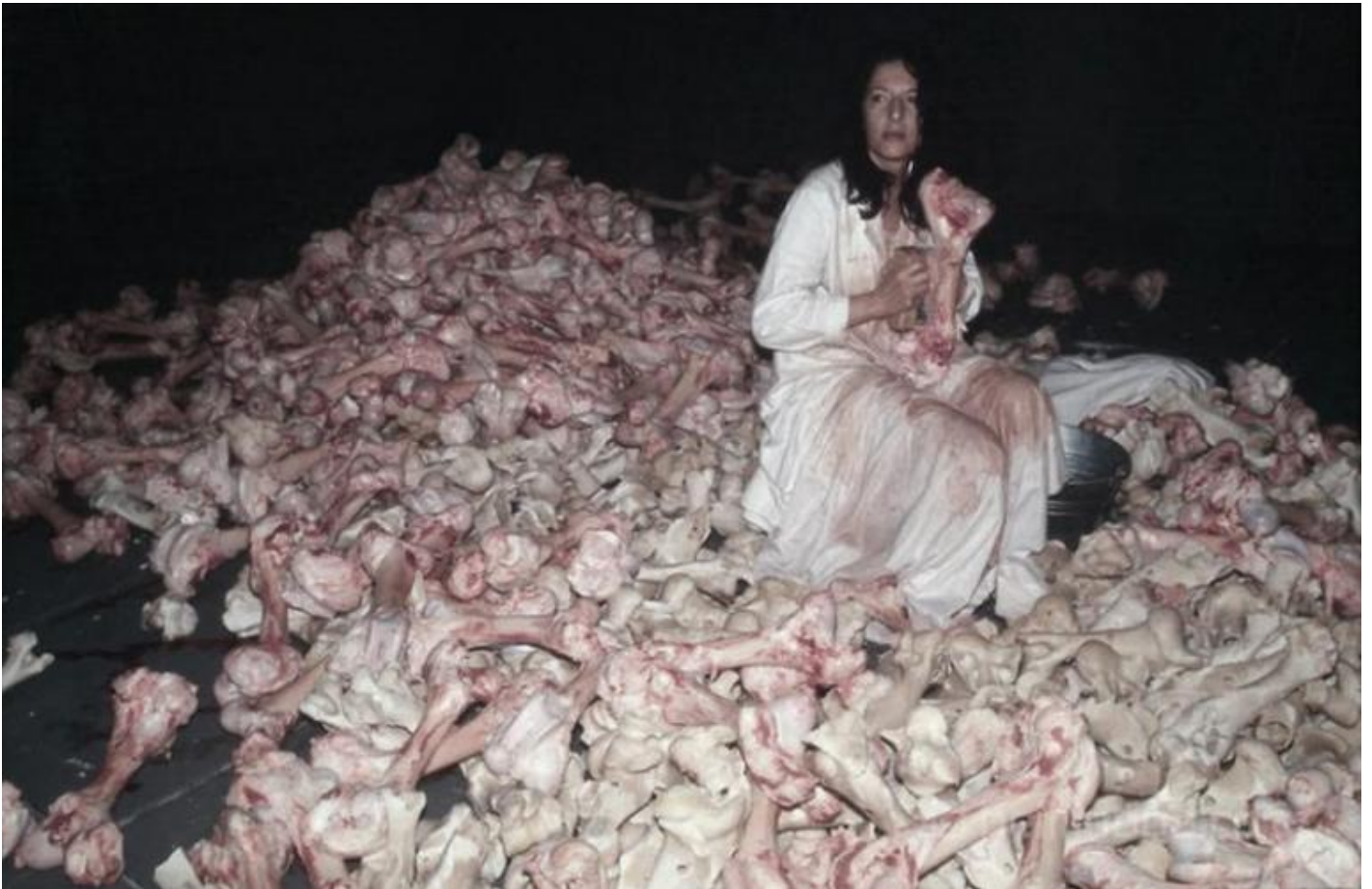
Performance Balkan Baroque eseguita in occasione della Biennale di Venezia del 1997.

Per associazione con â??nerviâ?• , â??ossiciniâ?• e â??sangue guastoâ?• balena nella mia mente lâ??immagine di una sanguinolenta opera di AbramoviÄ?. Seduta su una montagna di ossa bovine, intenta a ripulirne la cartilagine nella performance Balkan Baroque eseguita in occasione della Biennale di Venezia del 1997, lâ??artista porta lâ??attenzione non solo sulla tragedia dei Balcani ma â?? mi permetto di pensare con la licenza ermeneutica che ogni opera dâ??arte rilascia dâ??ufficio â?? anche sulla fine di una concezione del mondo in cui la carne Ã? spirito, energia nel flusso della quale lâ??artista sâ??immette durante le sue performance. Per la sua natura polisemica lâ??opera dâ??arte indica sempre una cosa e, insieme, anche unâ??altra, diversa se non contraria, in questo caso la difficile e dolorosa ricomposizione sociale dopo le stragi balcaniche e lâ??altrettanto dolorosa perdita del respiro nella nostra cultura.