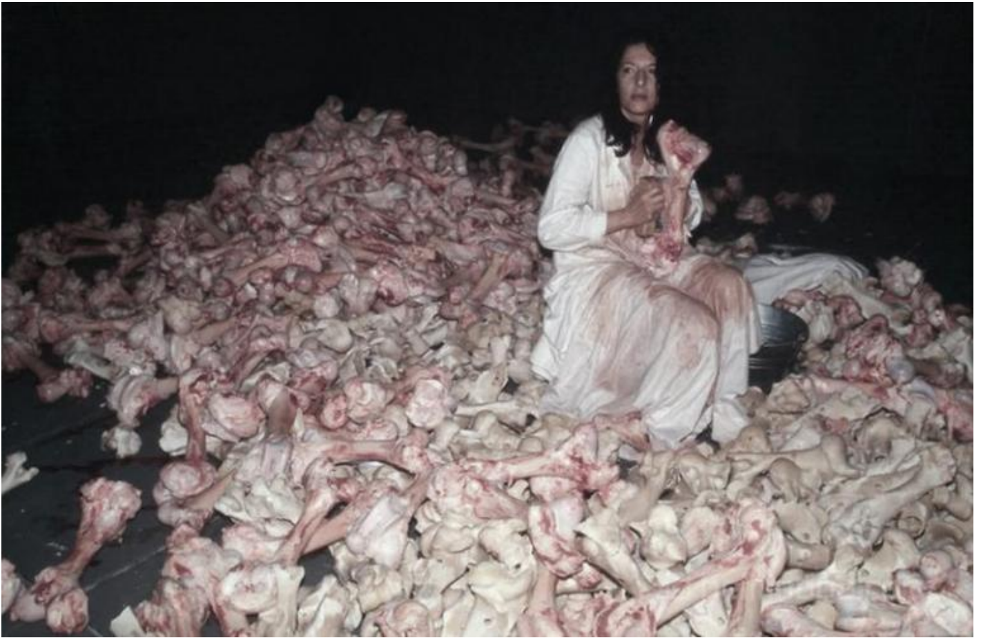
Performance Balkan Baroque eseguita in occasione della Biennale di Venezia del 1997.

Per associazione con â??nerviâ?• , â??ossiciniâ?• e â??sangue guastoâ?• balena nella mia mente lâ??immagine di una sanguinolenta opera di AbramoviÄ?. Seduta su una montagna di ossa bovine, intenta a ripulirne la cartilagine nella performance Balkan Baroque eseguita in occasione della Biennale di Venezia del 1997, lâ??artista porta lâ??attenzione non solo sulla tragedia dei Balcani ma â?? mi permetto di pensare con la licenza ermeneutica che ogni opera dâ??arte rilascia dâ??ufficio â?? anche sulla fine di una concezione del mondo in cui la carne Ã? spirito, energia nel flusso della quale lâ??artista sâ??immette durante le sue performance. Per la sua natura polisemica lâ??opera dâ??arte indica sempre una cosa e, insieme, anche unâ??altra, diversa se non contraria, in questo caso la difficile e dolorosa ricomposizione sociale dopo le stragi balcaniche e lâ??altrettanto dolorosa perdita del respiro nella nostra cultura.