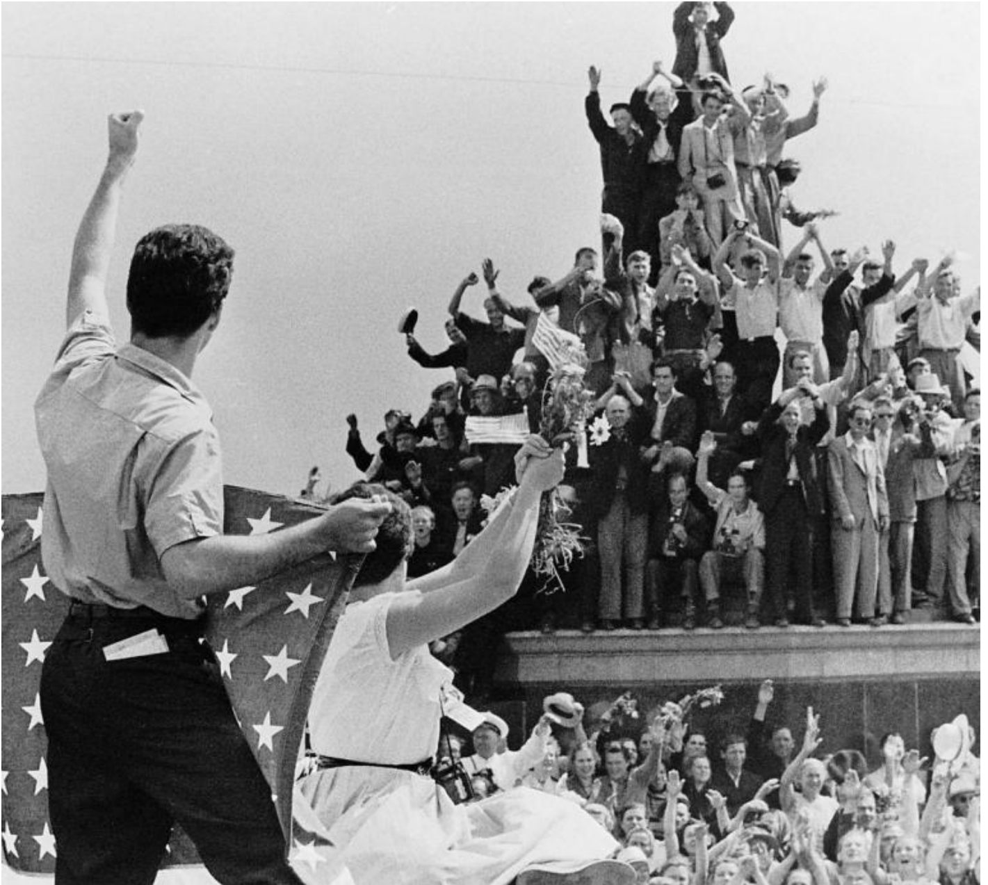
Il Festival della giovent  a Mosca, 1957.

Le piramidi umane di cittadini che, alla ricerca di un punto d'osservazione privilegiato, si formavano a ridosso dei monumenti nulla più avevano in comune con le artificiose formazioni di atleti ibernati, per gli occhi di Stalin, in posizioni rigide e assurde.