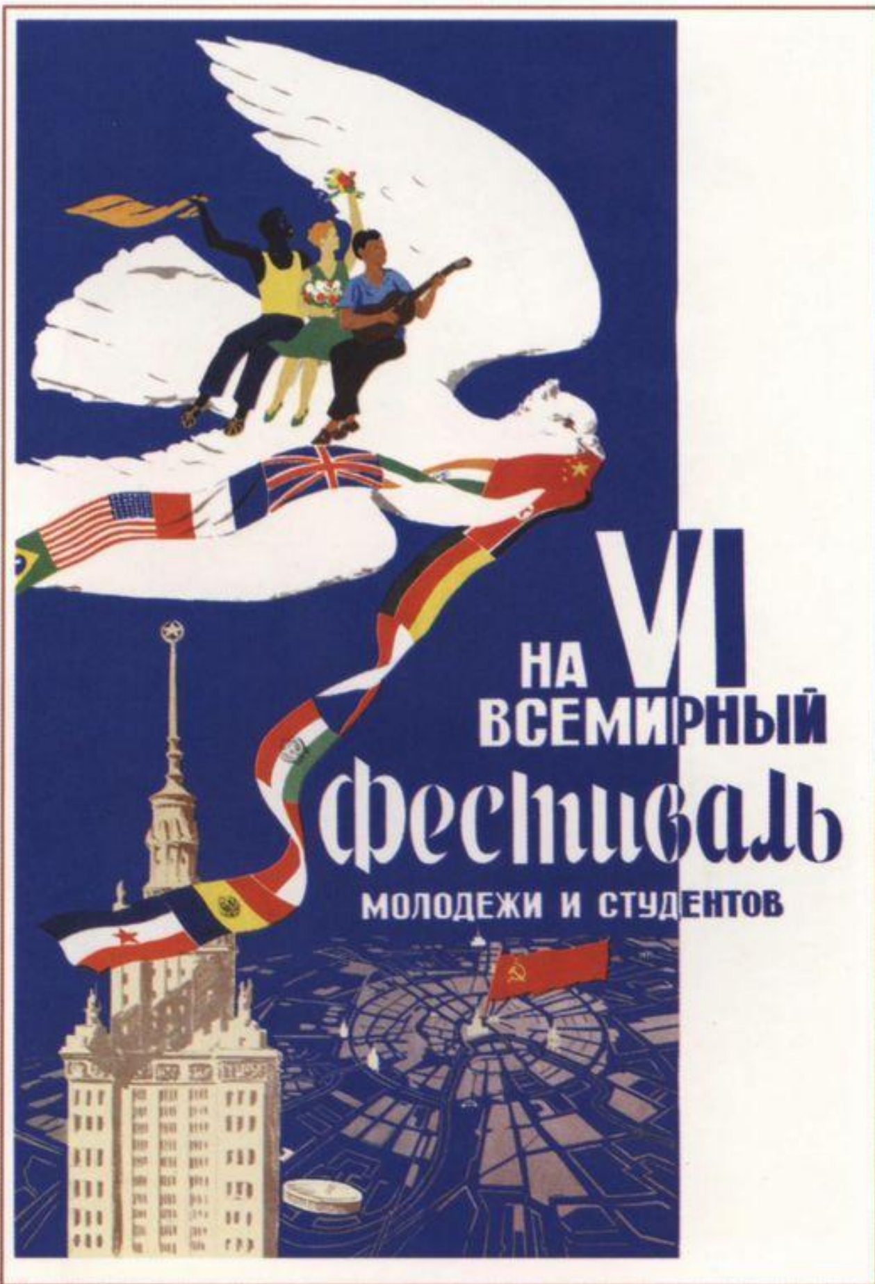
Manifesto. Andiamo al Festival mondiale della giovent  e degli studenti.