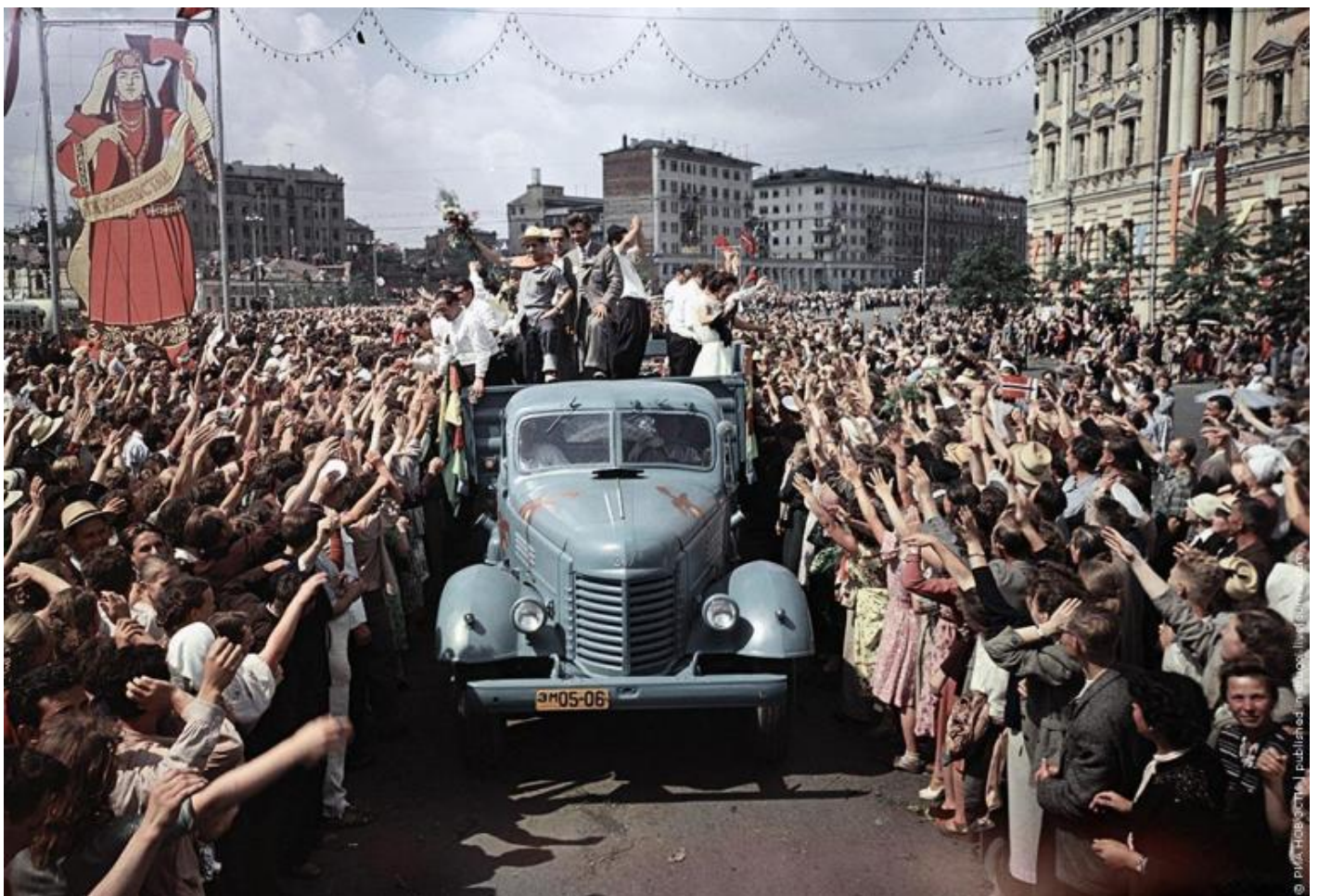
Il Festival della gioventù per le strade di Mosca, 1957.