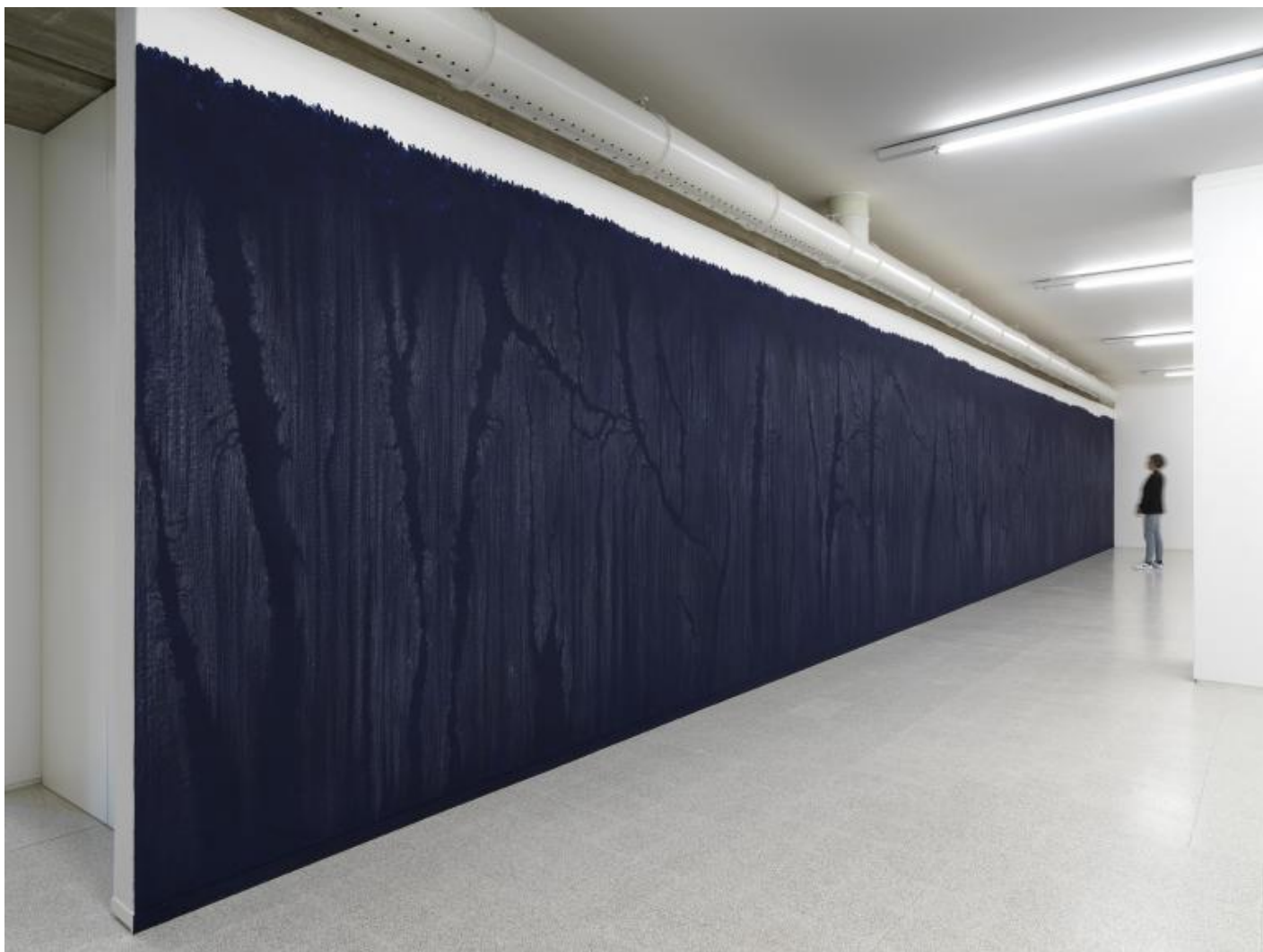
Luisa Rabbia Another Country 2017 pastello a cera, acrilico / wax pastel, acrylic 2,56 x 17,28 metri site specific per Collezione Maramotti / site specific for Collezione Maramotti

Pur avendo sperimentato linguaggi differenti, che spaziano dal video alla scultura, il medium d'elezione di Luisa Rabbia è il disegno, con la sua forza segnica e la relazione diretta con il gesto. Se è convenzione identificarlo come disciplina concettuale per eccellenza, nel lavoro di Rabbia esso è anche traccia del corpo, prediletto per la sua forza espressiva a fronte della sua scabra specificità. Proprio per questa virtù, l'artista lo elegge a linguaggio primario durante il primo periodo dell'esperienza negli Stati Uniti, dove le contingenze la portano a prediligere un medium leggero, che le consenta una gamma espressiva vasta ma senza la necessità di ampi spazi d'installazione o tempi di produzione estesi. In fondo, una semplice penna blu e un foglio di carta possono generare interi mondi.