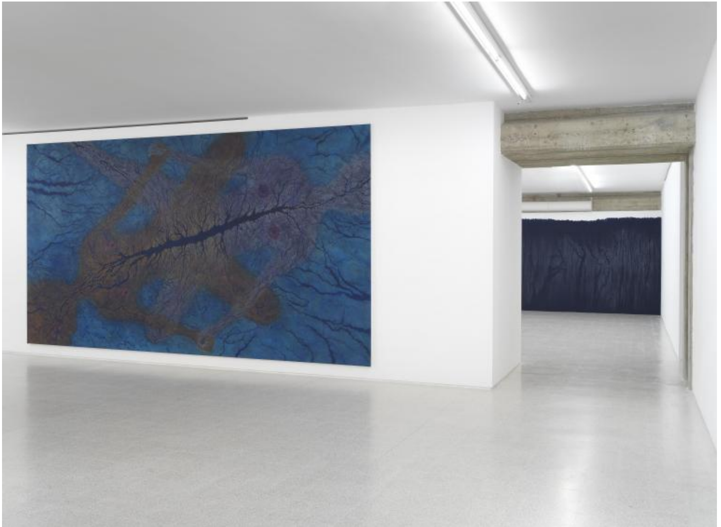
Luisa Rabbia Love Veduta di mostra alla Collezione Maramotti, 2017 / Exhibition view at Collezione Maramotti, 2017

La relazione tra spazio empirico, tangibile della tela, e spazio interno della rappresentazione rimanda inoltre alla lezione di Agnes Martin, artista amata da Rabbia e la cui presenza aleggia tra le tele. Tra le due artiste non si può parlare di rapporto di filiazione né di citazionismo, piuttosto si tratta di mondi contigui che risuonano l'uno nell'altro, accomunati da una volontà di scarnificazione dell'opera tesa a far emergere una verità profonda, universale e a tratti scandalosa.