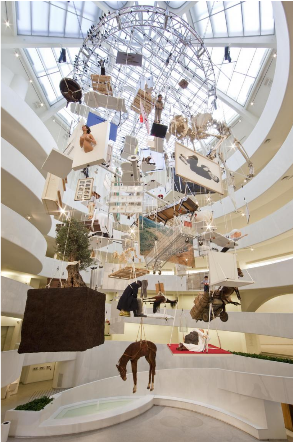
Maurizio Cattelan, All, 2001, ph Zeno Zotti, the Solomon Guggenheim foundation New York.

Cattelan non è un giullare, è sempre stato serio su tutto, viene ripetuto più volte nel film. O meglio, a noi pare che dietro la molto sottile superficie picaresca si nasconda qualcosa di assai più complesso. Il suo è un lavoro potente, e questa potenza - e qui siamo all'ultimo e più rilevante nucleo tematico - sta nella sua