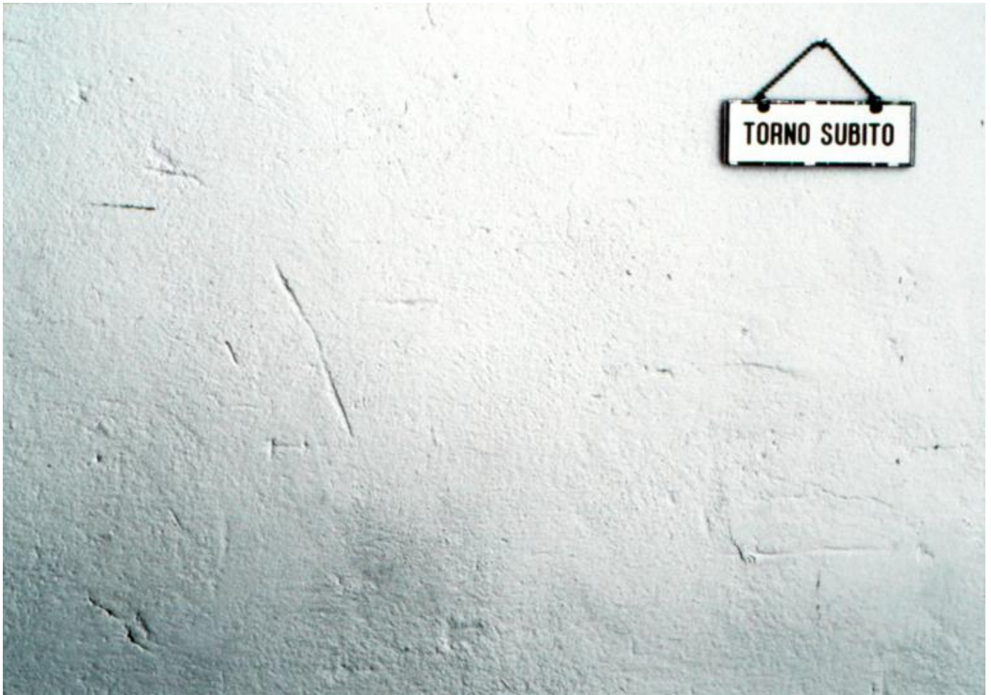
Maurizio Cattelan, Torno subito, 1989, ph Fausto Fabbri.

raffigurante Papa Giovanni Paolo II schiacciato da un meteorite, liquidata – da un'altra voce fuoricampo – come 'totalmente priva di gusto'. Mentre vediamo che Daddy, Daddy (2008), installazione venduta all'asta per una cifra vertiginosa, viene imballata dai trasportatori, ci viene raccontato che Maurizio è un tipo sfuggente, che non si apre con nessuno, che è circondato da molti ma pochi gli sono davvero vicini. In tre minuti e mezzo di film ci vengono date chiavi di lettura che ci permetteranno di andare oltre allo stereotipo di Cattelan buffone, pur senza contraddirlo. La narrazione si sposta quindi sull'infanzia padovana – cresce in una famiglia povera, frequenta poco la scuola – lasciando intuire l'immagine di un bambino non facile, quello stesso bambino che tornerà come autoritratto in molte sue opere.