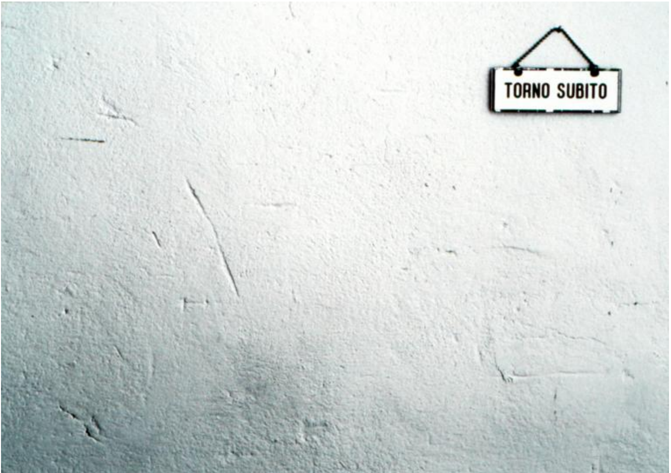
Maurizio Cattelan, Torno subito, 1989