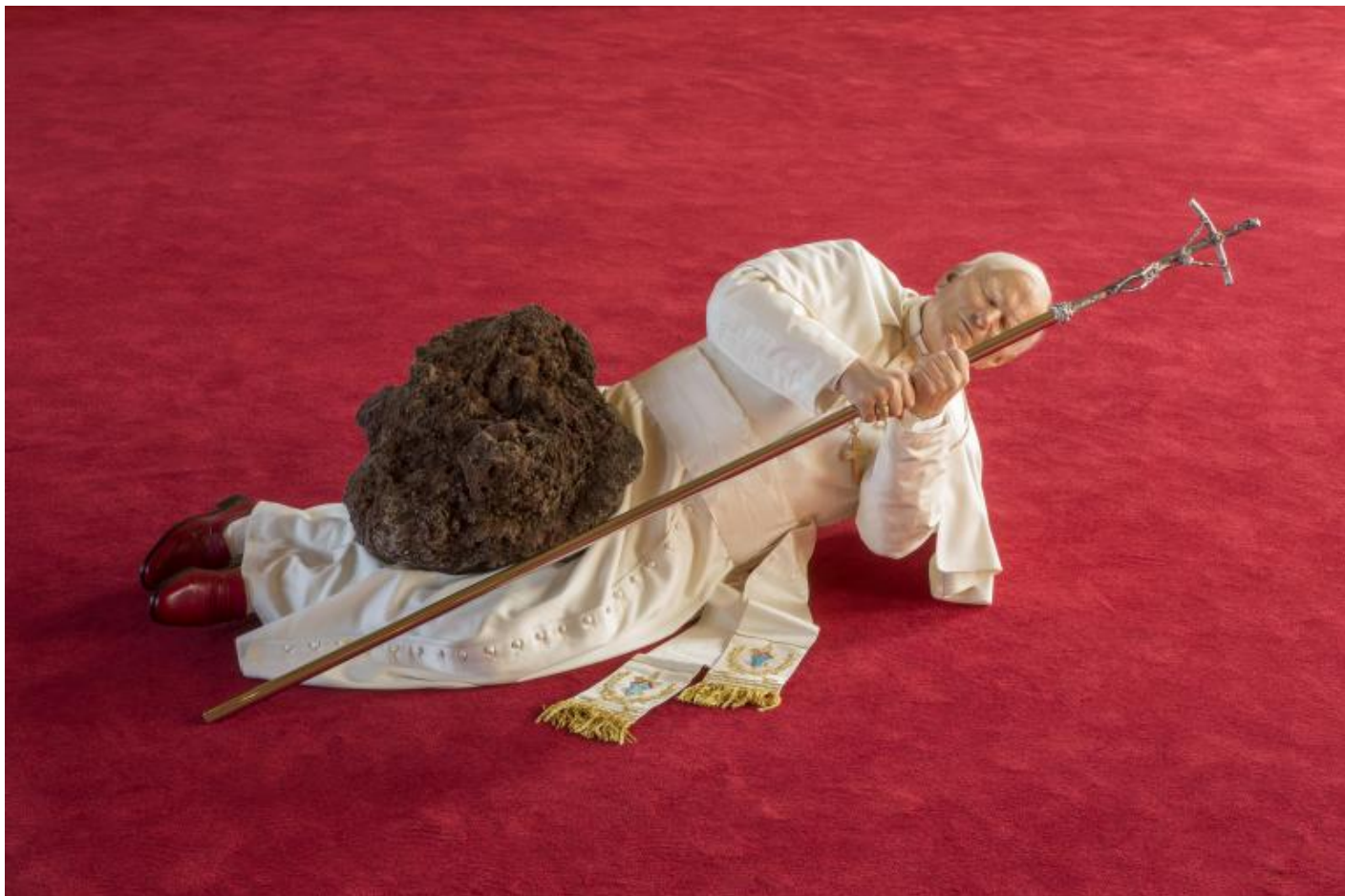
Maurizio Cattelan, La nona ora, 1999