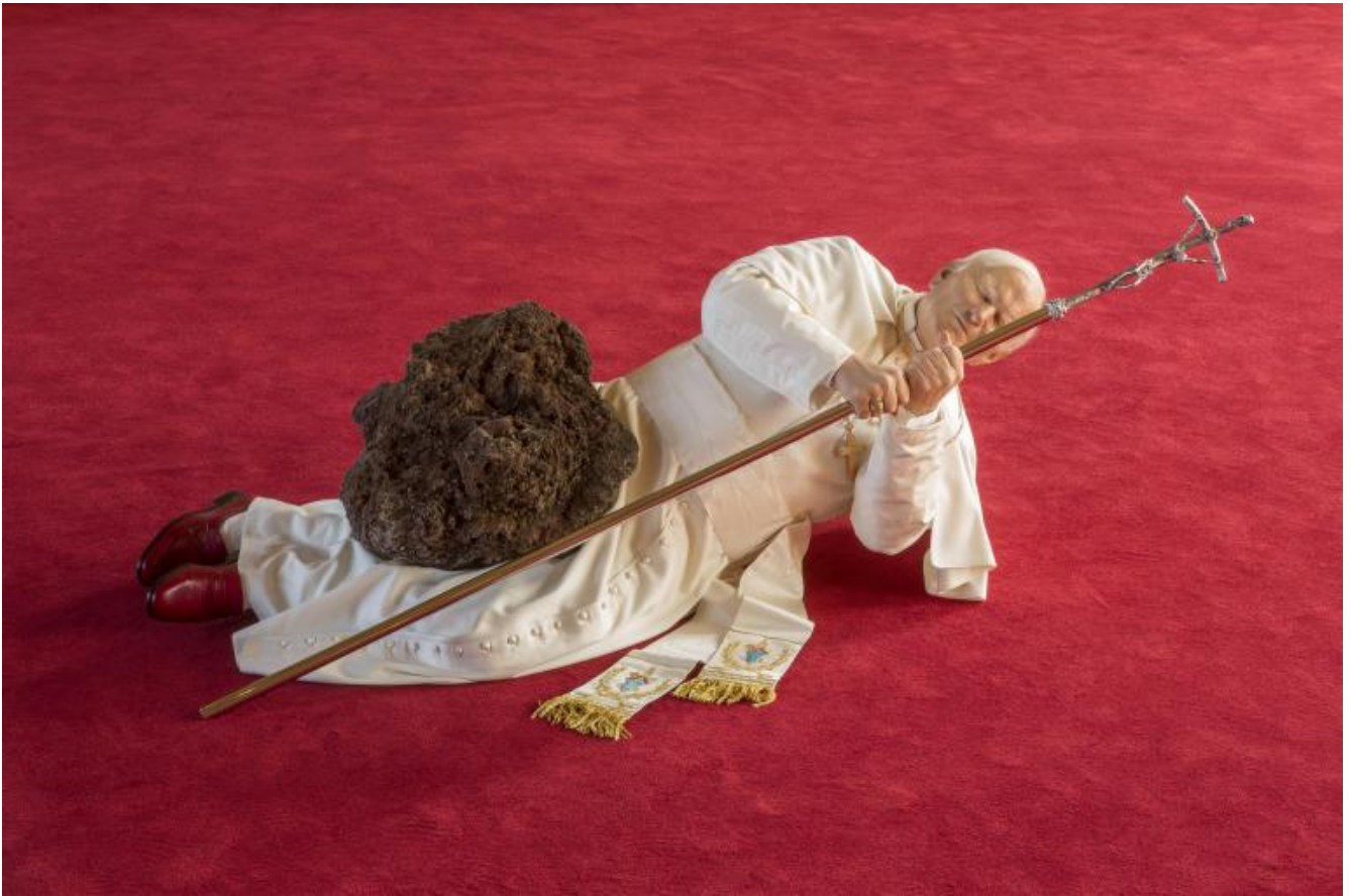
Maurizio Cattelan, La nona ora, 1999.

900.000 dollari, fatto che cambiò significativamente il suo rapporto con il mercato ma anche la sua popolarità, visto che quell'immagine del Papa divenne virale su ogni media. In una delle interviste che compongono il documentario, Massimo De Carlo, tra i primi galleristi a credere in lui sin dagli esordi, afferma che Cattelan ha dedicato la sua vita non all'arte, ma al successo nell'arte. È quindi un arrivista?