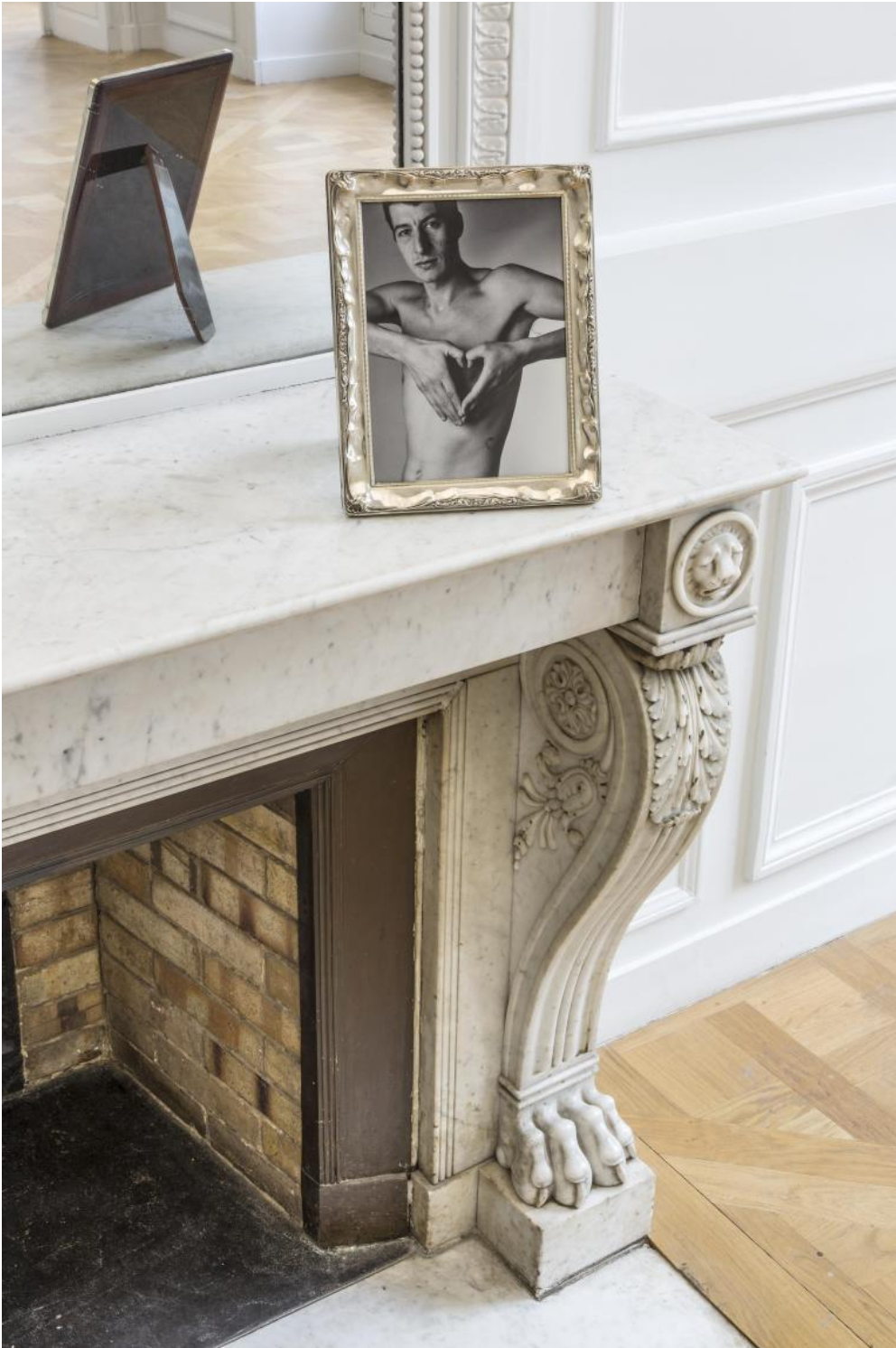
Maurizio Cattelan, Lessico familiare.

meno, poco importa – mostra al Guggenheim di New York, nel 2011, quando viene una volta per tutte consacrato come uno degli artisti più importanti della nostra contemporaneità.