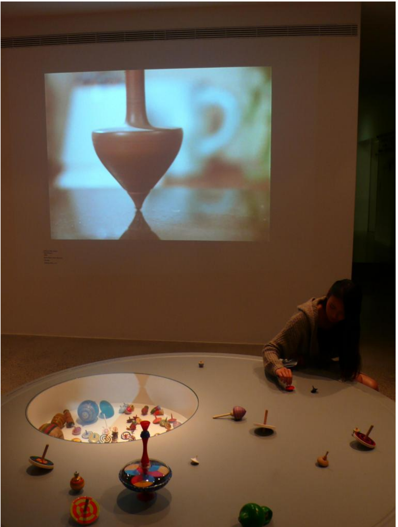
Plat parade - Proiezione e banco gioco.