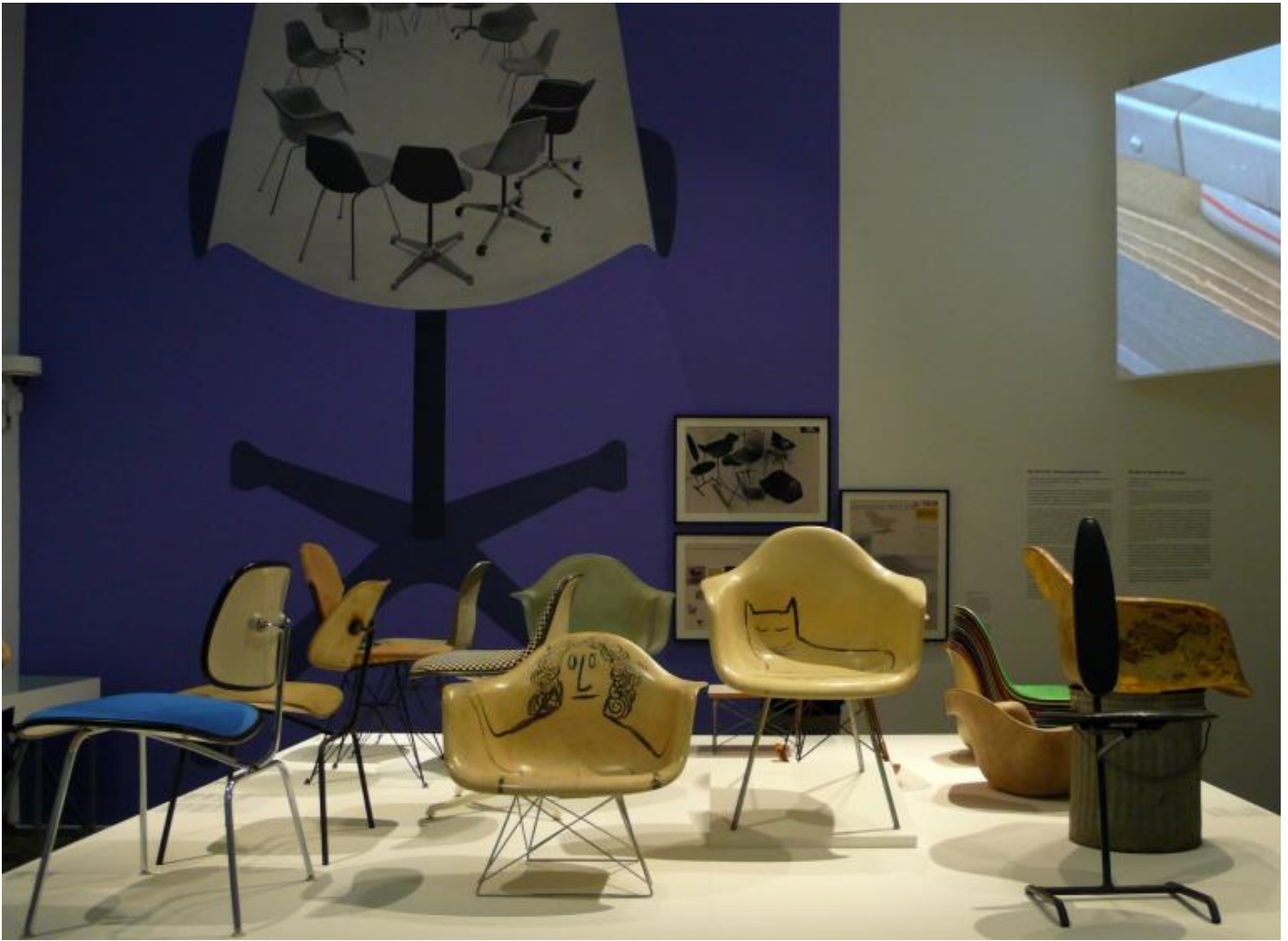
The power of design - Prototipi plastic chair con decori Saul Steinberg.