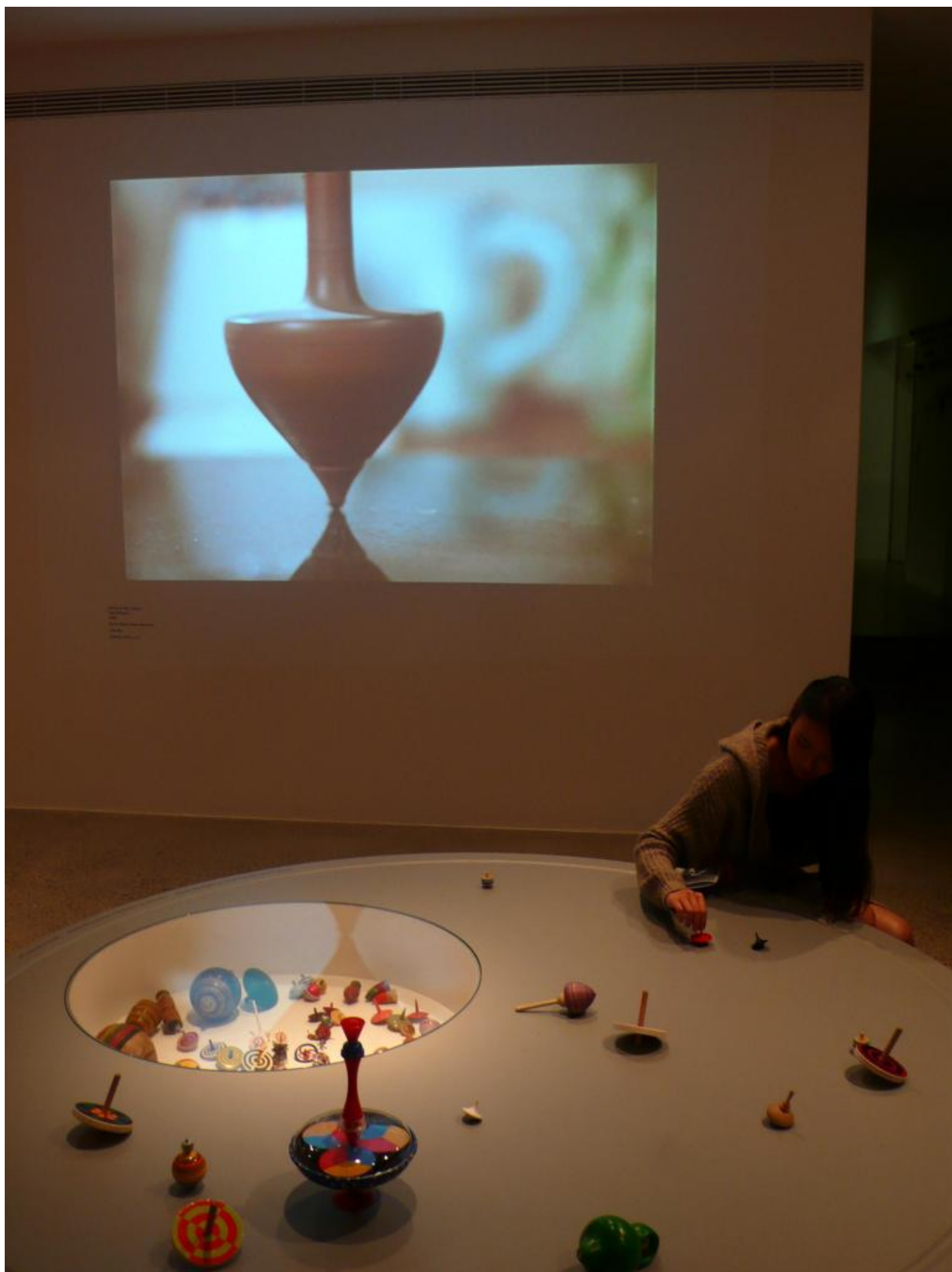
Plat parade - Proiezione e banco gioco.