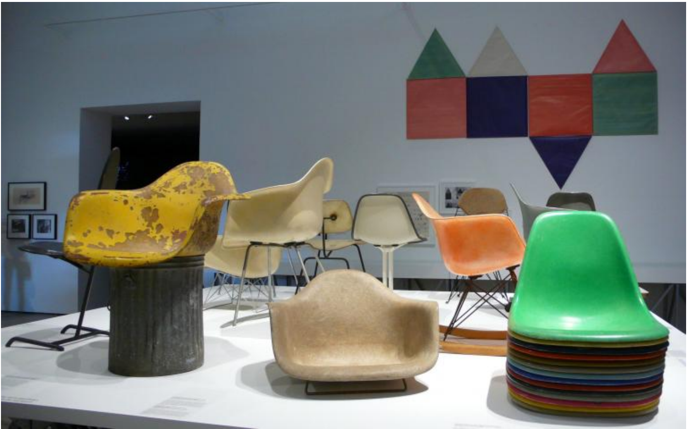
The power of design - Prototipi plastic and wire chair.

espositiva vuole valorizzare definitivamente la loro produzione filmica e l'enorme archivio di documenti mai resi disponibili prima al grande pubblico.