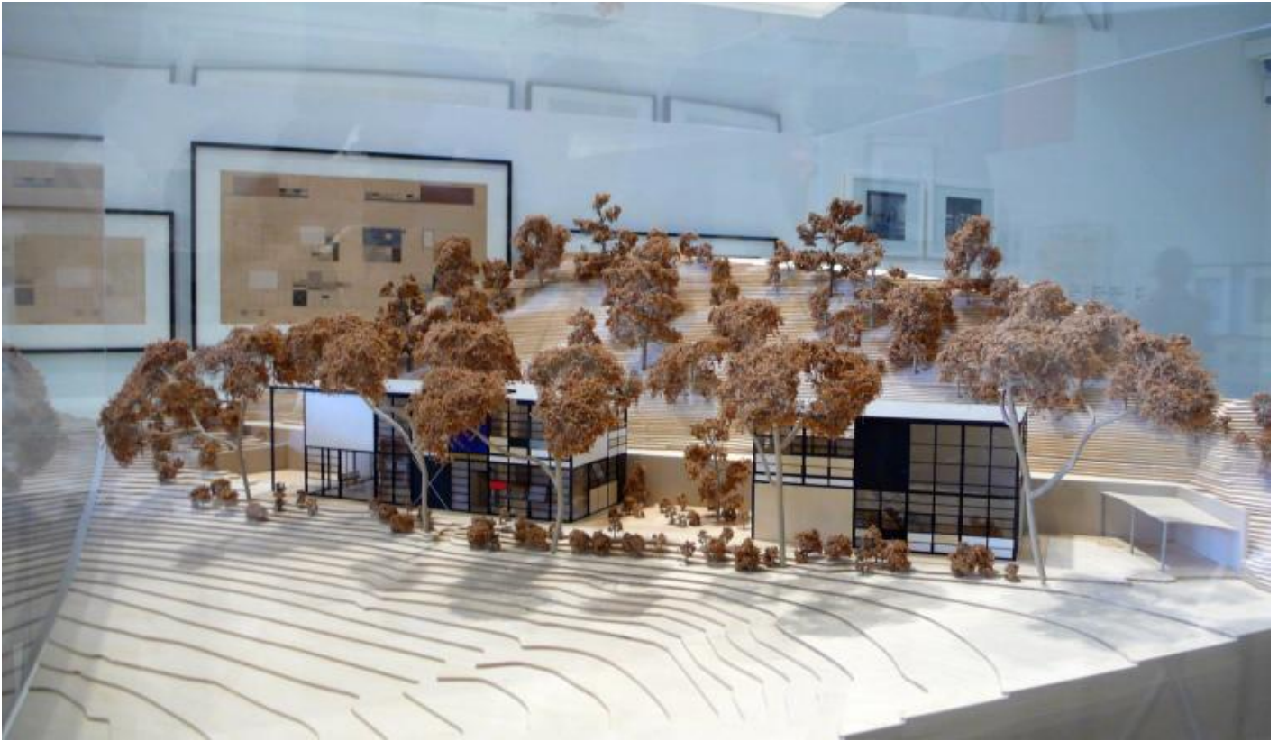
The power of design - Modello della Eames house, Santa Monica.

Procedendo si trova un approfondimento sugli allestimenti per i loro primi arredi prodotti, fino alla proposta architettonica di modelli abitativi moderni, con l'esemplare realizzazione della Case Studies House nr. 8, che è stata subito adottata da loro stessi come casa propria ed oggi è monumento di se stessa e sede della Eames Foundation.