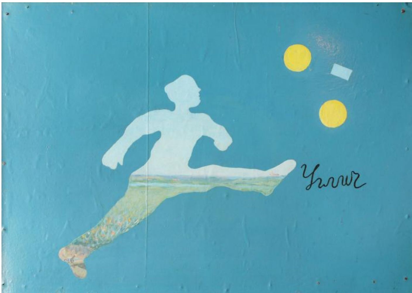
Ilya Kabakov, Soccer Player, 1964 Olio e smalto su masonite, 560 x 700 mm, Private collection © Ilya & Emilia Kabakov.

Nato nel 1933 a Dnepropetrovsk, Ilya Kabakov studia alla Scuola d'Arte di Mosca e al V.I. Surikov Art Institute dove si specializza in Graphic design e illustrazione. A metà degli anni Cinquanta inizia a lavorare come illustratore di libri per bambini e in parallelo sviluppa un discorso artistico lontano dai canoni e dalle censure imposte all'arte ufficiale dal regime.