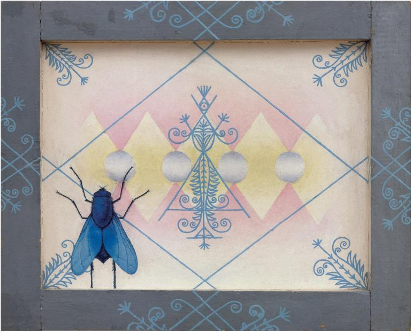
Ilya Kabakov, The Queen Fly, 1965, Olio e smalto su masonite, su legno, Oil paint and enamel on Masonite and wood, 485 x 600 x 60 mm, Private collection, Switzerland, Â© Ilya & Emilia Kabakov.

accregono il senso della manodopera di un lavoro forzato. La parola scritta mescola lâ??invenzione fantastica con la denuncia del reale: sul pannello sinistro sono elencate case, scuole, centri sportivi, cinema, biblioteche e altri servizi per i cittadini, la cui costruzione prevista entro il 25 dicembre 1979 non Ã?? ancora realizzata nel 1983, anno in cui Ã?? datato il dipinto.