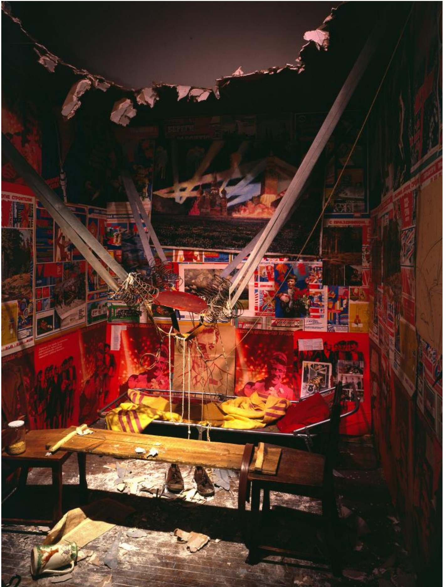
Ilya Kabakov, The Man Who Flew Into Space From His Apartment, 1985, Sei pannelli, manifesti, collage, Centre Georges Pompidou, Paris. Musée national d'art moderne/Centre de Création industrielle.