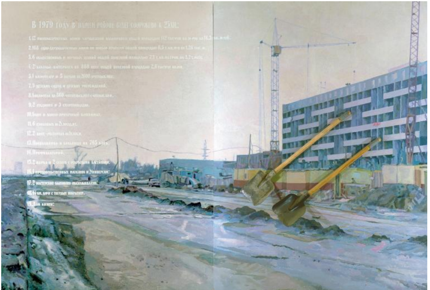
Ilya Kabakov, The Queen Fly, 1965 Olio e smalto su masonite, su legno, Oil paint and enamel on Masonite and wood, 485 x 600 x 60 mm, Private collection, Switzerland Â© Ilya & Emilia Kabakov.

lasciare per la prima volta lâ??Unione Sovietica.