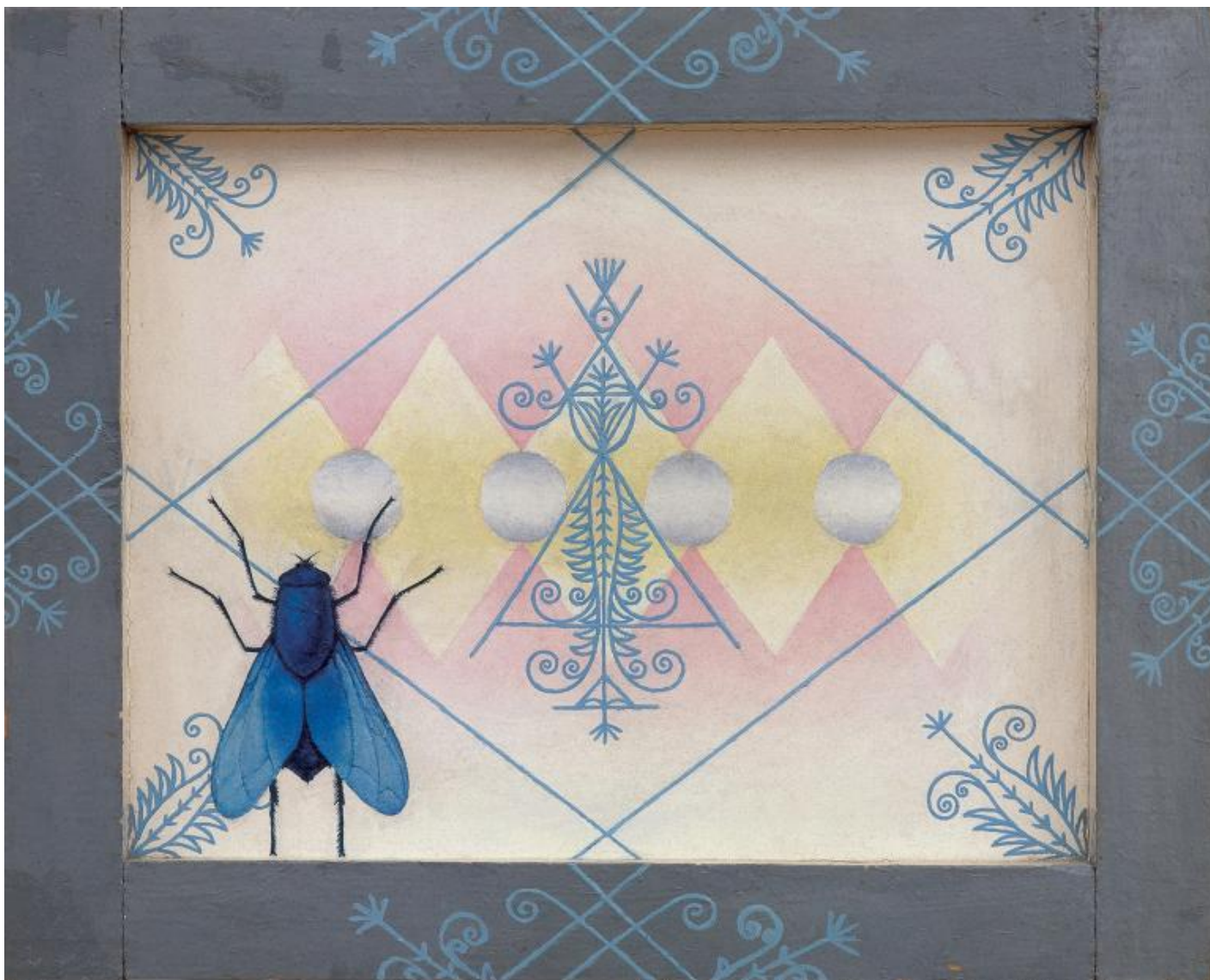
Ilya Kabakov, The Queen Fly, 1965, Olio e smalto su masonite, su legno, Oil paint and enamel on Masonite and wood, 485 x 600 x 60 mm, Private collection, Switzerland, © Ilya & Emilia Kabakov.

accregono il senso della manodopera di un lavoro forzato. La parola scritta mescola l'invenzione fantastica con la denuncia del reale: sul pannello sinistro sono elencate case, scuole, centri sportivi, cinema, biblioteche e altri servizi per i cittadini, la cui costruzione prevista entro il 25 dicembre 1979 non è ancora realizzata nel 1983, anno in cui è datato il dipinto.