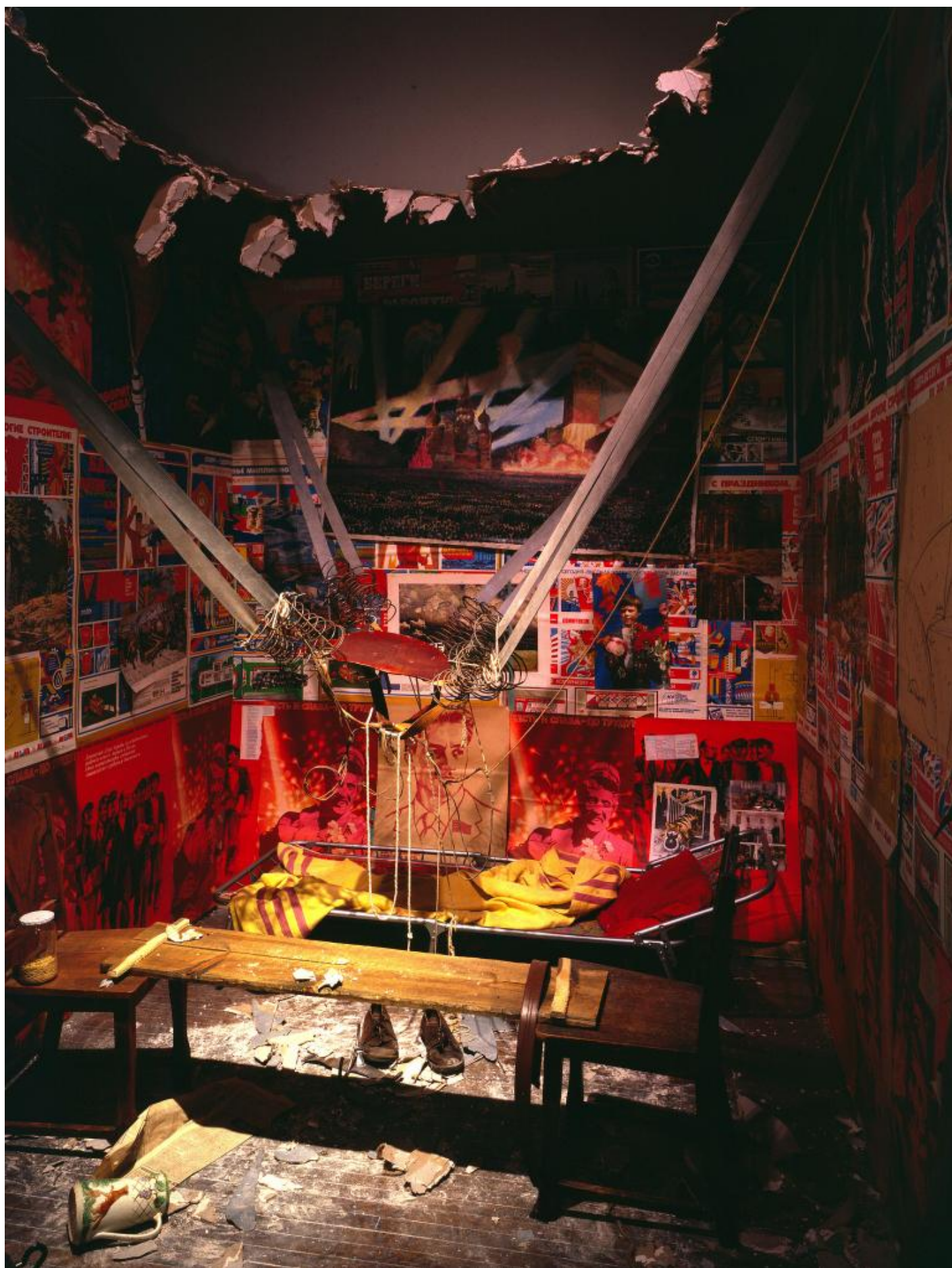
Ilya Kabakov, The Man Who Flew Into Space From His Apartment, 1985, Sei pannelli, manifesti, collage, Centre Georges Pompidou, Paris. Musée national d'art moderne/Centre de Création industrielle. Purchased