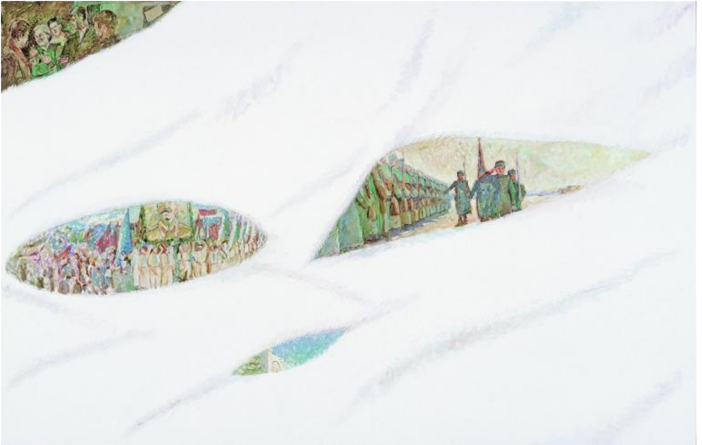
Ilya Kabakov ed Emilia Kabakov, Under the Snow #2, 2004, Olio su tela 1600 x 2490 mm, Private Collection. Courtesy Galerie Thaddaeus Ropac, London - Paris - Salzburg Photo Credit: Courtesy Biblio Fine Art © Ilya & Emilia Kabakov.

Soludukhina muore nel 1987 quando Ilya Kabakov, a 54 anni, parte per i suoi primi viaggi a Occidente e riprende la sua amicizia con Emilia Lekach Kanevski con cui inizia collaborare e che successivamente sposa nel 1992. Kate Fowl, capo curatore di Garage Museum of Contemporary Art, nel suo contributo in catalogo, racconta di avere discusso la diversità di quest'opera biografica rispetto alle installazioni dominate da personaggi inventati, e di avere chiesto a Ilya Kabakov perché abbia considerato a lungo se stesso un personaggio: «Alla fine, finché vivevo in Unione Sovietica, non sapevo chi ero. Anche quando partii, continuavo a recitare alcuni personaggi, finché Emilia mi diede la possibilità di essere chi sono».