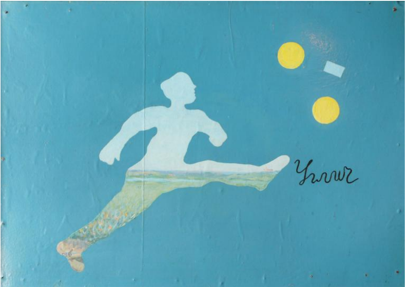
Ilya Kabakov, Soccer Player, 1964 Olio e smalto su masonite, 560 x 700 mm, Private collection © Ilya & Emilia Kabakov.

Nato nel 1933 a Dnepropetrovsk, Ilya Kabakov studia alla Scuola d'Arte di Mosca e al V.I. Surikov Art Institute dove si specializza in Graphic design e illustrazione. A metà degli anni Cinquanta inizia a lavorare come illustratore di libri per bambini e in parallelo sviluppa un discorso artistico lontano dai canoni e dalle censure imposte all'arte ufficiale dal regime.