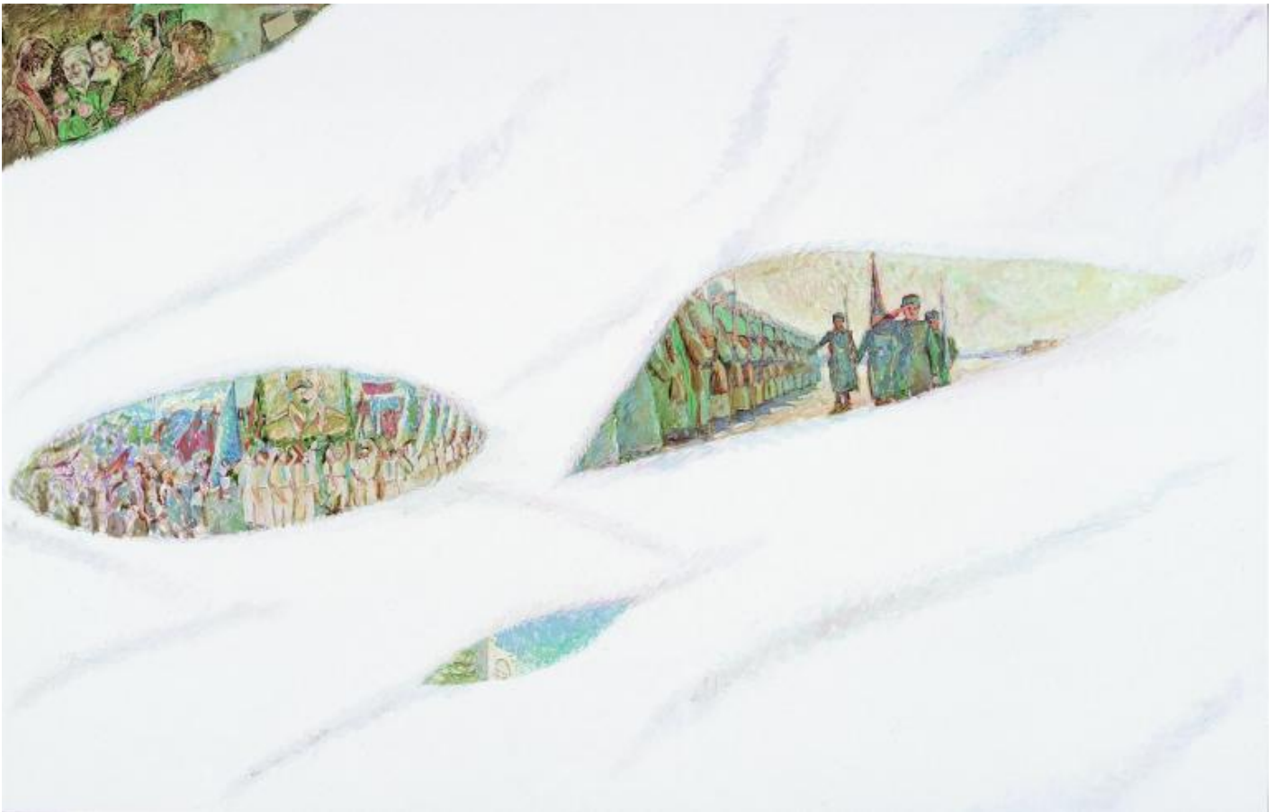
Ilya Kabakov ed Emilia Kabakov, Under the Snow #2, 2004, Olio su tela 1600 x 2490 mm, Private Collection. Courtesy Galerie Thaddaeus Ropac, London – Paris - Salzburg