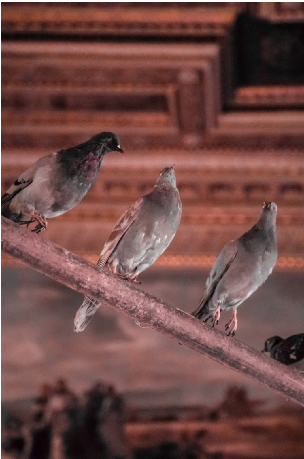
Maurizio Cattelan (Padova 1960), «Turisti», 1997, piccioni imbalsamati, dimensioni variabili, foto Delfino Sisto Legnani.

Più che giusto, allora, che all'immaginario delle periferie sia appunto dedicata la mostra che ha trovato una così simbolica cornice. Un cortocircuito esplicito, nelle parole della curatrice, illustra i Turisti di Maurizio Cattelan: una serie di piccioni, raggelati nella consueta tassidermia illusionistica, appollaiati con quieta minaccia hitchcockiana sulle opere degli altri artisti (in origine erano esposti alla Biennale del '97), nonché su marmi stucchi e pannelli dorati della Sala di Augusto (quella del Trono, cioè, di Papi e Re). «Con questa