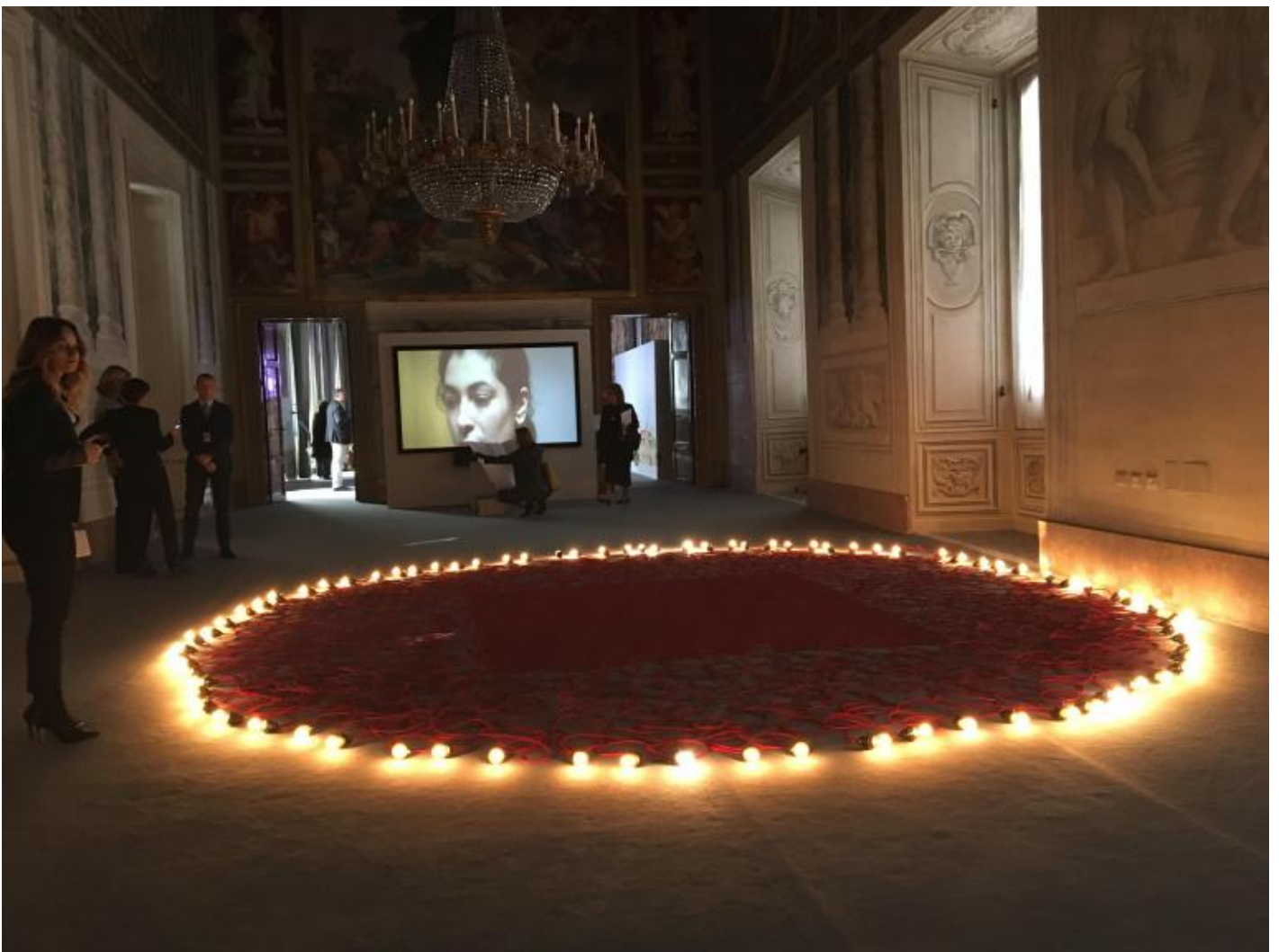
Mona Hatoum (Beirut 1962), «Undercurrent (Red)», 2008, cavo elettrico rivestito, lampadine, variatore d'intensità.

Non può mancare il tema dell'immigrazione: è nel concreto campo di battaglia delle periferie, infatti, che vengono alla prova gli stereotipi della correctness , e i non meno stucchevoli cattivismi, dello showbiz politicien . Sulla pelle delle persone reali, cioè (e dunque negli occhi, difficili da dimenticare, della siriana Rasha , microzavattinianamente “pedinata” dal video omonimo di Adrian Paci – albanese del 1969, a Milano dal 2000). Bellissimo il lavoro di Mona Hatoum (palestinese trapiantata a Londra nel '75): un tappeto dalla struttura ortogonale, composto da un intreccio di fili elettrici che, verso la “periferia” del disegno, si aggruppano in viluppi sempre più caotici, terminando in lampadine la cui luminosità cresce, e decresce, come al ritmo di un respiro vitale. Luccica pure, in rosso, la scritta al neon di Alfredo Jaar. È una frase di Gramsci: «IL VECCHIO MONDO STA MORENDO. QUELLO NUOVO TARDA A COMPARIRE. E IN QUESTO CHIAROSCURO NASCONO I MOSTRI». Questa la sigla decisiva della mostra: che vale negli anni Trenta del secolo scorso, si capisce, quanto nei nostri Dieci di ri-fascismi insorgenti.