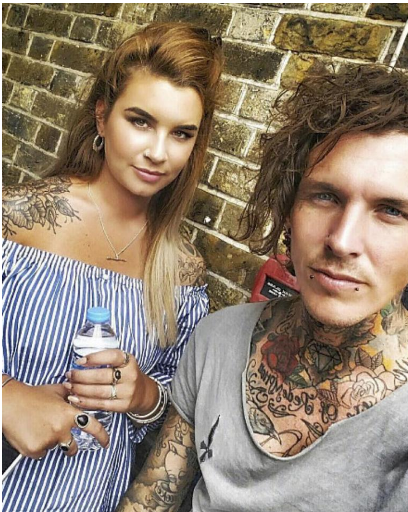
Protagonisti della trasmissione tv Tattoo Fixers.

Altro che segno maledetto d'infamia o marchio dell'eroe mitico. Se tutto è immagine, simulacro, visibilità esteriore, come si dice da troppo tempo, è