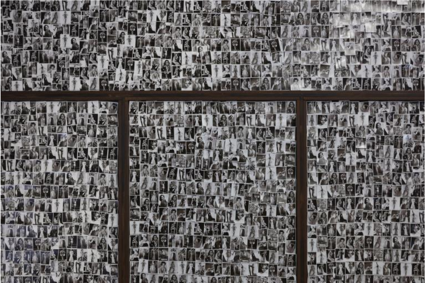
â??Take Me (Iâ??m Yours)â?•, veduta della mostra, Pirelli HangarBicocca, Milano, 2017.

La mostra Ã¨ accessibile gratuitamente , ma per interagire attivamente e poter Â«comporre la propria collezioneÂ» Ã¨ necessario acquistare qui o all'ingresso (per la cifra simbolica di â?¬ 10) una shopper di carta firmata Boltanski â?? dovrebbe essere la prima opera conquistata da portare a casa â?? che permetterÃ , altresÃ , di intervenire e modificare alcune altre opere , e in molti casi persino di appropriarsene. Il titolo Ã¨ programmatico; e in fondo, parla chiaro: Â«Prendimi (sono tuo, tua)Â».