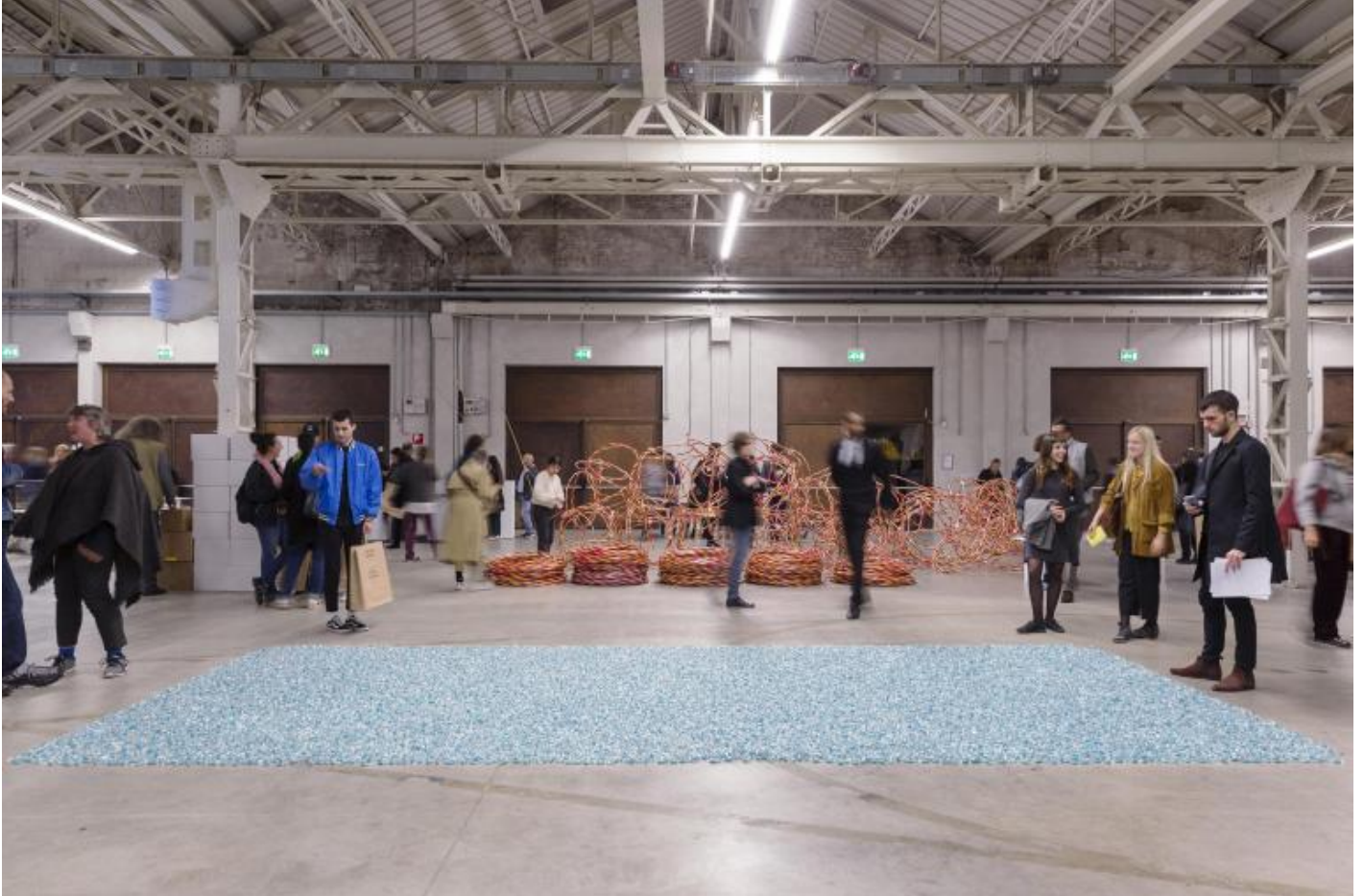
â??Take Me (Iâ??m Yours)â?•, veduta della mostra, Pirelli HangarBicocca, Milano, 2017.

restando sempre in silenzio; sembra carta velina, c'Ã© scritto Be Quiet . Si tratta della performance concepita da James Lee Byars nel 1976 ( video della performance alla Peder Lund Gallery , Oslo, 2016), che ha come riferimento l'estetica orientale, in particolare la scarna e quieta essenzialitÃ del movimento degli spettacoli NÅ del teatro giapponese lungo il XIV secolo. Non suona come un rimprovero, anzi, ha un certo potere calmante, nella frenesia dell'evento: costringe a fermarsi un momento, incontrare lo sguardo di un'alteritÃ , riconoscere, ancora una volta, la benedizione dell'incontro.