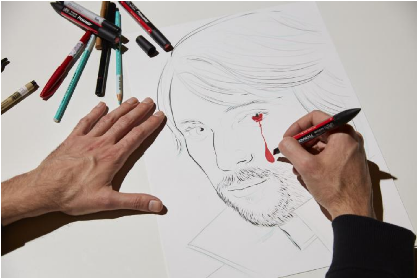
«Take Me (Iâ??m Yours)», veduta della mostra, Pirelli HangarBicocca, Milano, 2017.

Superando la soglia della Sequenza , opera ambientale di Fausto Melotti mi appare sempre maestosa, e magnifica con ogni condizione atmosferica e di luce ed entrando cosÃ¬ nell'atrio dell'Hangar, si ha subito accesso al giardino dei desideri di Yoko Ono : due Wish Trees piante di limone Madernino attendono di essere incoronate da desideri, sogni, pensieri, goliardÃ¬e e disegni dei visitatori. Nell'incertezza, l'artista offre indicazioni e mette a disposizione penne, cartoncini e cordoncini per annodarli alla chioma verde, speranza . Dopo la chiusura dell'esposizione, ogni biglietto sarÃ¬ raccolto da Mother Superior e prontamente conservato insieme a un milione d'altri (e piÃ¹), sotterrati insieme sotto l' Imagine Peace Tower creata proprio da Yoko a ReykjavÃ¬k.