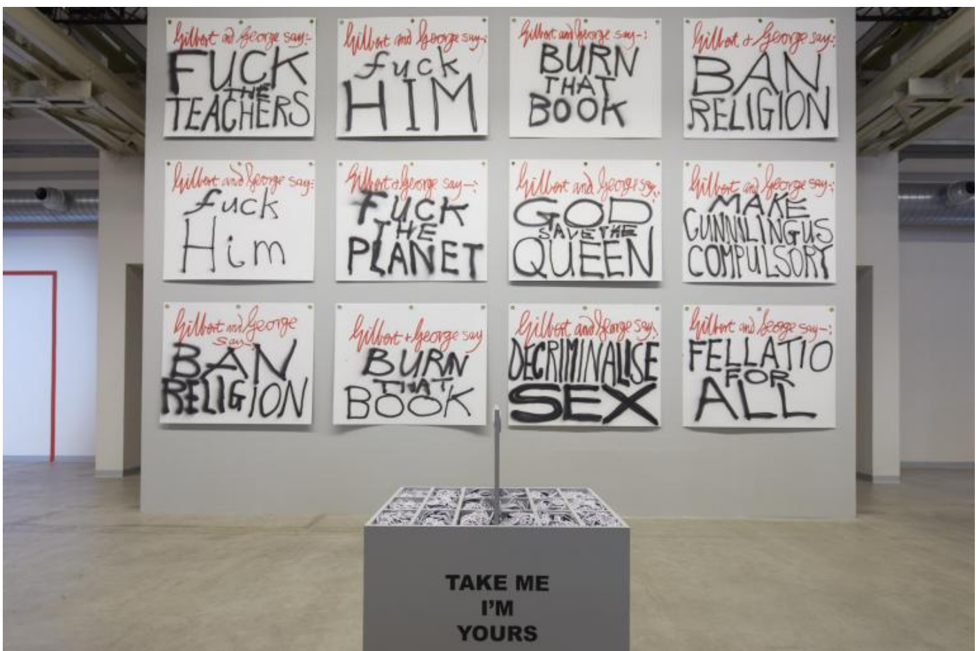
“Take Me (I’m Yours)”, veduta della mostra, Pirelli HangarBicocca, Milano, 2017.

Non sono forse le esperienze che facciamo, come le viviamo, a renderci quello che siamo?