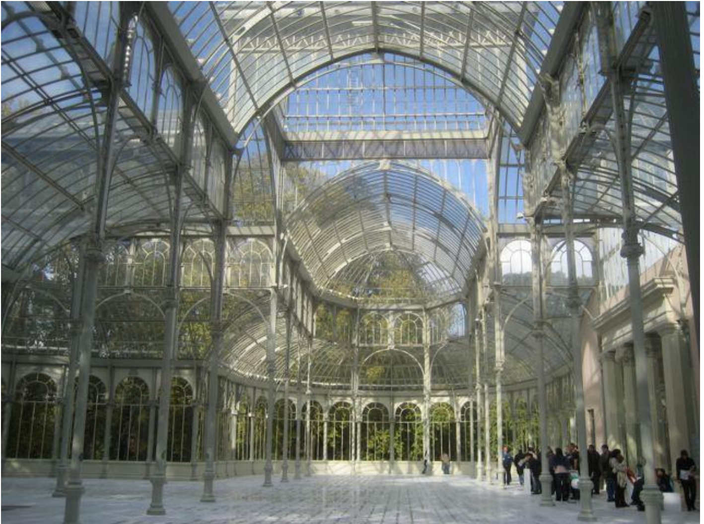
Madrid, Palacio de Cristal.

della Tempesta di Shakespeare – «Nothing of him that doth fade, / But doth suffer a sea change, / Into something rich and strange» –, ma sul suo destino pare impossibilmente riflettere, prima di poterlo conoscere, l'epitaffio dettato per sé dall'altro poeta, Keats: «Here lies One Whose Name was writ in Water». La sua lapide è ritta a perpendicolo sull'erba, mentre orizzontale si stende su di essa quella di Shelley.