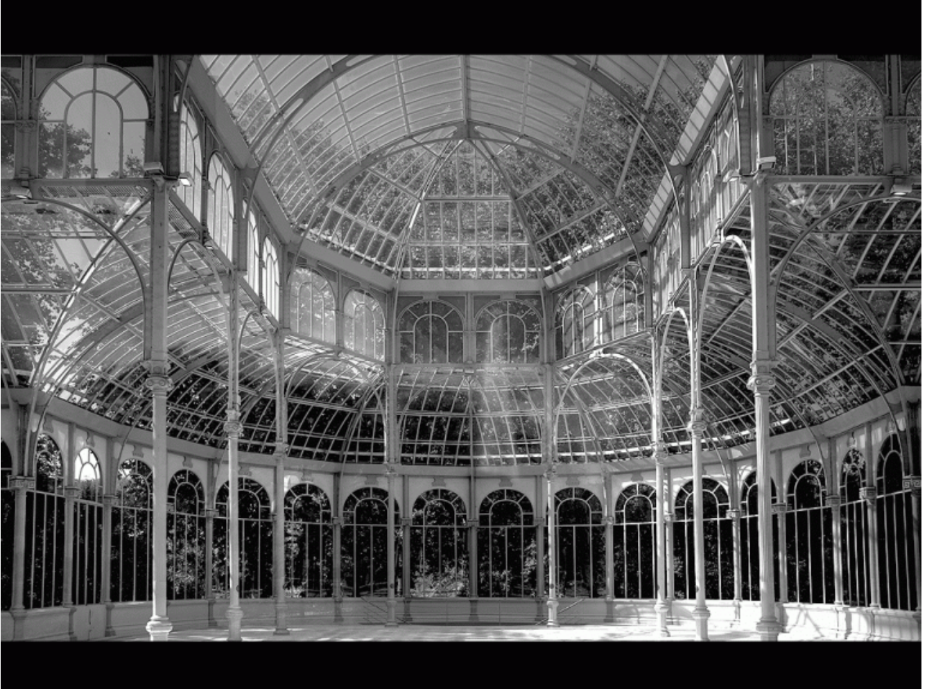
Crystal Palace, London, interno.

l'opera di Salcedo, non è dissimile dal funzionamento dei meccanismi della memoria e del riconoscimento).