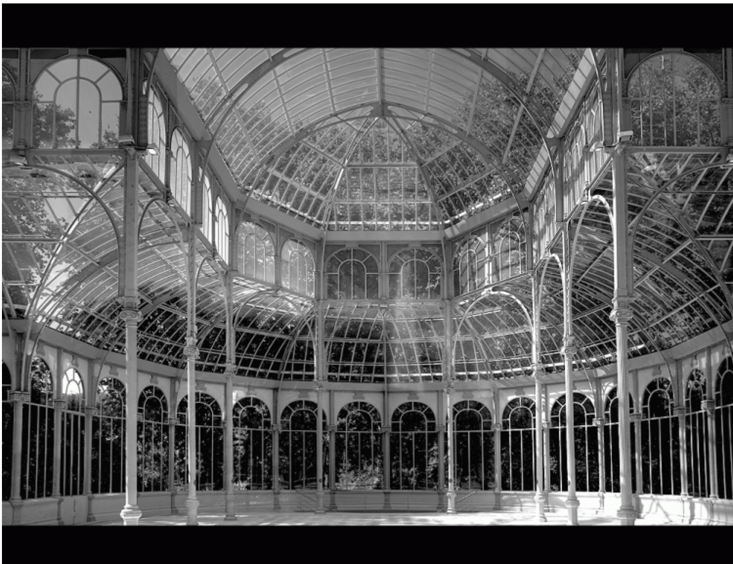
Crystal Palace, London, interno.