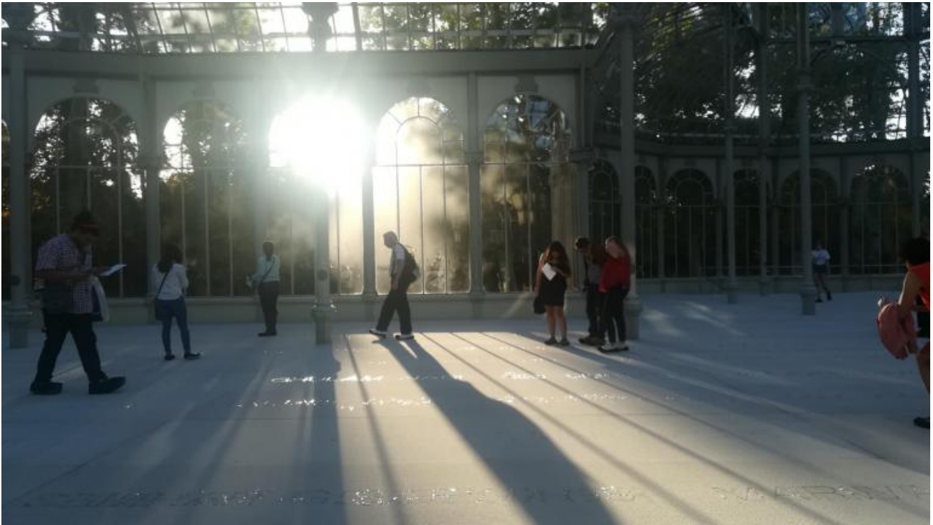
Doris Salcedo, Palimpsesto.