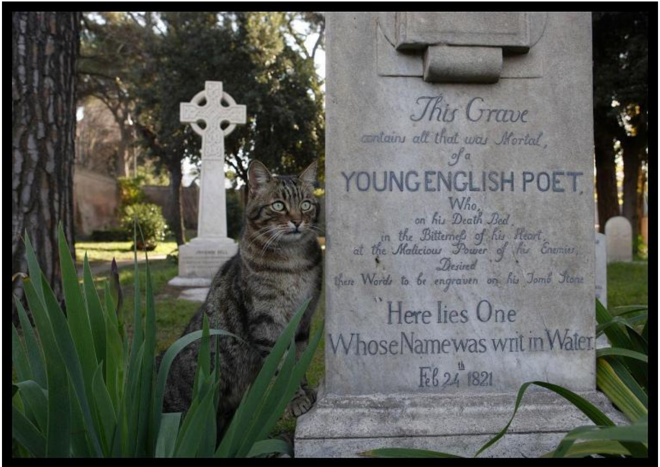
Tomba di Keats, Cimitero Acattolico, Roma.

Come ognuno sa, John Keats e Percy Bysshe Shelley sono sepolti a pochi metri di distanza l'uno dall'altro, in una valletta di dolce verdezza al Cimitero Acattolico di Roma: all'ombra della Piramide Cestia, non lontani da Gramsci, Gadda e Amelia Rosselli. Vicini pure morirono, nel tempo più che nello spazio: men che trentenni entrambi, tra il febbraio del 1821 e il luglio del 1822. Il primo a Roma, di tisi; il secondo al largo di Portovenere, in quello poi ribattezzato Golfo dei Poeti, nel