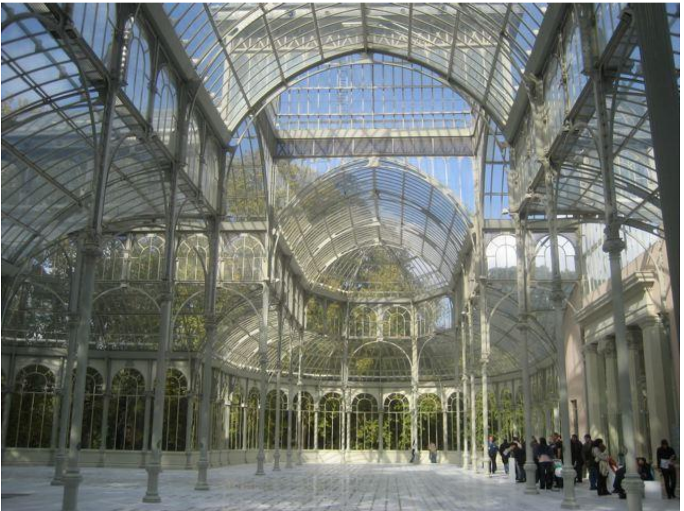
Madrid, Palacio de Cristal.

naufragio della goletta Ariel . Le rispettive lapidi (riportate, fra l'altro, nel bellissimo Tumbas di Cees Nooteboom, un paio d'anni fa tradotto da Fulvio Ferrari per Iperborea ) paiono dialogare fra loro. Quella di Shelley, memore del naviglio fatale, riporta i versi celebri della Tempesta di Shakespeare - «Nothing of him that doth fade, / But doth suffer a sea change, / Into something rich and strange» -, ma sul suo destino pare impossibilmente riflettere, prima di poterlo conoscere, l'epitaffio dettato per sé dall'altro poeta, Keats: «Here lies One Whose Name was writ in Water». La sua lapide è ritta a perpendicolo sull'erba, mentre orizzontale si stende su di essa quella di Shelley.