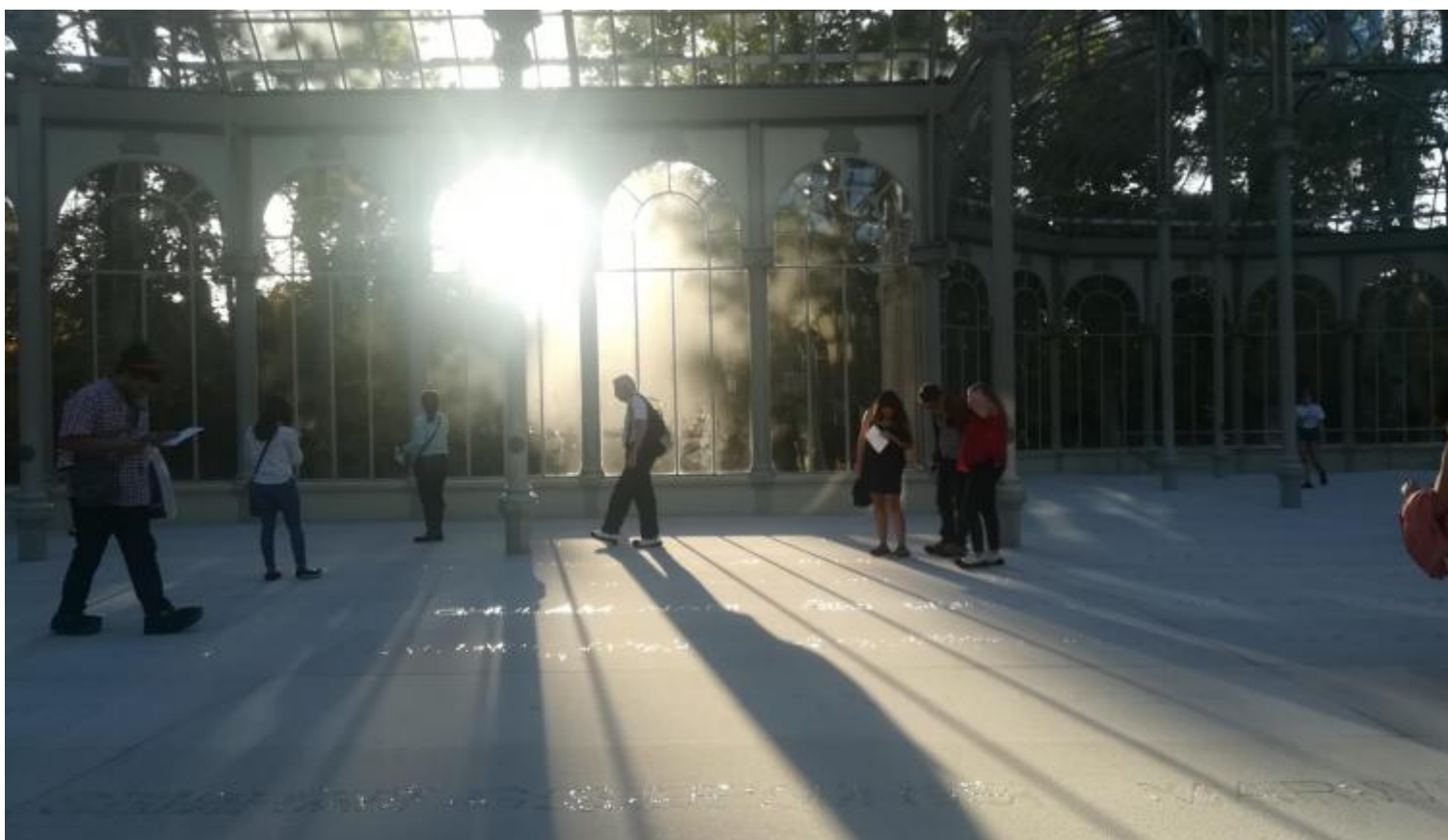
Doris Salcedo, Palimpsesto.