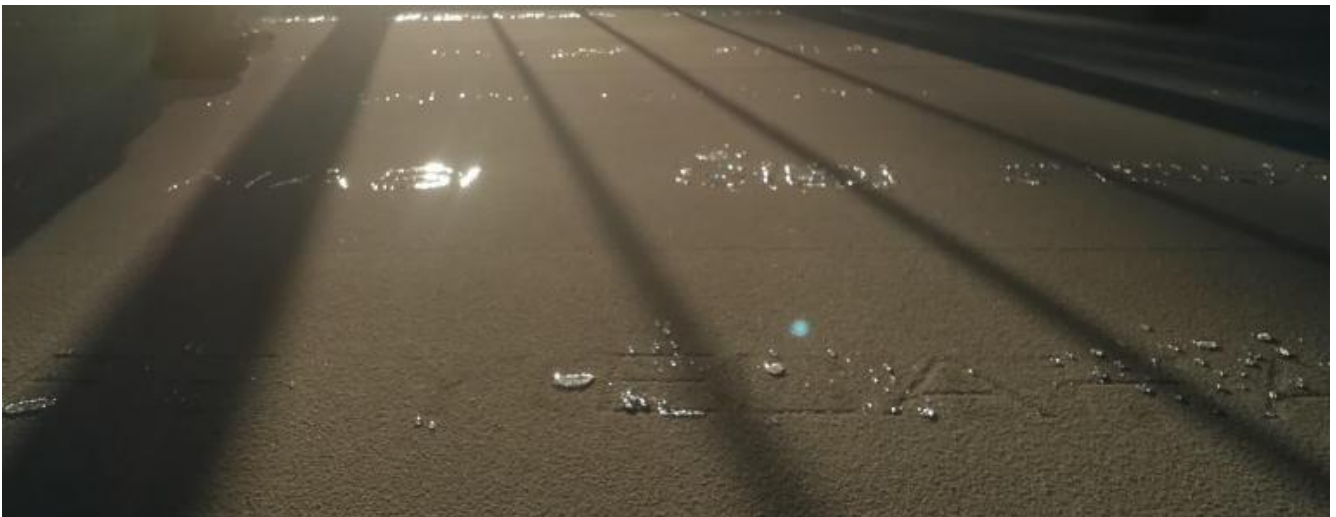
Doris Salcedo, Palimpsesto.

realtà, non c'è scritto nessun nome. Mentre di nomi, essenzialmente, consiste appunto l'opera dell'artista colombiana: nomi non scritti sull'acqua , e dunque destinati subito a svanire, ma (come pure si potrebbe tradurre la frase dettata dal poeta) con l'acqua . Alla lettera. Quando mi avvicino alla struttura efflorescente di vetro e metallo, incastonata fra i cipressi calvi e gli ippocastani del parco, e il laghetto artificiale antistante colla sua fontana a getto, il Palazzo di Cristallo sembra del tutto vuoto. Ma quando abbasso lo sguardo ai miei piedi mi accorgo che su un tappeto granulare di colore grigio, steso uniformemente sull'intera superficie circoscritta dalle pareti trasparenti, pian piano si vanno addensando macchie di umidità che, dopo qualche minuto, diventano lettere davvero fatte d'acqua; e queste lettere compongono dei nomi di persone. Persone morte in mare, nel Mediterraneo, nel tentativo di salvare la propria vita dalla guerra e dalla fame. Passa qualche altro minuto, l'acqua pare riassorbita dal "terreno", poi lentamente si formano di nuovo delle lettere. Altri nomi. Gli uni si sovrappongono al ricordo recente di quelli che li hanno preceduti. Un palimpsesto appunto.