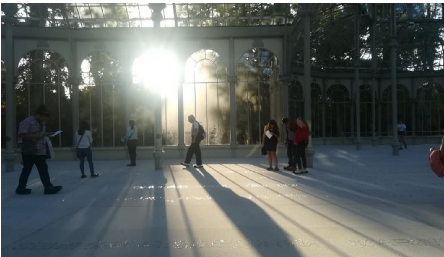
Doris Salcedo, Palinsesto.