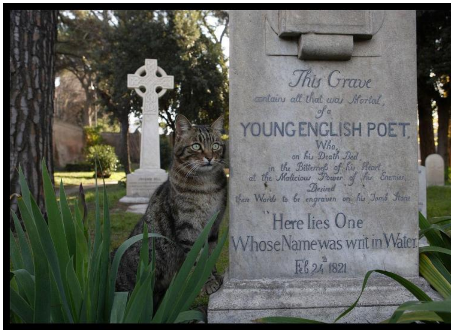
Tomba di Keats, Cimitero Acattolico, Roma.

Come ognuno sa, John Keats e Percy Bysshe Shelley sono sepolti a pochi metri di distanza l'uno dall'altro, in una valletta di dolce verdezza al Cimitero Acattolico di Roma: all'ombra della Piramide Cestia, non lontani da Gramsci, Gadda e Amelia Rosselli. Vicini pure morirono, nel tempo più che nello spazio: men che trentenni entrambi, tra il febbraio del 1821 e il luglio del 1822. Il primo a Roma, di tisi; il secondo al largo di Portovenere, in quello poi ribattezzato Golfo dei Poeti, nel naufragio della goletta Ariel . Le rispettive lapidi (riportate, fra l'altro, nel bellissimo Tumbas di Cees Nooteboom , un paio d'anni fa tradotto da Fulvio Ferrari per Iperborea ) paiono dialogare fra loro. Quella di Shelley, memore del naviglio fatale, riporta i versi celebri