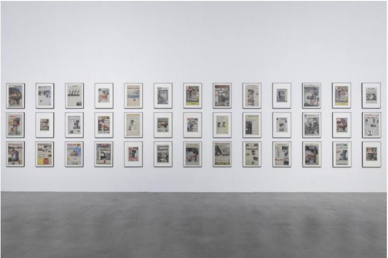
Hans-Peter Feldmann, 9/12 Frontpage, 2001 Installazione, 151 quotidiani 60 x 40 / 64 x 46,5 cm Collezione Fondazione Sandretto Re Rebaudengo, Torino.

Più audace la selezione proposta dalla Fondazione Sandretto Re Rebaudengo, che celebra il suo venticinquesimo anno di attività e offre un altro spaccato della dimensione collezionistica e del mecenatismo. La continuità tra passato e presente prende la forma di una mostra che apre al conflitto e dalla spiccata dimensione politica. In mostra si alternano grandi nomi del contemporaneo e tra le opere spicca il guizzo inimitabile di Maurizio Cattelan che apre il percorso con Christmas '95 , opera contenuta nelle dimensioni ma fulminante: si tratta di una stella cometa realizzata con un tubo di neon rosso che riprende il simbolo della stella a cinque punte delle brigate rosse, demistificandola e riducendola alla stregua di una insegna da bar. Da lì il percorso conduce attraverso un percorso non accomodante, nel quale si incontra Ingrowth (2009) di Thomas Hirshorn, un disturbante compendio della violenza che quotidianamente i media offrono in pasto al pubblico, qui chiamato in causa con una assunzione di responsabilità dello sguardo. Anche Hans-Peter Feldmann affronta il tema della relazione tra reale e media con l'installazione 9/12 Frontpage (2001), formata da centocinquanta prime pagine di quotidiani, costruite come una serie. Sono poi