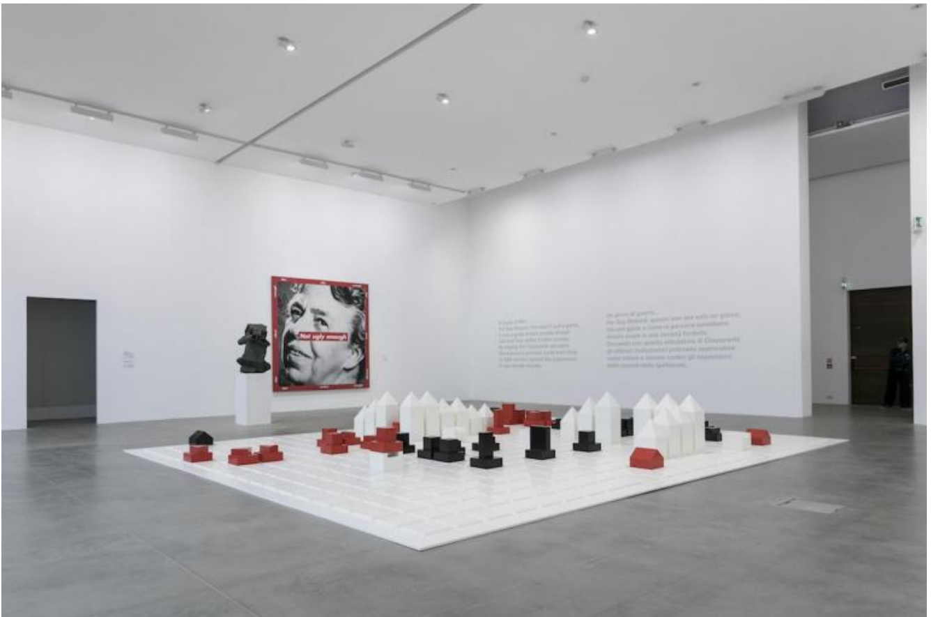
Liam Gillick A Game of War Structure, 2011 Alluminio verniciato a polvere (tavolo), alluminio zigrinato, sabbciato, colorato e anodizzato (pedine) Tavolo 255 x 225 x 100 cm, 32 pedine di dimensioni variabili Esther Schipper, Berlino.

Il titolo scelto per la mostra rimanda all'idea del collezionismo, attorno alla quale è stato costruito l'intero progetto: in prima istanza forse può apparire come un volo fantastico ma l'immagine della falena che viene attirata dalla fiamma rappresenta con efficacia quel richiamo irresistibile che l'opera d'arte esercita nei confronti del collezionista. Al contempo, racconta anche della ricerca inesausta, una domanda destinata a rimanere senza risposta, quell'eterno tentativo di interrogare il mistero che si esplica nella relazione elettiva che lega l'artista alla propria opera. Dal punto di vista filologico, il titolo della mostra è tratto dall'opera di Cerith Wyn Evan In girum imus nocte et consumimur igni che, a sua volta, riprende l'ultimo film realizzato da Guy Debord nel 1978: si tratta di un palindromo, una frase attribuita a Virgilio e che significa "giriamo in tondo di notte, consumati dalle fiamme". Il richiamo al collezionismo e alla storia artistica della città si ricollega anche nell'anniversario della nascita dell'Internazionale Situazionista, fondata ad Alba sessant'anni fa proprio dal filosofo francese, autore del testo ormai biblico La società dello spettacolo .