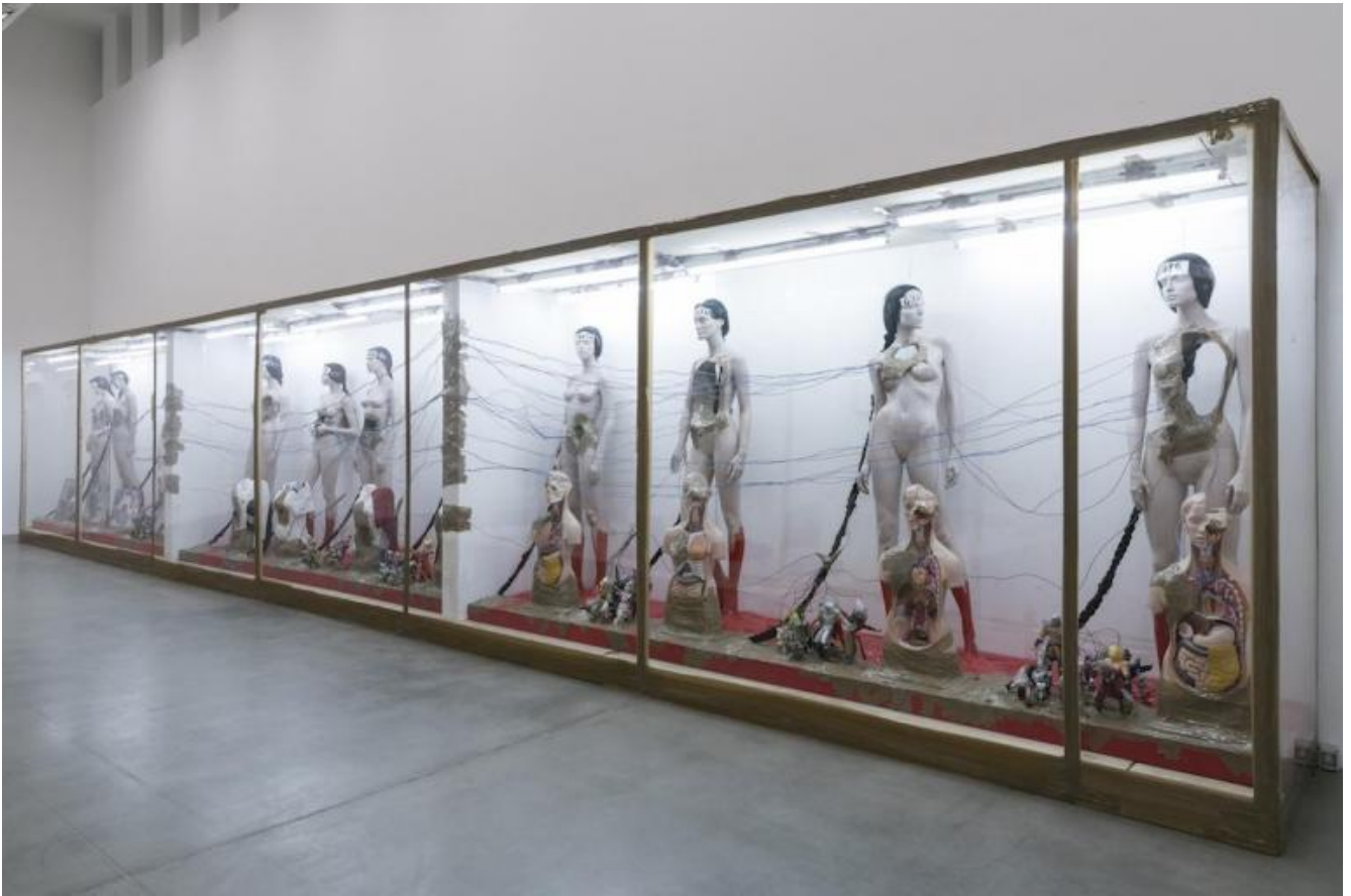
Thomas Hirschhorn, Ingrowth, 2009 Legno, neon, plexiglass, manichini, pittura, cavi elettrici, stampe, nastro adesivo, tessuto, vestiti, giocattoli 1500 x 100 x 236 cm Collezione Fondazione Sandretto Re Rebaudengo, Torino.