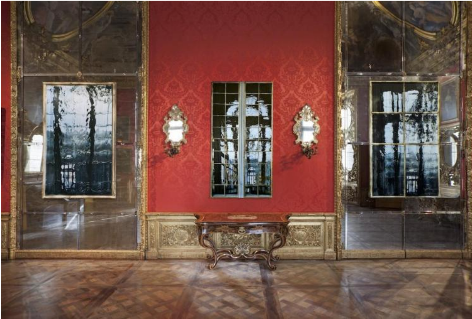
Uno, trentasei e sei, 2017 fotografia stampata su raso trittico, immagine a sinistra 225 x 140 cm immagine al centro 225 x 118 cm immagine a destra 225 x 134 cm.

invito a osservare. Di formazione scultorea, l'artista conserva un interesse spiccato per il "display" e la relazione che l'oggetto instaura con lo spazio. Passando dal linguaggio plastico a quello fotografico, mantiene viva l'attenzione per ciò che comporta l'installazione e le dinamiche generate dalla presenza della foto intesa come oggetto, nella sua realtà fenomenica, e non come strumento di narrazione. Intenzione pienamente espressa anche nel progetto site specific voluto per Palazzo Madama, che condensa in sé una serie di temi cari all'artista.