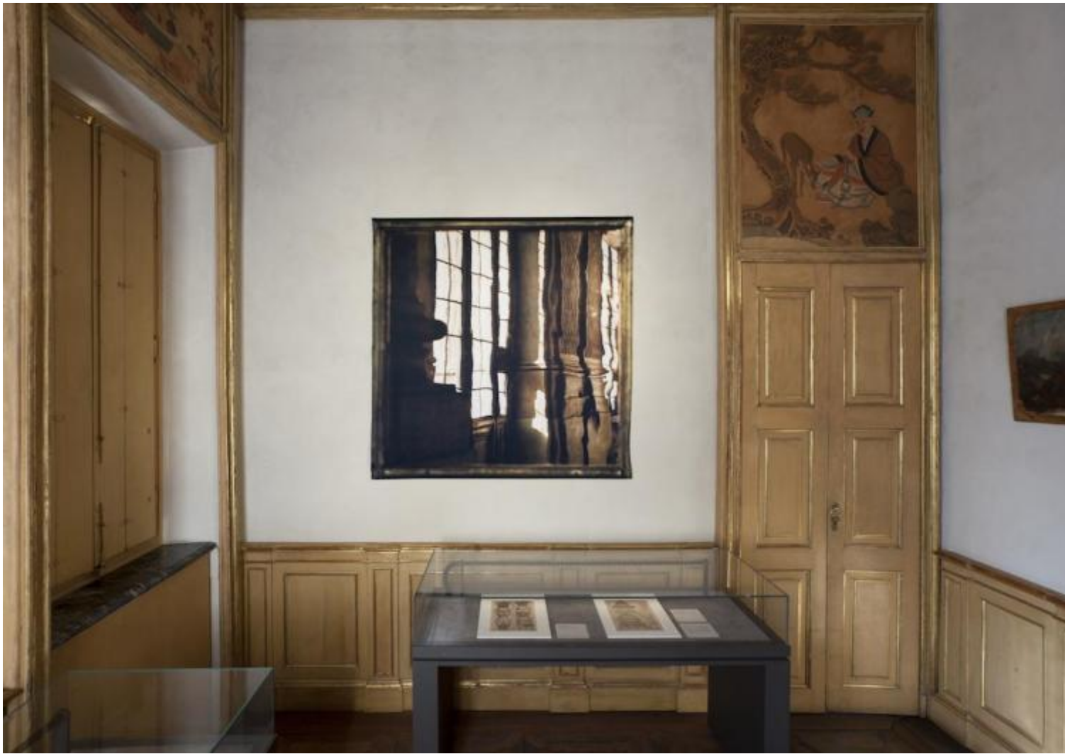
Through the single glass, 2017 fotografia stampata su raso 140 x 140 cm.

movimento, in una perenne condizione di indeterminatezza che l'occhio cerca di combattere, come se per propria natura necessitasse di una certezza della forma in cui acquietarsi. L'artista però non sembra interessata ad affermare uno statuto degli enti definitivo: sebbene la sua ricerca si manifesti attraverso un registro estetico, si avverte una inquietudine delle cose che contagia lo spettatore e lo induce ad indagare, cercando delle coordinate per comprendere l'attestazione dei piani di realtà e finzione. Si tratta di un tentativo destinato a fallire, perché malgrado le immagini create da Sighicelli non siano mendaci, tuttavia sono volutamente ambigue e elusive. Anche in Through the Single Glass (2017), nella Piccola Guardaroba, e Gyproc Habito Forte 5979 (2017), collocata nel Gabinetto Cinese, benché il supporto della tela venga sostituito dal cartongesso e la stampa venga ripresa dall'artista che sovradipinge la foto con vernici opalescenti, il gioco di mascheramento prosegue.