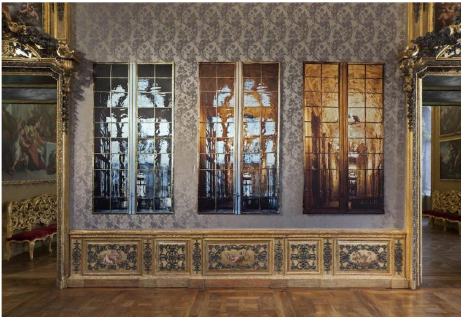
Riflettente trasparente, 2017 fotografia stampata su raso triptych, each photograph 246 x 135 cm.