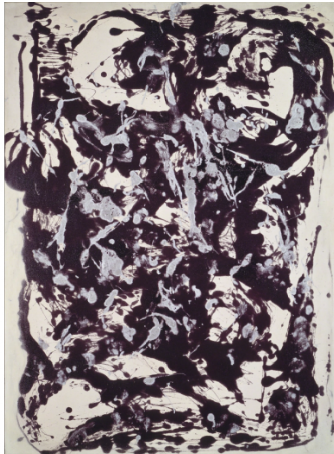
Pollock, Brown and Silver.

Da questa modesta e imperfetta analisi, potremmo derivare un ultimo spunto teorico. Siamo normalmente propensi a considerare il silenzio, la solitudine e il vuoto come realtà negative, ovvero a considerarle come condizioni di debolezza ed assenza di vitalità. Chi sta in silenzio è perché non è capace di parlare, il solitario consiste in chi non ha saputo procurarsi amori e amicizie, chi si è svuotato è colui che ha rinunciato all'incessante soddisfazione dei propri desideri. Il corrispettivo emotivo di questo atteggiamento mentale è condensato nella dicitura "orrore del vuoto", horror vacui : la paura di trovarsi improvvisamente circondato dal nulla. L'artista minimale ed essenziale che lavora a teatro ci suggerisce, però, che può esistere anche una sorta di positivo amor vacui . Silenzio, solitudine, vuoto sono concetti-limite che indicano spazi o condizioni poetiche in cui, proprio perché non c'è o non accade "nulla", allora si può dare manifestazione e movimento a qualunque cosa. Nella pienezza, può accadere solo quello che già c'è. Nel vuoto, può aver luogo l'inedito e l'imprevisto.