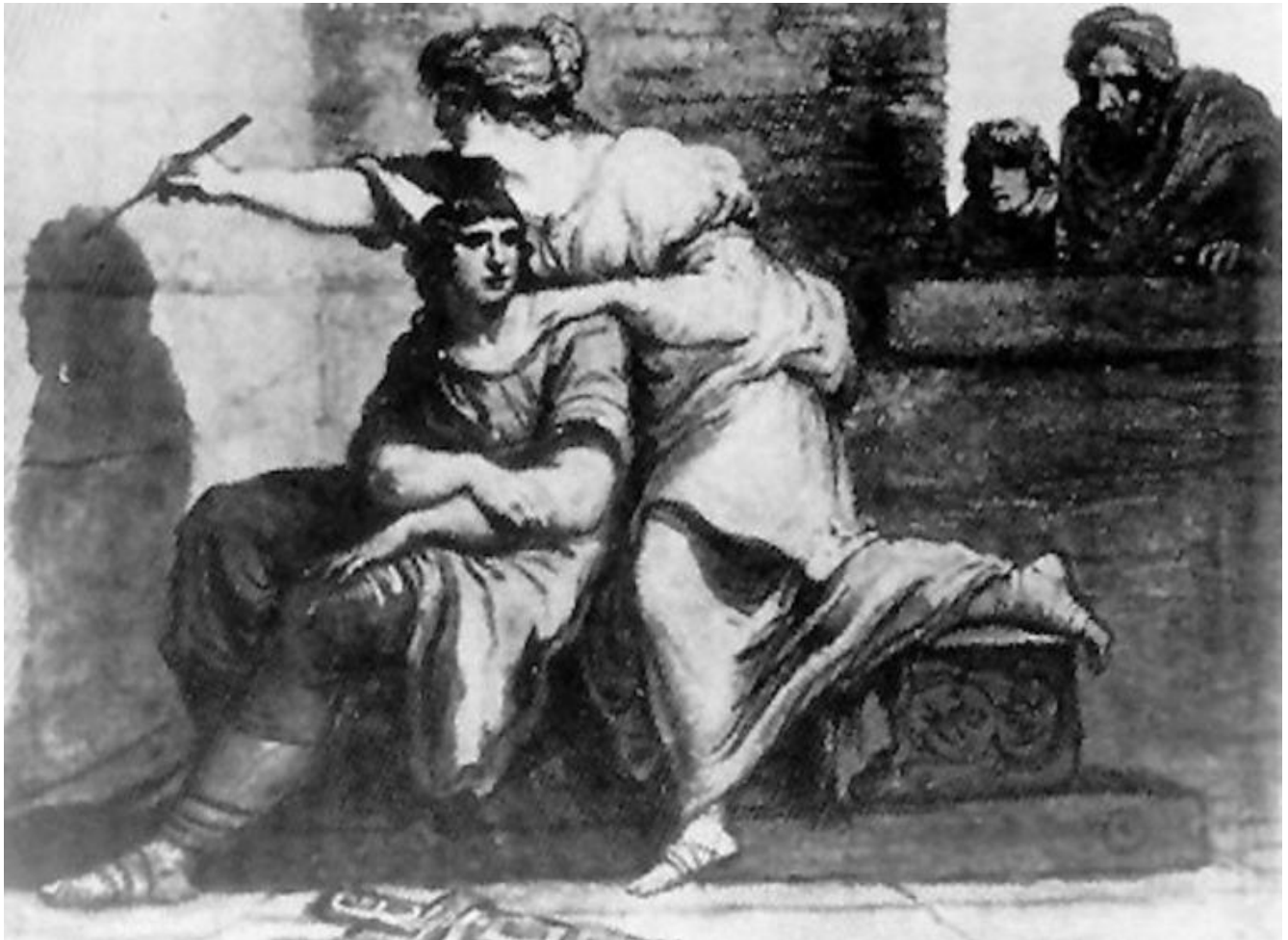
Giani, La fanciulla di Corinto .

conosce ed è normalmente, almeno per qualche secondo, allo sguardo e all'udito del pubblico convenuto. Per tali attori o attrici, il proverbio menzionato da Eraclito per attaccare i presenti-assenti andrebbe a sua volta adattato, stavolta per sostenere che la loro ricerca di questa "assenza" è in realtà una segreta forma di "presenza". Infatti, facendo il vuoto intorno a sé e al proprio povero "io", evocano visioni interessanti e profonde, che trattengono la nostra attenzione sulla scena. Di loro si dovrebbe insomma dire: «Assenti, essi sono presenti».