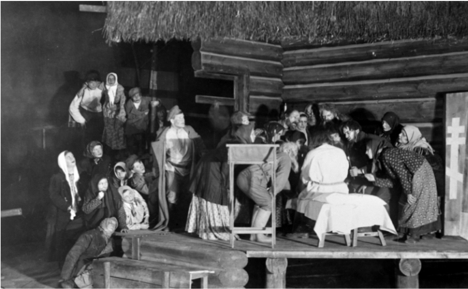
Scena dello spettacolo Virineja (1925).