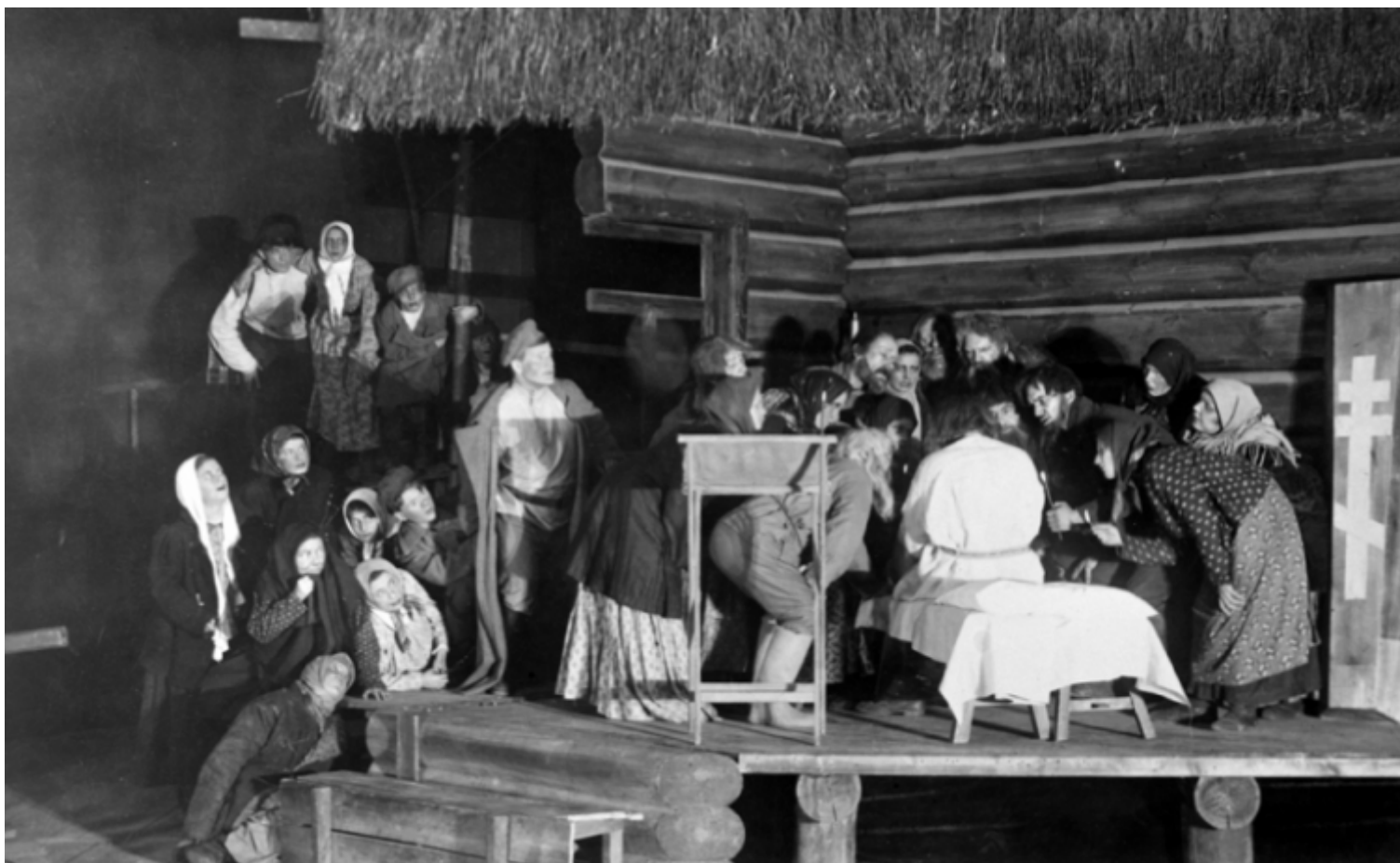
Scena dello spettacolo Virineja (1925).