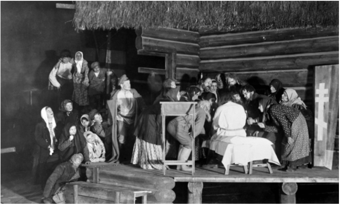
Scena dello spettacolo Virineja (1925).