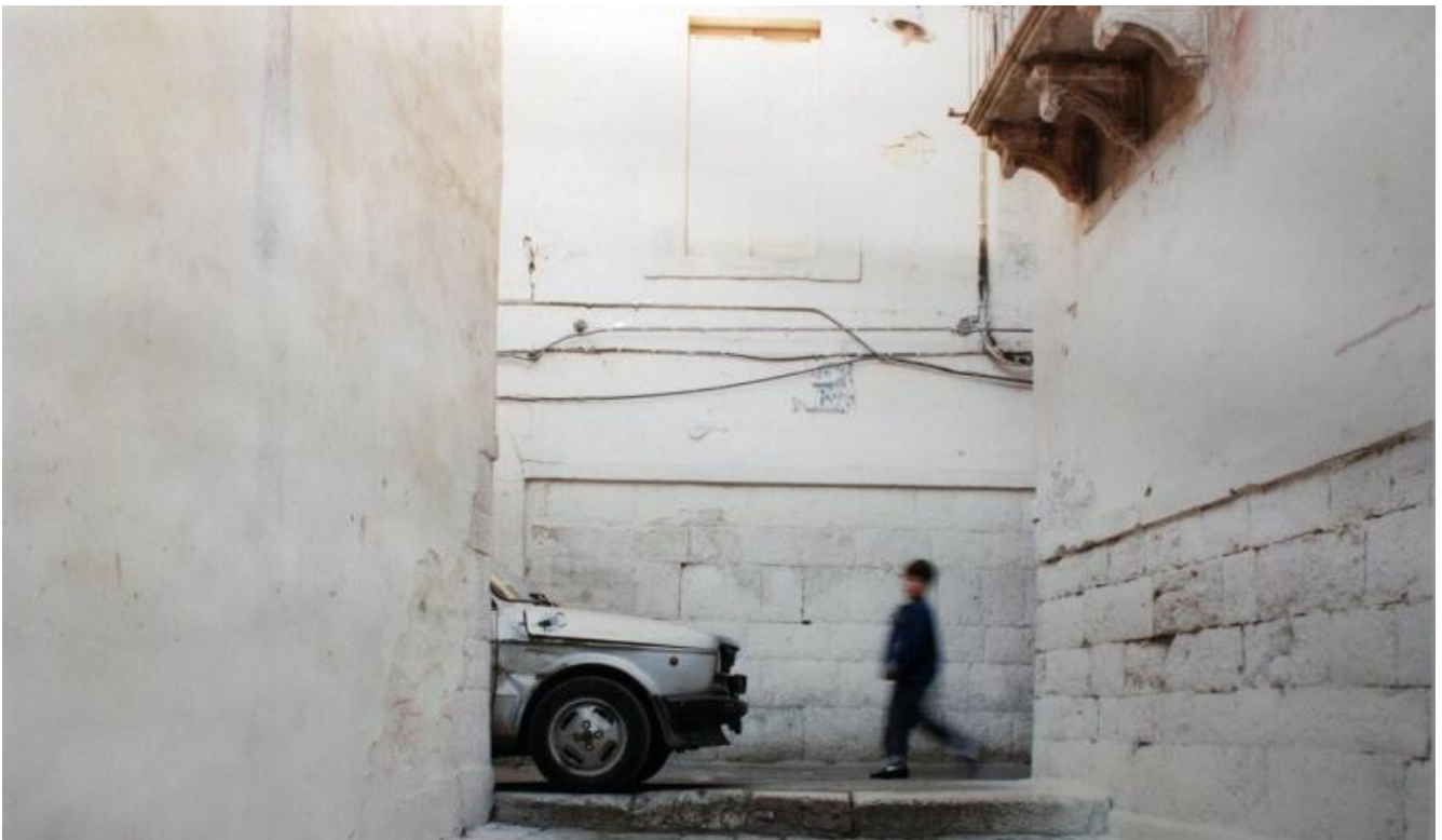
Ph Luigi Ghirri.

Il volume di Taramelli ha il merito di ripartire dal circolo di artisti modenesi che sono stati per Ghirri un momento fondamentale della sua formazione, da cui ha appreso alcuni stilemi della neoavanguardia di quegli anni, ma volgendoli verso un aspetto più sentimentale ed empatico di quanto lo stile ideologico e artistico dell'epoca sembra suggerire, se non proprio imporre. In Parmiggiani e Della Casa, artisti assai diversi tra loro, c'è un atteggiamento concettuale simile, che tuttavia li ha portati a esiti differenti: l'ironia mozartiana tutta leggerezza in Della Casa e la ricerca di un sacro laicizzato, isola dell'Assoluto, in Parmiggiani. L'impronta è però comune, e questa, anche attraverso l'ironico Guerzoni, si è trasmessa al fotografo emiliano.