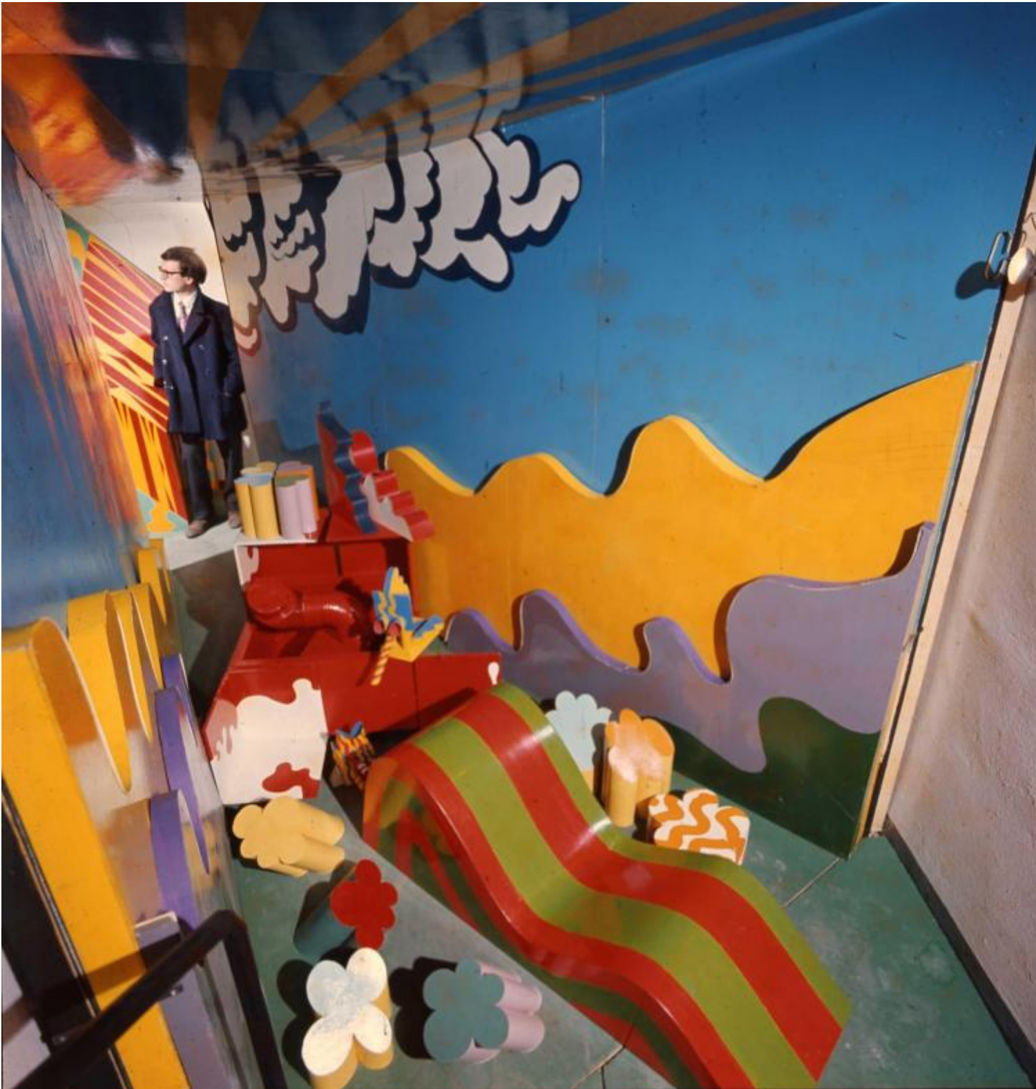
Superarchitettura, Galleria Jolly 2 di Pistoia, dicembre 1966.

A liquefarsi era lâ??idea della casa come macchina per abitare di Le Corbusier, come aveva giÃ intuito Ettore Sottsass, che al Primo congresso mondiale degli artisti liberi del 1956 ribadÃ¬ come â??lâ??uomo non Ã¨ nÃ© un minerale nÃ© un prodotto chimicoâ?•. Il passo successivo Ã¨ un condensato di antropologia sottsassiana: â??lâ??uomo Ã¨ un affare strano che affolla i campi sportivi e si scalmana, gli ospedali e urla, le chiese e si commiseria, affolla i teatri e si commuove, affolla le spiagge e si lava; lâ??uomo Ã¨ un affare strano con tumori e sesso, con pazzia e lacrime, e cosÃ¬ viaâ?• (cit. da Elisabetta Trincerini in