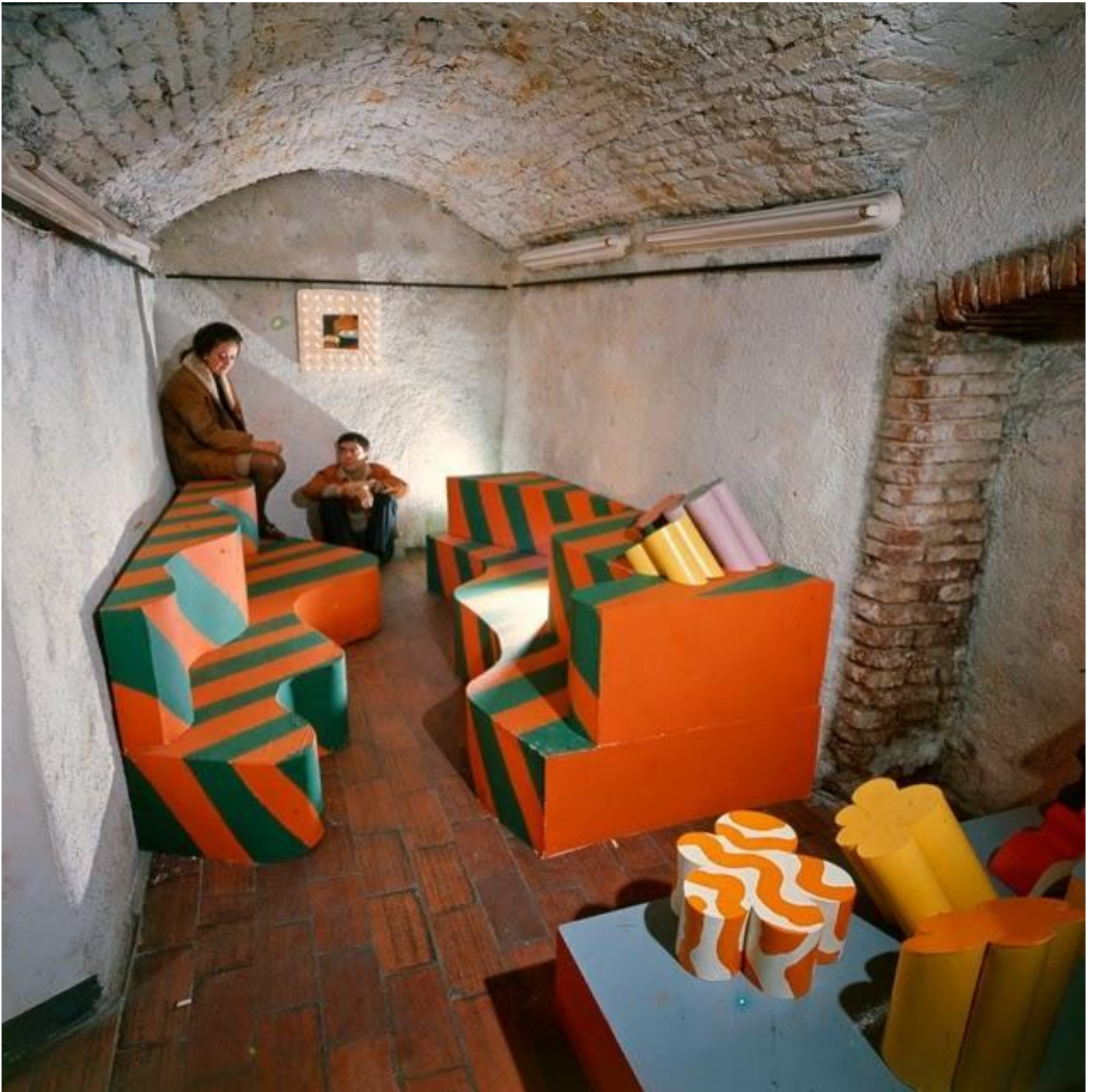
Superarchitettura, Galleria Jolly 2, Pistoia, dicembre 1966.