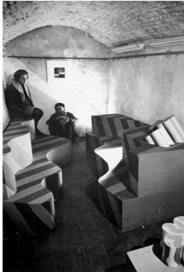
Superarchitettura, Galleria Jolly 2, Pistoia, dicembre 1966.

Custodite nell'alveo nel fiume, smosse dall'erosione del 1966, le opere di Rauschenberg e Serra sono recuperate simbolicamente dai giovani architetti fiorentini. I loro riferimenti oscillano dalle sculture-monumento fuori scala di Claes Oldenburg (riprese e sviluppate da Zziggurat) alle griglie di Sol LeWitt, dagli happening di Allan Kaprow alle performance di Vito Acconci, dalla funk architecture alla Land art, fino alla carica visionaria di Buckminster Fuller.