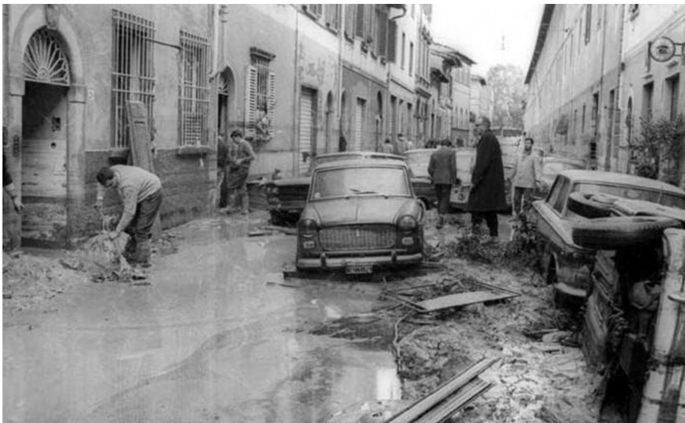
Alluvione di Firenze, 1966.