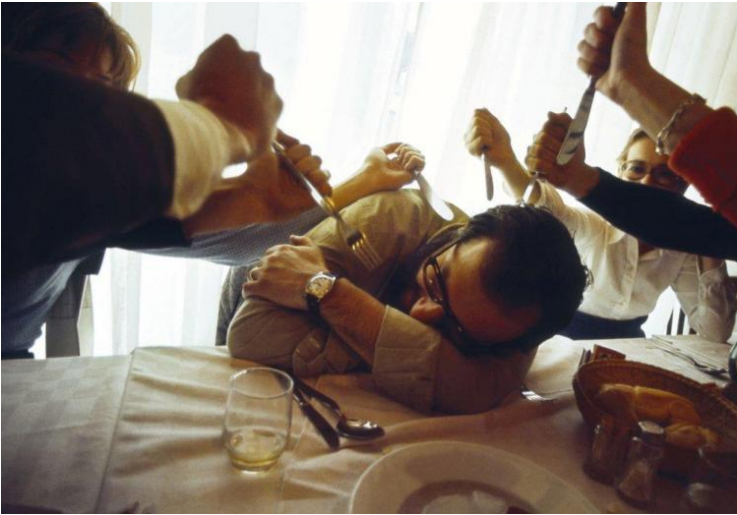
Umberto Eco in pasto agli UFO, 1968.