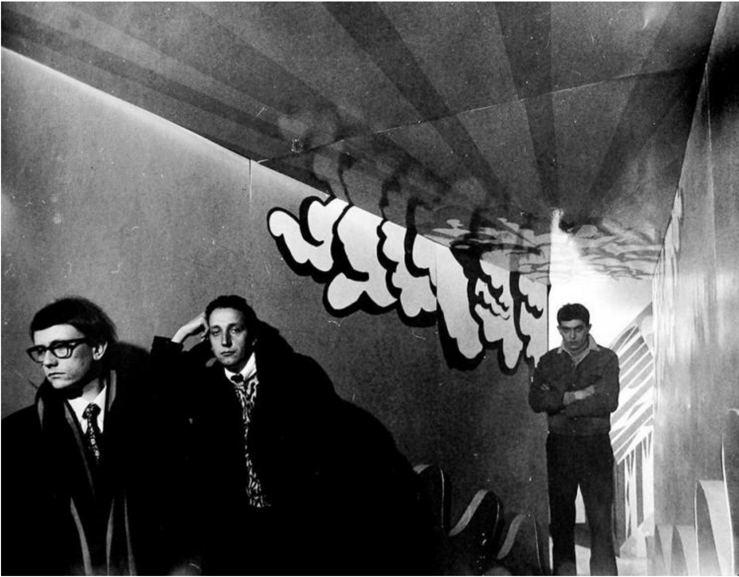
Superarchitettura, Galleria Jolly 2, Pistoia, dicembre 1966.

A straripare sono anche i confini tra architettura e arti visive, da cui «la consapevole trasformazione dell'architettura in immagini e la volontaria demistificazione del progetto come strumento» (Gianni Pettena, p. 24). Un cambio di prospettiva decisivo, in cui i giovani architetti non guardano alla storia della propria disciplina ma all'attualità delle altre discipline. Uno spostamento dall'asse diacronico a quello sincronico, dallo storicismo a uno sperimentalismo attento alla contemporaneità, che genera una dinamica inedita nella cultura visuale italiana.