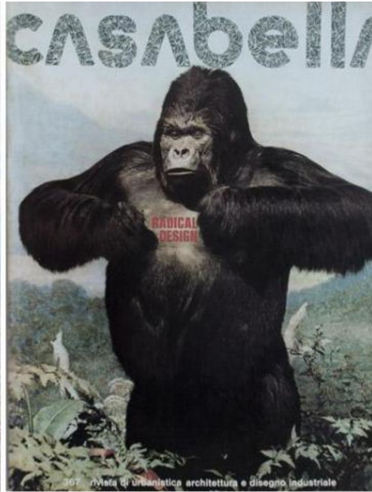
Affiche della mostra Utopie Radicali. Oltre l'architettura , Firenze 1966-1976, rielaborazione della copertina di "Casabella", luglio 1972.