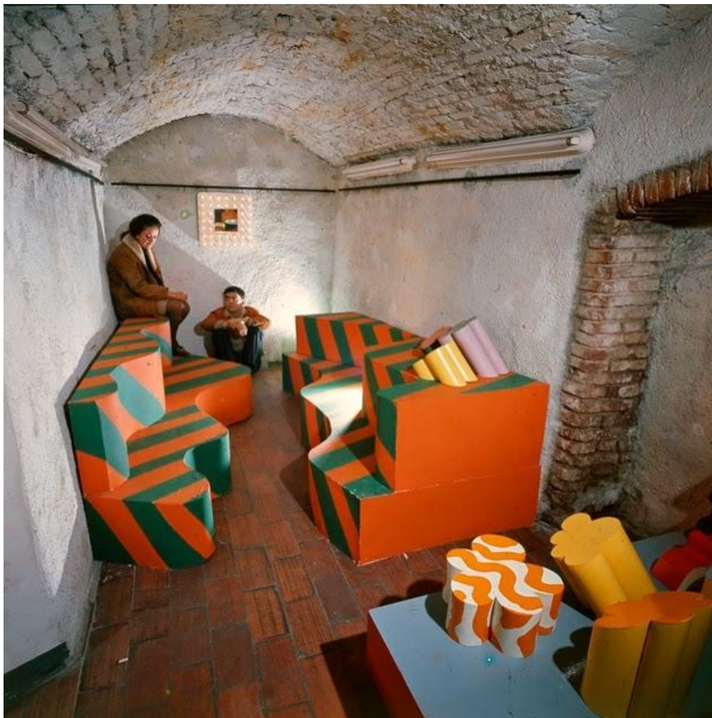
Superarchitettura, Galleria Jolly 2, Pistoia, dicembre 1966.