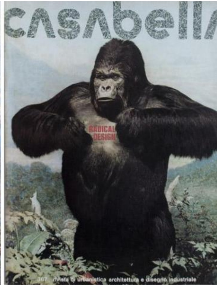
Affiche della mostra Utopie Radicali. Oltre l'architettura, Firenze 1966-1976, rielaborazione della copertina di "Casabella", luglio 1972.