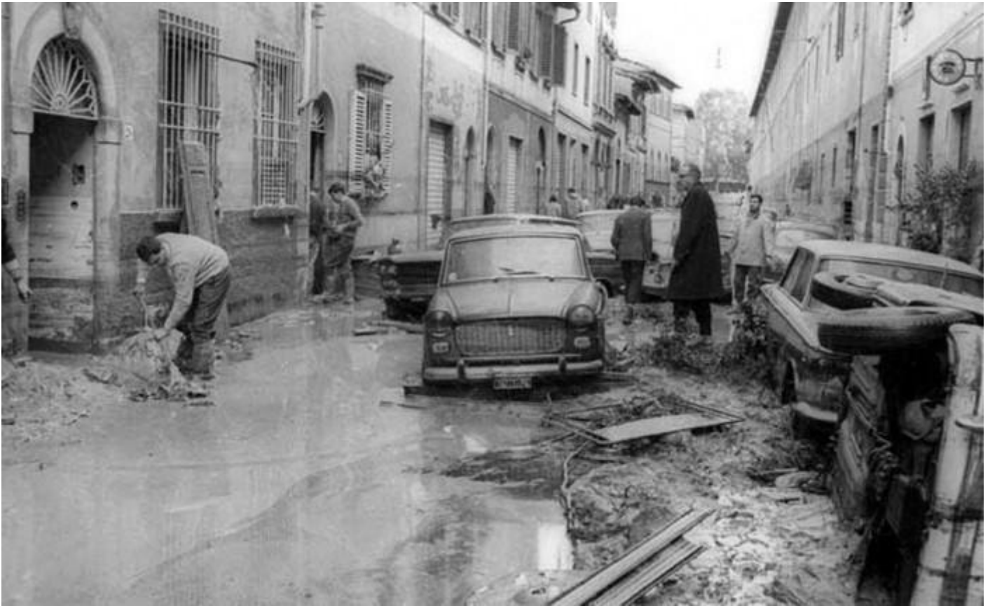
Alluvione di Firenze, 1966.