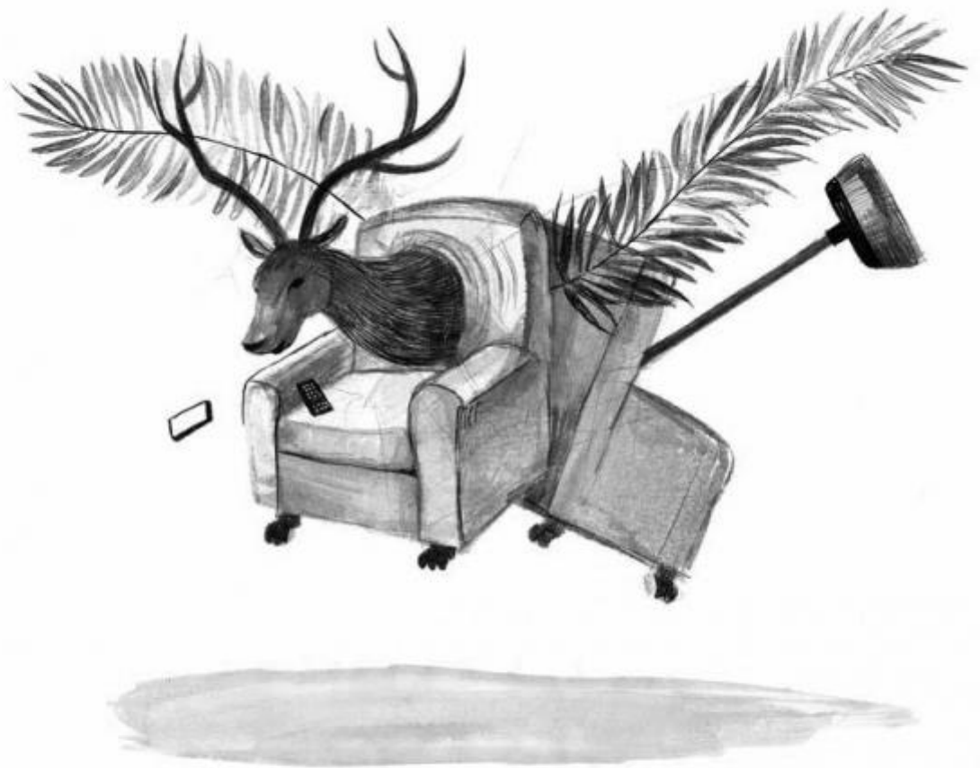
Cervovolante, immagine di Mara Cerri.

Favole di bambini, dove è possibile la magia, dove siamo prima delle vere e proprie definizioni sessuali, dove basta un atto di (incantata) volontà per trasformare un pezzetto di legno in un essere vivente e qualche parola confortevole e un po' di (auto)illusione per dare un cuore a un uomo di latta che crede di non averlo. Dove i confini tra il banale, il quotidiano, il materiale umile e lo splendore smeraldino e la fantasia più accesa, l'accelerazione immaginativa, sono sempre labili e i salti improvvisi possibili. L'idea, nei vari meravigliosi paesi e casi di Oz, si può dare corpo ai sogni, col gioco, con il desiderio, con la fantasia.