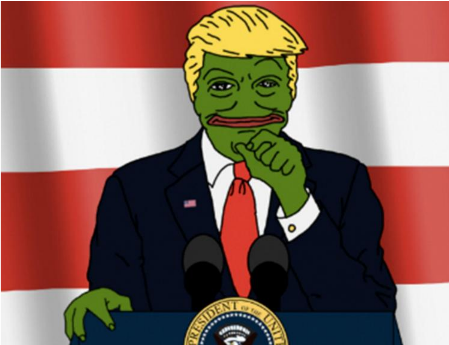
Donald Trump come Pepe the Frog.

Di per sé sono strumento comunicativo neutro, e anzi più che parlare del mondo, ne sfruttano i discorsi. Ma è anche vero che da come vengono usati gli strumenti si originano pratiche, usi, culture. Nel caso dei meme si è parlato moltissimo del legame con l' alt-right . L'avanguardia politica di Breitbart e Steve Bannon, al centro della vittoria di Donald Trump.