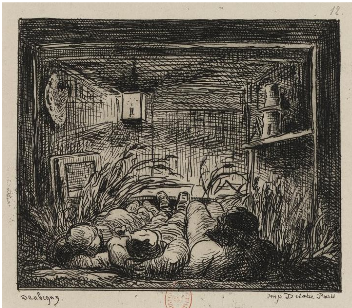
Charles François Daubigny, Dormire in barca (1862), acquaforte, Bibliothèque nationale de France, Parigi.