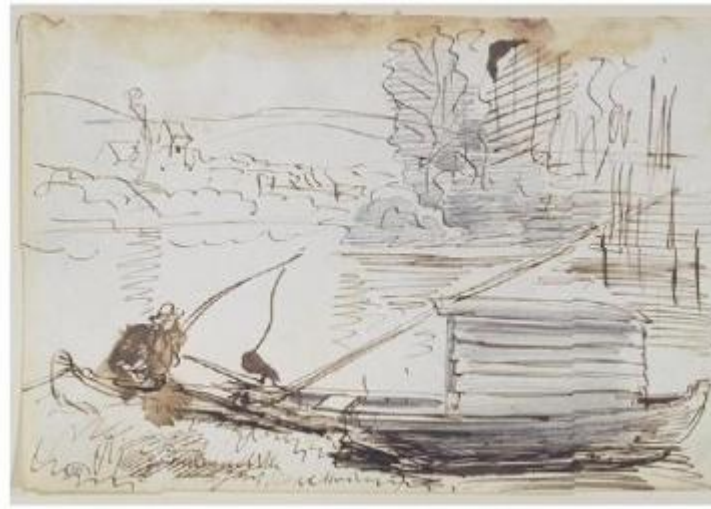
Charles François Daubigny, Le Botin; La pesca (1857) - schizzi, Cabinet des Dessin du Louvre, Parigi.

Le onde câ?erano, eccome, il traffico era molto intenso, i fiumi francesi erano sempre piÃ¹ solcati da navi commerciali mosse a vapore che certo non badavano alle piccole imbarcazioni. Ecco che padre e figlio con cappello vogano di gran lena per fronteggiare le difficultÃ e raddrizzare la barcaâ? PiÃ¹ in IÃ il fumo nero dei battelli a vapore inquina il cielo e soffoca gli alberi. Un paesaggio ironicamente invaso dalle nuove macchine marine.