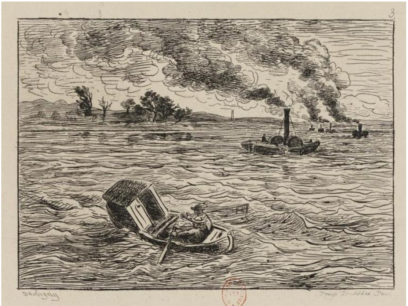
Charles François Daubigny, Attenzione alle navi a vapore (1862), acquaforte, Bibliothèque nationale de France, Parigi.