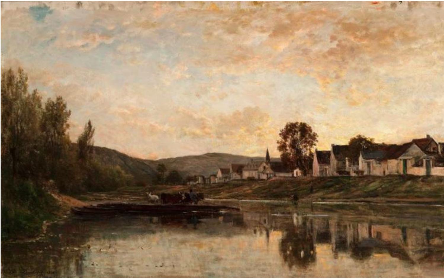
Charles François Daubigny, Traghetto vicino a Bonnière-sur-Seine, 1861, Taft Museum of Art, Cincinnati.

In un articolo del 1865, quasi un decennio prima che la parola ‘impressionismo’ facesse la sua comparsa ufficiale alla celebre mostra del 1874, il critico Léon Lagrange menziona una “scuola dell’ impressione e il suo maestro, Monsieur Daubigny”. La scelta di paesaggi semplici e reali, la tecnica veloce, le pennellate sempre più rapide e immediate quasi come per uno schizzo, lo posizionano come il più autentico traduttore della natura ma scatenano anche molte critiche: “questo non è un quadro, è solo uno schizzo”. Lo stesso Gautier nel 1862 lo critica perché “trascura i dettagli” mostrando solo “prime impressioni”.