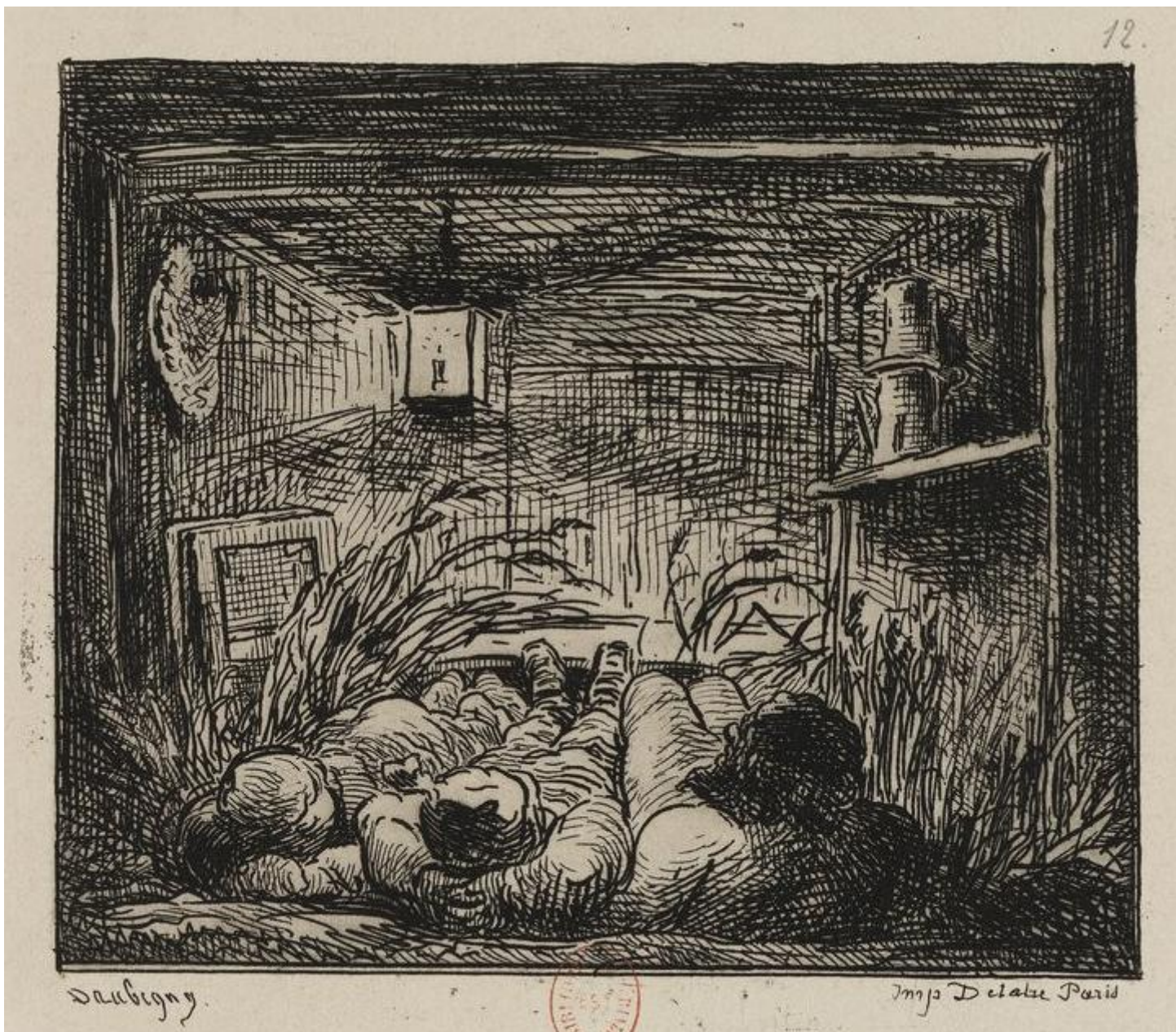
Charles François Daubigny, Dormire in barca (1862), acquaforte, Bibliothèque nationale de France, Parigi.