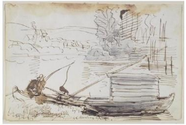
Charles François Daubigny, Le Botin; La pesca (1857) - schizzi, Cabinet des Dessin du Louvre, Parigi.

Le onde c'erano, eccome, il traffico era molto intenso, i fiumi francesi erano sempre più solcati da navi commerciali mosse a vapore che certo non badavano alle piccole imbarcazioni. Ecco che padre e figlio con cappello vogano di gran lena per fronteggiare le difficoltà e raddrizzare la barca... Più in là il fumo nero dei battelli a vapore inquina il cielo e soffoca gli alberi. Un paesaggio ironicamente invaso dalle nuove macchine marine.