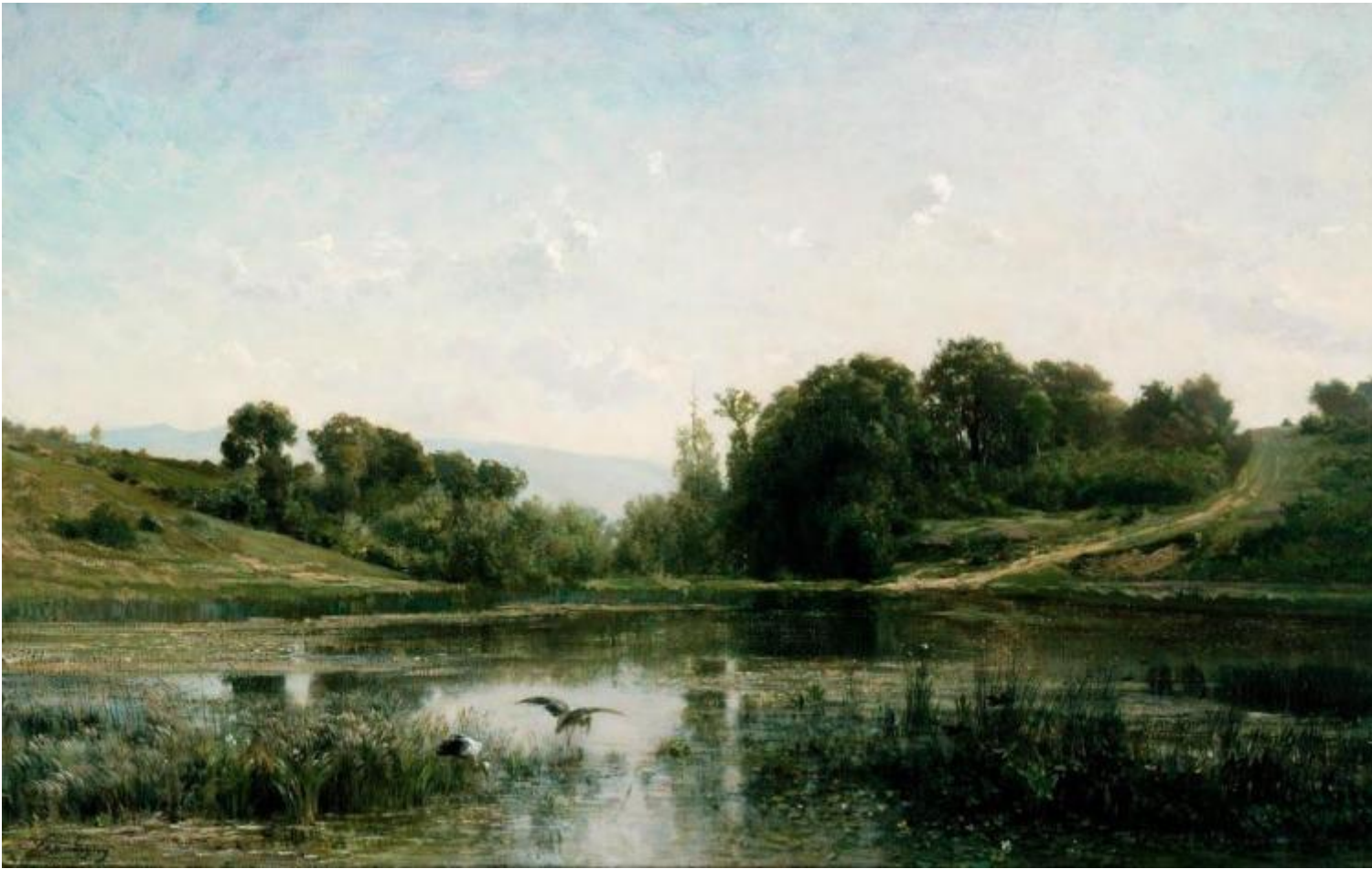
Charles François Daubigny, Lo stagno a Gylieu , 1853, Cincinnati Art Museum.

Un punto d'osservazione già molto basso che anticipa le successive vedute sempre più a fior d'acqua. Lo spettatore è portato sul fiume, in mezzo al fiume. Specchi di cieli, albe, tramonti, nuvole fluide dai toni spezzati e chiari si susseguono in tagli compositivi sempre originali. Le tele allungate e panoramiche, che prenderanno il nome di double-square (doppio quadrato), affascineranno le nuove leve come Pissaro e Monet e, più tardi, Van Gogh. Secondo le ultime ricerche, Daubigny le otteneva modificando i telai standard pronti all'uso allora in commercio.