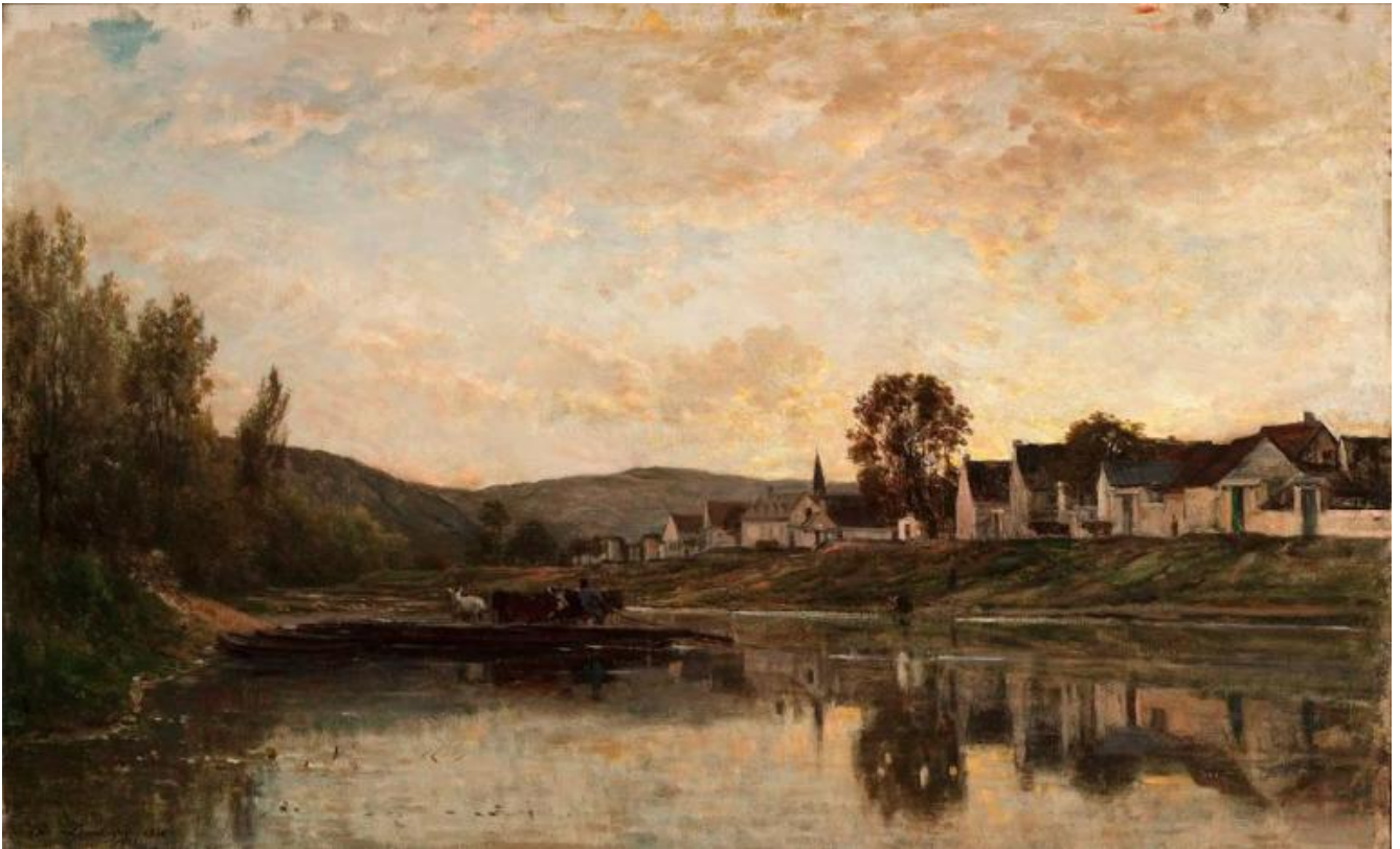
Charles François Daubigny, Traghetto vicino a Bonnière-sur-Seine, 1861, Taft Museum of Art, Cincinnati.

In un articolo del 1865, quasi un decennio prima che la parola 'impressionismo' facesse la sua comparsa ufficiale alla celebre mostra del 1874, il critico Léon Lagrange menziona una "scuola dell'impressione e il suo maestro, Monsieur Daubigny". La scelta di paesaggi semplici e reali, la tecnica veloce, le pennellate sempre più rapide e immediate quasi come per uno schizzo, lo posizionano come il più autentico traduttore della natura ma scatenano anche molte critiche: "questo non è un quadro, è solo uno schizzo". Lo stesso Gautier nel 1862 lo critica perché "trascura i dettagli" mostrando solo "prime impressioni".