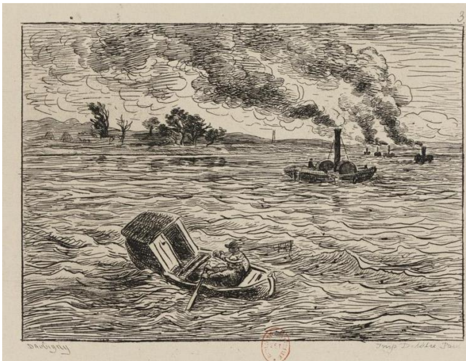
Charles François Daubigny, Attenzione alle navi a vapore (1862), acquaforte, Bibliothèque nationale de France, Parigi.

Grazie all'editore Alfred Cadart, che nel 1862 aveva fondato la Société des aquafortistes per ridare vita e restituire ai pittori la tecnica dell'acquaforte, abbiamo questo prezioso libro, stampato lo stesso anno a Parigi da Auguste Delâtre. Dei numerosi schizzi del carnet originale, Cadart seleziona quindici fogli da realizzare in acquaforte. Daubigny, bravissimo incisore (si era mantenuto per anni come illustratore) ne trattiene la freschezza e il verso: esegue il disegno su carta semi-trasparente che poi riporta rovesciato sulla lastra preparata per l'acquaforte. Così facendo, la stampa che ottiene non è a specchio, ma l'immagine 'si rigira' nuovamente nel verso dell'originale.