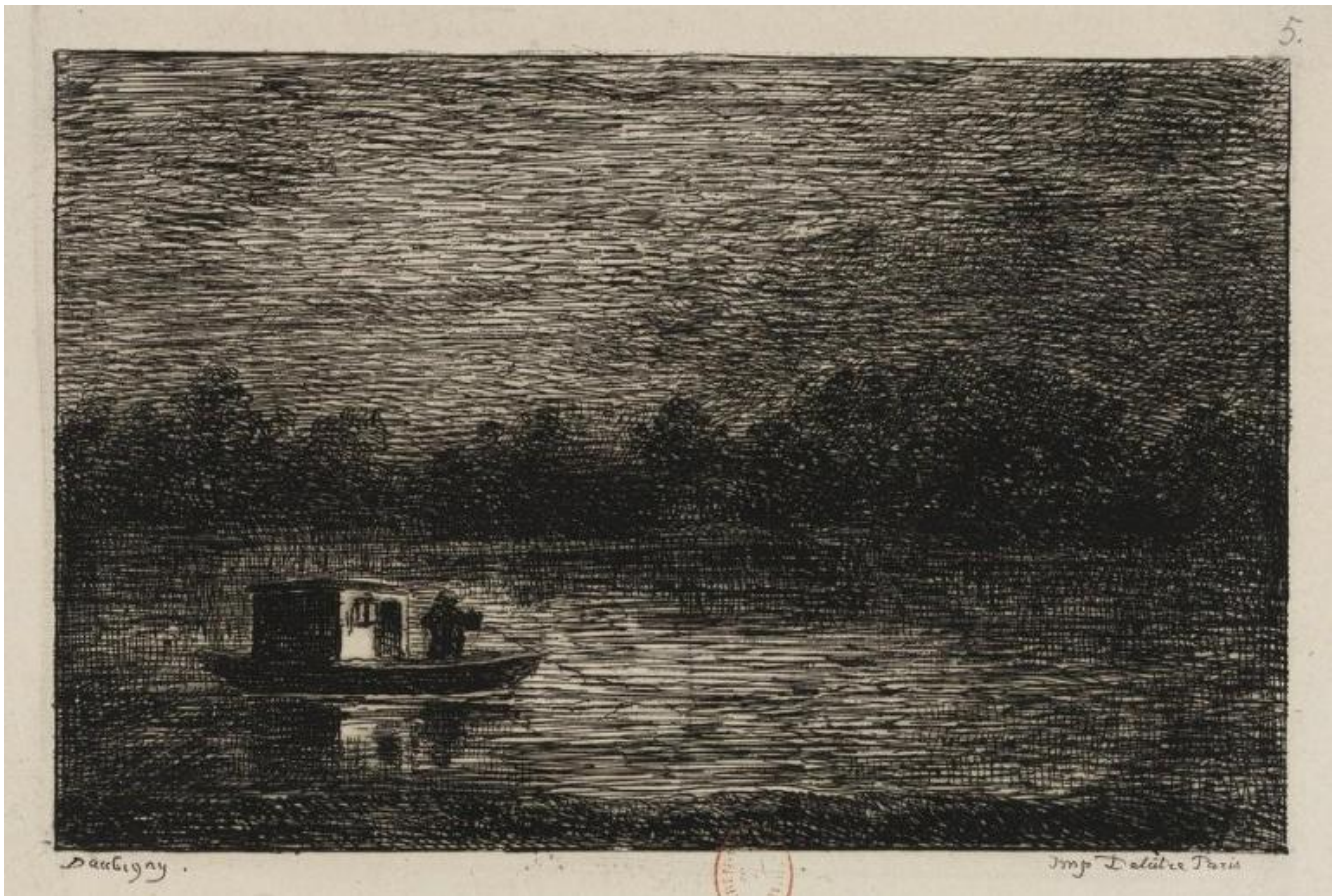
Charles François Daubigny, La notte (1862), acquaforte, Bibliothèque nationale de France, Parigi.

È così che nel 1857, a quarant'anni, con alle spalle una sudata carriera, moglie e 3 figli, si consulta con l'amico Baillet di Asnière che gli propone una barca da traghettatore, da attrezzare con un albero, una vela e dei remi. Lunga otto metri e mezzo, ha il fondo in quercia piatto, e un pescaggio di soli cinquanta centimetri. La cabina, in legno di abete, è alta un metro e sessanta, lunga due. Un po' scomoda secondo Daubigny, che la fa alzare di quindici centimetri e allungare di venti, con una zona "dalla quale dipingere en plein air ".