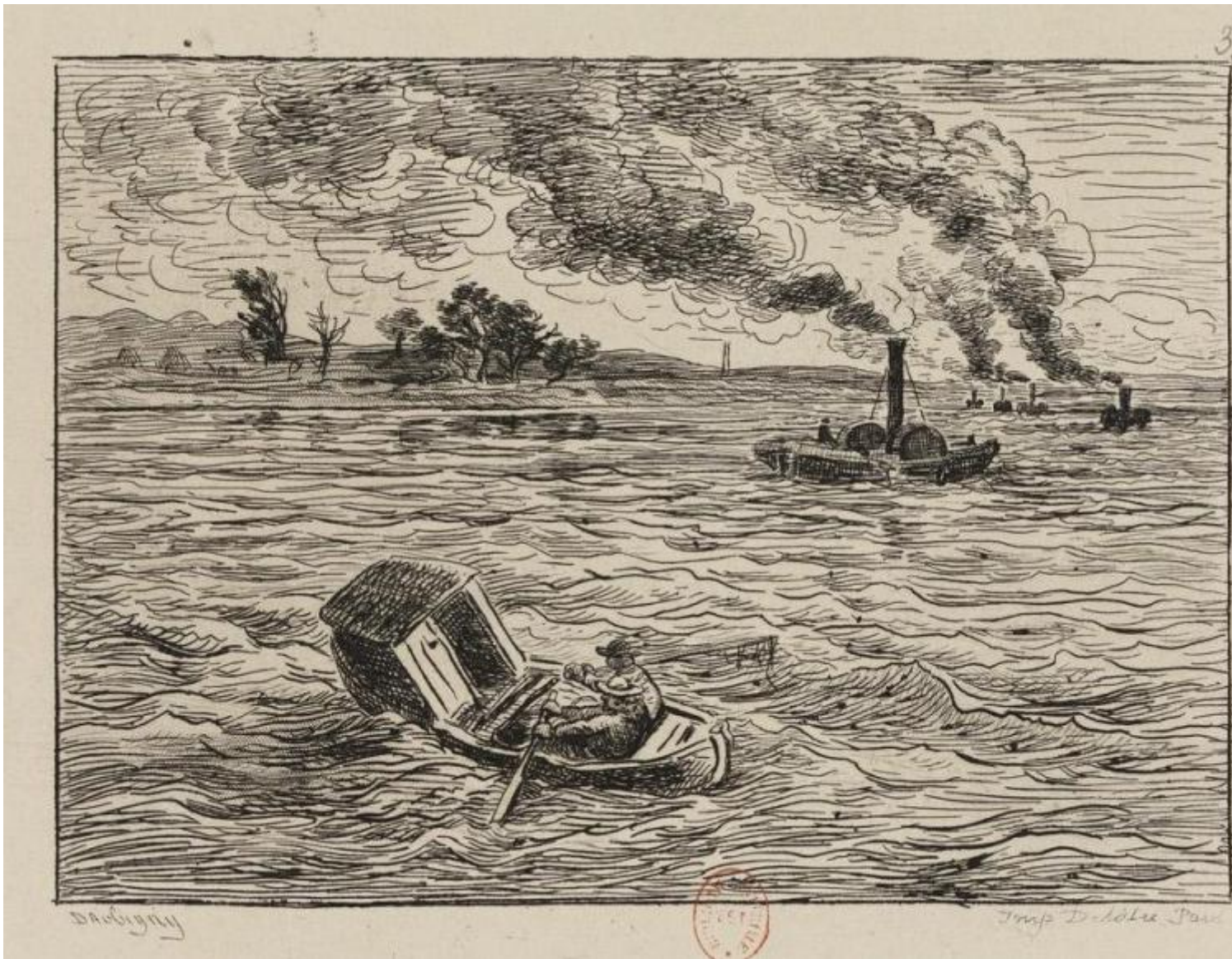
Charles François Daubigny, Attenzione alle navi a vapore (1862), acquaforte, Bibliothèque nationale de France, Parigi.