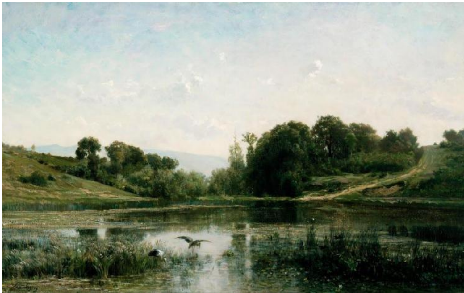
Charles François Daubigny, Lo stagno a Gylieu, 1853, Cincinnati Art Museum.

Un punto d'osservazione già molto basso che anticipa le successive vedute sempre più a fior d'acqua. Lo spettatore è portato sul fiume, in mezzo al fiume. Specchi di cieli, albe, tramonti, nuvole fluide dai toni spezzati e chiari si susseguono in tagli compositivi sempre originali. Le tele allungate e panoramiche, che prenderanno il nome di double-square (doppio quadrato), affascineranno le nuove leve come Pissaro e Monet e, più tardi, Van Gogh. Secondo le ultime ricerche, Daubigny le otteneva modificando i telai standard pronti all'uso allora in commercio.