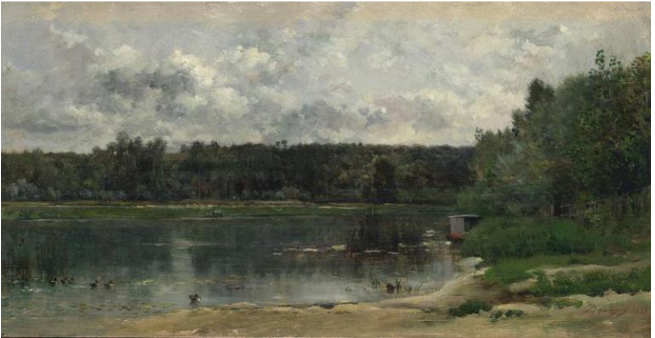
Paesaggio sul fiume con anatre, The National Gallery, Londra.

Niente grandeur come nel contemporaneo Théodore Rousseau, nulla di idealizzato come in Camille Corot. Daubigny non abbellisce niente, osserva e dipinge. Sta lavorando per liberare la pittura dalle rigide barriere accademiche che volevano da un lato lo studio dall'altro il dipinto. Se ne accorgono mercanti (Durand-Ruel, Goupil), collezionisti, lo stato, che gli commissiona due quadri.