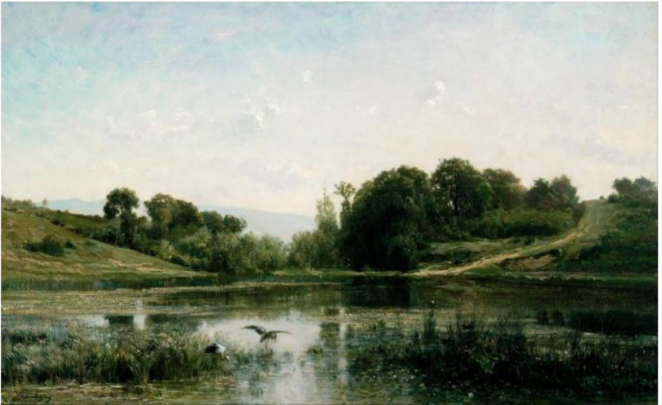
Charles François Daubigny, Lo stagno a Gylieu, 1853, Cincinnati Art Museum.

Un punto d'osservazione già molto basso che anticipa le successive vedute sempre più a fior d'acqua. Lo spettatore è portato sul fiume, in mezzo al fiume. Specchi di cieli, albe, tramonti, nuvole fluide dai toni spezzati e chiari si susseguono in tagli compositivi sempre originali. Le tele allungate e panoramiche, che prenderanno il nome di double-square (doppio quadrato), affascineranno le nuove leve come Pissaro e Monet e, più tardi, Van Gogh. Secondo le ultime ricerche, Daubigny le otteneva modificando i telai standard pronti all'uso allora in commercio.