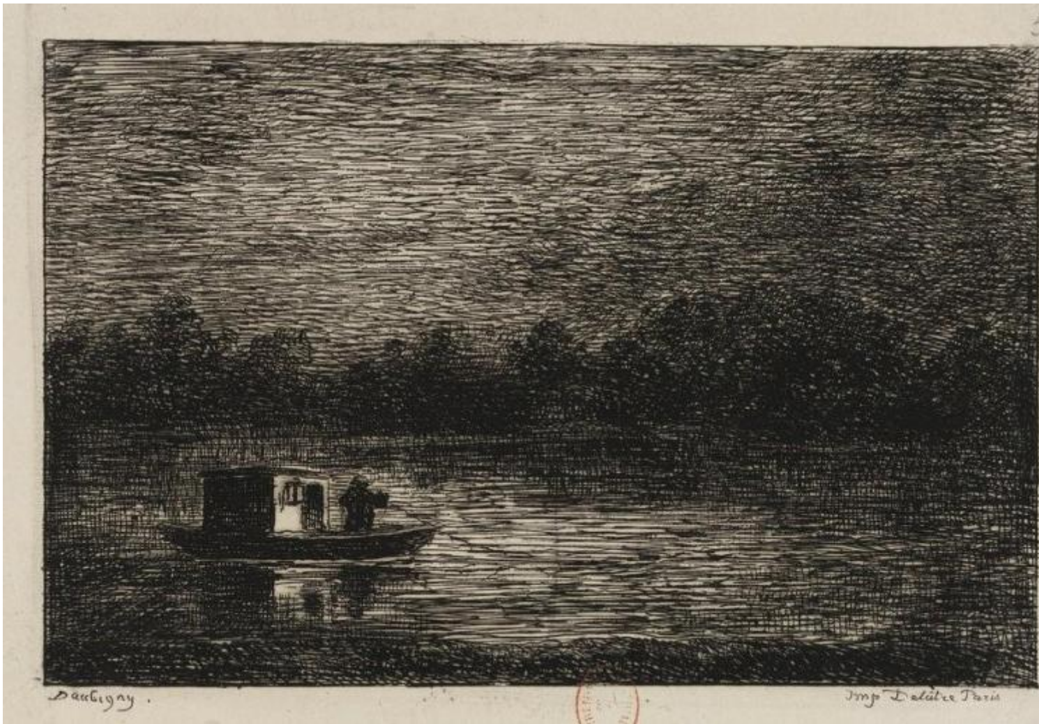
Charles François Daubigny, La notte (1862), acquaforte, Bibliothèque nationale de France, Parigi.

È così che nel 1857, a quarant'anni, con alle spalle una sudata carriera, moglie e 3 figli, si consulta con l'amico Baillet di Asnières che gli propone una barca da traghettatore, da attrezzare con un albero, una vela e dei remi. Lunga otto metri e mezzo, ha il fondo in quercia piatto, e un pescaggio di soli cinquanta centimetri. La cabina, in legno di abete, è alta un metro e sessanta, lunga due. Un po' scomoda secondo Daubigny, che la fa alzare di quindici centimetri e allungare di venti, con una zona dalla quale dipingere en plein air .