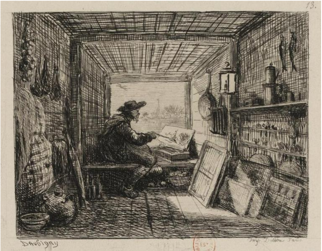
Charles François Daubigny, L'artista che dipinge a bordo del Botin (1862), acquaforte, Bibliothèque nationale de France, Parigi.

Si apre con queste righe la prefazione di Voyage en Bateau , un libro-raccolta di incisioni che raccontano le imprese di viaggio del Botin , la barca attrezzata a studio di Charles Daubigny (1817-1878). Amante del fiume (aveva passato la sua infanzia a Valmondois, un villaggio sull'Oise a nord di Parigi) per primo intuisce che stare a fior d'acqua giorno e notte, muoversi sul fiume, non è come osservarlo camminando lungo i suoi argini. Per coglierne le luci, i riflessi, le vite, le vedute più intime, bisognava passare sull'acqua ogni momento del giorno e della notte, insomma viverci, navigare.