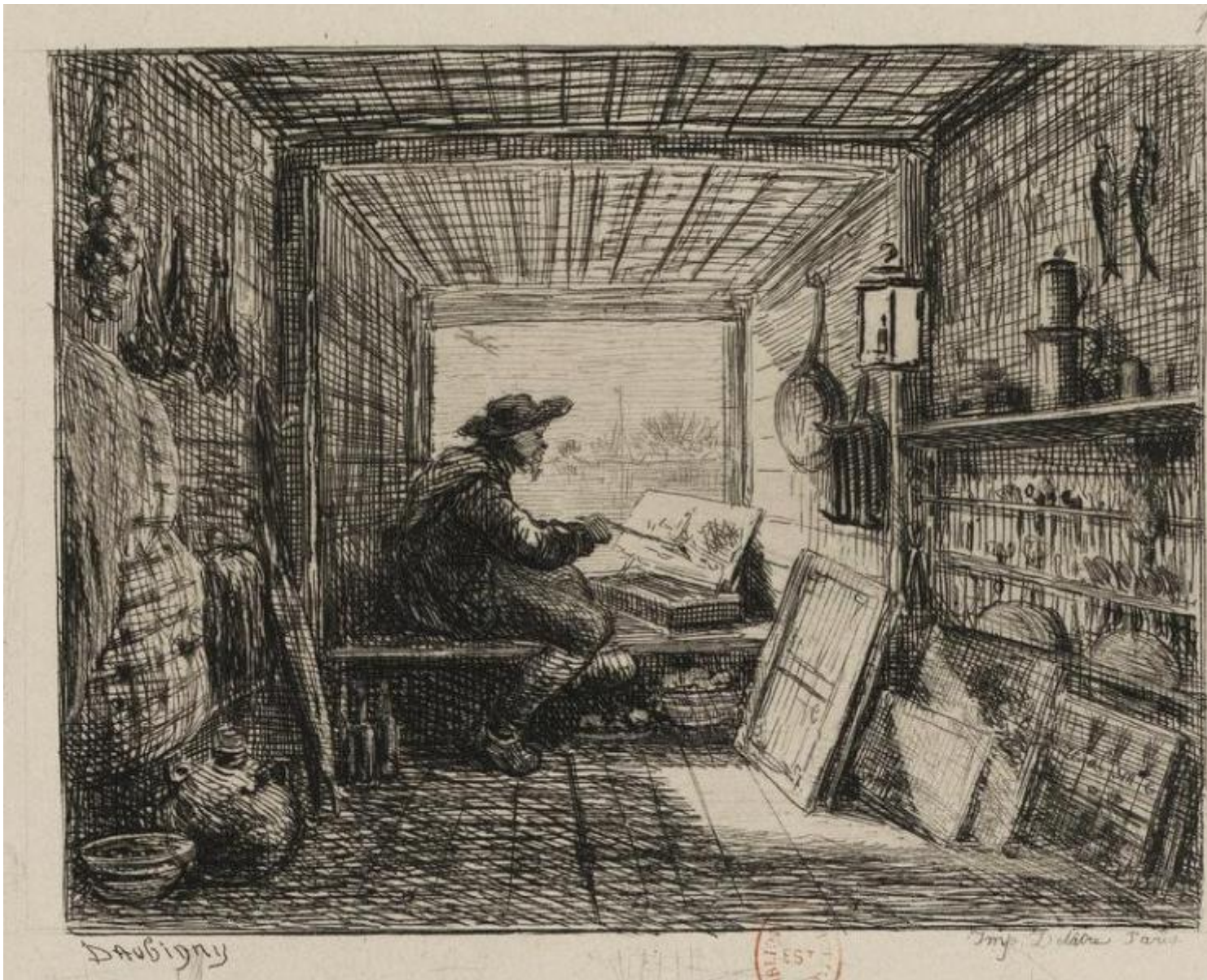
Charles François Daubigny, L'artista che dipinge a bordo del Botin (1862), acquaforte, Bibliothèque nationale de France, Parigi.

Si apre con queste righe la prefazione di Voyage en Bateau , un libro-raccolta di incisioni che raccontano le imprese di viaggio del Botin , la barca attrezzata a studio di Charles Daubigny (1817-1878). Amante del fiume (aveva passato la sua infanzia a Valmondois, un villaggio sull'Oise a nord di Parigi) per primo intuisce che stare a fior d'acqua giorno e notte, muoversi sul fiume, non è come osservarlo camminando lungo i suoi argini. Per coglierne le luci, i riflessi, le vite, le vedute più intime, bisognava passare sull'acqua ogni momento del giorno e della notte, insomma viverci, navigare.