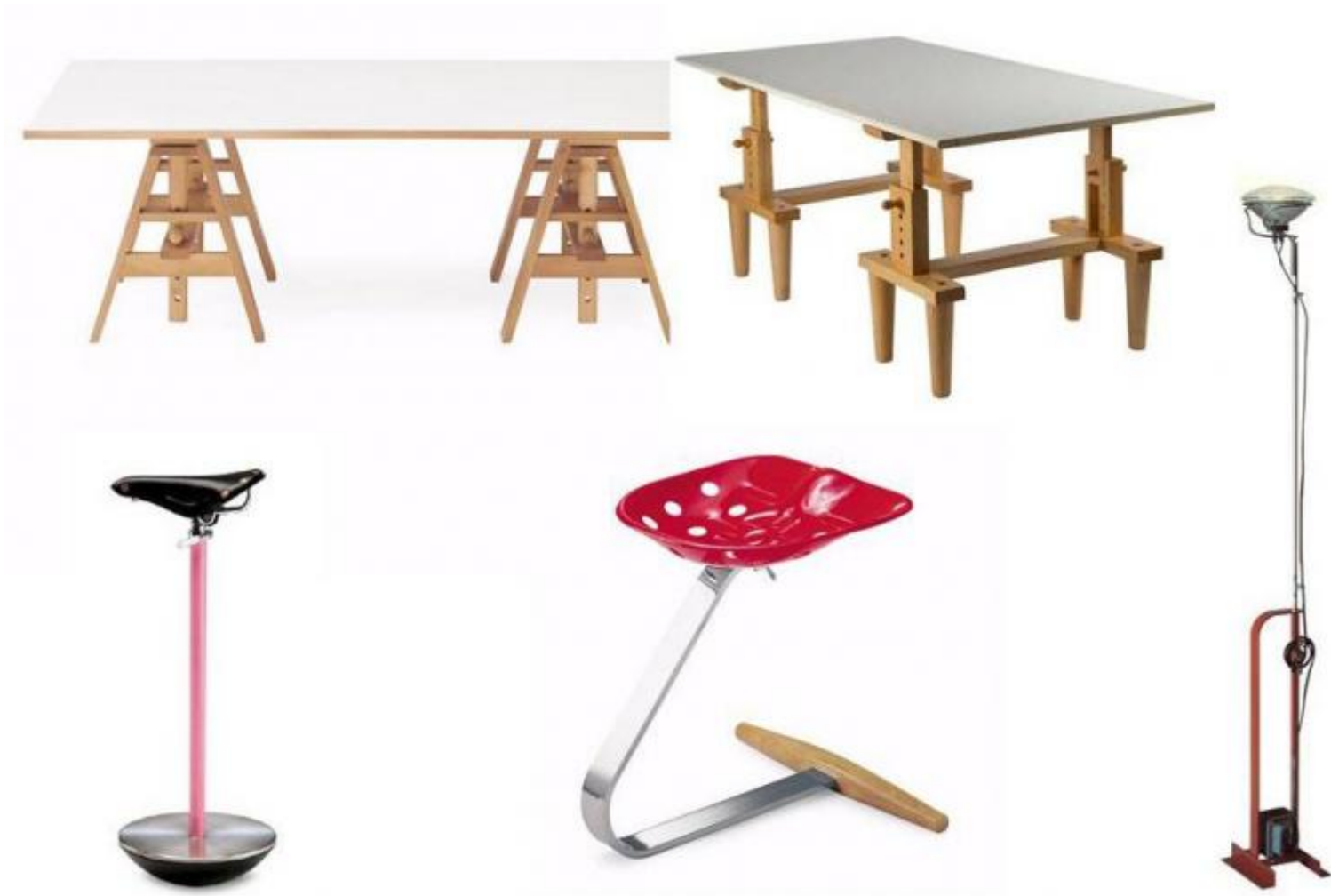
In alto: Tavolo Leonardo e tavolo Bramante, 1950. In basso: sgabello Sella e sgabello Mezzadro, 1957; lampada Toio, 1962.

È da questa inusuale raccolta di oggetti anonimi che il maestro ha tratto spunto per realizzare, in coppia con il fratello Pier Giacomo, maggiore di lui e prematuramente scomparso, alcuni dei suoi pezzi di design più famosi, come i tavoli Leonardo e Bramante (1950), che reinterpretano il tema del cavalletto e del banco da lavoro da falegname; o ancora lo sgabello Mezzadro (1957), che ingloba il sedile di un trattore agricolo d'inizio Novecento, fabbricato in lamiera stampata e verniciata; e poi Sella (1957), la seduta da tenere di fronte al telefono (ovviamente ai vecchi apparecchi telefonici a muro) volutamente scomoda per scoraggiare le lunghe conversazioni; e la lampada Toio (1962), la cui fonte illuminante è costituita da un vero faro d'automobile da 300 watt, sorretto da uno stelo ricavato da una canna da pesca, a sua volta inserita in una base di lamiera d'acciaio ripiegata in cui è racchiuso un pesante trasformatore che le conferisce stabilità.