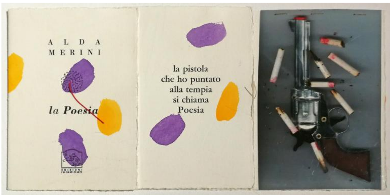
Alda Merini, La Poesia . Osnago, Marzo 2004. Edizione di 33 copie.