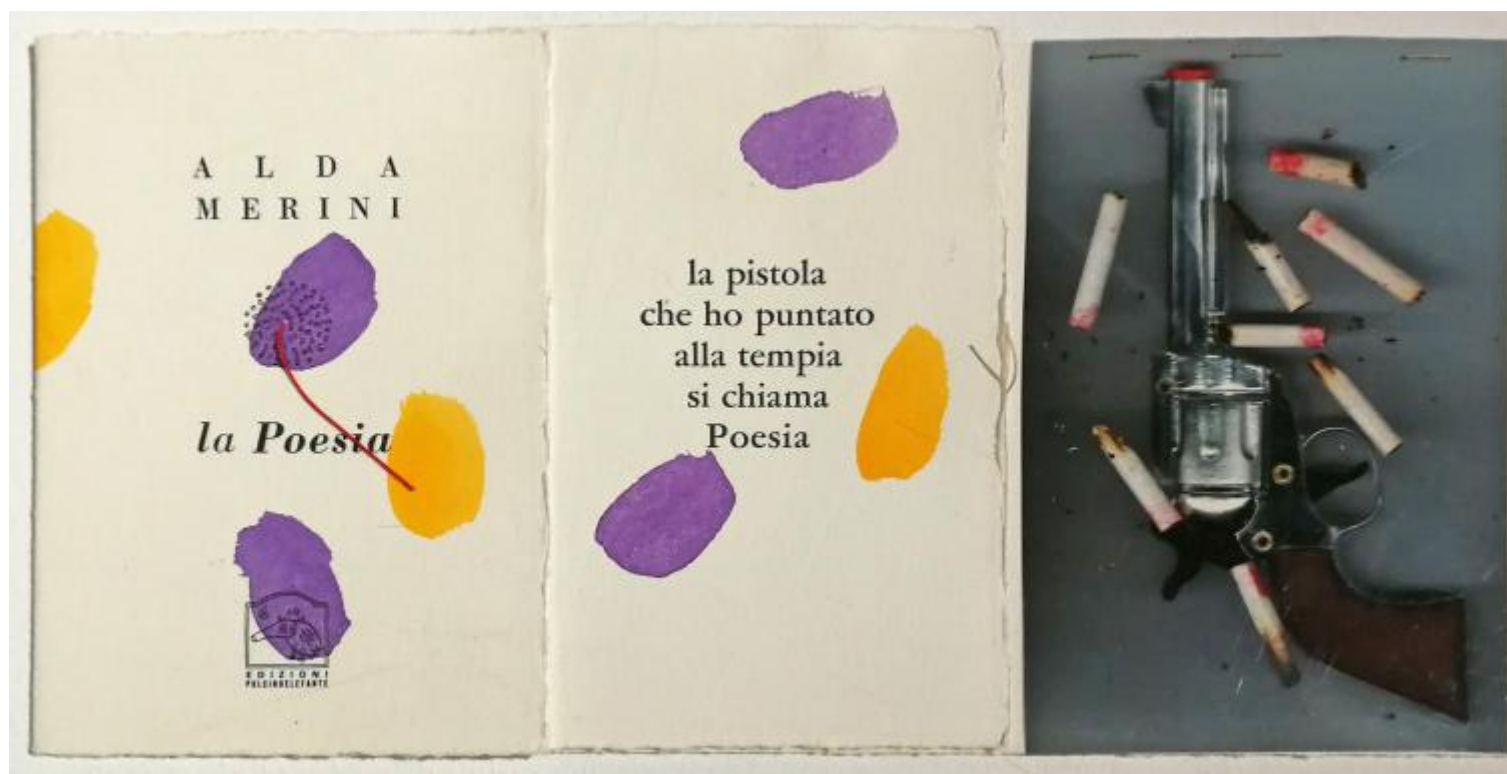
Alda Merini, La Poesia. Osnago, Marzo 2004. Edizione di 33 copie.