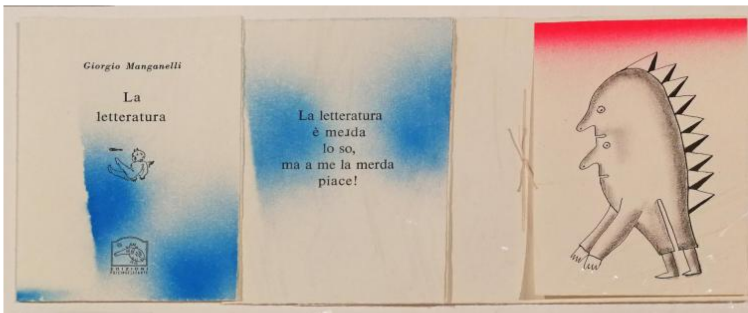
Giorgio Manganelli, La letteratura. Osnago, Ottobre 2012. Edizione di 23 copie. Disegno di Alberto Casiraghy.

Numerosi sono i poeti e gli artisti che hanno partecipato all'âavventura umana prima ancora che artistica e letteraria di Pulcinoelefante . La stampa di un libretto Ã il pretesto per passare una giornata insieme: si compongono i caratteri e le xilografie, si stampa, si rilegano le pagine, si applica lâimmagine o lâoggetto in giornata.