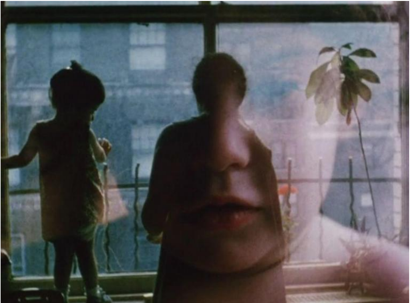
Jonas Mekas, Diaries, notes and sketches, 1969.

Continuamente a darsi il cambio in stretta vicinanza. In un montaggio che ama anche la presenza del caso o dell'incontro fortuito o per stacco, dal biancore della neve ai colori accesi dei fiori primaverili, della natura in città. Dalle giornate di sole alle riprese azzurrognole dei pomeriggi piovosi. All'interno di questo flusso vi sono anche riferimenti precisi, come il 24 maggio 1983, l'anniversario del ponte di Brooklyn, o l'ultima passeggiata con Jerome Hill il 7 luglio 1972, e scene che ritraggono attimi di vita di alcuni dei celebri amici di Mekas, come ad esempio Andy Warhol, Antonia Brico e Carl Theodor Dreyer.