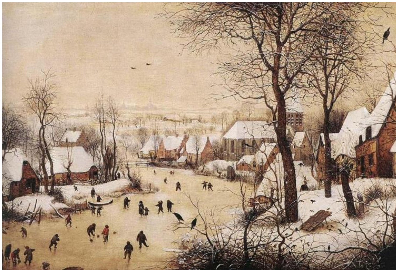
Pieter Bruegel il Vecchio, Paesaggio invernale con pattinatori e trappola per uccelli (1565), Bruxelles, Museo reale delle belle arti del Belgio.

Poi, per qualche momento, irrompono i fiori della primavera, e le persone che toccano e annusano le loro corolle. Ma tornano di nuovo immagini invernali, la gente sul ghiaccio, riprese in bianco e nero. Poi ancora qualche frame primaverile a colori e subito dopo di nuovo filmati invernali in bianco e nero. E poi un acquazzone ripreso dai finestrini di un'auto in viaggio sulle strade e sui lunghi ponti di New York, in epoca più recente. E di nuovo il freddo periodo invernale, nella morsa della neve, negli anni Settanta. Scampagnata di famiglia nel parco, in una giornata di sole, primaverile, con moglie e figlia. Ancora riprese di un incendio, con i pompieri al lavoro. Primavera, nel parco. Autunno. Inverno. Continuamente a darsi il cambio in stretta vicinanza. In un montaggio che ama anche la presenza del caso o dell'incontro fortuito o per stacco, dal biancore della neve ai colori accesi dei fiori primaverili, della natura in città. Dalle giornate di sole alle riprese azzurrognole dei pomeriggi piovosi. All'interno di questo flusso vi sono anche riferimenti precisi, come il 24 maggio 1983, l'anniversario del ponte di Brooklyn, o l'ultima passeggiata con Jerome Hill il 7 luglio 1972, e scene che ritraggono attimi di vita di alcuni dei celebri amici di Mekas, come ad esempio Andy Warhol, Antonia Brico e Carl Theodor Dreyer.