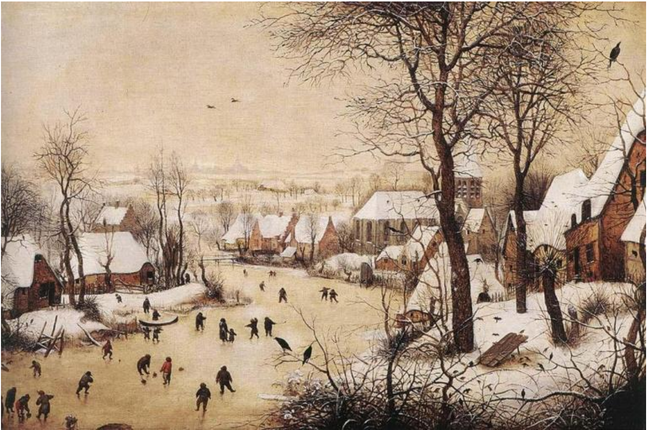
Pieter Bruegel il Vecchio, Paesaggio invernale con pattinatori e trappola per uccelli (1565), Bruxelles, Museo reale delle belle arti del Belgio.

colpirsi con palle di neve, o a scivolare con le slitte. Tornano alla mente alcune opere di Brueghel il Vecchio, i suoi quadri invernali. Mekas testimonia il suo tempo, la banalità del quotidiano, in una maniera simile a quella documentata da Brueghel e dagli innumerevoli disegni di Rembrandt, con il medium del suo taccuino filmico.