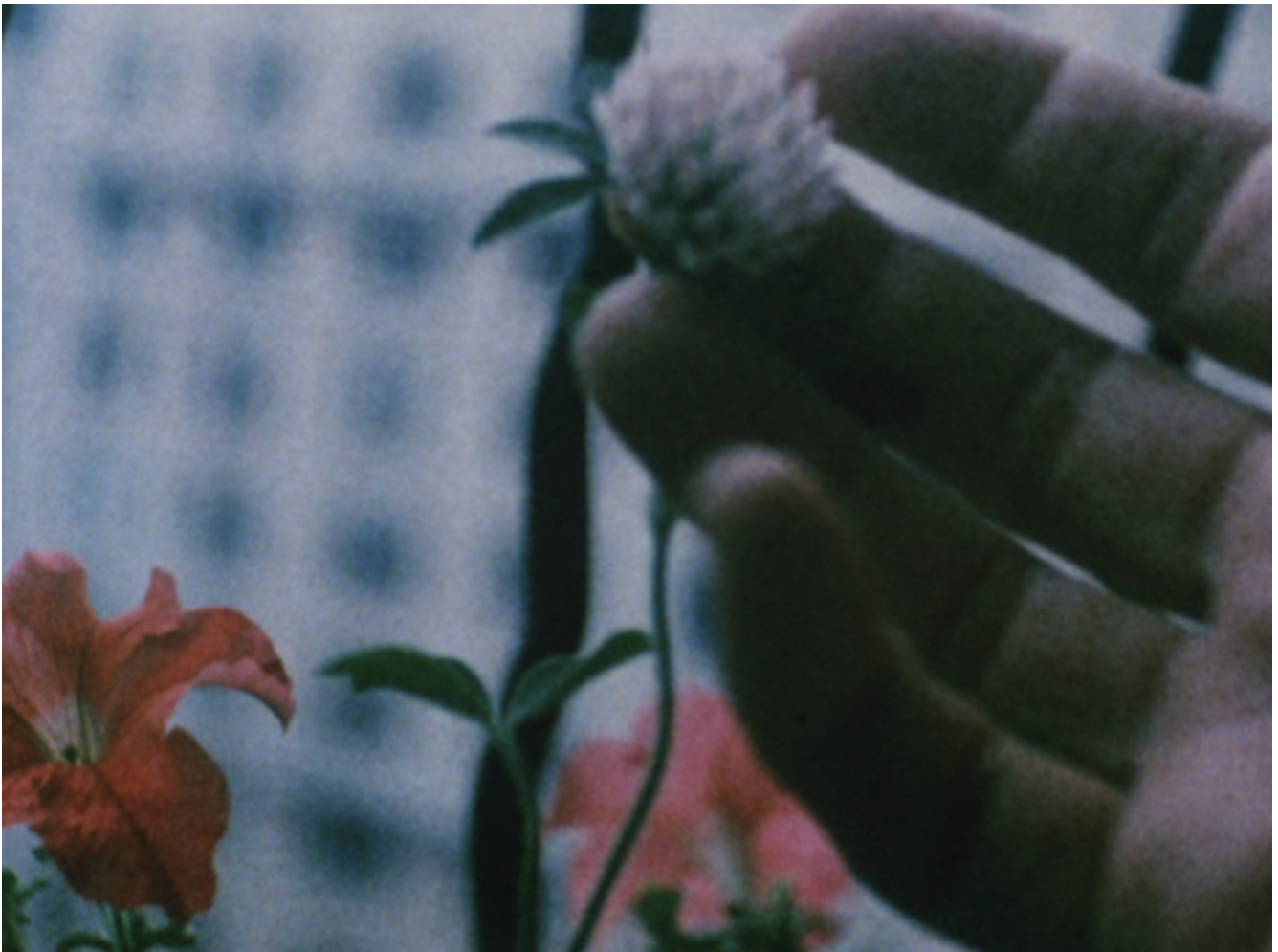
Jonas Mekas, The seasons, 2017.

In contemporanea ai film diary , Mekas scrive anche poesie che cercano di trascendere le semplici reiterazioni dei discorsi quotidiani.