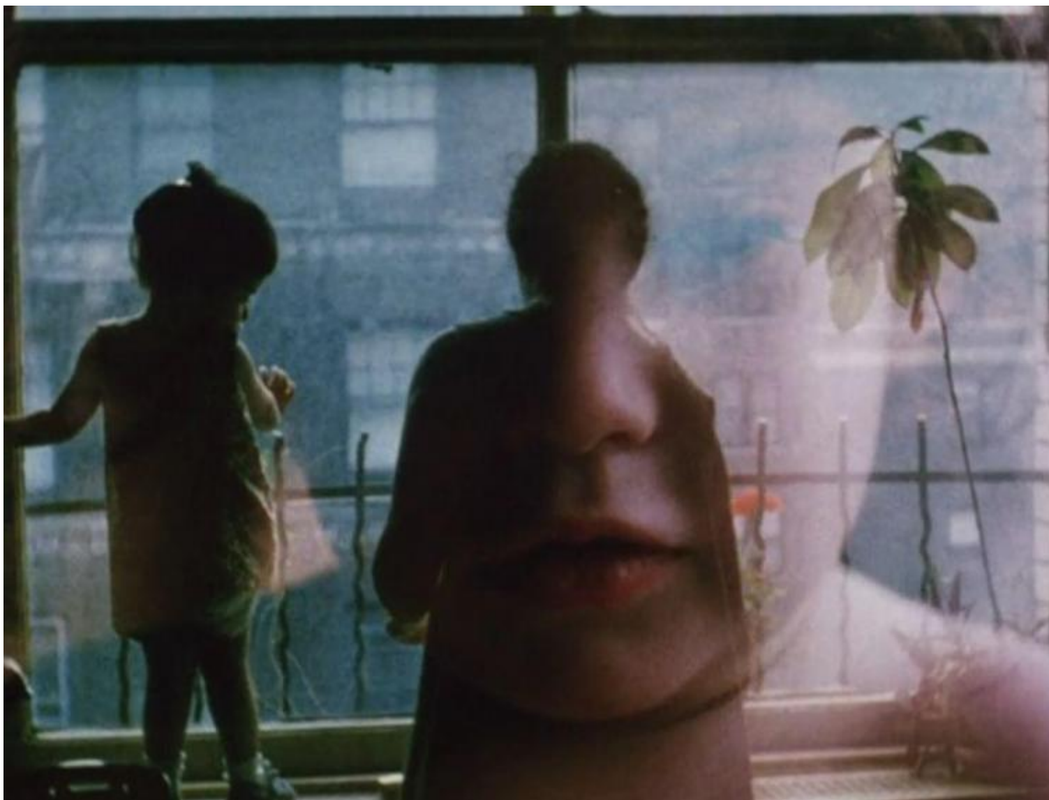
Jonas Mekas, Diaries, notes and sketches, 1969.