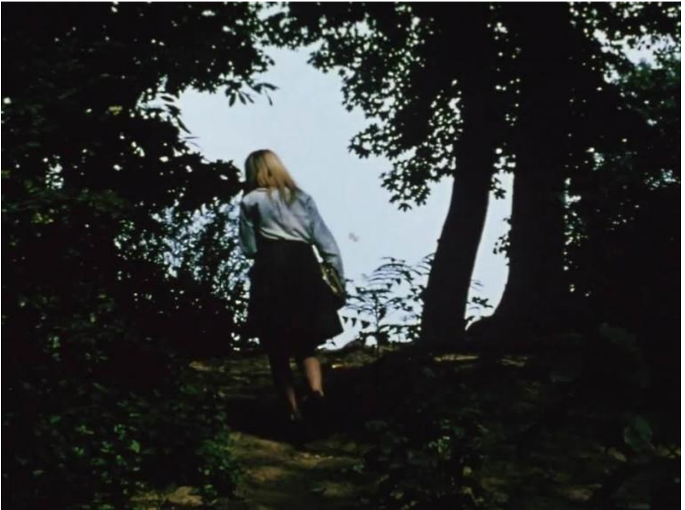
Jonas Mekas, The seasons, 2017.

Nella mostra allestita a Bergamo, nel Palazzo della Ragione, The Seasons (2017) è una doppia proiezione di immagini fisse e in movimento, senza sonoro, che racconta le stagioni a New York, città adottiva del regista lituano dal 1949. In alcuni momenti della narrazione le immagini tremano, oppure i movimenti sono accelerati, o le riprese si soffermano per pochi istanti prima di tremare o di accelerare di nuovo il passaggio delle persone. I filmati degli anni Settanta scorrono in innumerevoli modi, testimoniano un flusso vivace, il formicolare della gente che esiste e scorre nella vita quotidiana della città.