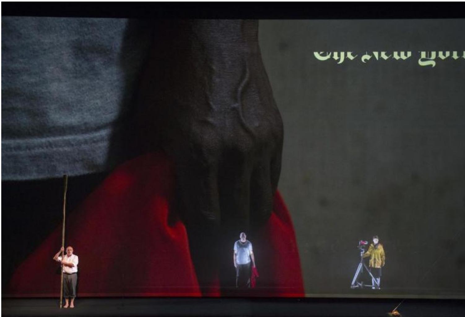
Das FloÃ der Medusa, regia di Romeo Castellucci, Dutch National Opera, ph. Monika Rittershaus.

Possiamo dire che la telecamera di Morte sia connessa a un dispositivo filmico della messa in scena?