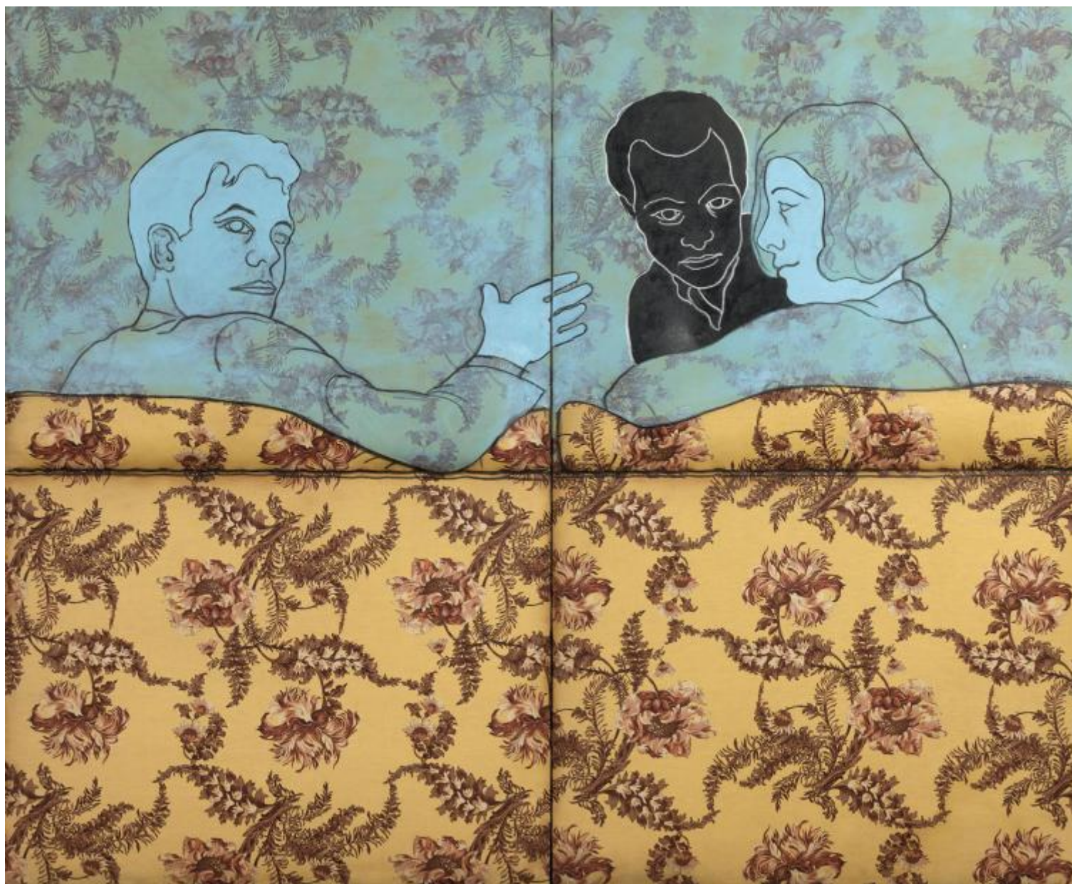
Sul divano a fiori, pittura su tessuto stampato e rilievo, cm 160x200 (due elementi) Collezione Maramotti, Reggio Emilia.

Seguono le opere morbide del Tacchi più conosciuto, i suoi quadri imbottiti e coloratissimi, fatti di stoffe da tappezziere (di per sé un meraviglioso saggio della cultura di quegli anni), su cui sono tracciate figure a smalto nero; un altro modo per uscire dalla bidimensionalità del quadro usando immagini familiari – gli amici, le icone della storia dell’arte – ma vivificate, insieme intime e pop , “popolari” appunto, ovvero capaci di portare avanti una sorta di tradizione visiva ininterrotta che è insieme culturale e di costume ( Poltrona gialla , 1964; Sul divano a fiori , 1965; La primavera allegra , 1965). E arriva il mitico Sessantotto, un 1968 ancora senza canoni, e arrivano le tappezzerie ‘allegre’, iconiche, parlanti, già opere-oggetto, che lasciano il posto ad altre opere-oggetto, questa volta impossibili.