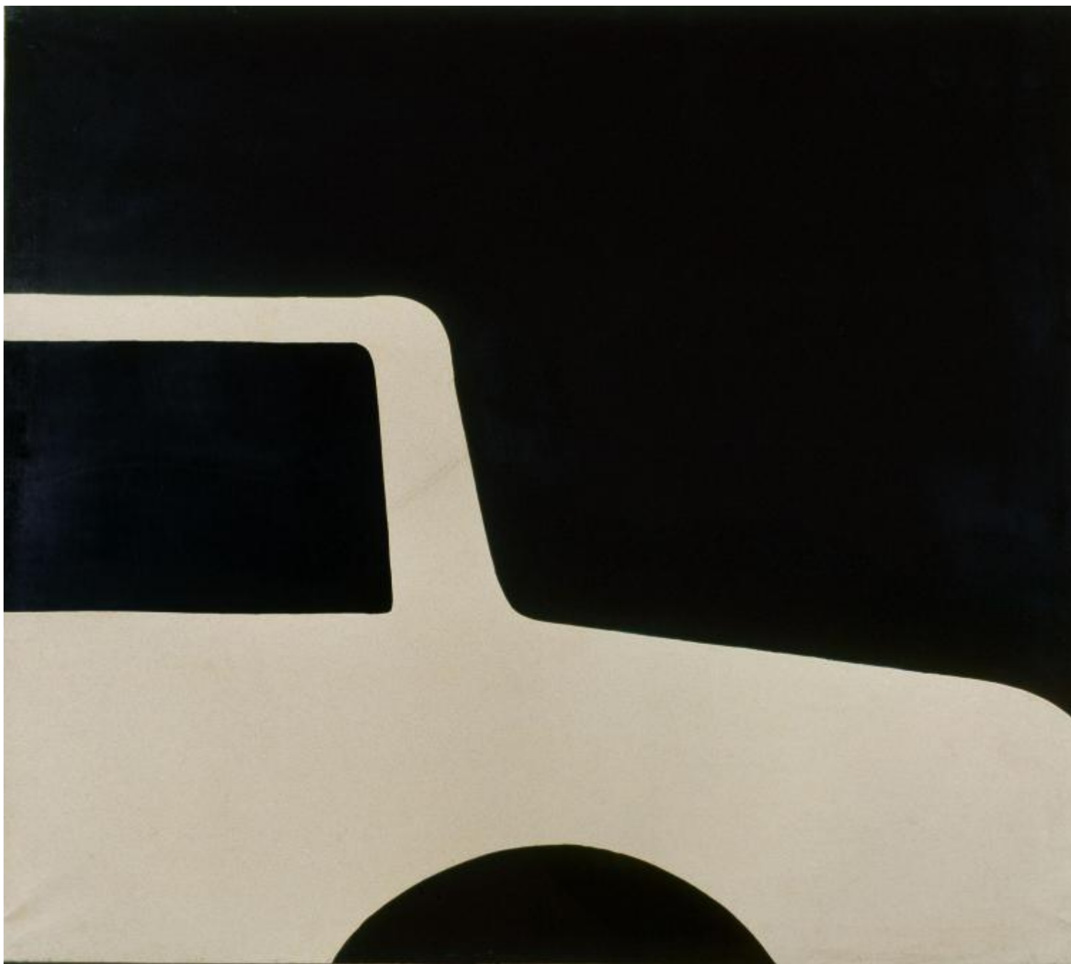
Struttura bianca su nero, 1962 Smalto su carta intelata, cm 122x140, Collezione privata, Roma, Foto Salvatore Piermarini - Archivio Cesare Tacchi.

Non solo. Al di là della completa cronologia iniziale che fa da introduzione e guida al pubblico, visitando questa mostra, chi gli anni Sessanta un po' li conosce perché li ha vissuti, li ha letti, li ha studiati, li rivede e li supera attraverso il filtro delle cento opere esposte. Proprio come in un racconto per immagini, di opera in opera, si avverte infatti chiaramente sullo sfondo la storia del paese, specie della sua capitale, una città effervescente, fatta di decadenza e di avanguardia, poi compresa nei decenni controversi degli anni Settanta e Ottanta, e infine odierna (per quanto l'oggi nelle opere di Tacchi appaia comunque osservato nella prospettiva degli anni Sessanta, attraverso quello che allora si andava conquistando e perdendo).