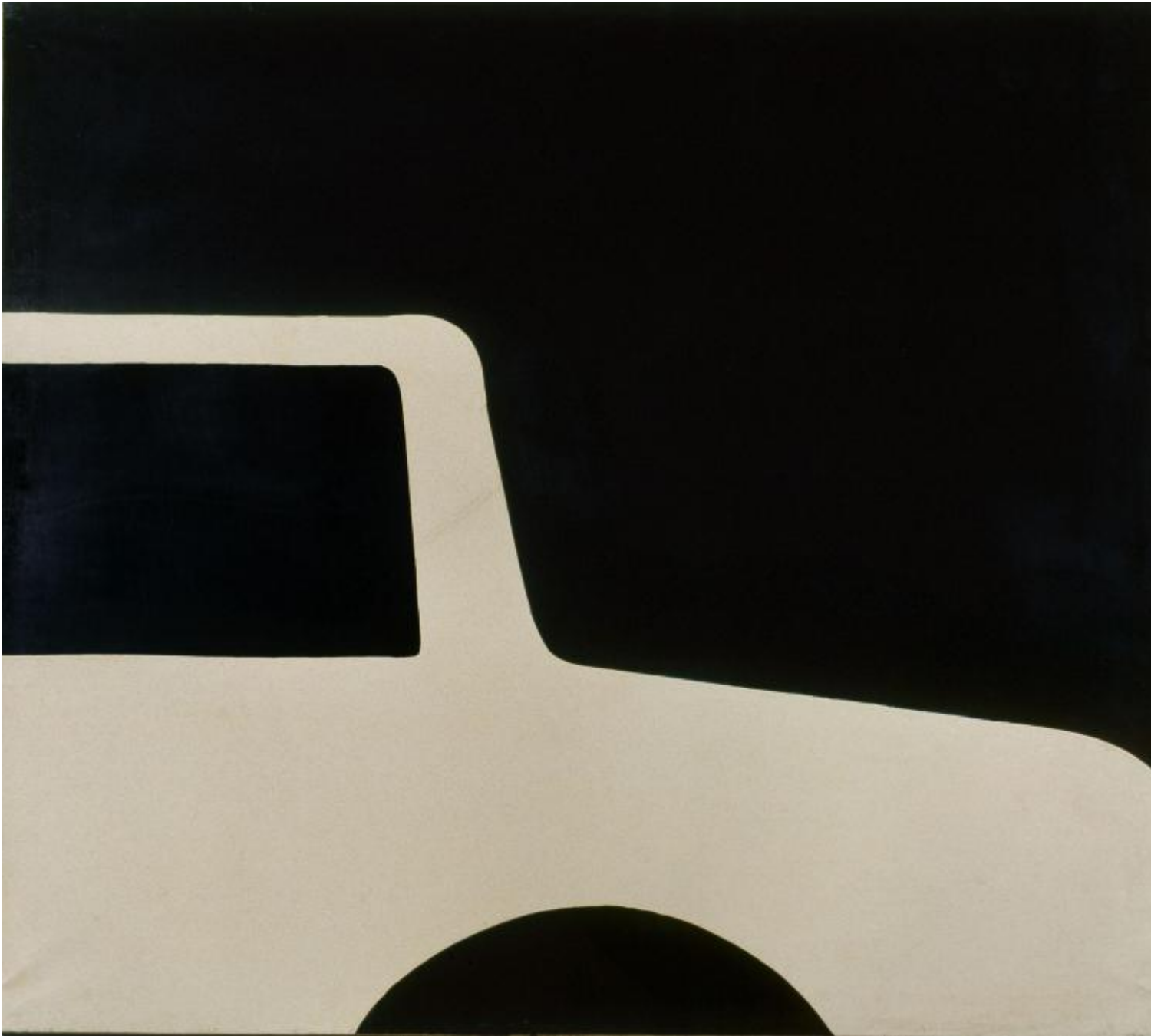
Struttura bianca su nero, 1962 Smalto su carta intelata, cm 122x140, Collezione privata, Roma, Foto Salvatore Piermarini - Archivio Cesare Tacchi.

Non solo. Al di là della completa cronologia iniziale che fa da introduzione e guida al pubblico, visitando questa mostra, chi gli anni Sessanta un po' li conosce perché li ha vissuti, li ha letti, li ha studiati, li rivede e li supera attraverso il filtro delle cento opere esposte. Proprio come in un racconto per immagini, di opera in opera, si avverte infatti chiaramente sullo sfondo la storia del paese, specie della sua capitale, una città effervescente, fatta di decadenza e di avanguardia, poi compresa nei decenni controversi degli anni Settanta e Ottanta, e infine odierna (per quanto è oggi nelle opere di Tacchi appaia comunque osservato nella prospettiva degli anni Sessanta, attraverso quello che allora si andava conquistando e perdendo).