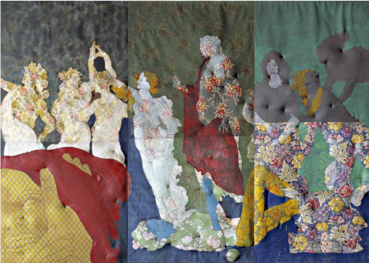
La primavera allegra, 1965 Pittura su tessuto stampato e rilievo (smalto, pastello, pennarello, 6 diverse stoffe cinque stampate e una tinta unita, filo per cucire, chiodi, capoc, cerniere metalliche, legno), tre elementi, misure complessive, cm 210x301x8. Collezione Maramotti, Reggio Emilia.

Il mestiere resta lo stesso ma il panorama Ã¨ cambiato. Gli anni Settanta hanno debuttato con qualche mese di anticipo e Tacchi comincia a soffermarsi sulla negazione: una poltrona su cui non ci si puÃ² sedere, una cornice senza quadro, una porta che non si apre ( Porta nera , 1967; Cornice , 1968), e dei progetti (realizzati con Nanni Caione, 1968) immaginifici e bellissimi in cui il disegno, le note di lavoro, sono puntuali ricordando l'ossessione progettuale di Francesco Lo Savio ma animati dall'intenzione di agire su un immaginario ormai afflitto dal dire, dal far vedere e dall'utile creando esperienze, habitat, spazi e visioni idealiste, vivaci e geniali, anche perchÃ© spesso irrealizzabili. E nelle sale seguenti gli anni Settanta incontrano gli Ottanta (perchÃ© negli anni Settanta si dipingeva, mentre negli anni Ottanta la pittura era anche concettuale, e il pittore era anche performer ): alla base di tutte queste operazioni c'Ã¨ sempre lâ€™immagine, ricalcata, minutamente descritta o invece sagomata, cancellata o rivelata ( Disegni da Painting , 1975; Secretaire , 1980, Defogliato , 1995).