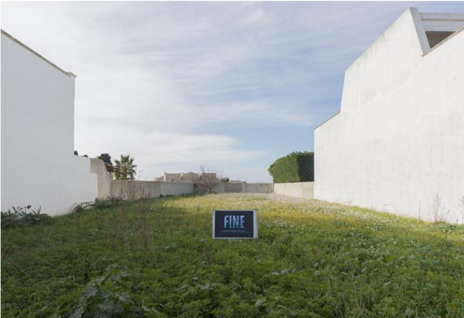
Nuvola Ravera, Fine.