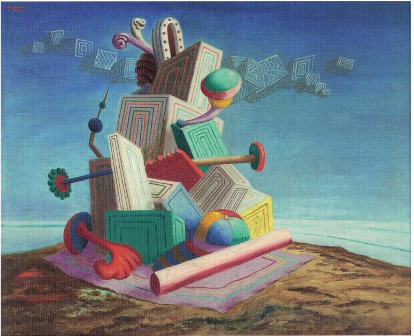
Alberto Savinio, Tombeau d'un roi maure , 1929, olio su tela, Patrimonio Unipol Gruppo Bologna.

Nell'introduzione a Capitano Ulisse — testo scritto nel 1925 per il Teatro dell'arte di Pirandello, edito nel 1934 e rappresentato solo nel 1938 — Savinio conduce Ulisse per mano sul palcoscenico e dietro le quinte del teatro romano dell'Odescalchi, secondo la sua abitudine di far camminare nel presente dei ed eroi del mito antico, e lo introduce all' Avventura Colorata : questa la sua definizione del teatro che — scrive — gli "è venuta da sé, senza che egli si sognasse di cercarla. Nell' Avventura Colorata l'attore «riesce a mutare con lievissima contrazione dei muscoli il colore della pelle. Passa a scelta da uomo rosso a uomo turchino, giallo, verde e così via. Peli e unghie se li fa spuntare a vista d'occhio. Da uomo diventa donna e reciprocamente». La forza del teatro sta nei colori che devono essere «vivi, orgogliosi, mordenti» e agire come il blu di metilene sui microbi sotto la lente del microscopio. Il progetto di Savinio di rinnovare il teatro si "è per" rivelato un'illusione: il teatro italiano per il momento non accoglie Savinio, l'Odescalchi fallisce, il teatro si trasforma in una recita tetra in bianco e nero e lo stesso Pirandello nella sua serietà è diventato nero ( La verità sull'ultimo viaggio , in Capitano Ulisse , Adelphi, Milano 1995).