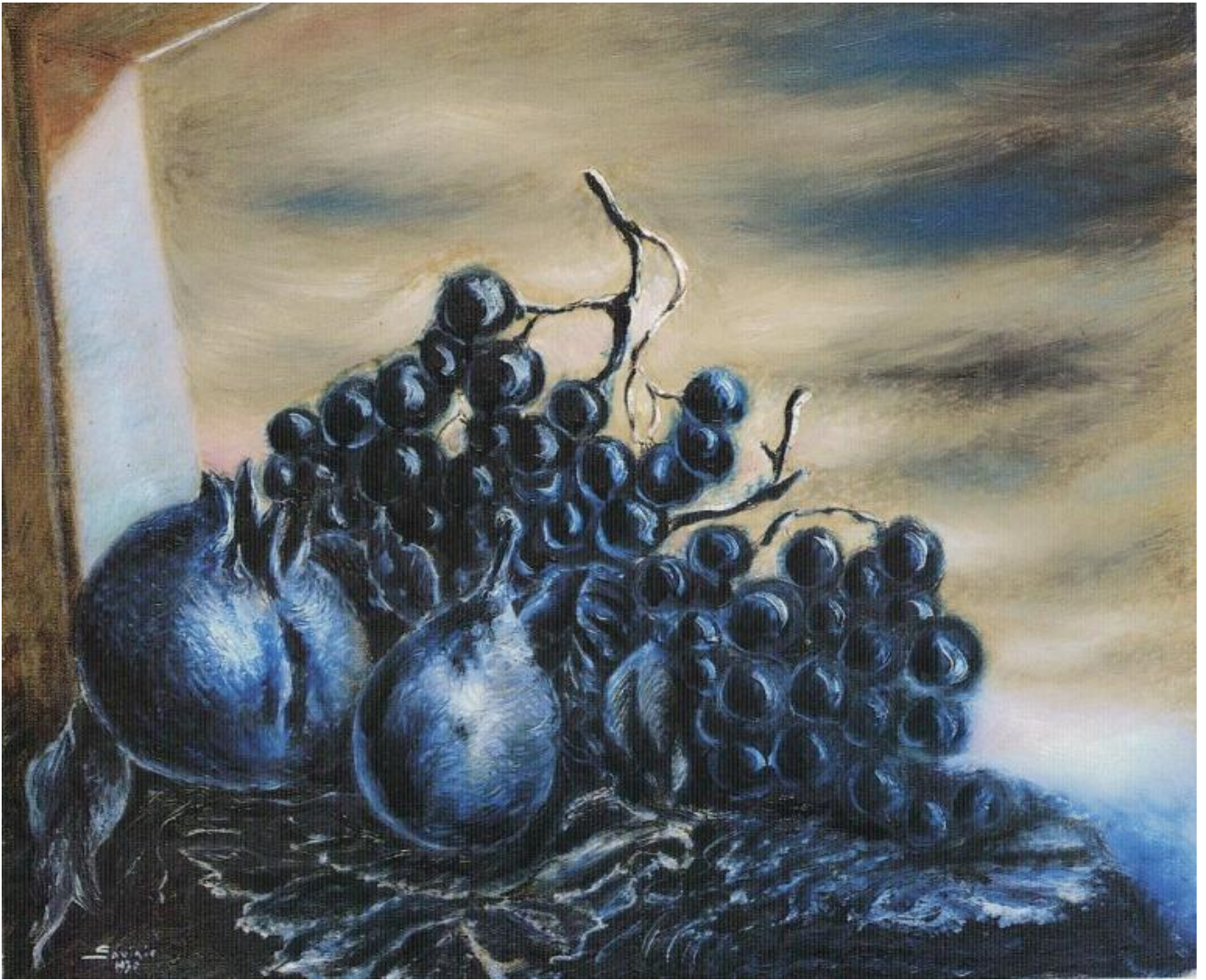
Alberto Savinio, Nature morte bleue , 1930, olio su tela, Collezione privata.

Nell' Autopresentazione a una mostra alla Galleria Il Milione a Milano nel 1940 Savinio descrive il suo lavoro di pittore. Afferma di voler dipingere sempre meglio, ma non per descrivere in modo piÃ¹ aderente la realtÃ fenomenica, Â«anzi per sempre piÃ¹ staccare la "cosa" dipinta dalla cosa reale, per implicarla in sÃ©, per isolarlaÂ», vuole Â«dipingere sempre piÃ¹ forteÂ», Â«portare con ogni mezzo la "cosa" dipinta al suo massimo di intensitÃ Â», Â«far "cantare" la parola pittoricaÂ». Di tale impostazione teorica antinaturalistica fanno dunque parte gli uomini con teste di animali, ispirati alla metafisica ironica di Weininger, e la possibilitÃ di dipingere una natura morta blu. Il fondo dei quadri deve essere per lo piÃ¹ nero, e il nero ha, secondo Savinio, la stessa funzione dell'oro nei quadri medievali: nel bellissimo Objets dans la forÃªt dipinto nel 1927-28 gli oggetti colorati si stagliavano sullo sfondo inquietante di una foresta grigia.