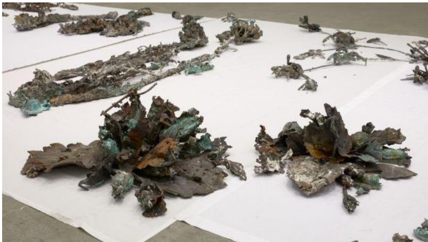
Abbas Akhavan, Study for a monument , 2016.

Sono 'opere di pensiero' dunque; il loro fine non è puramente estetico, ma più propriamente etico, sociale e politico, sono opere che raccontano storie e resistono – o forse esistono proprio per resistere – alla banalità degli stereotipi su questioni diffuse quali migrazione, dislocazione, storia, società, architettura, geografia e soprattutto, infine, geometria ; quest'ultima assume particolare rilievo interpretativo, perché la curatrice se ne serve come fil rouge del pensiero logico alla base dell'allestimento.