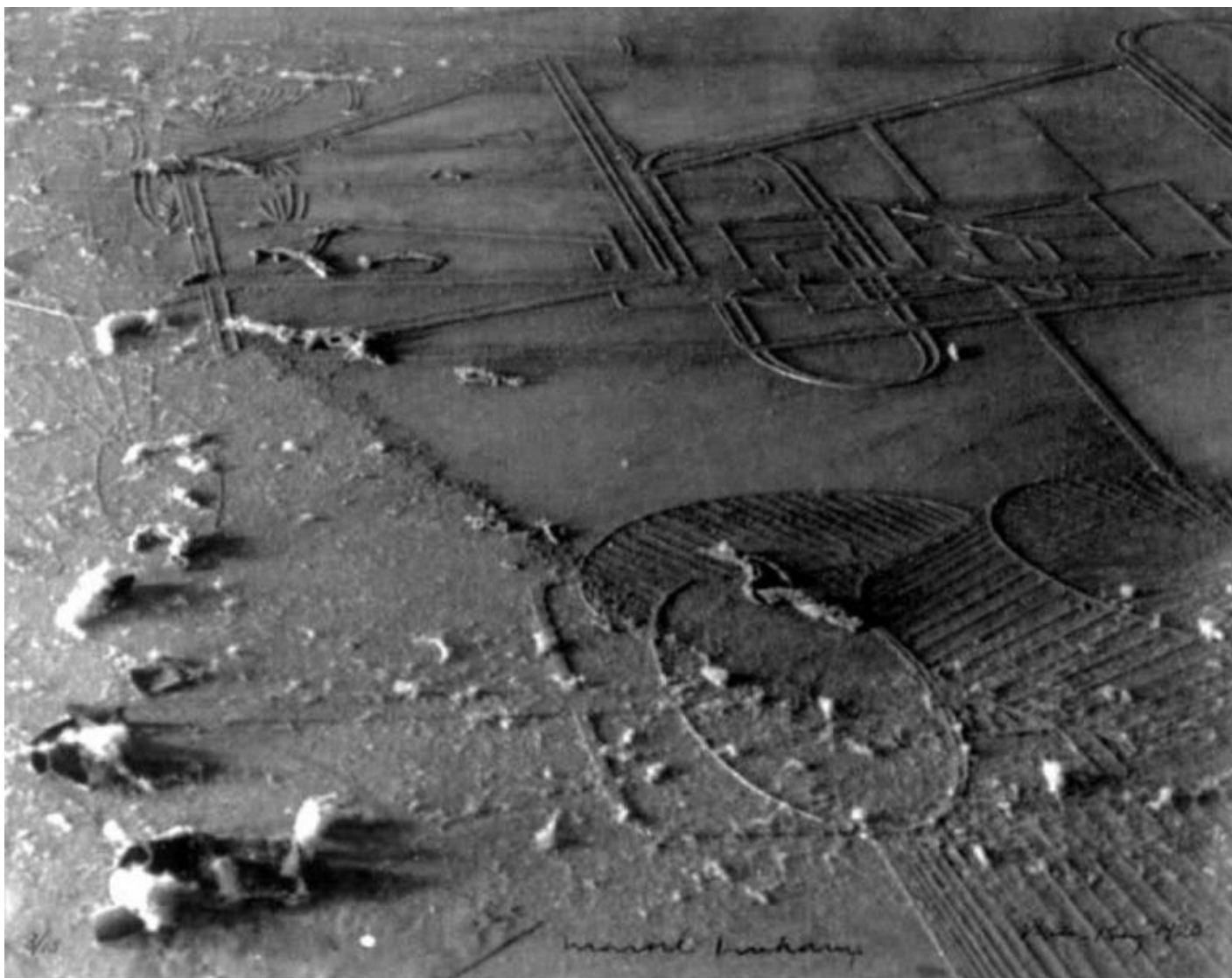
Man Ray, Allevamento di polvere , 1920, dettaglio grande vetro Duchamp.

Gli elementi dell'installazione sono molteplici: 354 volumi a stampa di un libro d'artista di 1.312 pagine, 177 scaffali di metallo e un piedistallo; infine, un video (a colori e sonoro, 120 min.) a documentare una performance; si tratta di un lavoro molto lungo e complesso. A prima vista, c'è una lunga parete bianca, tappezzata di libri bianchi e spessi, 'taglio lungo' a vista, posti in una sequenza temporale continua, ma è necessario avvicinarsi per capire meglio, per intuire . Per rendersi conto che ogni volume presenta fotografie invisibili – non le vediamo, ma le possiamo immaginare , nei particolari – che ci figuriamo mentalmente, ognuno a proprio modo, grazie alle didascalie tratte da un taccuino di appunti, il memoir di Abdallah Farah, un fotografo di cartoline libanese (nato dalla fantasia degli artisti per esigenze del dispositivo narrativo) che ha scattato quelle immagini – centinaia di rullini mai sviluppati, effacées – per registrare e testimoniare i cambiamenti culturali e politici che hanno investito Beirut, negli anni successivi alla guerra civile, iniziata nell'aprile del 1975 . Per approfondire la questione della impotenza delle immagini nella storia, gli artisti raccontano anche Wonder Beirut , il progetto di decostruzione narrativa, politica e performativa entro cui Latent Images rientra, e che dice: esisto, anche se non mi vedi .