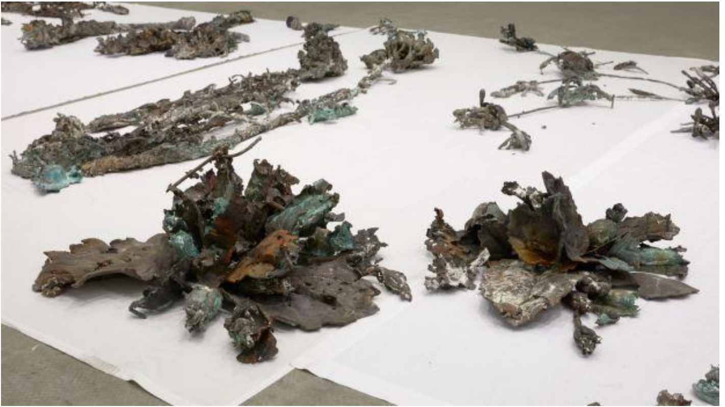
Abbas Akhavan, Study for a monument , 2016.

Sono 'opere di pensiero' dunque; il loro fine non Ã¨ puramente estetico, ma piÃ¹ propriamente etico, sociale e politico, sono opere che raccontano storie e resistono â?? o forse esistono proprio per resistere â?? alla banalitÃ degli stereotipi su questioni diffuse quali migrazione, dislocazione, storia, societÃ , architettura, geografia e soprattutto, infine, geometria ; quest'ultima assume particolare rilievo interpretativo, perchÃ© la curatrice se ne serve come fil rouge del pensiero logico alla base dell'allestimento.