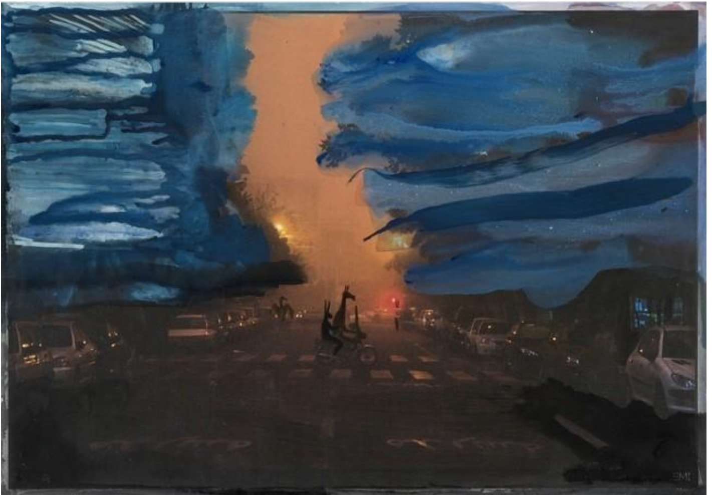
Rokni Haerizadeh, But a storm , 2014.

Ci Ã² che conta Ã² il tentativo di dire e, in questo caso, di fare; nonostante le difficoltÃ² e i limiti irriducibili, la balbuzie di un linguaggio, poetico e artistico che sia: senza dubbio qualcosa andrÃ² perso, ma anche molto, di quel gesto, si salverÃ². La bellezza salverÃ² questa terra martoriata e benedetta? Tutta questa arte, sarÃ² finalmente utile?