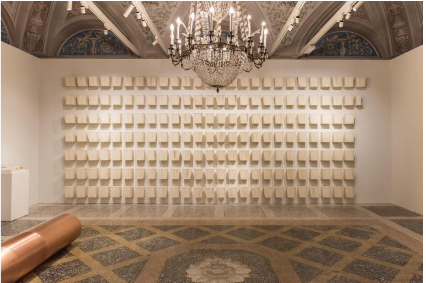
Joana Hadjithomas and Khalil Joreige, 2015.

L'intento principale della mostra Ã" quello di Â«mettere in luce la formazione del presente riconoscendo allo stesso tempo l'influenza attiva esercitata dal passatoÂ», attraverso la rimessa in discussione, da parte di questi artisti, di una veritÃ oggettiva capace di interpretare adeguatamente la realtÃ . Verosimilmente, AbÃ« l-WalÃ«d MuÃ , Yammad Ibn Ê¼AÃ , Ymad Ibn Rushd â?? AverroÃ per l'Occidente latino, fu anche il primo a formulare una teoria dell'immaginazione , ponendola originariamente nella problematica duplicitÃ del soggetto dell'intellezione, suggerendo che la forza del pensiero logico sarebbe nulla, senza virtus imaginativa . Proprio su questa imaginatio si gioca la creazione di queste opere d'arte, perchÃ© il seme dell'idea che portano, giunga a compimento.