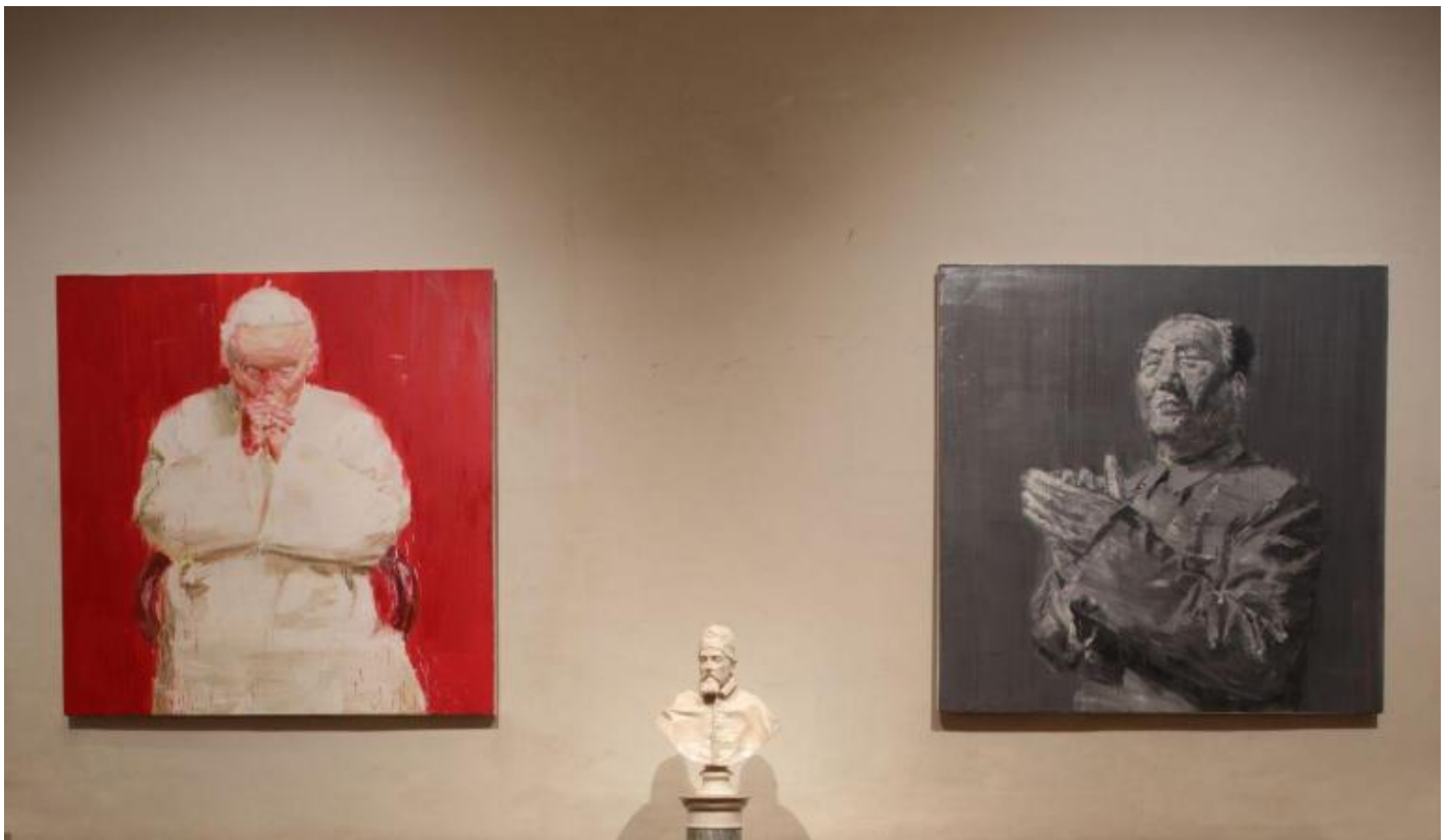
Ph Alberto Novelli, preview.

La storia dell'arte dei manuali ci insegna che, dal Cinquecento, ritratto e autoritratto si arricchiscono di aspetti interiori e che il secolo che affina l'osservazione della psiche è il Novecento. Cosa accade allora se oggi si guardano ritratti e autoritratti dal Cinquecento ai nostri giorni in un contesto forte e connotato come quello di Palazzo Barberini? Accade che si aprano suggestioni inaspettate. L'immagine è ovunque. Non solo, come normalmente dovrebbe essere, nelle sale di un museo, in una mostra, in un palazzo nobile di rappresentanza, ma di più. Di sala in sala si riflette sul funzionamento dell'immagine, sul vedere e sul rappresentare. Risulta evidente, ad esempio, nell'accostamento tra Il Nudo femminile di schiena di Pierre Subleyras e i nudi SBQR , netnud , etc. di Stefano Arienti, lo slittamento percettivo tra l'immagine della nudità e dell'intimità dal privato al pubblico, oppure ci si sorprende di fronte alla concettualità della Fornarina di Raffaello che, mostrando la donna, riesce a mostrare in absentia l'uomo, il pittore, unendo ritratto e autoritratto.