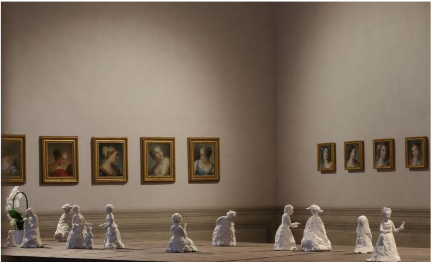
Ph Alberto Novelli, preview.

Si aggiungono, questa volta nelle sale del MAXXI, La Velata di Antonio Corradini e VB74 di Vanessa Beecroft, portandoci a riflettere sulla nudità tra grazia e peccato, incoscienza e coscienza. Di opera in opera, continua il dialogo tra moderno e contemporaneo, eco e narciso, mito e realtà, figure speculari, modelli sociali e di genere, ritratti e autoritratti sorprendente accostamento tra il Papa e Mao di Yan Pei-Ming al ritratto di papa Urbano VIII di Gian Lorenzo Bernini rivelando in ogni sala una cosa inaspettata, una malinconia, uno shock visivo, un'inquietudine.