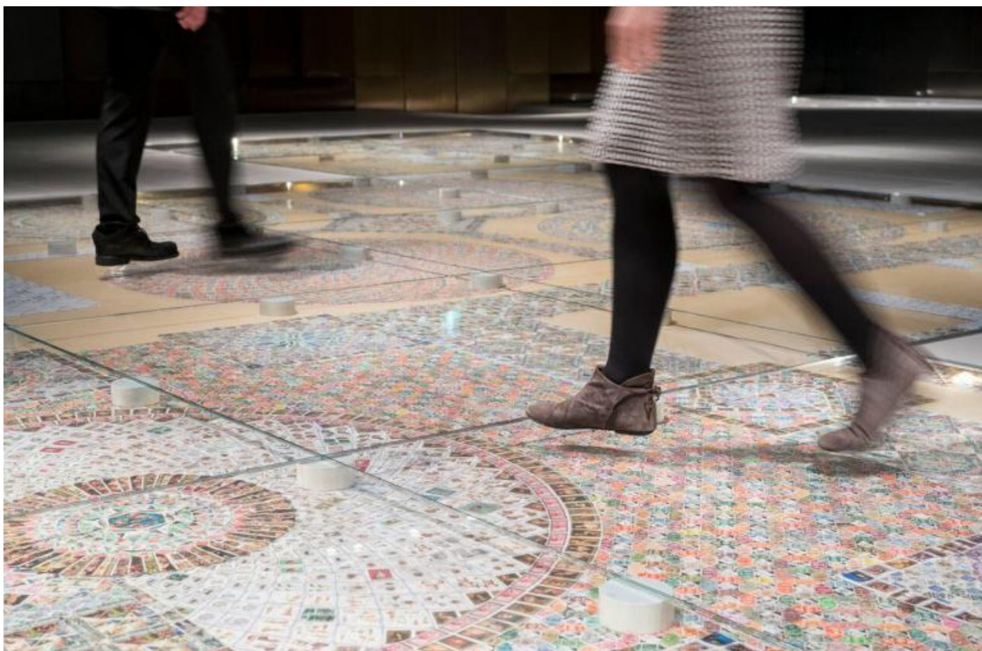
Greetings from Venice.

gestibili. Collezionare francobolli equivale a pretendere di catalogare il mondo, in formato ridotto: a partire dalle sue categorie fondanti, la storia e la geografia.