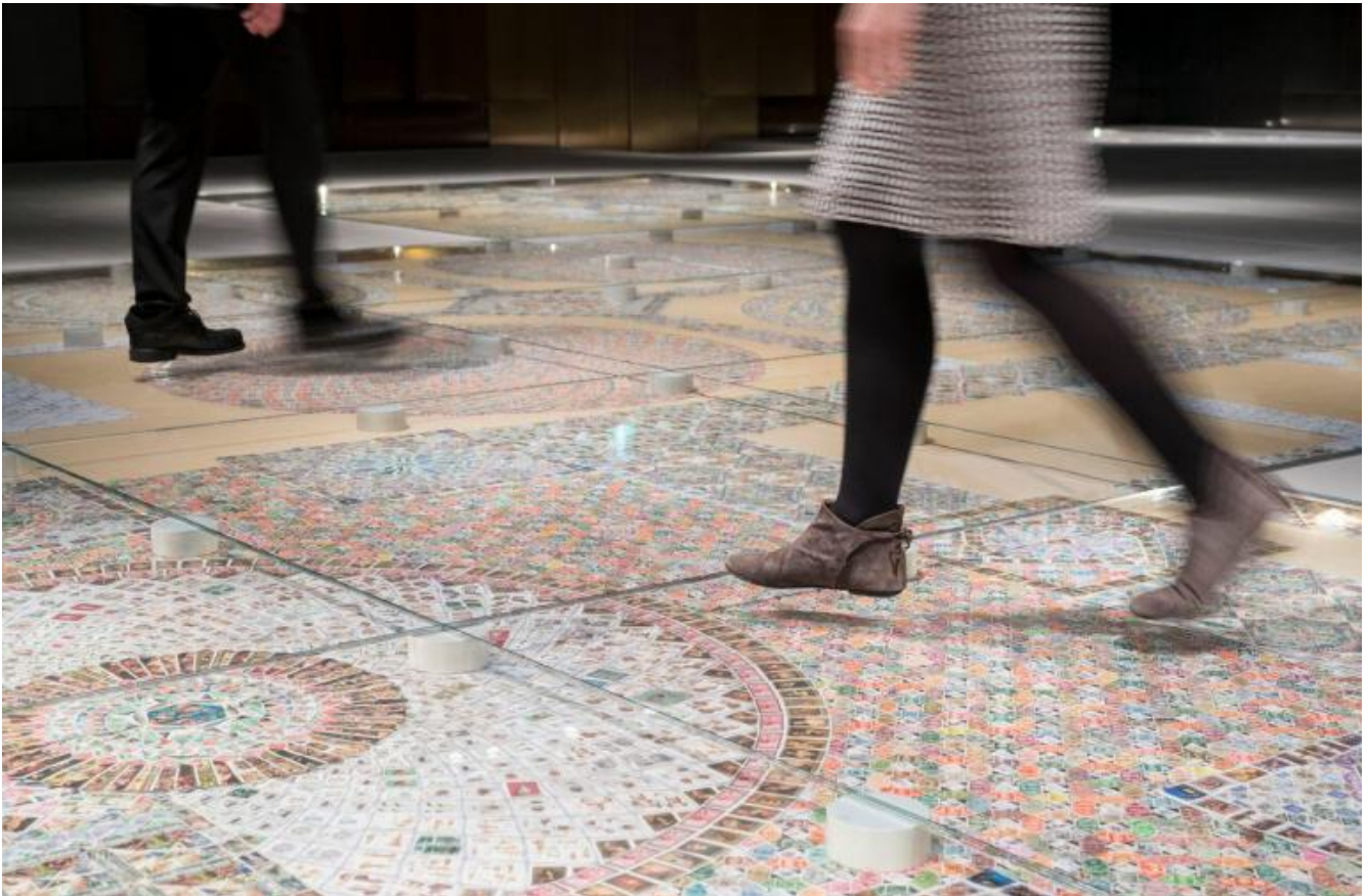
Greetings from Venice, ph Matteo De Fina.

mondo, scelte e riconosciute e nominate una per una con delicatezza e precisione amorosa». La filatelia non è che un metodo illusoriamente abbreviato, a misura d'infanzia appunto, con cui ci s'illude di appropriarsi di uno scibile umano racchiuso entro proporzioni in apparenza gestibili. Collezionare francobolli equivale a pretendere di catalogare il mondo, in formato ridotto: a partire dalle sue categorie fondanti, la storia e la geografia.