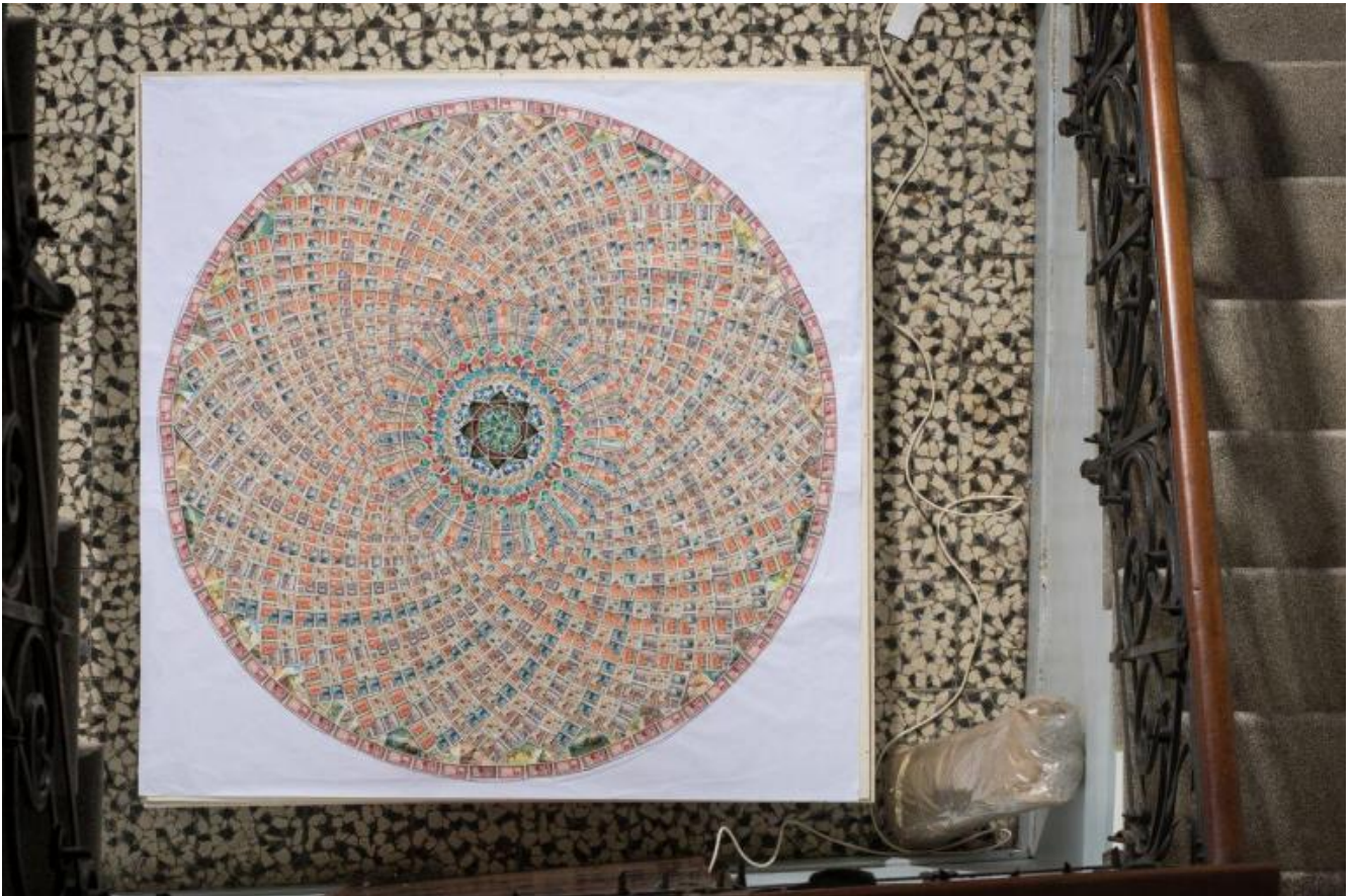
Greetings from Venice, ph Francesco Allegretto.

network globale che è la Rete. E sopravvive allora, ricondotta alla sua matrice malinconicamente individualista, solo come ossessione privata, liturgia familiare, memoria di repertori luttuosamente conclusi (l'ascetismo associato al nomadismo, celebrato già in Evans da Bruce Chatwin; ma lo stesso Boetti - ha testimoniato la figlia Agata - concepiva le sue lettere come un modo introvertito e compensatorio, quasi à la Raymond Roussel, di "vedere" il mondo: «se la gente non viaggia, le lettere lo fanno al loro posto»).