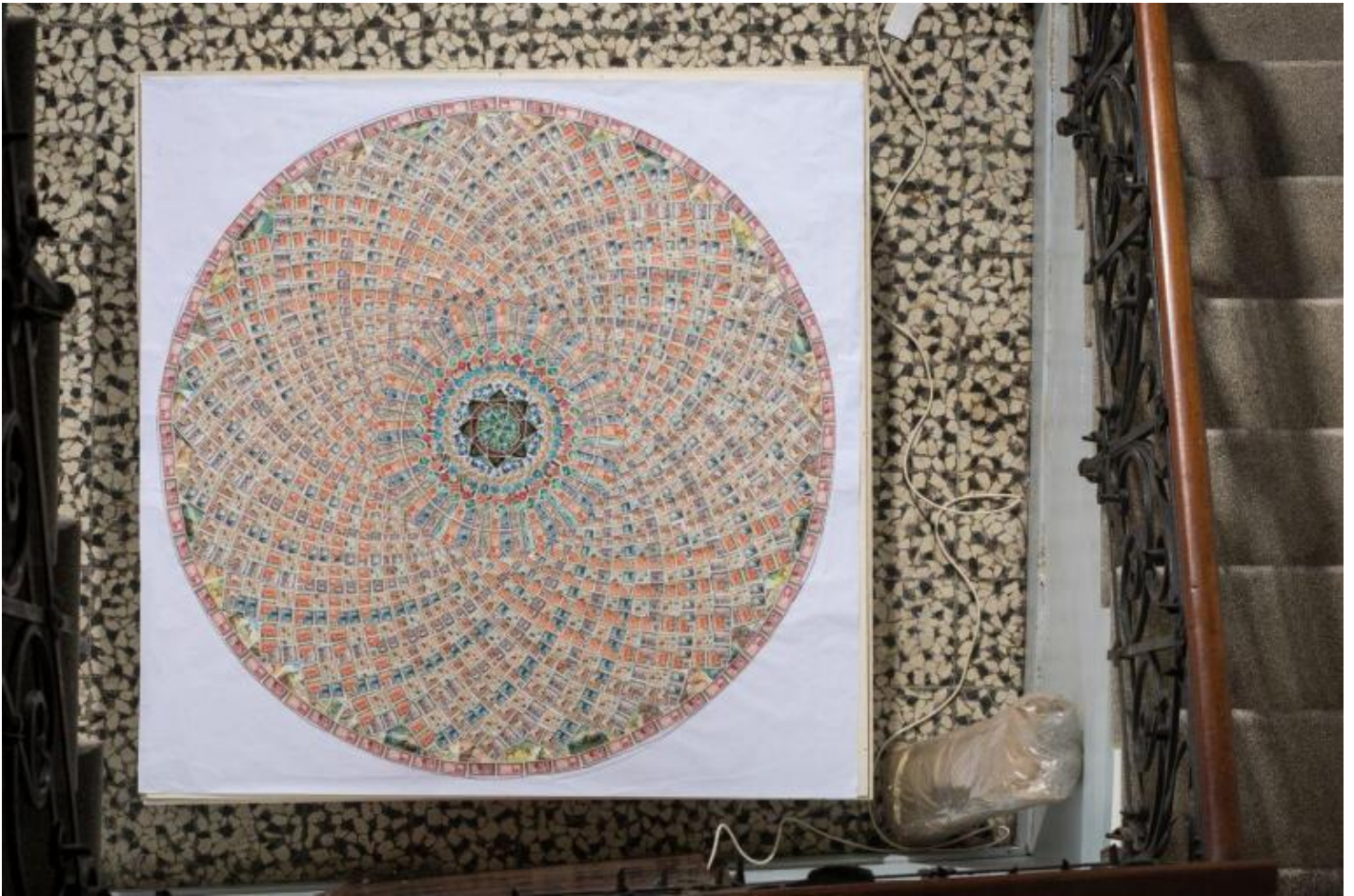
Greetings from Venice