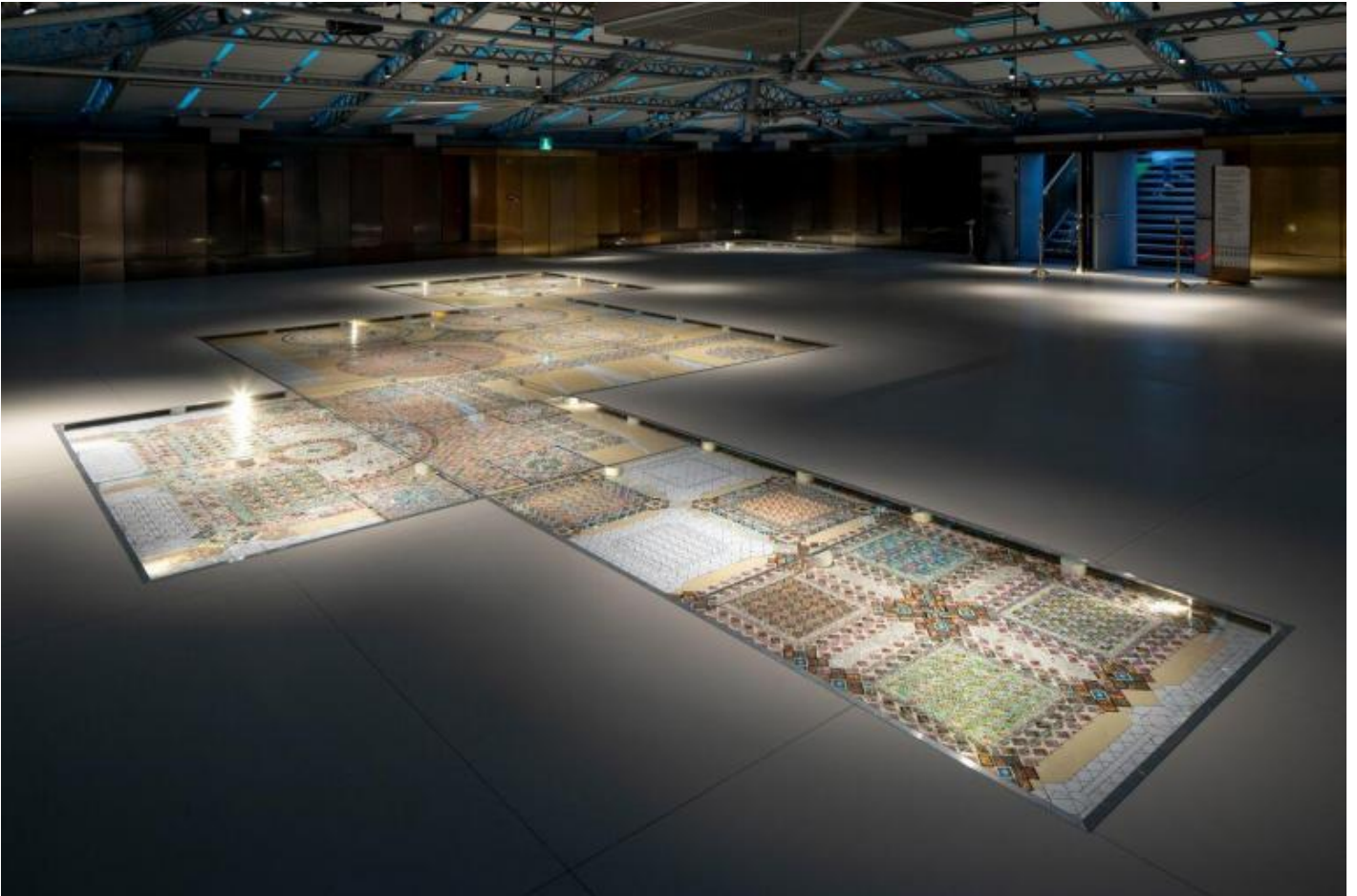
Greetings from Venice, ph Francesco Allegretto.

Già le sedi dei rispettivi interventi la dicono lunga sulla distanza fra i due temperamenti, prima che fra le loro opere. Lo scenario di Bazzano, dimesso e pressoché dismesso, allude a una storia opacizzata e «rientrata», sconfitta e denegata, che ci appare come un revenant persecutorio; il d'Accor squillante di colori e cartellini di prezzi del centro commerciale, che per raggiungere il lavoro di Venezia tocca attraversare (un po' come il serpentone in autogrill, per guadagnare la zona dei bagni), dice di un presente assoluto e ostentatamente spensierato. Il titolo di Favelli è tetramente suprematista e rinvia a una storia tragica, quello di Di Maggio ironizza sull' exploitation a stereotipo turistico di un territorio non meno carico di storia.