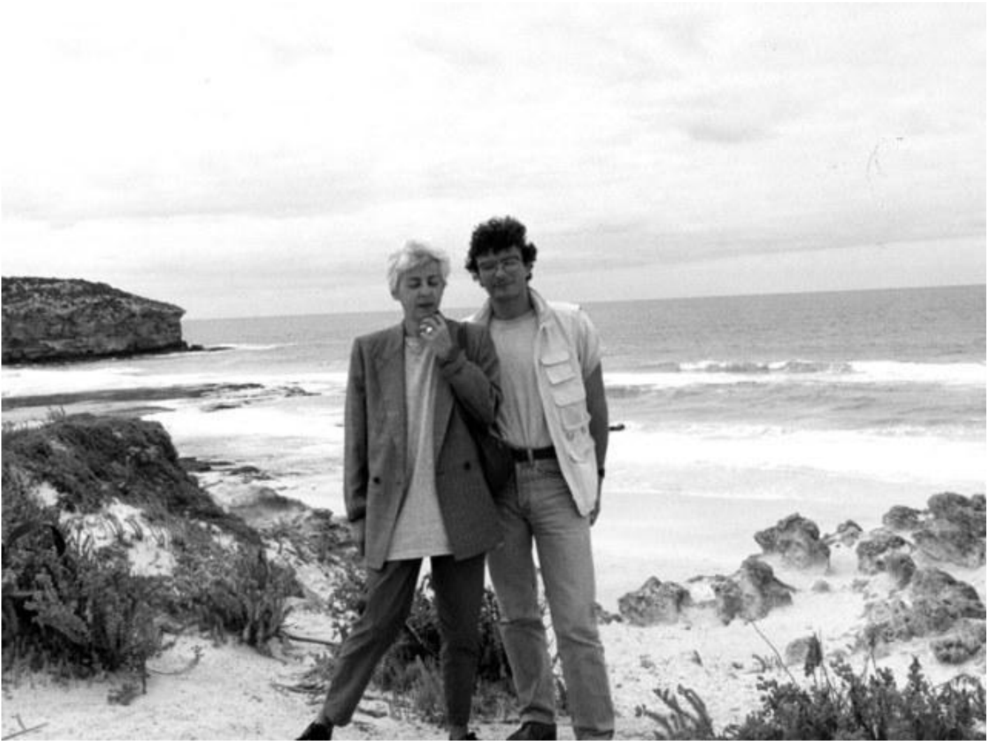
Fabrizia Ramondino con Mario Martone