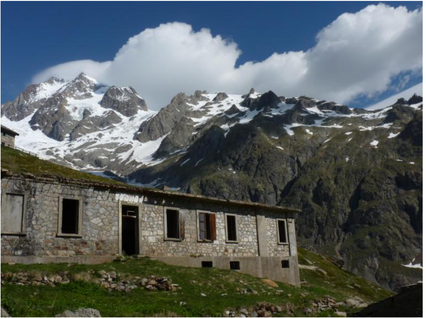
La caserma Seigne, sullo sfondo Laguille de la Trelatete.

Il miglior modo per lâ?escursionista di camminare e vedere la Val Veny non Ã? perÃ² seguire la mulattiera militare che costeggia la piana del lago Combal e poi sale al rifugio Elisabetta. Consiglio di compiere il giro circolare Arp Vieille desot, Mont Fortin, Colle des Chavannes, Col de la Seigne, rifugio Elisabetta, lago di Combal. Il sentiero Ã? lungo ma il dislivello non Ã? eccessivo, il percorso Ã? molto vario e con ampie vedute sulla catena del Monte Bianco, dallâ?Aiguilles des Glaciers alle Grandes Jorasses. Le rovine del ricovero militare in cima al Mont Fortin, a 2.755 metri, sono un avamposto tra le nuvole, da lâ? si vedono tutte le montagne e i ghiacciai della Val Veny ma anche quelle della Val Ferret e, ancora piÃ¹ lontano, il Rutor e il Gran Paradiso. Nel lasciare il Mont Fortin per dirigersi al Colle, invito a camminare il piÃ¹ possibile sulla cresta, cosÃ¬ da avere sempre il panorama del Monte Bianco sulla destra; sulla sinistra il paesaggio Ã? comunque affascinante: i prati, i piccoli laghi e le rocce fanno pensare ad una brughiera scozzese. Anche in estate la solitudine Ã? quasi certa, e inspiegabile vista la bellezza dei luoghi: ampi orizzonti, montagne immense, cime innevate, declivi vertiginosi, acque come specchi, appena increspate dal vento.