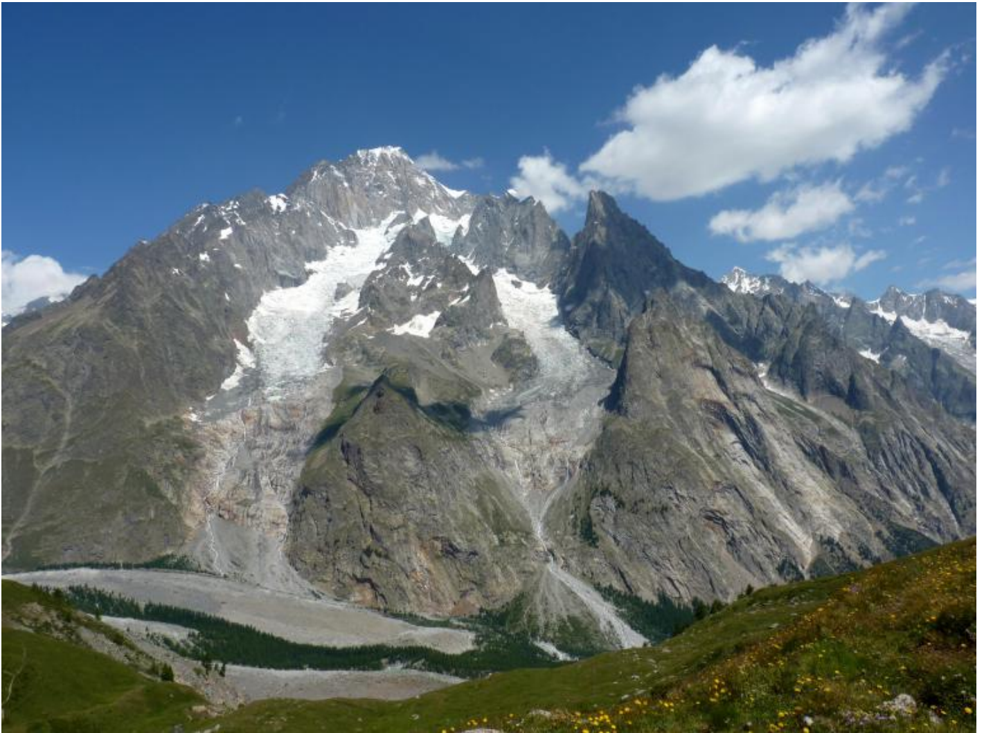
Il massiccio del Monte Bianco visto dalla salita al Mont Fortin.

Malaparte era l'unico proprio nei giorni dell'attacco, nel suo romanzo racconta vicende di fantasia, ma in un contesto storico e ambientale fedele alla cronaca degli avvenimenti. Aveva combattuto nella Grande Guerra, ed era già ferocemente disilluso sul futuro di quell'ultima contesa mondiale.