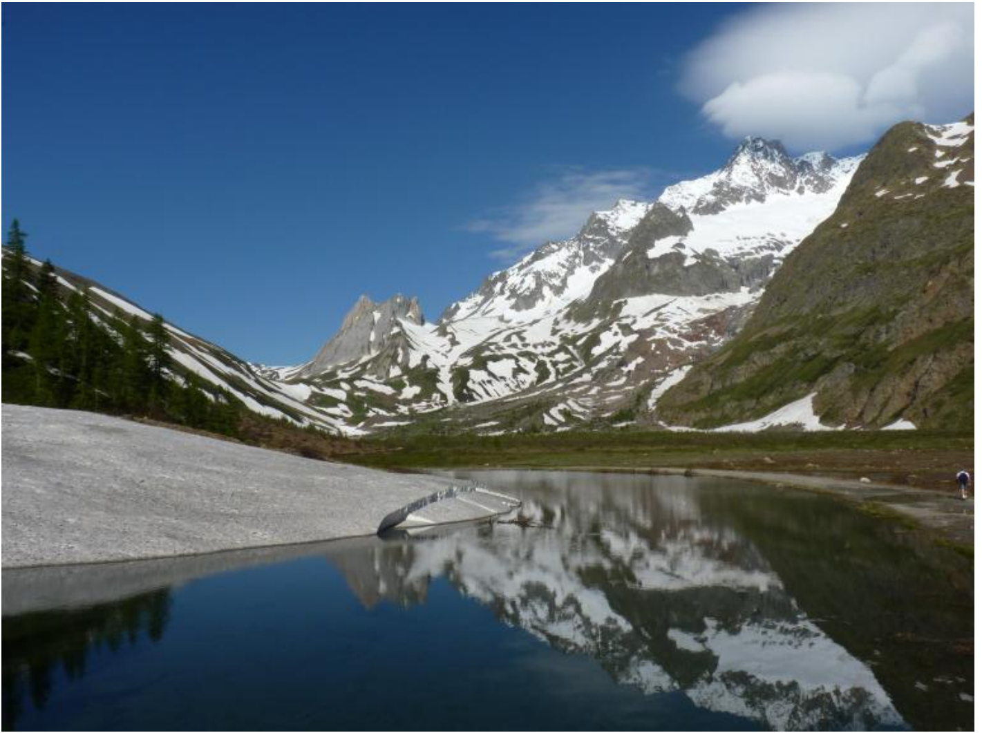
Il lago di Combal sullo sfondo Laiguille des glaciers.

La guerra sul confine italo-francese durò solo quindici giorni, ma costò oltre 600 morti, più di 600 dispersi e 2.600 tra feriti e congelati. Ne scrissero Curzio Malaparte in Il sole è cieco e Mario Rigoni Stern in L'ultima partita a carte e nei primi capitoli di Quota Albania .