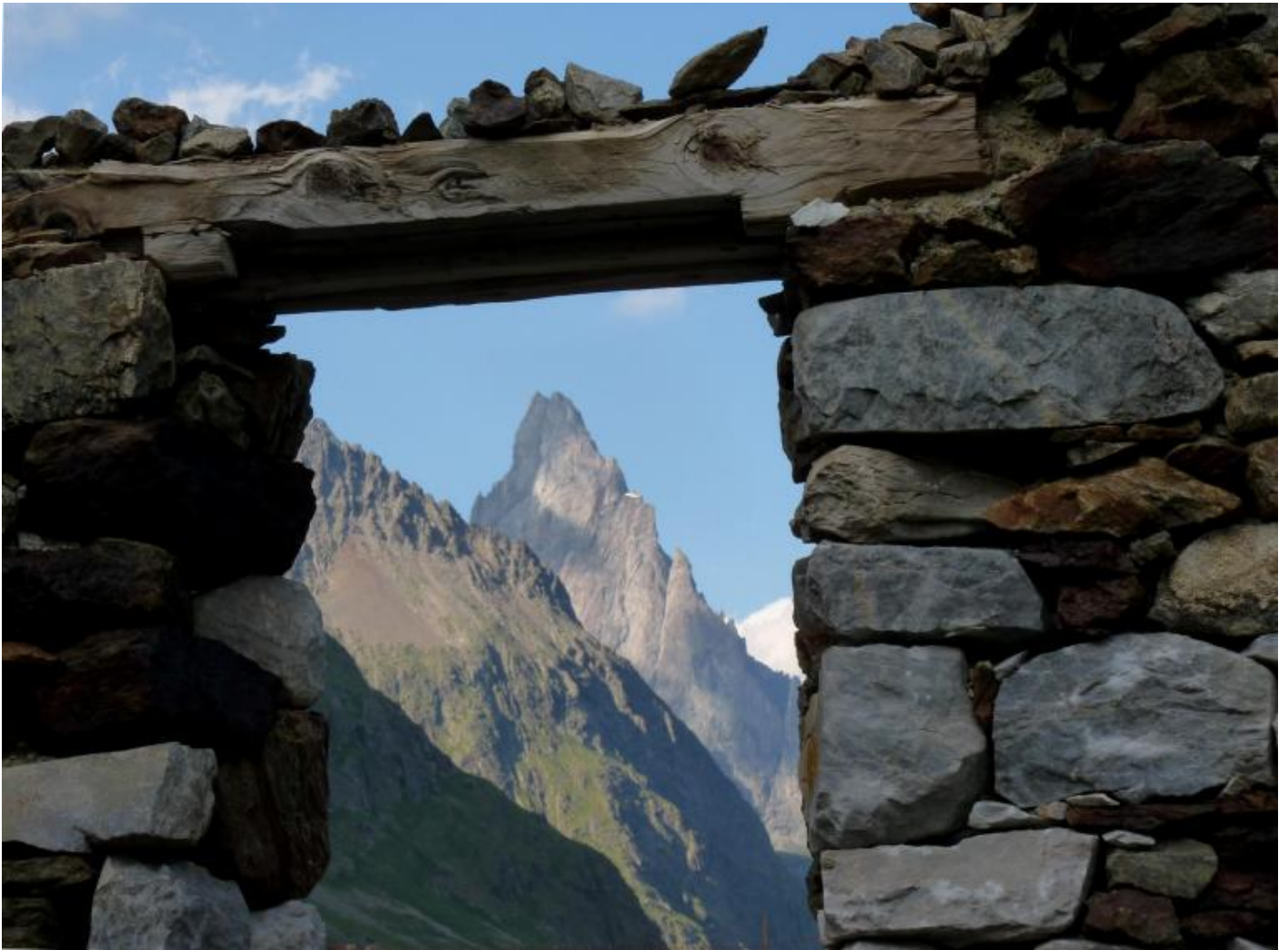
Laguille noire de Peuterey vista dalle rovine sottostanti al rifugio Elisabetta.

Sulle battaglie combattute in quell'angolo di Alpi, vale la pena leggere, purtroppo solo in francese, Les carnets du capitaine Bulle , di Gil Emprin: la biografia del leggendario savoiaro Jean-Marie Bulle, capitano degli explorateurs-skieurs francesi, eroe della difesa contro gli italiani e poi, ancor più, eroe della Resistenza. Morì nei giorni della liberazione di Parigi: si era recato inerme, a trattare la resa di un presidio tedesco presso Albertville, per evitare altre inutili morti tra i civili. Venne invece imprigionato e poi assassinato. Le vicende del capitano Bulle e dei combattimenti del giugno 1940 sono riportate anche in Eclaireurs-Skieurs au combat , di Jacques Boell. Un capitolo è stato tradotto in italiano e fa parte degli scritti raccolti in La guerra della naia alpina , a cura di Rigoni Stern: «?gli alpini portano lâ?offensiva: delle compagnie intere, evitando il Col de la Seigne che credevano minato, passano dal versante nord e si concentrano intorno a Les Lanchettes. Alla nostra artiglieria si presenta un facile bersaglio, i colpi cadono in pieno sulle colonne e, malgrado le gravi perdite, gli alpini dilagano senza sosta nella Val des Glaciers.»