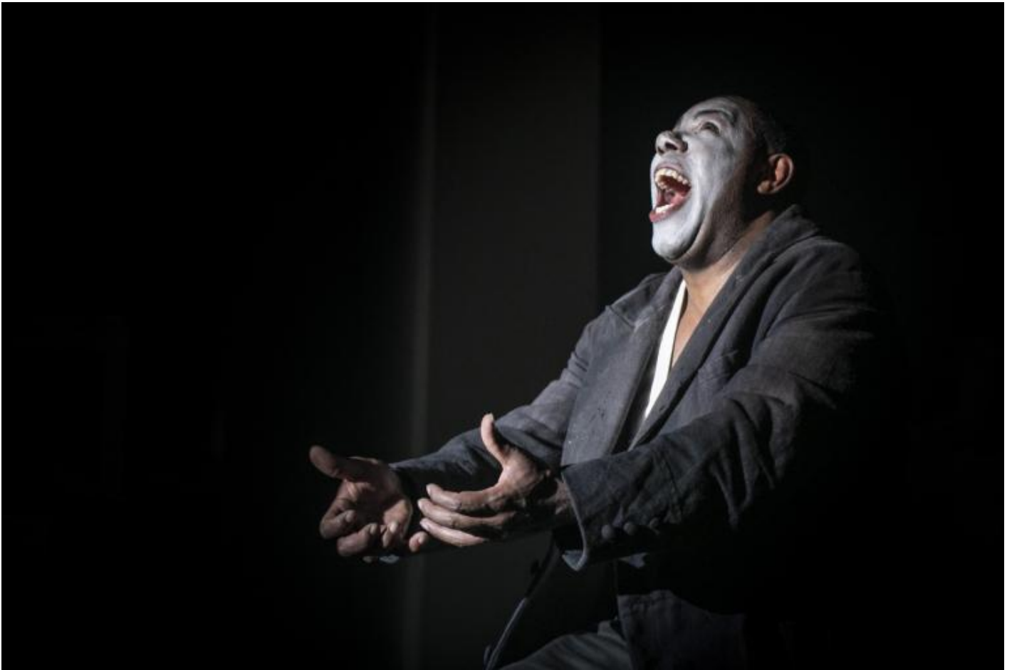
Teatro La Ribalta, Otello.

Il corpo Ã il soggetto psichico per eccellenza, ed erano corpi con il loro linguaggio, con la specificitÃ e la potenza di apertura di quel linguaggio. Certo: coordinati da un movimento ordinato e da coreografie complesse. Ã questo che fanno i professionisti: lavorano a lungo, si trovano ogni giorno, si fanno guidare da maestri di grandi tradizioni e chiedono a loro stessi rigore. Non si cambia il mondo senza rigore, Basaglia lo ripeteva di continuo.