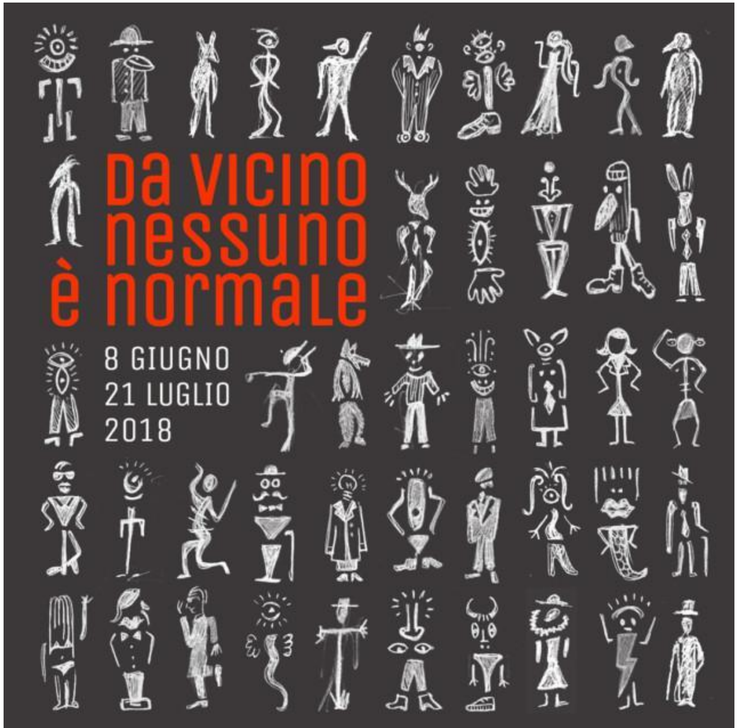
Da vicino nessuno è normale

Chiusi i manicomi, infatti, non sono crollati i muri e l'identità culturale continua a erigersi a difesa: bianco, normale, italiano, sano. Si tratta sempre di quel movimento che pretende di porre alla periferia della società esattamente come l'individuo pone alla periferia di se stesso quello che turba il regolare svolgersi del nostro esistere, quel germe di imprevisto e di inassimilabile.