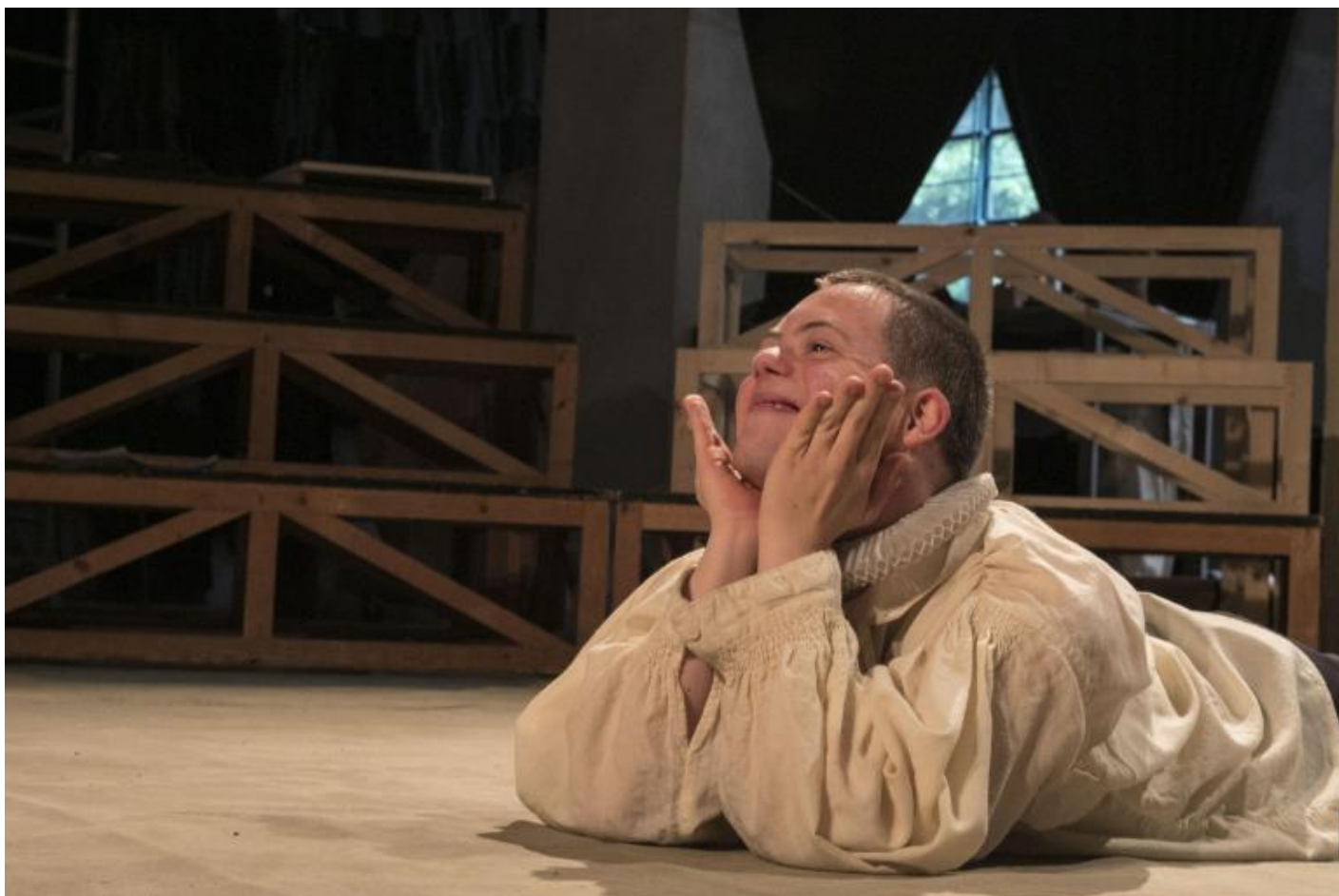
Prove Otello, maggio 2018, ph Vasco Dell'Oro.

Fare teatro, in questa prospettiva, significa non accettare di porsi sotto quel limite che configura spesso il teatro sociale come realtà ricreativa e terapeutica.