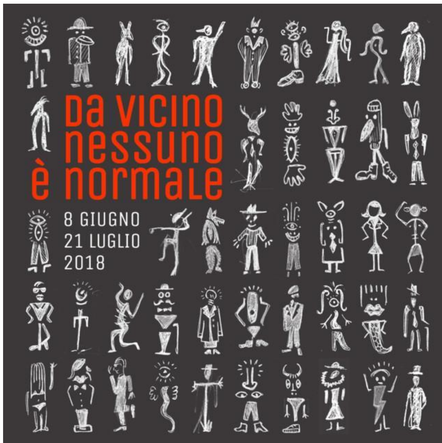
Da vicino nessuno è normale

Chiusi i manicomi, infatti, non sono crollati i muri e l'identità culturale continua a erigersi a difesa: bianco, normale, italiano, sano. Si tratta sempre di quel movimento che pretende di porre alla periferia della società – esattamente come l'individuo pone alla periferia di se stesso – quello che turba il regolare svolgersi del nostro esistere, quel germe di imprevisto e di inassimilabile.