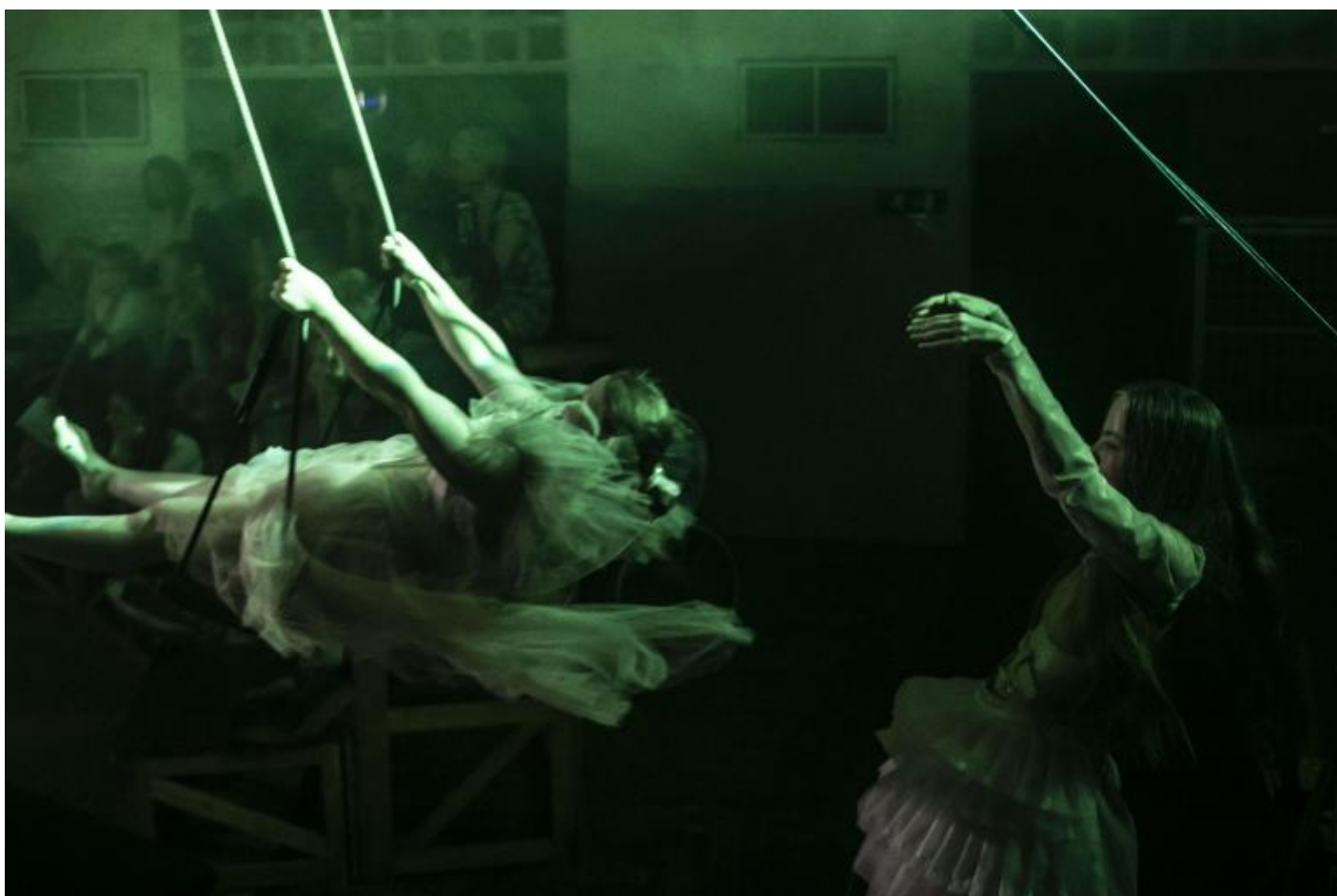
Otello, Allegro Moderato, ph Vasco Dell'Oro.

Antonio Viganò del Teatro alla Ribalta – prima Compagnia teatrale costituita da uomini e donne in situazione di “handicap” che, dopo dodici anni di attività di creazione e formazione, sono diventati attori e attrici professionisti – ha messo in scena un Otello rivisitato, in cui, come è lui stesso a dirci, non è Rodrigo, l'attore, che si è adattato a Otello, il personaggio, ma Otello che si è adattato a Rodrigo.