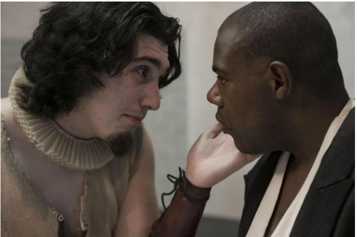
Prove Otello, maggio 2018, ph Vasco Dell'Oro.

Secondo movimento: portare la città in quei luoghi marginali, fare inclusione in periferia, connettere i luoghi dell'esclusione con i luoghi della vita, combinare luoghi e pratiche sanitarie e sociali con luoghi e pratiche culturali.