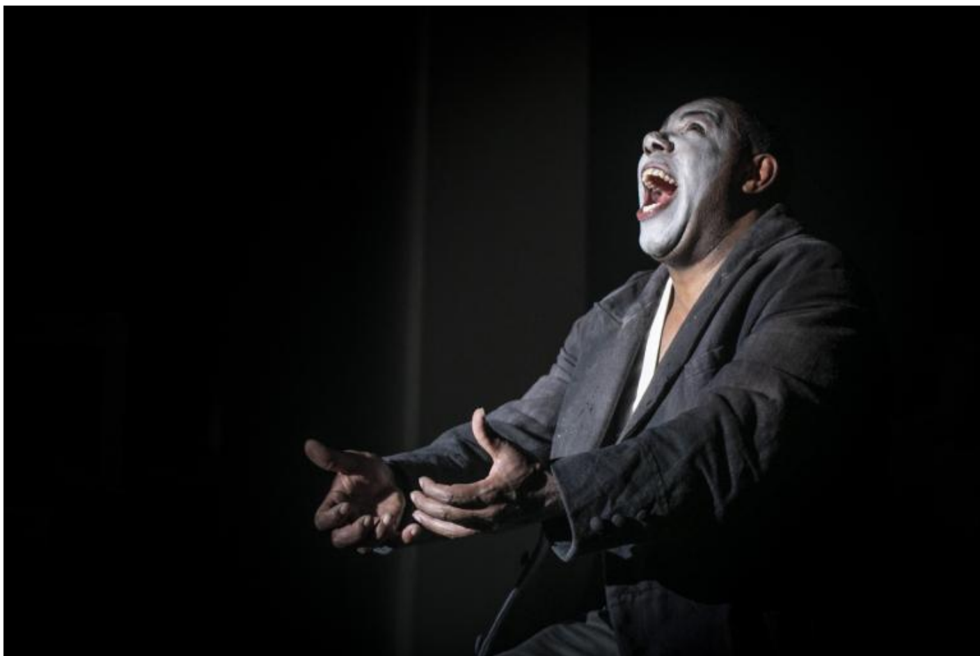
Teatro La Ribalta, Otello, ph Vasco Dell'Oro.

Il corpo è il soggetto psichico per eccellenza, ed erano corpi con il loro linguaggio, con la specificità e la potenza di apertura di quel linguaggio. Certo: coordinati da un movimento ordinato e da coreografie complesse. È questo che fanno i professionisti: lavorano a lungo, si trovano ogni giorno, si fanno guidare da maestri di grandi tradizioni e chiedono a loro stessi rigore. Non si cambia il mondo senza rigore, Basaglia lo ripeteva di continuo.