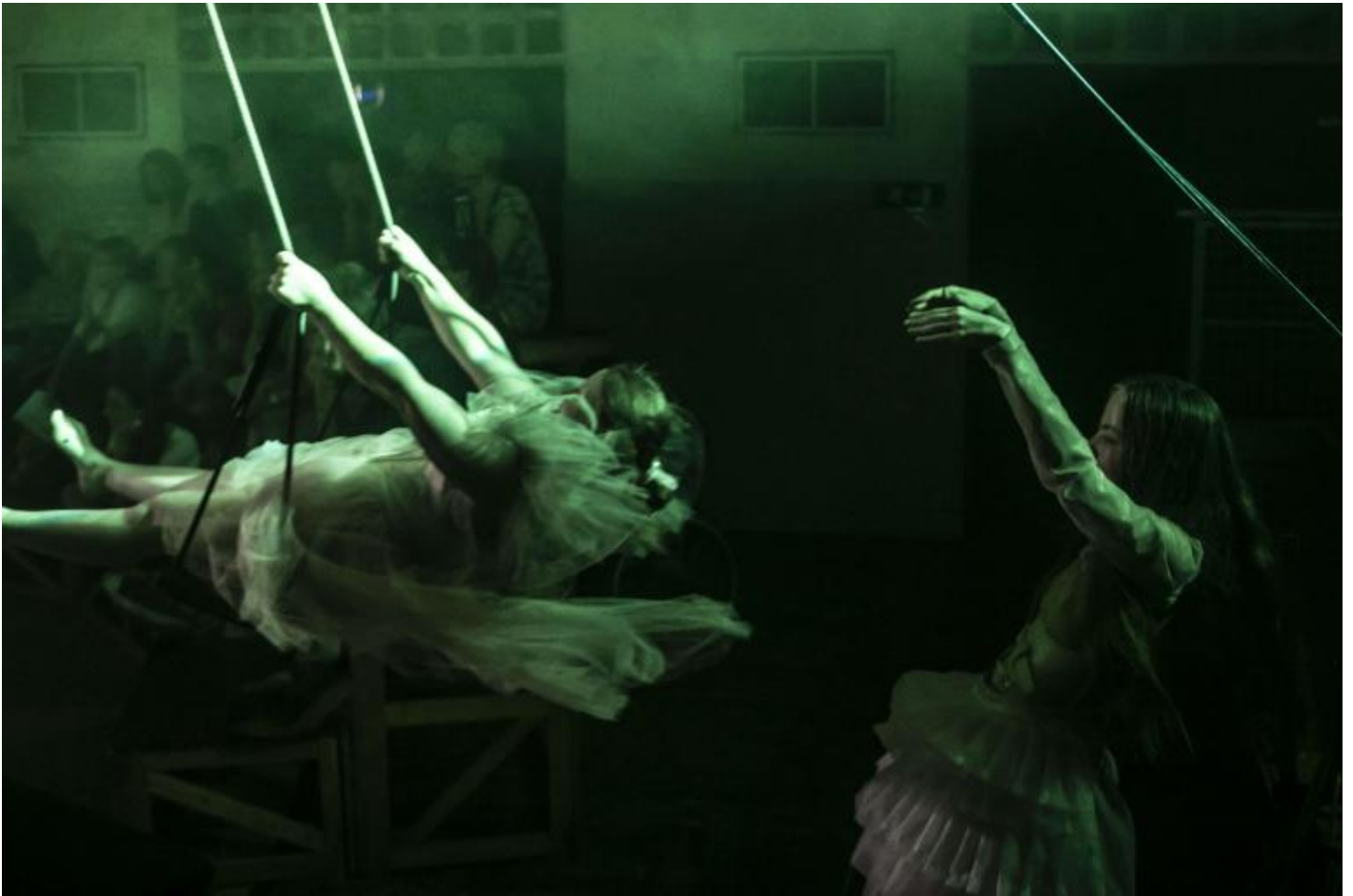
Otello, Allegro Moderato, ph Vasco Dell'Oro.

Antonio ViganÃ² del Teatro alla Ribalta Ã² prima Compagnia teatrale costituita da uomini e donne in situazione di "handicap" che, dopo dodici anni di attivitÃ di creazione e formazione, sono diventati attori e attrici professionisti ha messo in scena un Otello rivisitato, in cui, come Ã² lui stesso a dirci, non Ã² Rodrigo, lâ'attore, che si Ã² adattato a Otello, il personaggio, ma Otello che si Ã² adattato a Rodrigo.