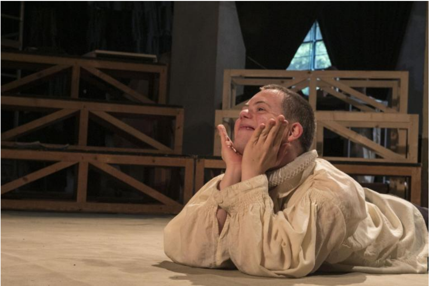
Prove Otello, maggio 2018.

Fare teatro, in questa prospettiva, significa non accettare di porsi sotto quel limite che configura spesso il teatro sociale come realtà ricreativa e terapeutica.