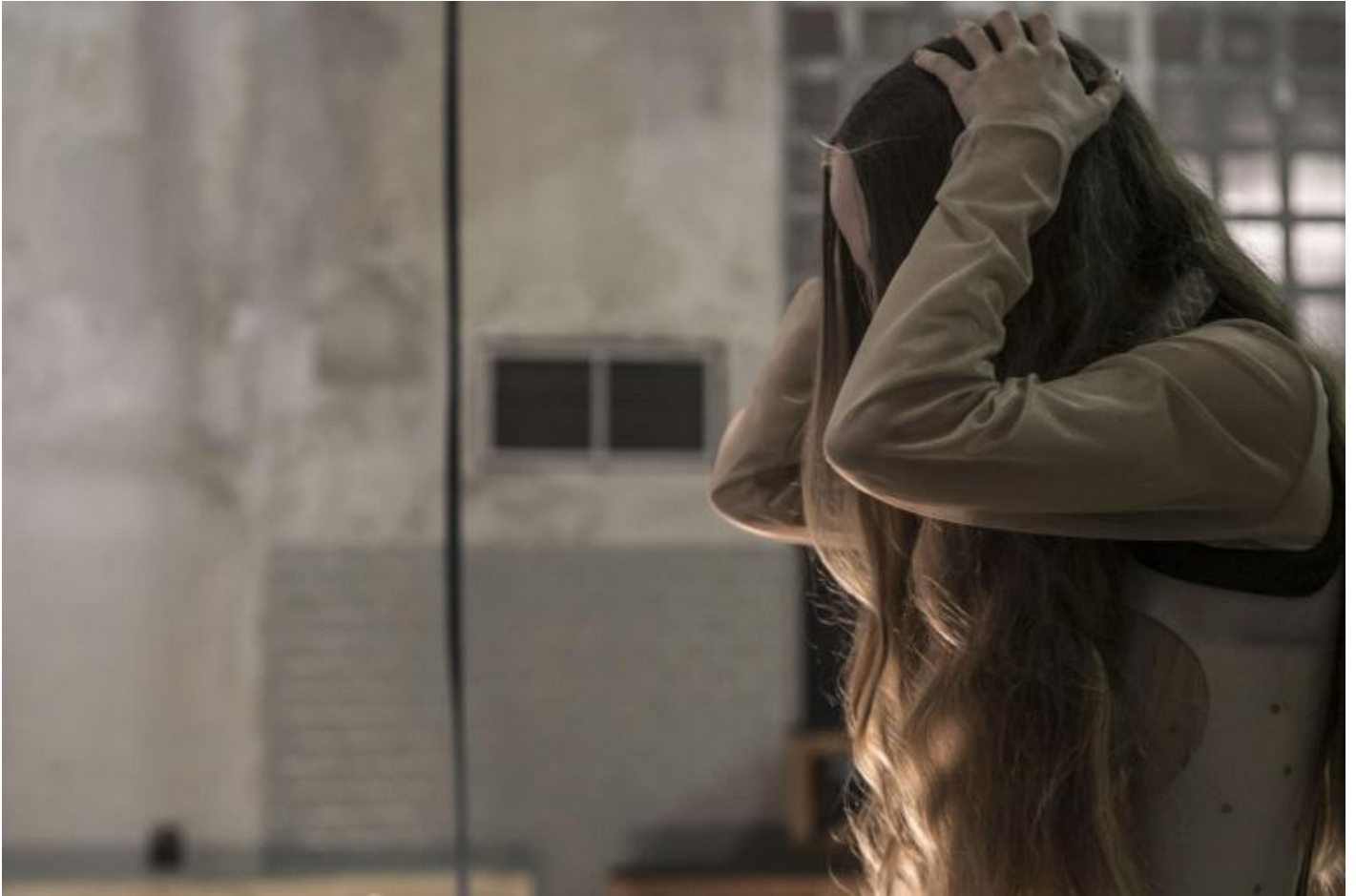
Prove Otello, maggio 2018, ph Vasco Dell'Oro.

Rodrigo si colpisce la testa con la mano in un movimento stereotipato che Ã del suo corpo, ed Ã quel gesto a portare in scena il tarlo della gelosia che divora Otello, cosÃ come la ribellione prende forma in un grido sordo, in una parola che balbetta, che fatica a uscire.