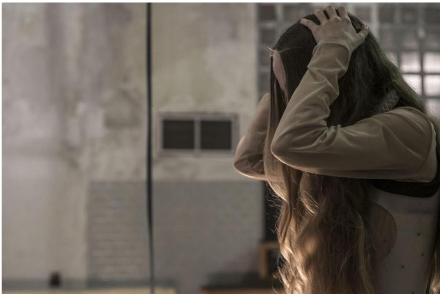
Prove Otello, maggio 2018, ph Vasco Dell'Oro.

Rodrigo si colpisce la testa con la mano in un movimento stereotipato che è del suo corpo, ed è quel gesto a portare in scena il tarlo della gelosia che divora Otello, così come la ribellione prende forma in un grido sordo, in una parola che balbetta, che fatica a uscire.