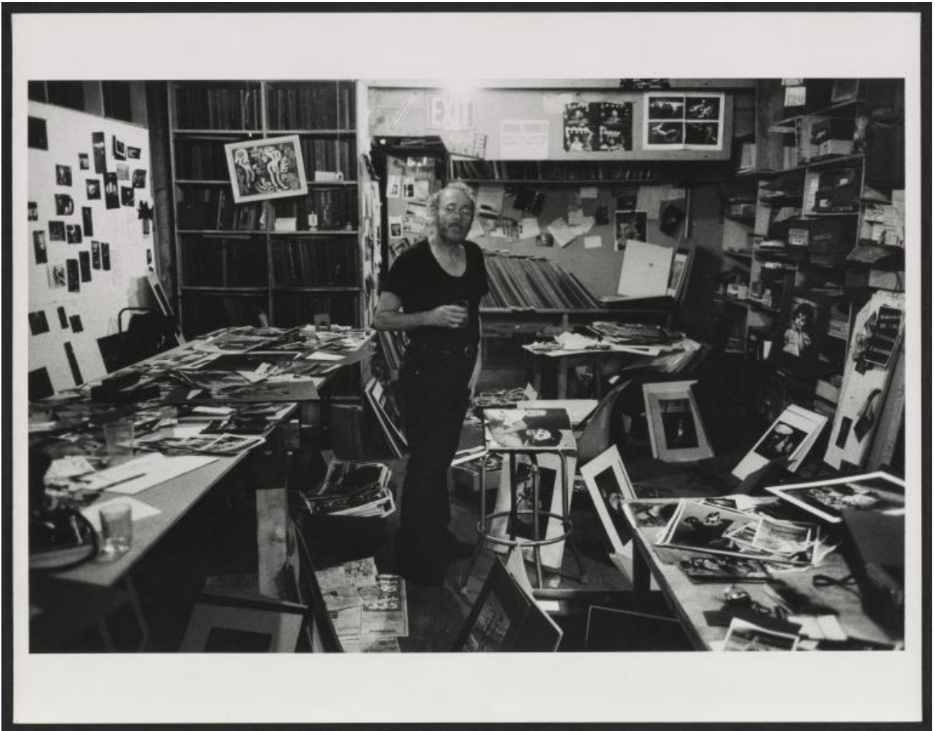
W. Eugene Smith in his workroom