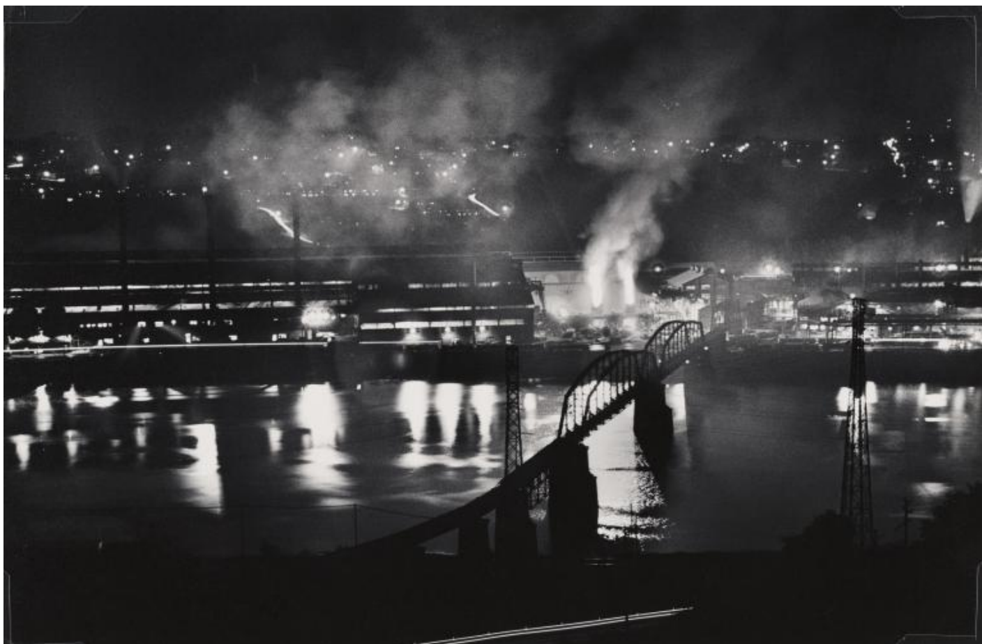
W. Eugene Smith, USA, 1918-1978 Stabilimento National Tube Company, U.S. Steel Corporation, McKeesport, e ponte ferroviario sul fiume Monongahela / National Tube Company works, U.S. Steel Corporation, McKeesport, and Union Railroad Bridge over the Monongahela River, 1955-1957 Stampa ai sali d'argento / gelatin silver print 22.86 x 34.29 cm Carnegie Museum of Art, Pittsburgh Gift of the Carnegie Library of Pittsburgh, Lorant Collection.