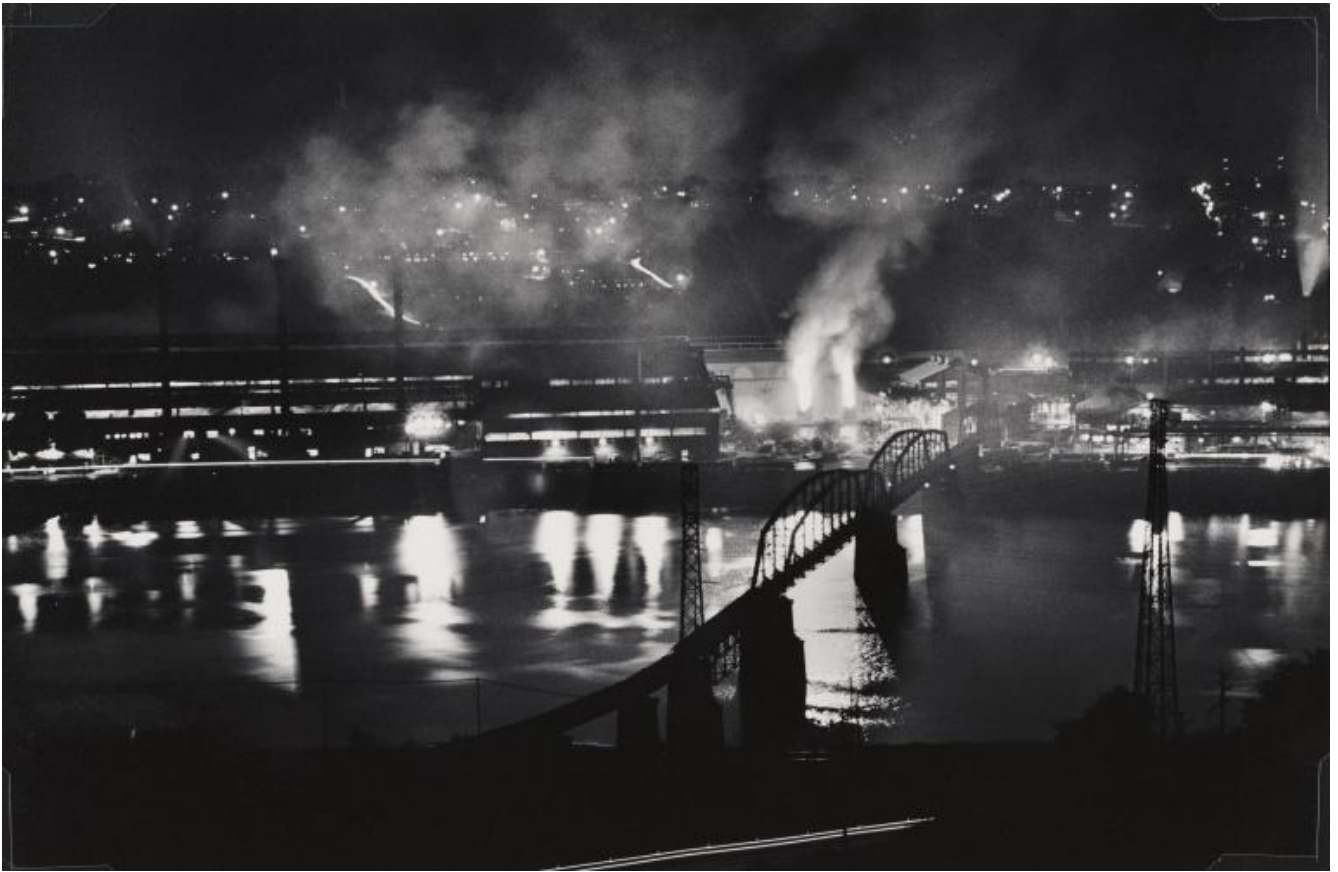
W. Eugene Smith, USA, 1918-1978 Stabilimento National Tube Company, U.S. Steel Corporation, McKeesport, e ponte ferroviario sul fiume Monongahela / National Tube Company works, U.S. Steel Corporation, McKeesport, and Union Railroad Bridge over the Monongahela River, 1955-1957 Stampa ai sali d'argento / gelatin silver print 22.86 x 34.29 cm Carnegie Museum of Art, Pittsburgh Gift of the Carnegie Library of Pittsburgh, Lorant Collection.