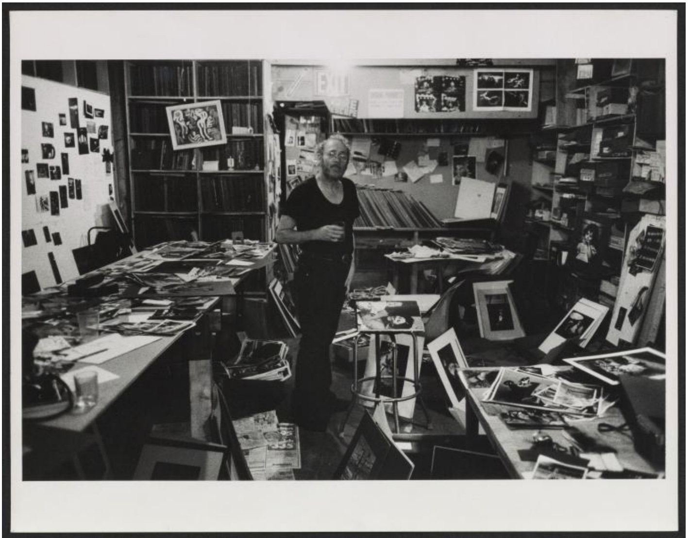
W. Eugene Smith in his workroom