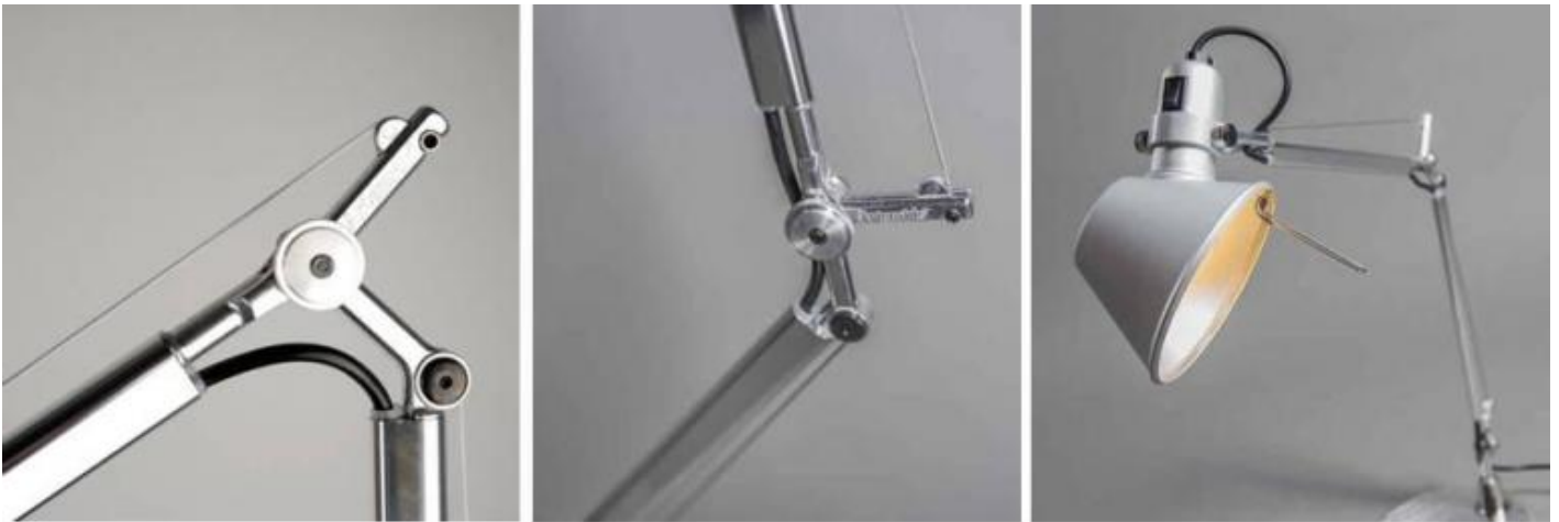
Michele De Lucchi, lampada Tolomeo, dettagli.