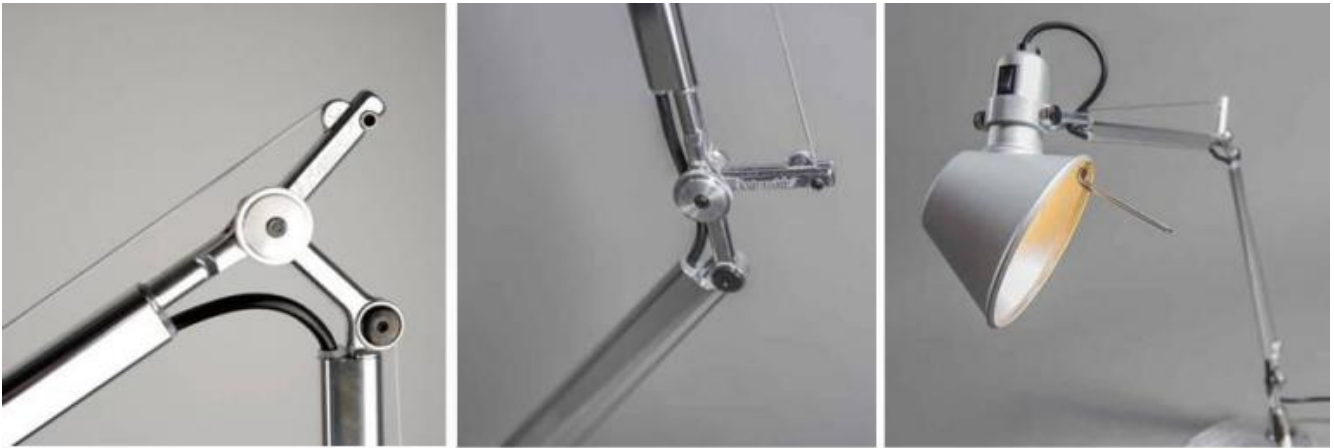
Michele De Lucchi, lampada Tolomeo, dettagli.

insomma era quello più adatto all'idea di una mentalità scientifica.»