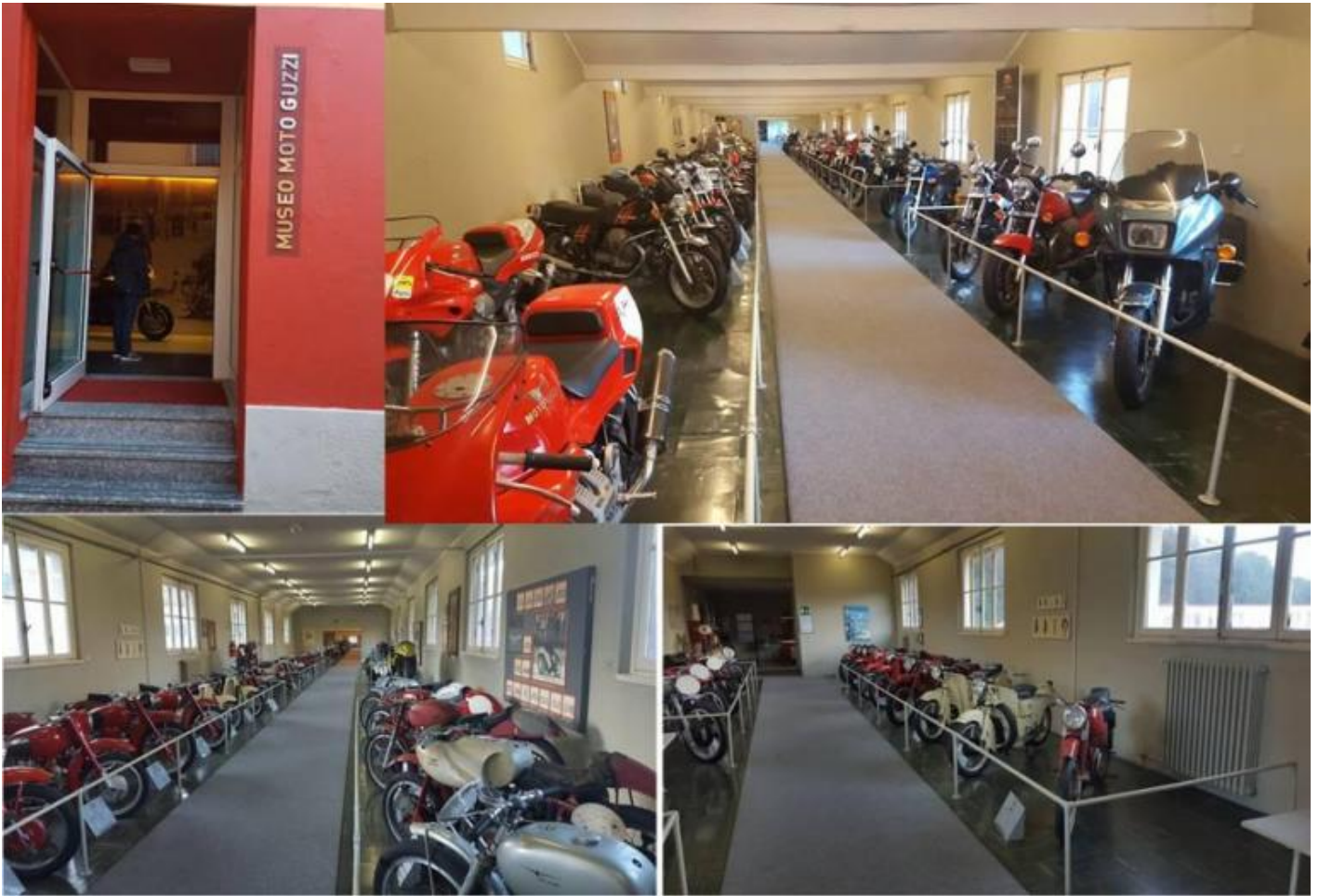
Alcune foto del museo Moto Guzzi a Mandello del Lario.

Si accede al museo da una anonima porticina che si apre su uno dei fianchi di un lungo edificio a fronte continuo, con un contrassegno minimale che lo preannuncia. Abituati come siamo alla bulimia di comunicazione, questa modestia suona strana. Stona. Forse la circostanza richiederebbe un “Per me si va” un pochino pi u magniloquente e rappresentativo, in fondo stiamo pur sempre per entrare in un tempio del made in Italy, nel regno del marchio dell’Aquila, in un luogo quasi sacro per gli appassionati di motori nostrani.