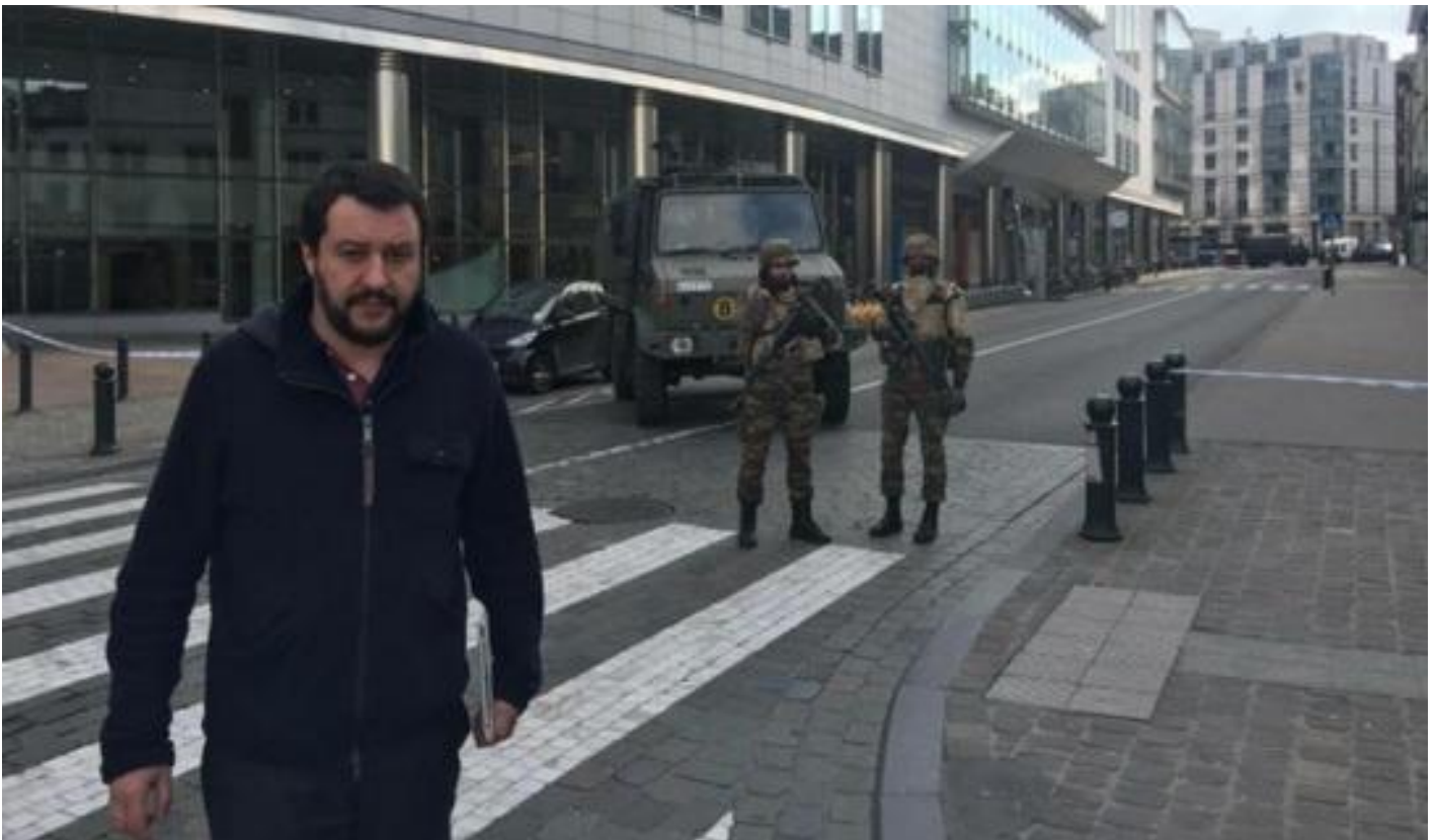
La foto di Salvini sui luoghi degli attentati di Bruxelles, diventata virale e oggetto di proliferazione memetica (22 marzo 2016).

Il controcampo Ansa ci mostrerà un Salvini con il volto tra l'imbambolato e l'ipnotizzato, gli occhi neri fissi puntati sullo schermo del cellulare, a sua volta vigilato dallo sguardo altrettanto fisso di quella che sembra essere una guardia del corpo, posizionata subito dietro di lui. Il tutto è incorniciato dagli applausi della gente. Per inciso, al secondo 00:37 del video si vedono anche lo scambio con una signora di colore sorridente, che abbraccia Salvini, e la di lui carezza a lei, momento che alcuni hanno citato come contraltare edificante da opporre all'additato orrore del selfie.