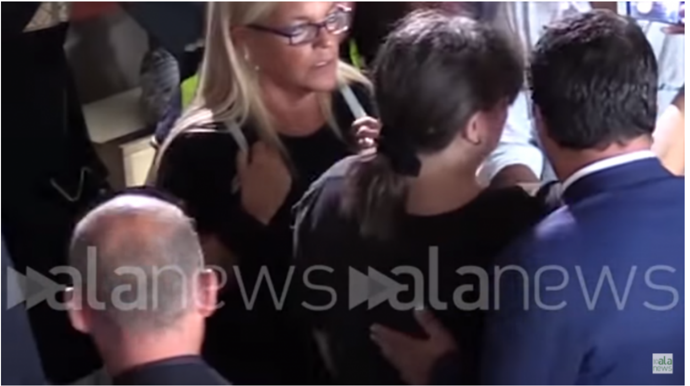
Il dietro le quinte del selfie di Genova catturato dal video di AlaNews (18 agosto 2018).