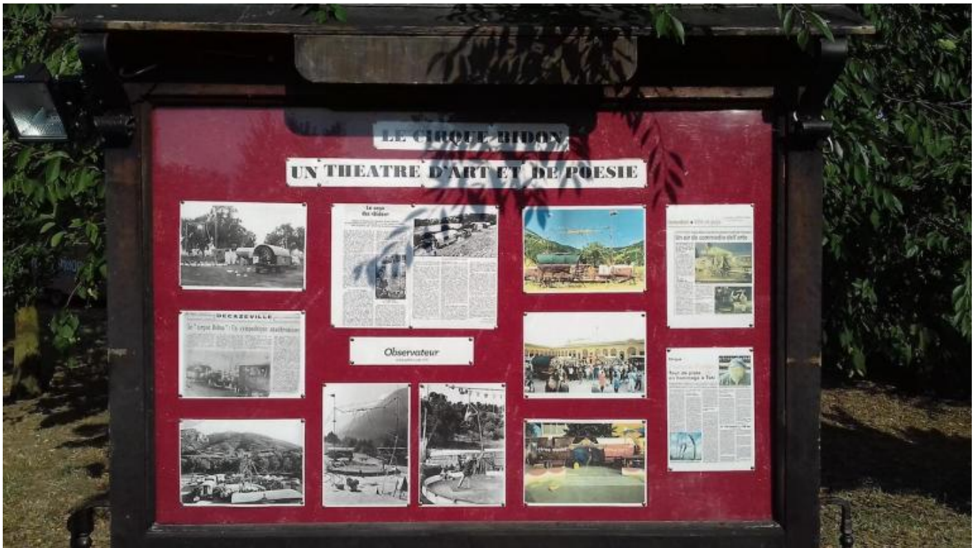
Villa Angeletti, Bologna.