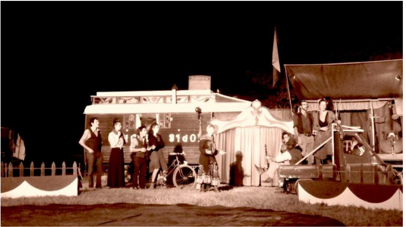
Scena iniziale "Entrez dans la danse" - Villa Angeletti (BO).

Assistere a uno spettacolo del Bidon significa trascorrere un paio d'ore in un'atmosfera di leggerezza, avendo l'impressione che gli artisti stiano improvvisando. In realtà, ogni gesto è studiato veramente al dettaglio. Non ho mai visto uno spettacolo così, oppure Da quando ero bambino, non vedevo un vero circo: questi alcuni dei commenti scaturiti tra gli spettatori al termine di una rappresentazione.