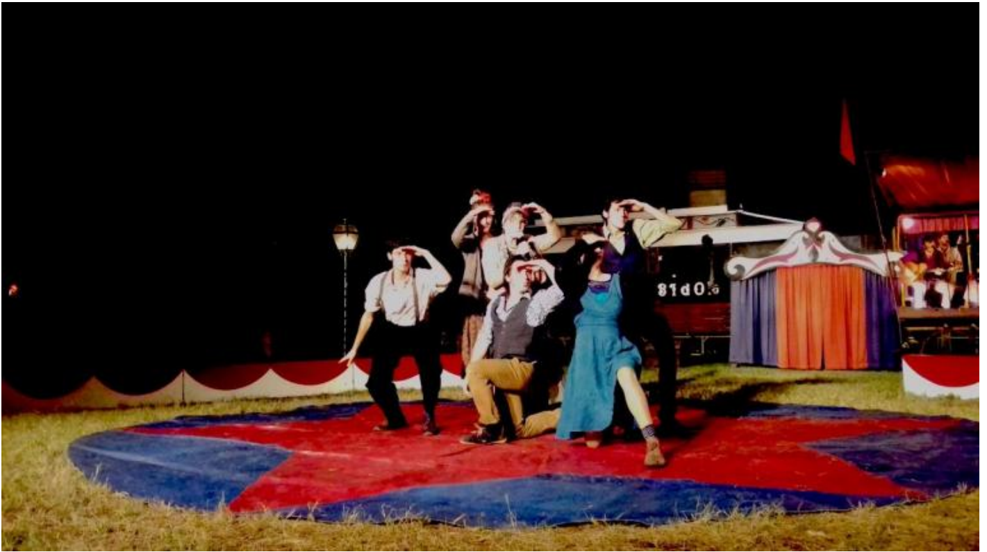
Ensemble "Entrez dans la danse" - Villa Angeletti (BO).