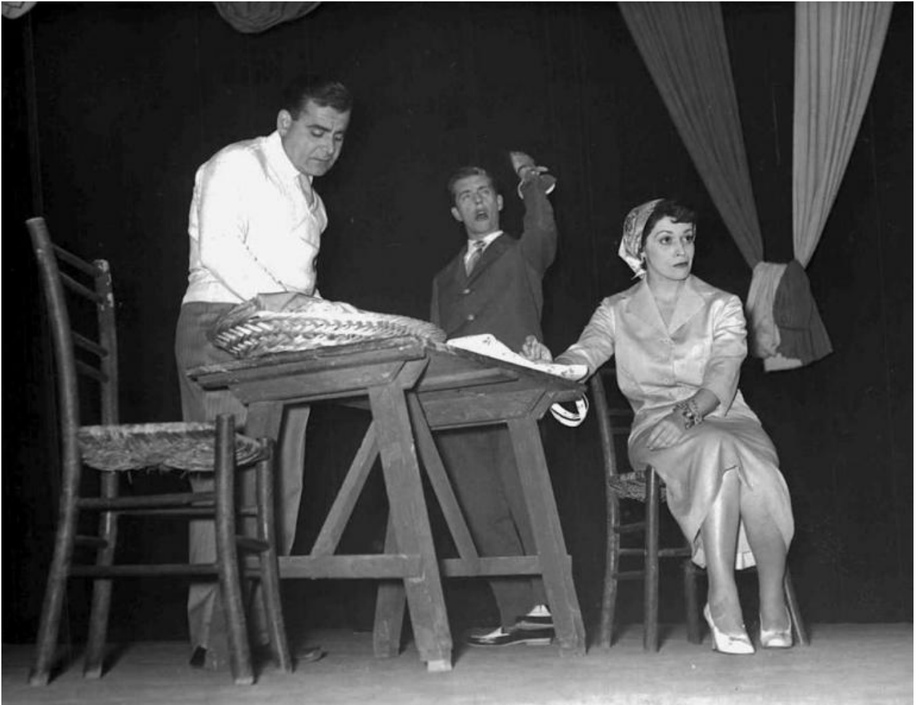
Vittorio Caprioli, Luciano Salce e Franca Valeri ai tempi de I Gobbi.

nel Novecento, descritta mirabilmente nell' Adalgisa di Carlo Emilio Gadda (a proposito di umoristi).