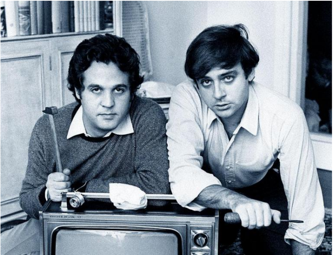
Cochi e Renato.