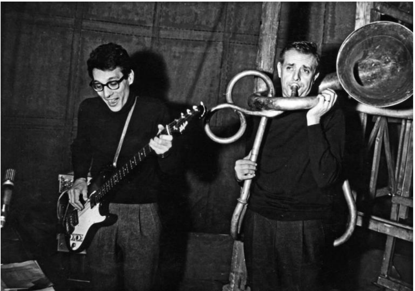
Enzo Jannacci e Dario Fo.