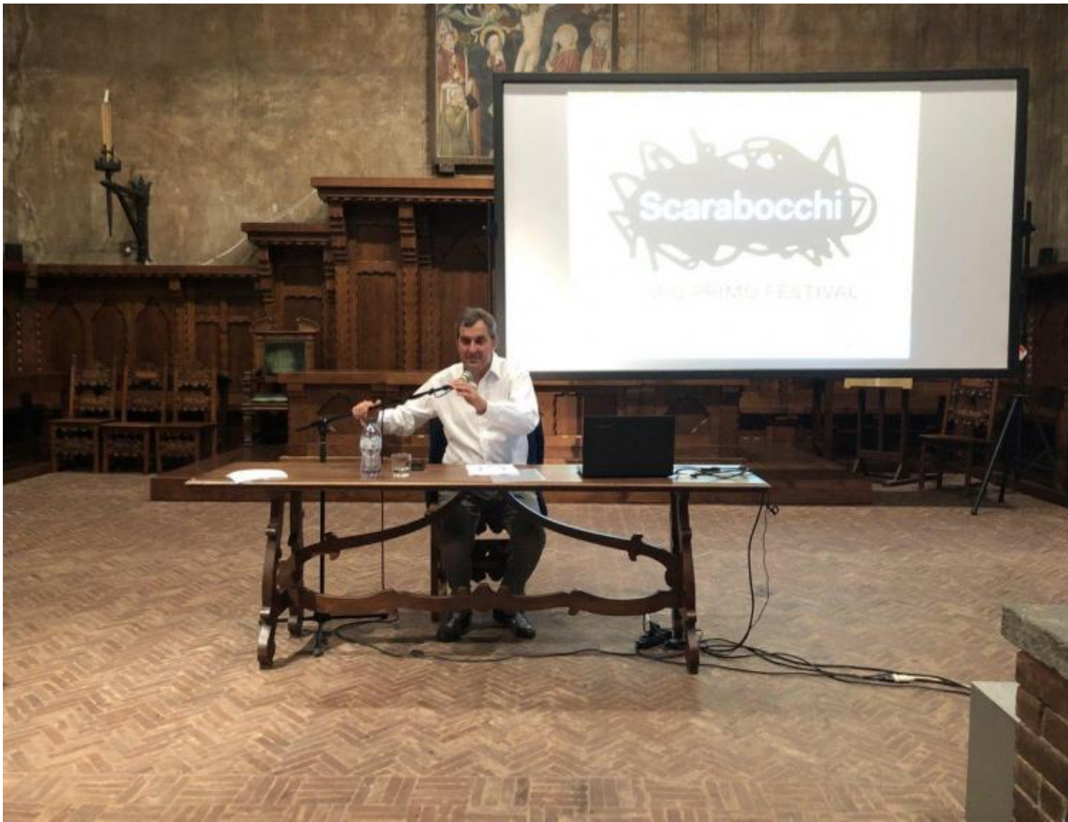
Mario Calabresi racconta Bruno Munari

In soli tre giorni a Novara si sono dati appuntamento per scarabocchiare insieme alcuni tra i piÃ¹ grandi illustratori e artisti italiani, i bambini hanno avuto accesso illimitato a colori, matite e tempere e si sono sbizzarriti in diversi laboratori, gli adulti hanno scoperto i significati degli scarabocchi o come gli scarabocchi nella sabbia possano dire qualcosa di noi, hanno guardato gli scarabocchi di famosi matematici e filosofi e interrogato questi gesti cosÃ¬ semplici nel loro rapporto con il disegno.