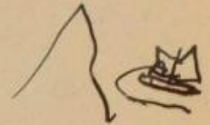
Uno scarabocchio di Albert Einstein

Abbiamo nuovi progetti in testa che cercheremo di realizzare nei prossimi mesi, e questa direzione - del cercare di creare dei momenti per stare insieme e di farlo