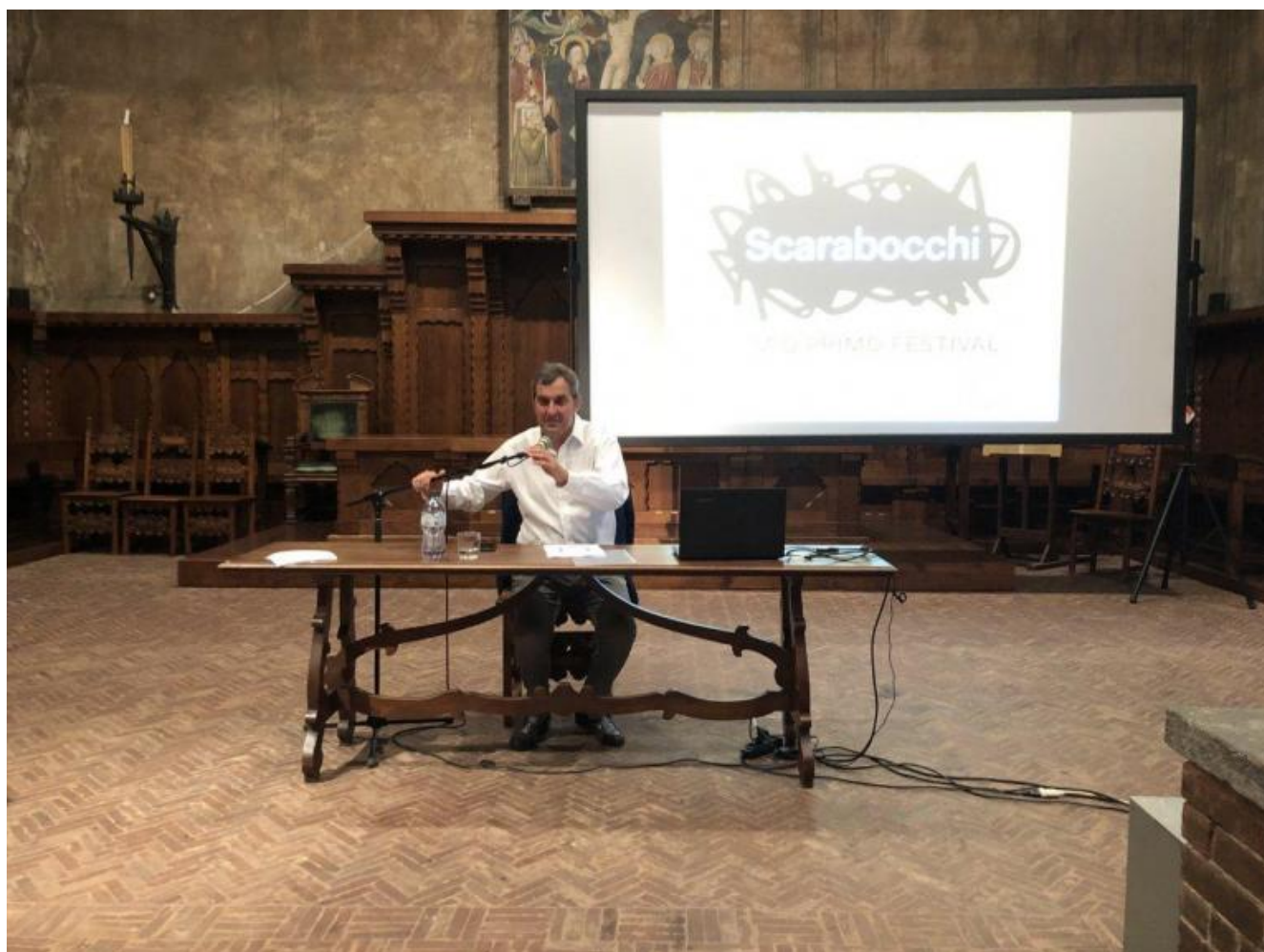
Mario Calabresi racconta Bruno Munari

In soli tre giorni a Novara si sono dati appuntamento per scarabocchiare insieme alcuni tra i più grandi illustratori e artisti italiani, i bambini hanno avuto accesso illimitato a colori, matite e tempere e si sono sbizzarriti in diversi laboratori, gli adulti hanno scoperto i significati degli scarabocchi o come gli scarabocchi nella sabbia possano dire qualcosa di noi, hanno guardato gli scarabocchi di famosi matematici e filosofi e interrogato questi gesti così semplici nel loro rapporto con il disegno.