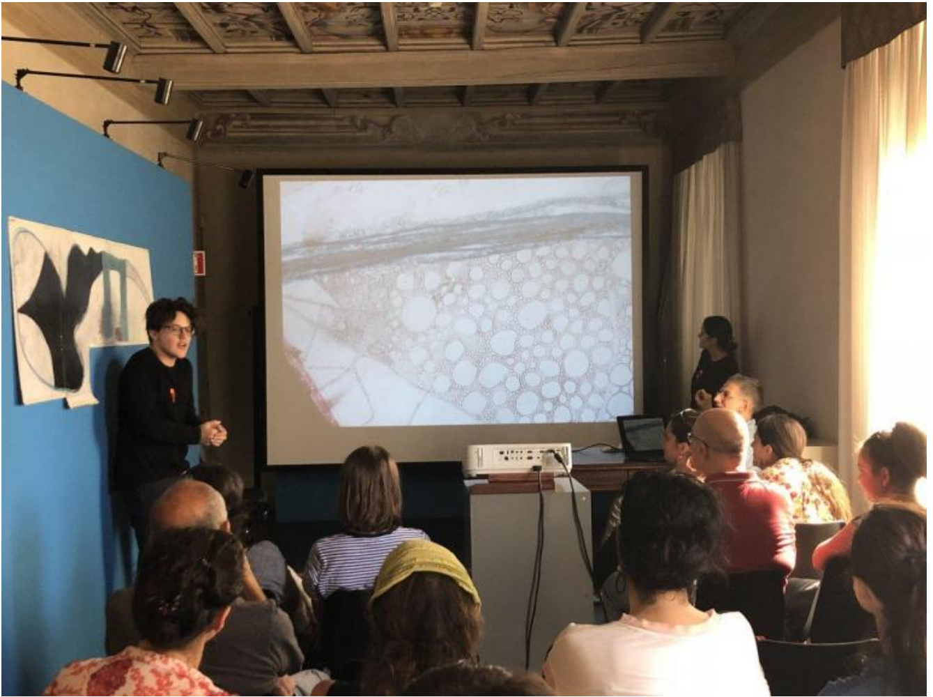
I ragazzi dell'Atelier dell'Errore danno vita agli scarabocchi