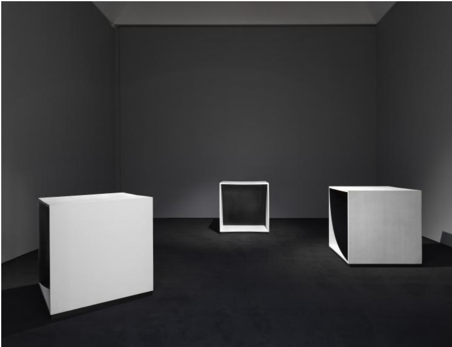
Francesco Lo Savio, Articolazioni totali, 1962 (vista dell'installazione al Mart, 2018).

anartiste che alla fine della sua vita confidava a Pierre Cabanne di considerare il vivere, il semplice respirare, come il vero oggetto della propria arte. “Un quadro vale solo in quanto è, essere totale: non bisogna dir nulla: essere soltanto”, gli fa eco Manzoni in testo del 1960, con una presa di posizione concettuale avant la lettre al cui centro vi è una volontà di abolizione della metafora, vale a dire della presunta capacità dell’arte di trascendere la materia, un ragionamento di Sanguineti che Cortellessa, con felice cortocircuito critico, trasla dall’opera di Burri a quella dell’artista più giovane. L’apertura alla materialità dell’esistenza, a una effettiva convergenza arte-vita, porterà Manzoni, come è possibile scorgere nella sua Base magica (1961), sempre più a includere lo spettatore nell’opera come parte attiva e anzi fondamentale, una mossa insieme seria e ironica in cui convivono la capacità di rileggere in termini originali l’eredità dada e quella di trasporla in una nuova condizione culturale, in cui l’ antiarte è divenuta essa stessa, definitivamente, materiale da museo.