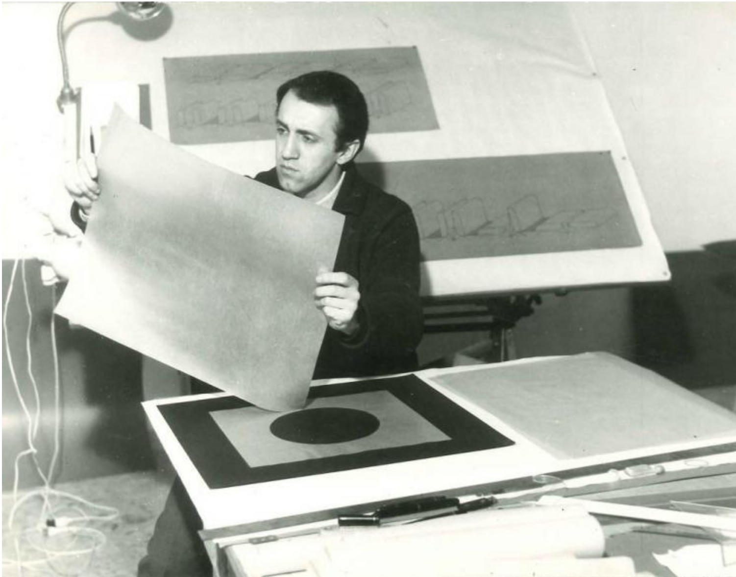
Francesco Lo Savio al lavoro sui Filtri nello studio, Roma 1961

D'altro canto, se la ricostruzione delle parabole di Lo Savio e Manzoni appare sempre sostenuta da acute riletture di testimonianze e documenti, il vero aspetto saliente di entrambi i libri è senz'altro il modo, brillante e idiosincratico, in cui essi trasformano questi materiali in fulcri di nuove interpretazioni. È in questa giuntura che essi mostrano – in segreta polemica con un certo conformismo neostoricista di cui la cultura storico-artistica italiana sembra non poter fare a meno – come critica e filologia siano indispensabili l'una all'altra, e che anzi, alla fine, sono momenti di un medesimo movimento del pensiero.