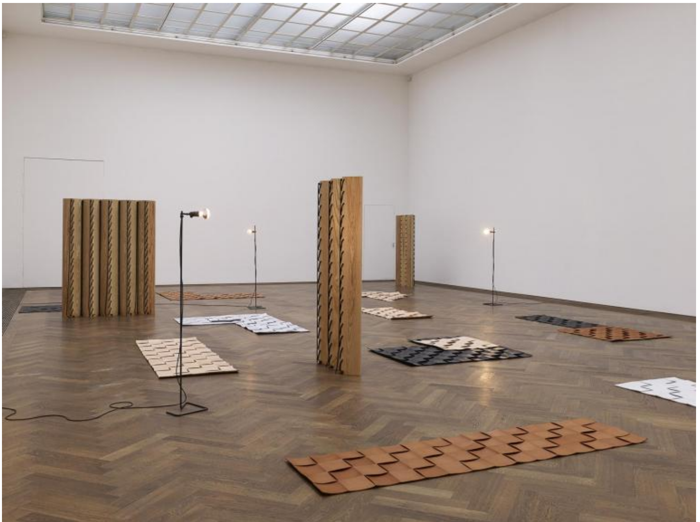
Leonor Antunes Veduta della mostra, â??the last days in chimalistacâ?•, Kunsthalle Basel, Basilea, 2013 Courtesy dellâ??artista e Kunsthalle Basel Foto: Nick Ash.

Vicende diverse nei luoghi e nel tempo che risuonano, una fitta rete di riferimenti, rimandi e consonanze, che dimostrano come lâ??arte che riflette su sÃ© stessa non produca necessariamente tautologia, nÃ© sia un cul-de-sac da cui, esaurita lâ??indagine sul linguaggio, non rimanga che polvere. Antunes sa che le storie sono una materia viva in grado di iniettare sangue nel corpo (talvolta prossimo alla morte clinica) della scultura contemporanea e le utilizza come un mezzo per riflettere sulla pratica dellâ??arte, un mezzo da utilizzare per trascendere la dimensione narrativa e approdare a riflessione organica sulla forma.