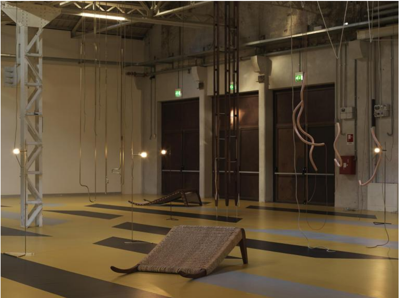
Leonor Antunes, the last days in Galliate, veduta della mostra, Pirelli HangarBicocca, Milano, 2018.

In questa relazione di esclusività risiede il calore che emanano questi lavori, così classici nell'impianto eppure indiscutibilmente contemporanei nelle istanze. Un modus operandi che avvicina Antunes alla sensibilità e alle pratiche di Lina Bo Bardi, architetta italiana naturalizzata brasiliana, interessata allo studio delle culture locali e all'artigianato come patrimonio di sapere applicato, ma anche alla cura maniacale per il dettaglio di Albini e alla "rarefazione" tipica di alcuni suoi progetti; a Gio Ponti, formidabile innovatore nel solco della tradizione di cui ricordiamo la passione per la pittura e la ceramica, che si concretizzò nella felice collaborazione con le manifatture Richard Ginori durante il periodo 1923-1930; ad Anni Albers, figura cardine del Bauhaus che seppe elevare la tessitura da semplice arte applicata a forma espressiva completa, al pari di scultura e pittura; o, ancora, a Eva Hesse, con le sue forme biomorfe sospese e l'utilizzo di materiali soggetti a degradazione naturale. Tra le figure più affascinanti, c'è la designer cubana Clara Porset, il cui lavoro era già stato oggetto di interesse da parte di