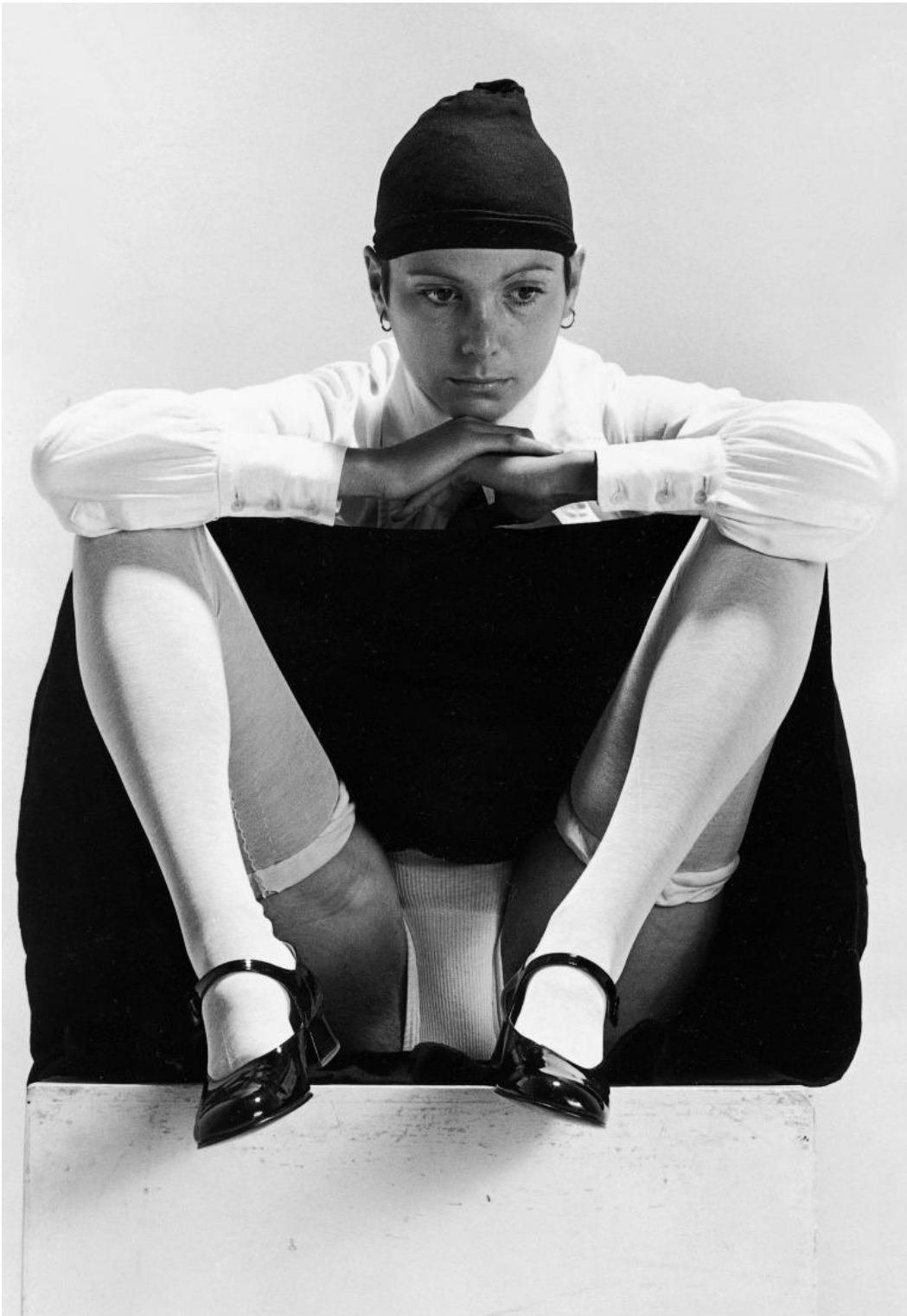
Ideologia e natura, 1973

Forse ancora piÃ¹ esplicita Ã¨ da questo punto di vista l'azione Ideologia e natura , eseguita per la prima volta nel 1973. Una giovane donna, in divisa da Giovane Italiana, si spoglia lentamente accanto a un plinto bianco sino a restare completamente nuda, per poi rivestirsi in un ciclo senza interruzioni. La "meccanica ipnotica" dell'azione, come scrive ValÃ©rie Da Costa, crea un "sentimento d'assenza", una complicitÃ tra performer e spettatore. La metafora del corpo alternativamente nudo e spogliato si carica cosÃ¬ di ulteriori risonanze: un corto circuito tra memoria dell'arte (la statua sul piedistallo, la modella nell'atelier), e voyeurismo di massa (lo "spogliarello", la pornografia soft ), tra high e low . La contrapposizione tra "natura", il nudo, e "cultura", l'uniforme del fascismo (e