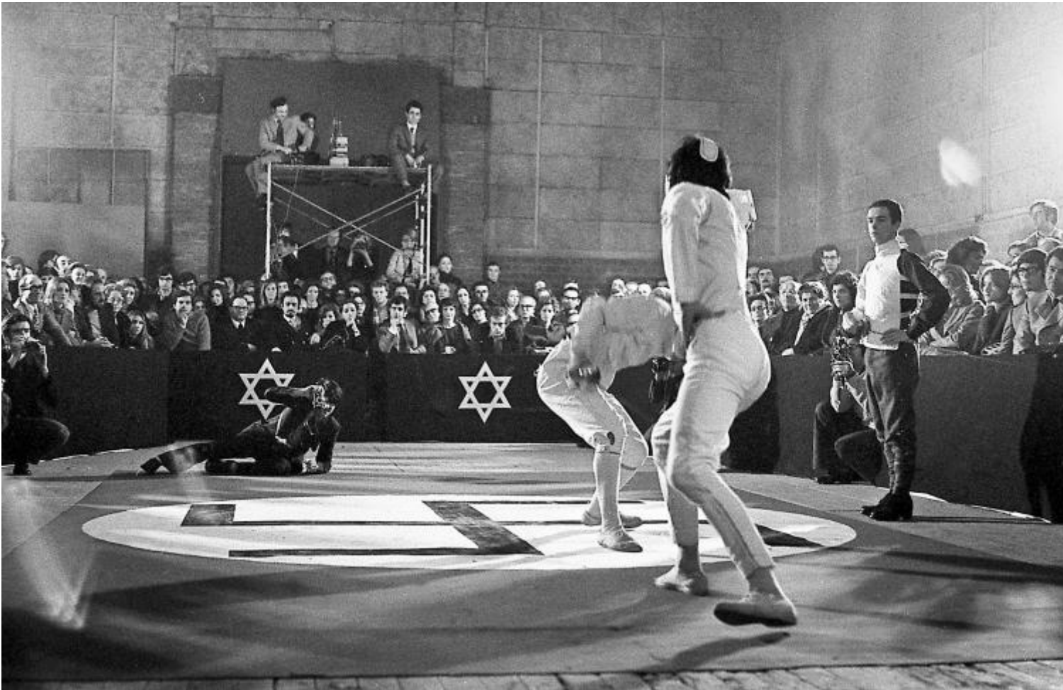
Che cosa è il fascismo, 1971

Una modalità questa che obbliga dunque lo spettatore contemporaneo a osservare in se stesso gli effetti dell'estetica fascista, a misurarne al presente, in atto come ben mostra appunto la recente monografia di Valérie Da Costa, Fabio Mauri. Le Passées en actes / The Past in Acts , (edizione bilingue francese e inglese, les presses du rivrel , 2018, pp. 283, 36), tutta la potenza di lutto, ritrovata attraverso un'operazione di filologia storica spinta dall'artista sulla soglia di una tormentosa resurrezione.