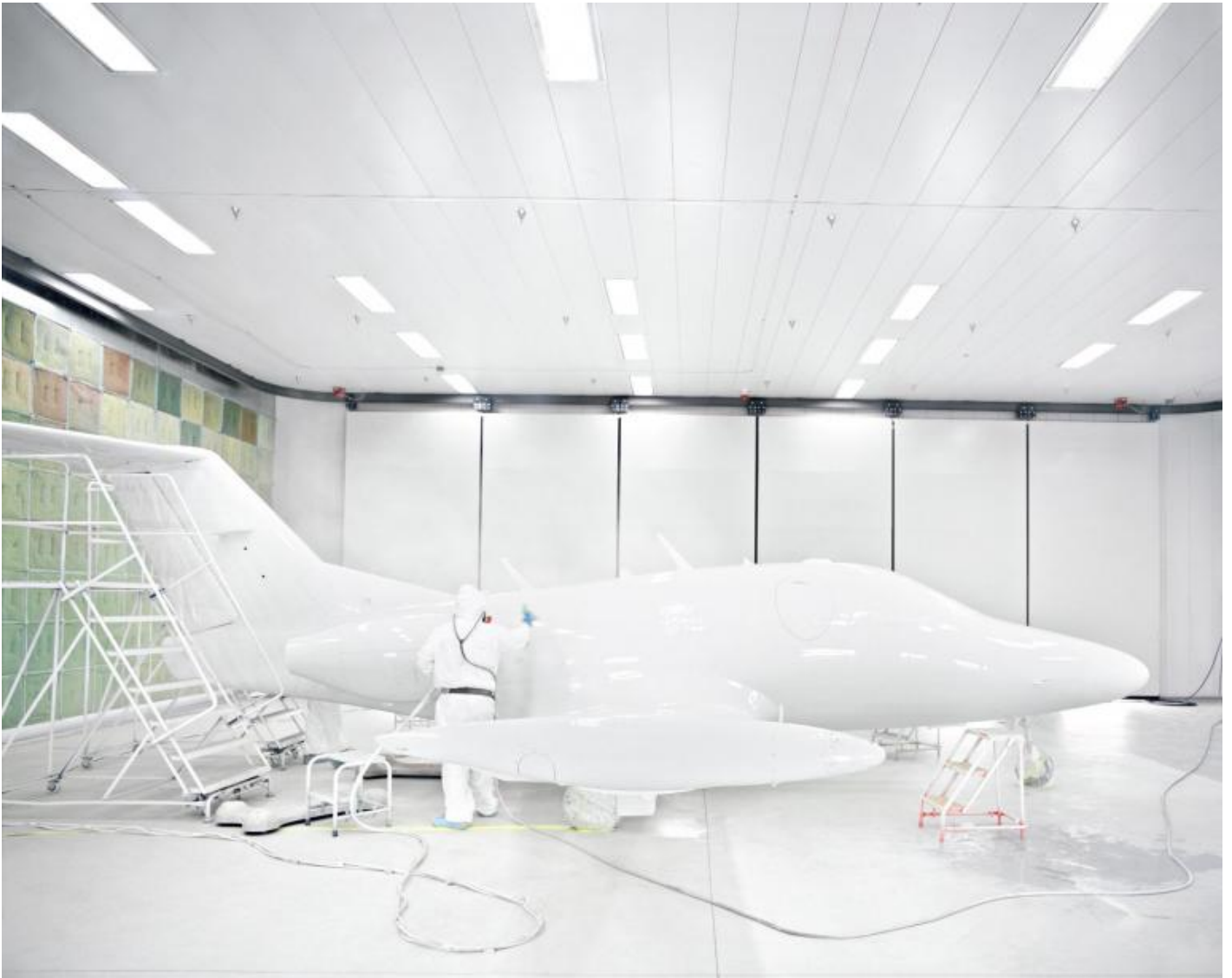
Floto + Warner, Sala verniciatura dell'«Eclipse Albuquerque, NM USA, 2007

Eppure questa mostra riesce a produrre un sovvertimento corrosivo all'interno del suo stesso percorso. Due fotografi, infatti, propongono lavori che segnano una netta linea di demarcazione rispetto al contesto e allo stesso tema espositivo. Sono Yto Barrada e Xavier Ribas. Le loro opere non recano alcuna traccia di movimento. Lo scarto appare talmente evidente che si è costretti ad interrogarsi sul senso della velocità proprio mentre se ne constata l'assenza.