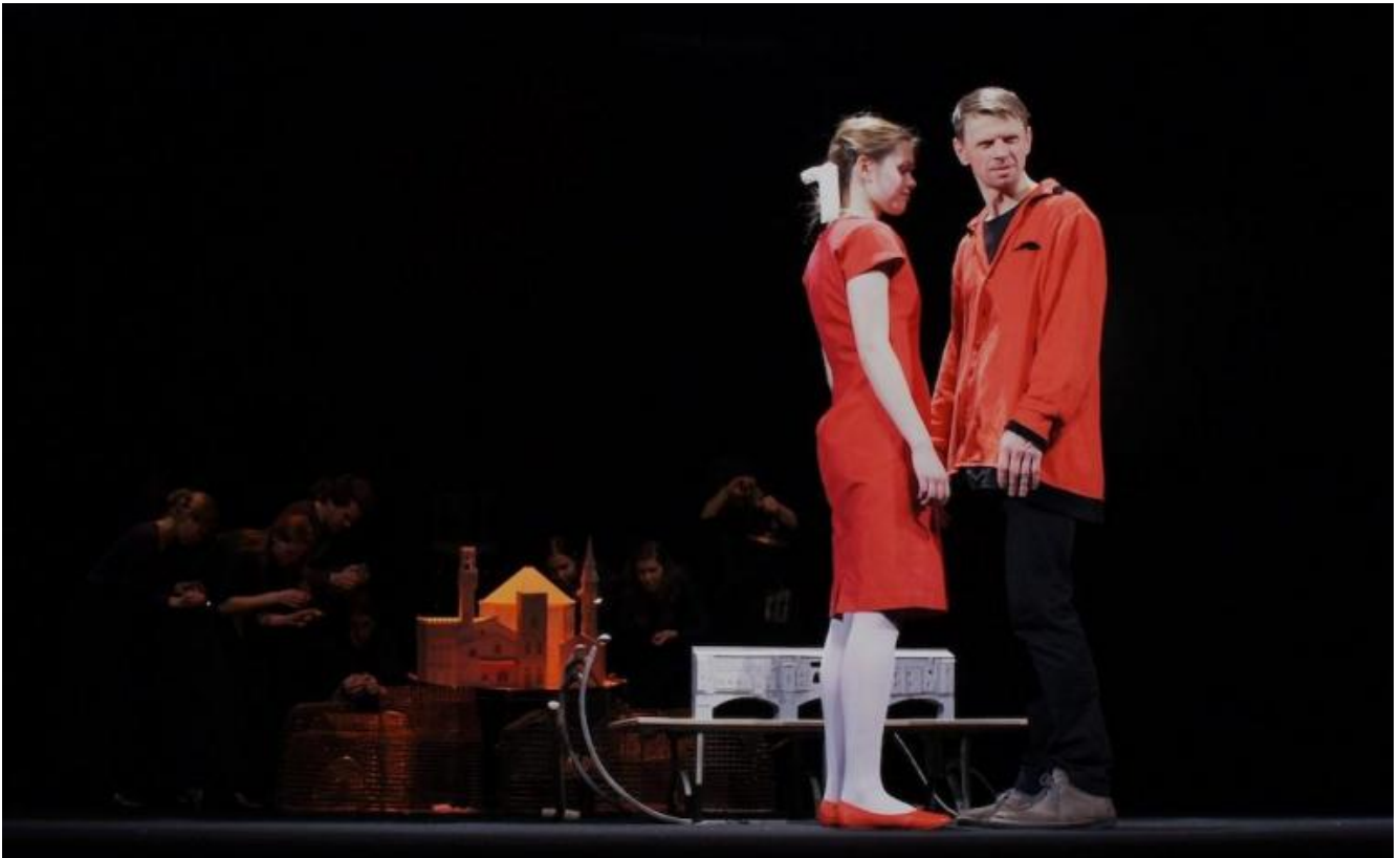
Divina Commedia, Dante e Beatrice

Scrivevo (era il 2012) per Doppiozero : “Anche il genio dei maestri a volte latita. Questa è la prima sensazione davanti alla Divina Commedia di Eimuntas Nekrosius. Lo spettacolo [...] sta al poema di Dante come To Rome with Love di Woody Allen sta alla complessità odierna di una città come Roma. Una cartolina innamorata e falsificante, una scelta degli episodi bizzarra per un lavoro con qualche momento d’incanto, come solo il regista lituano sa creare, e troppi altri decisamente insistiti, banali, al limite dell’ingenuità teatrale e interpretativa”.