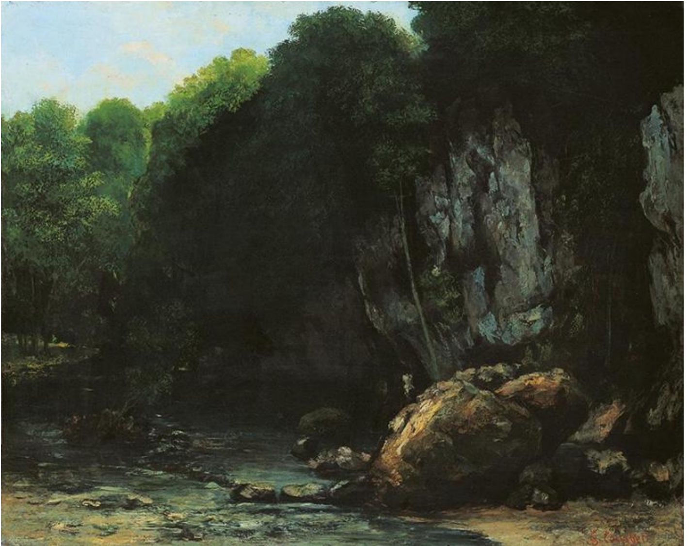
G. Courbet, Il ruscello del Puits Noir, valle della Loue.