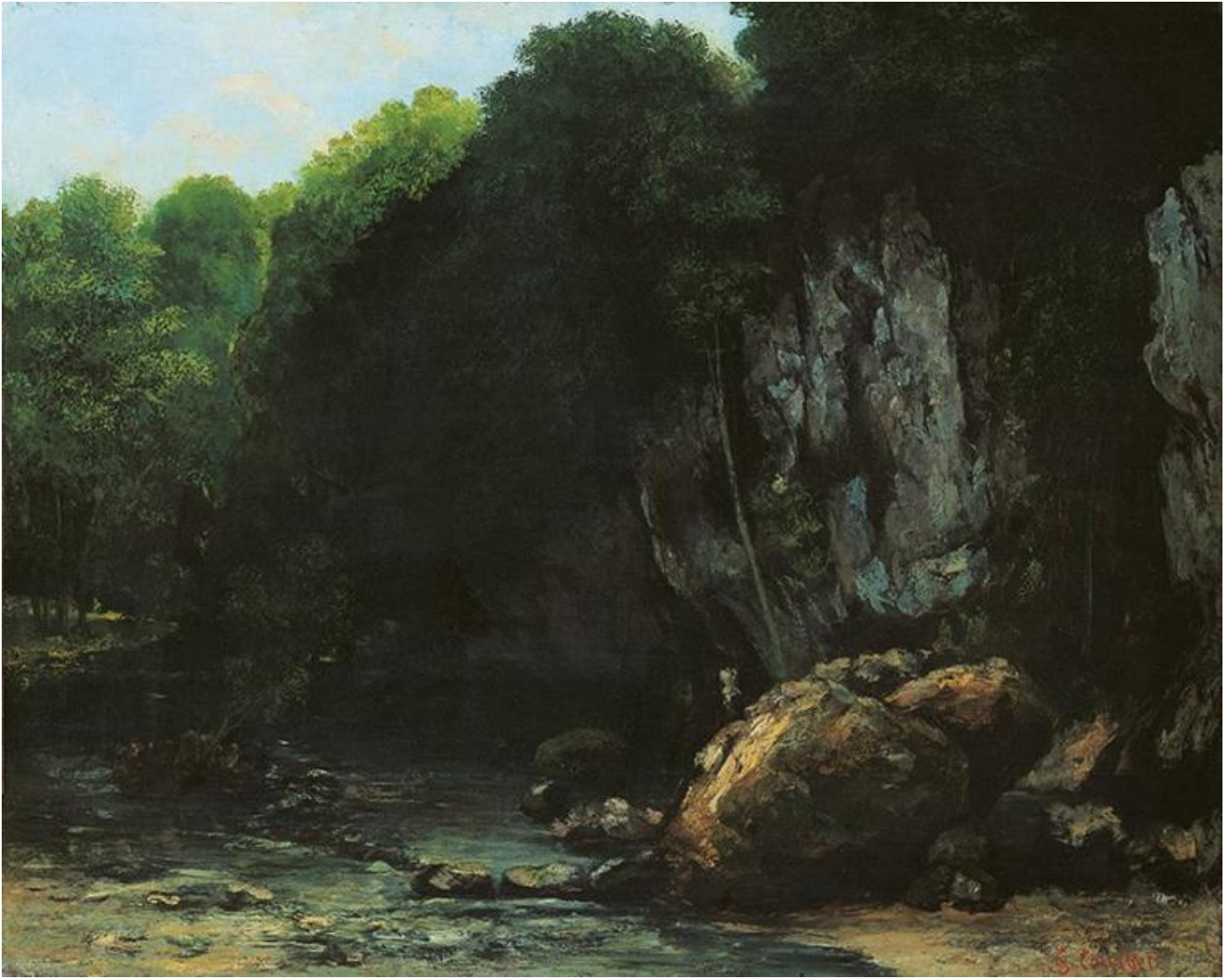
G. Courbet, Il ruscello del Puits Noir, valle della Loue.

per Garboli, esente da ragioni politiche o rivoluzionarie, care a Proudhon; piuttosto è legato alla sua «ristrettezza della visione, la sua limitatezza ottica». Insomma, cosa vede Courbet? E come vede? C'è qualcosa di intimo e insieme romantico in questi dipinti.