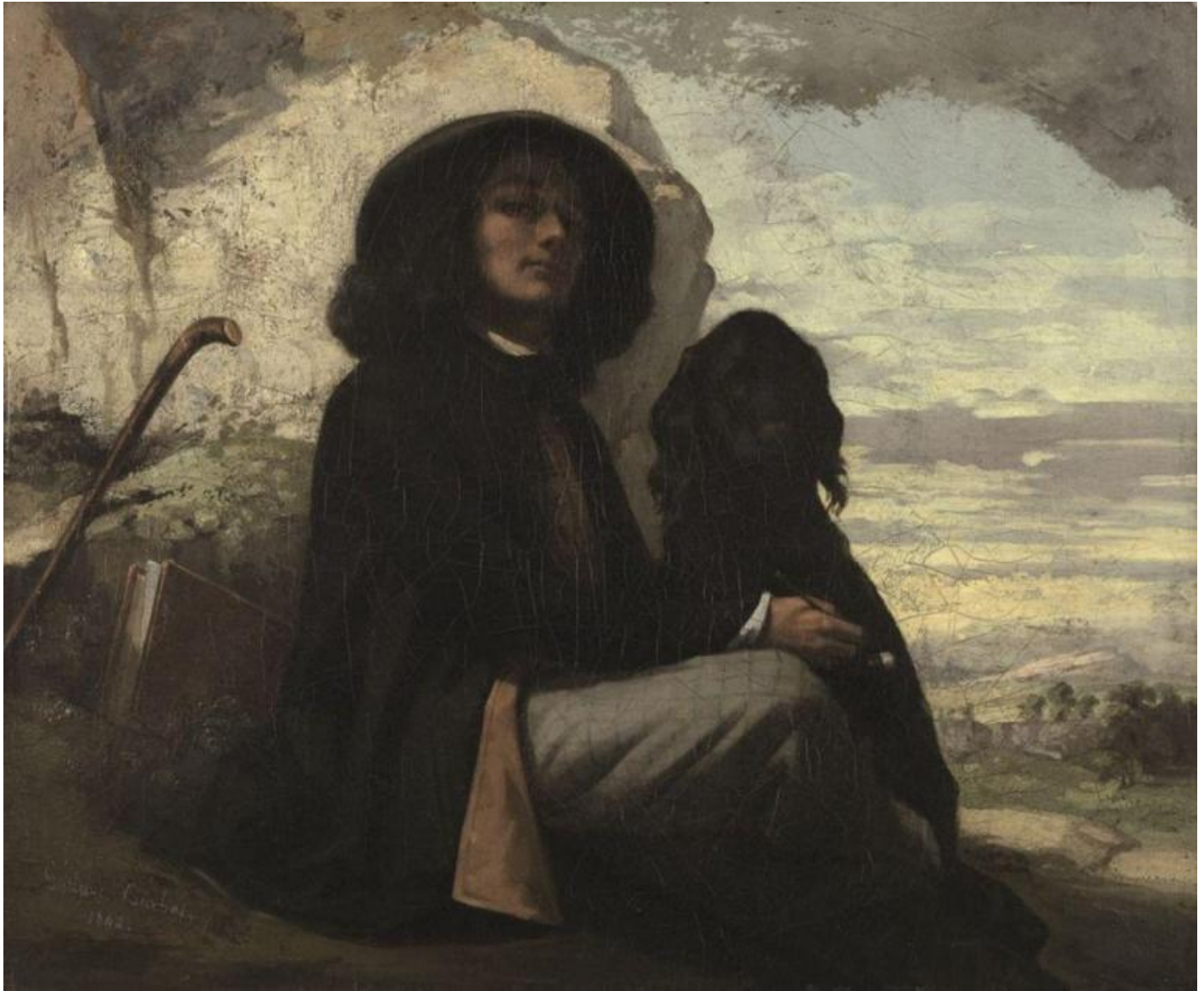
G. Courbet, Autritratto con il cane.

percorrerà e dipingerà a lungo. E quelle rocce: che magnifica resa pittorica, ottenuta per strati di colore passati con il coltello. C'è lì, evidente, tutta quella materialità della pittura che lo accompagnerà negli anni. Passeggiare per le sale della mostra è un piacere: l'illuminazione e anche le pareti ci vengono in aiuto, indicandoci topograficamente le zone, i luoghi a cui i dipinti fanno riferimento, così come alcune stampe fotografiche più o meno coeve (utilizzate come aide-memoire ?) Ci muoviamo tra alberi secolari dove corrono cani, e poi boschi, ruscelli, paesaggi marini, onde, nature morte, uomini feriti, rocce, scene di caccia, donne assopite sul greto del fiume, floride bagnanti, paesaggi nevosi svizzeri.