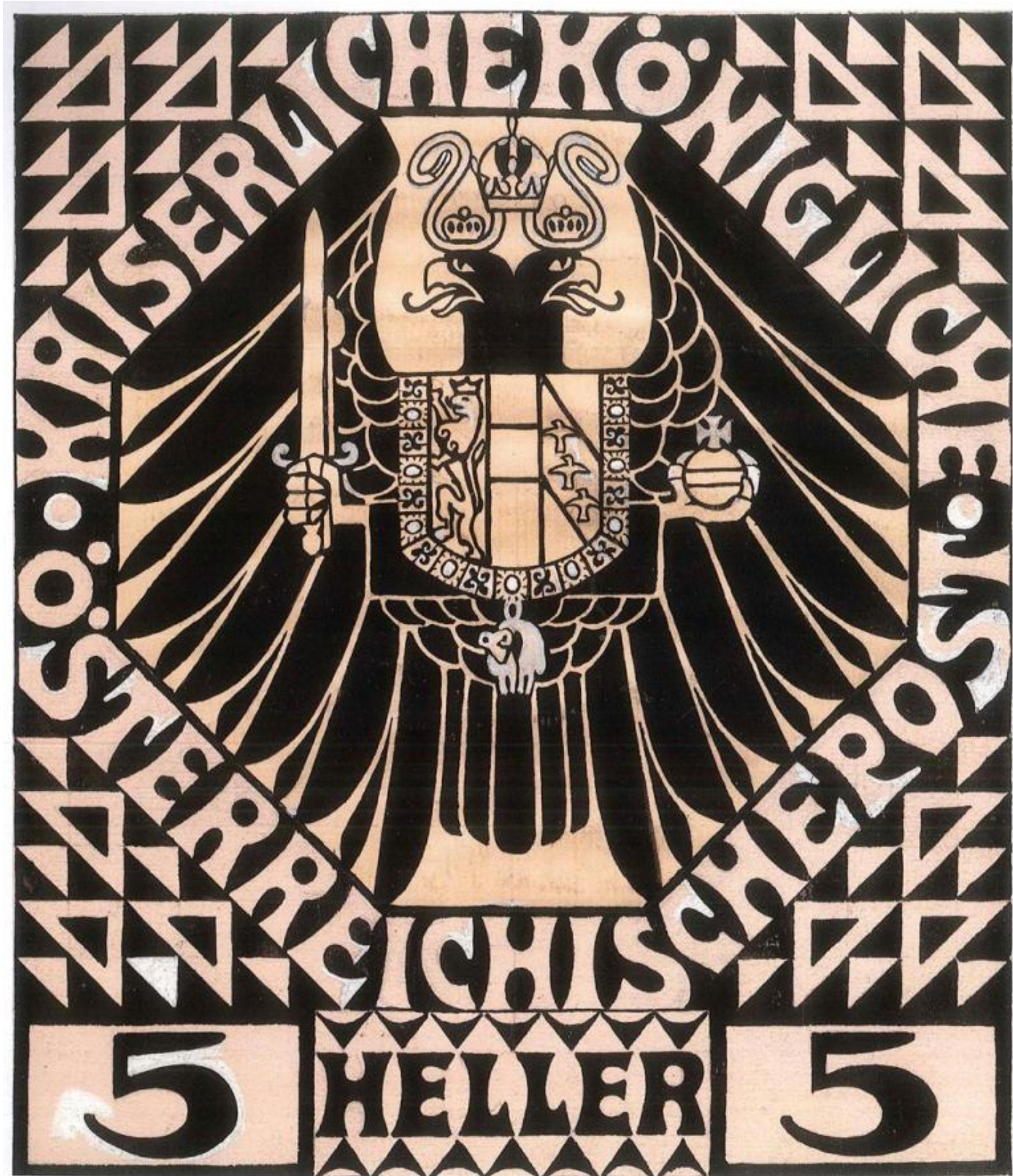
Koloman Moser, Disegno preparatorio per il francobollo commemorativo del 60° giubileo del regno di Francesco Giuseppe I, 1908, (Austrian Post AG, Vienna).

L'epoca della finis austriae è stata un'epoca di profonde contraddizioni, e Robert Musil è stato il suo cantore più importante nonché unica figura intellettuale che sia riuscita, per tramite della sua opera maggiore, a sviscerarle tutte con impressionante precisione. Elias Canetti ricordava che il compito di cui Musil si fece