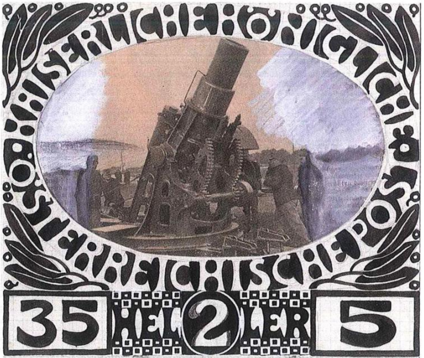
Koloman Moser, Disegno preparatorio per un francobollo di guerra, 1915 (Austrian Post AG, Vienna).

Il racconto stesso tende verso il nulla: unico tratto distintivo di una trama evanescente è infatti l'Azione Parallela, cioè a dire il comitato incaricato, nei mesi immediatamente precedenti lo scoppio della guerra, di organizzare le celebrazioni per il settantesimo anniversario del regno di Francesco Giuseppe I che, con ogni evidenza, non potranno mai avere luogo. Questo secondo paradosso determina lo stabilirsi di quel momento dilatato per le circa milleottocento pagine del volume, che è funzionale a far emergere le laceranti antinomie del momento storico; L'uomo senza qualità richiama in effetti l'immagine di un orologio a pendolo il cui funzionamento è regolato su un moto oscillatorio che, in luogo di scandire lo scorrere del tempo, ne determina e stabilisce le qualità dialettiche: questo moto, infinito e precisissimo, declina una disposizione dinamica e al tempo stesso bloccata della narrazione, nella quale ad ogni movimento per un verso corrisponde esattamente il suo contrario.